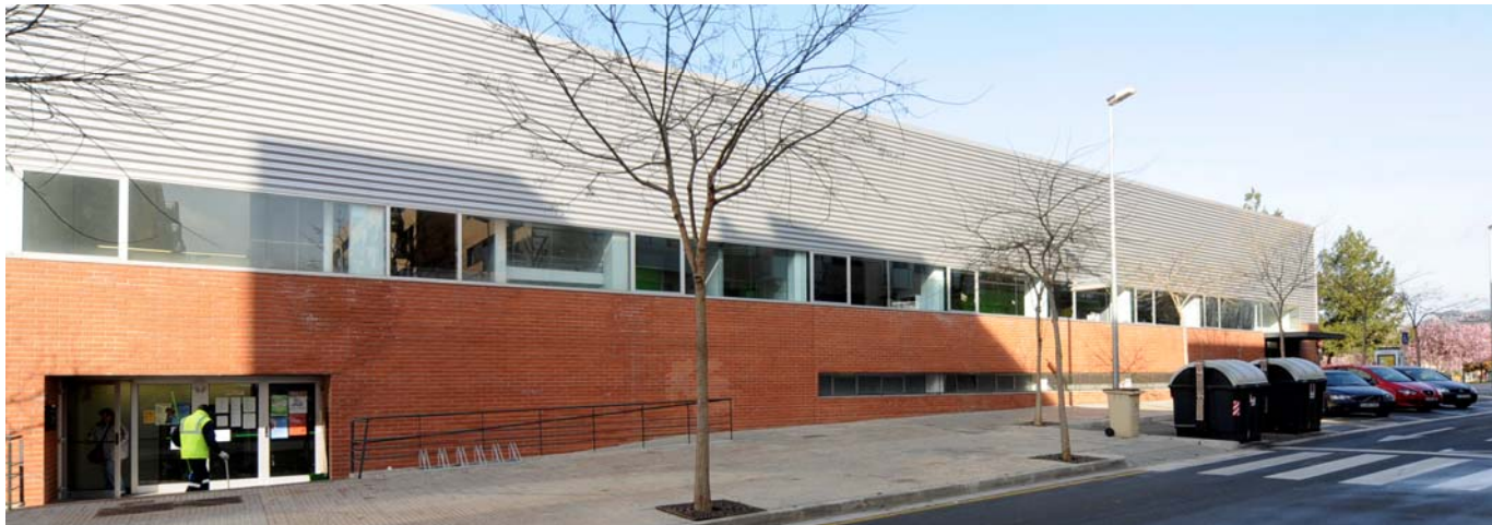
Espai Tolrà: nou punt d'atenció a la ciutadania