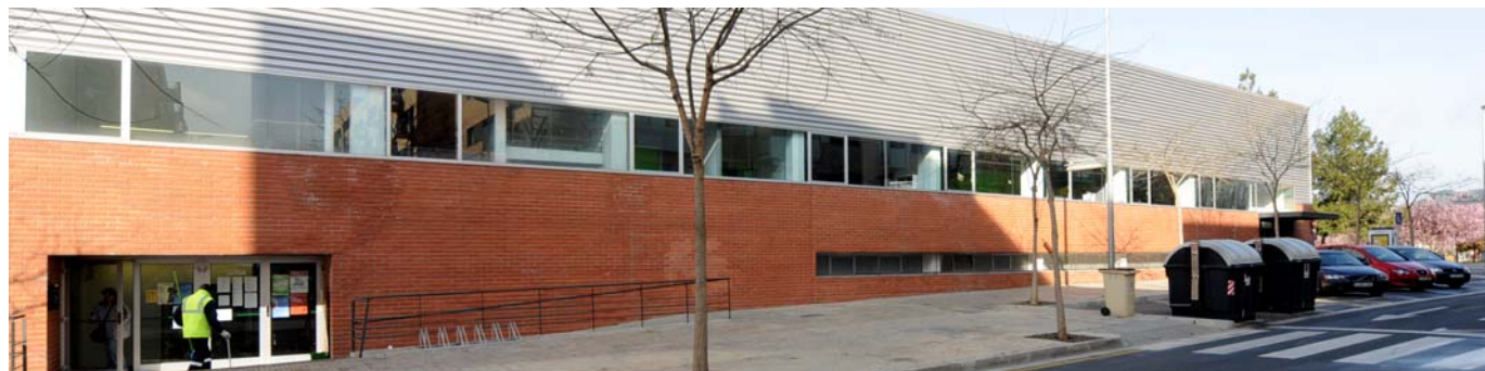
Espai Tolrà: nou punt d'atenció a la ciutadania