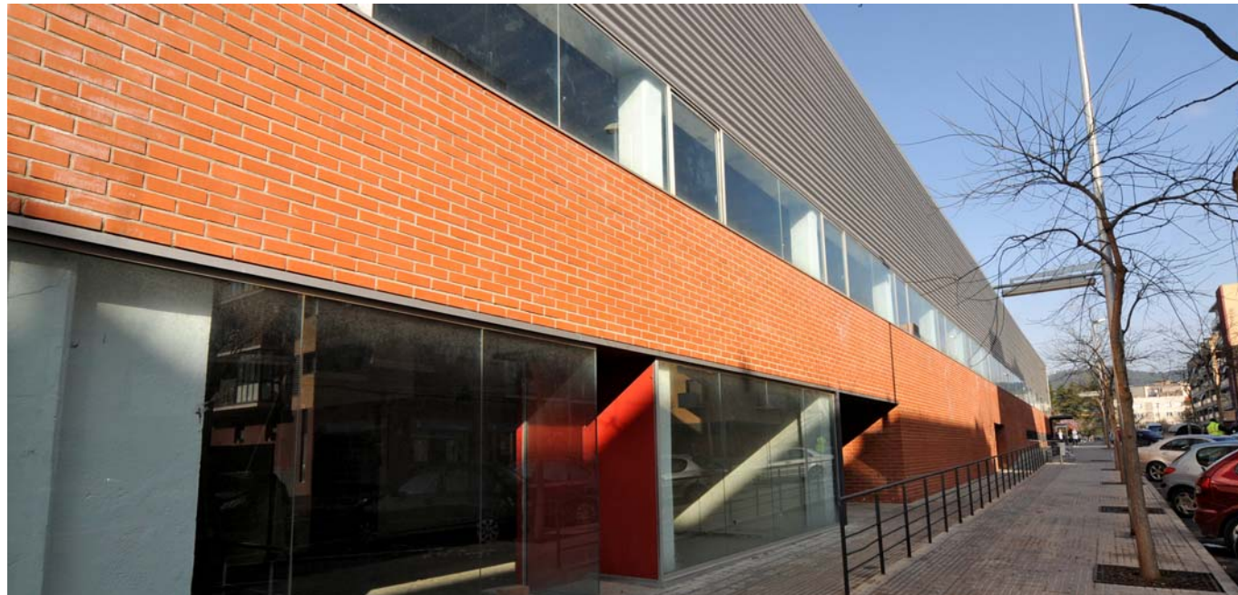
Espai Tolrà: nou punt d'atenció a la ciutadania