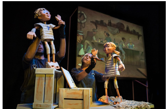
ON VAS, MOBY DICK?