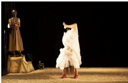
LES SABATES VERMELLES