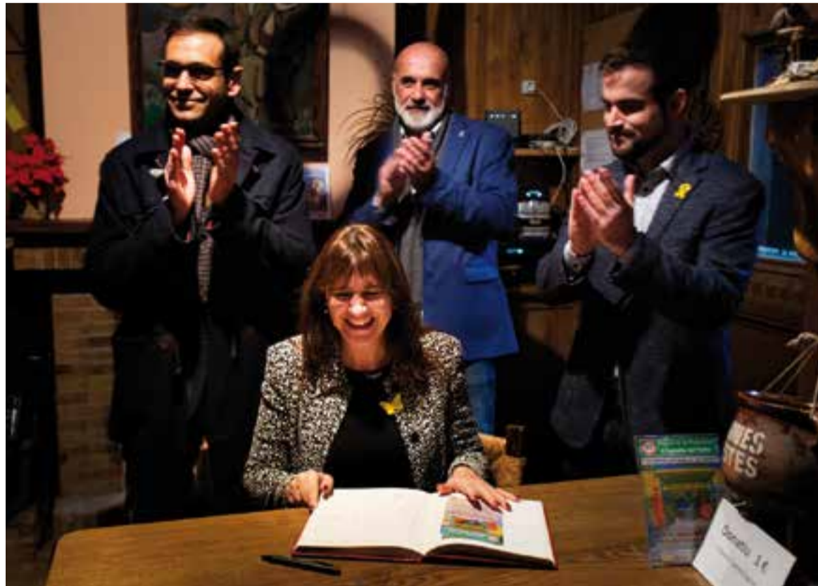
La consellera Laura Borràs, l'alcalde, el president del Grup Pessebrista i l'alcaldale de Junts per Castellar.

Durant l'acte institucional a la casa consistorial, la consellera va signar el Llibre d'Honor de la vila al despatx de la Capella de Sant Josep. Borràs va destacar en el seu escrit la importància de l'associacionisme com a una part fonamental del patrimoni cultural dels municipis. “Estem convençuts que l'associacionisme és un dels elements de cohesió social més important, i com que la cultura també és un element de transformació essencial, el paper que juguen totes les