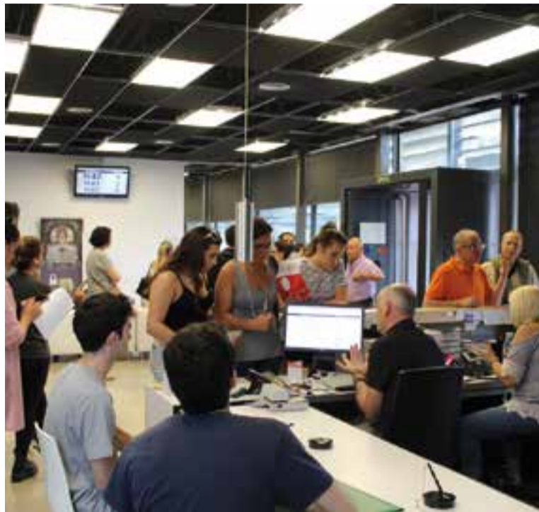
Els primers dies es van produir cues de sol·licitants d'aquest ajut.

Pel que fa als tipus d'estudis que cursen els alumnes que han rebut la subvenció, la majoria, un 61%, estudia algun grau universitari, un 37% cicles formatius de grau mitjà o superior, mentre que el 2% restant correspon a batxillerats artístics i a programes de formació i inserció. En relació a les 186 sol·licituds desestimades, aproximadament la meitat (90) no s'han concedit perquè ha vençut el termini per aportar la documentació