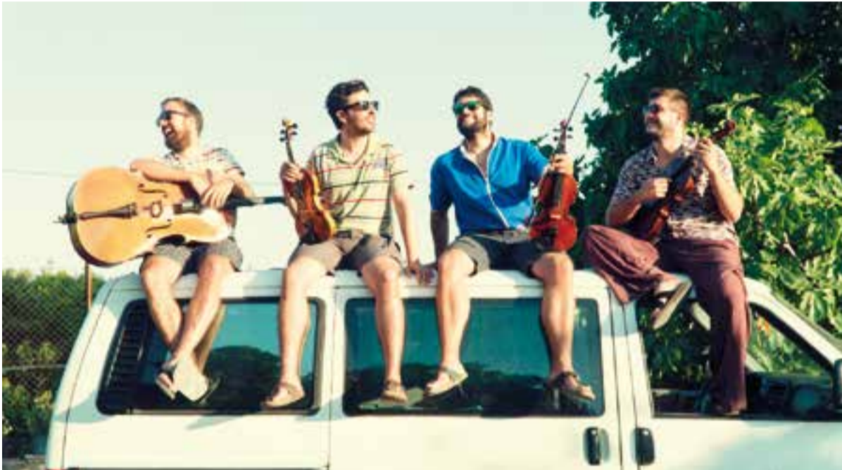
El quartet Aupa Quartet presentarà 'Step up' aquest dissabte, 2 de febrer, a l'Auditori Municipal Miquel Pont.

La formació de corda tarragonina actua dissabte a la vila de Castellar