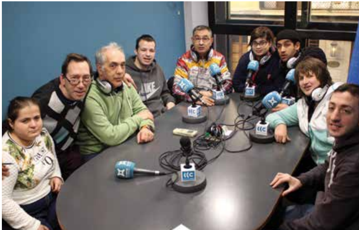
Els participants del programa Ona TEB a Ràdio Castellar van dedicar una de les tertúlies a parlar de sexe i afectivitat.