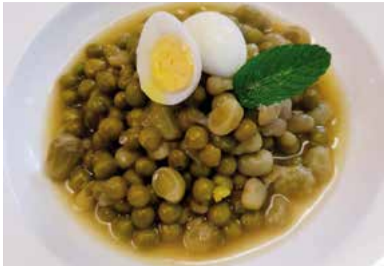
El plat elaborat pel restaurant durant aquests dies.