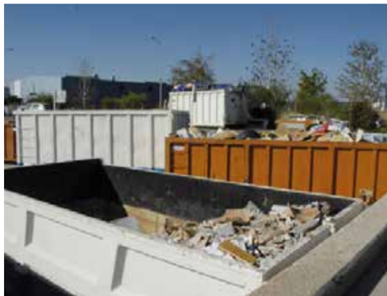
S'han fet 1.244 bonificacions del rebut d'escombraries per l'ús de la deixalleria.

L'altre 37% correspon a les bonificacions per a vehicles històrics o amb antiguitats superiors a 25 i 40 anys o els agrícoles, entre d'altres. ➔