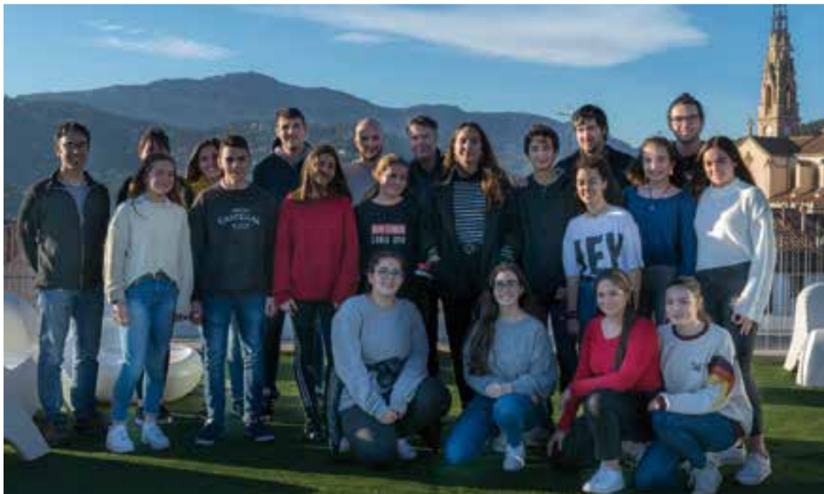
L'alumnat que participa en la segona edició del Taller de Periodisme, divendres passat durant la inauguració.