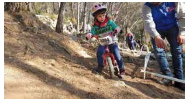
Una de les participants a l'Open de bicitrial.

Tretze van ser el total de categories que van participar en la tercera edició de l'Open de Trial 'ELBIXU', que enguany donava el tret de sortida des de l'Era d'en Petasques. Un total de 68 participants van prendre la sortida d'un torneig que novament tindrà tres proves, totes aquestes a Castellar.