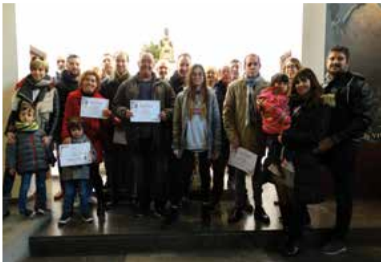
Guanyadors dels pessebres 2018 amb els membres del jurat.