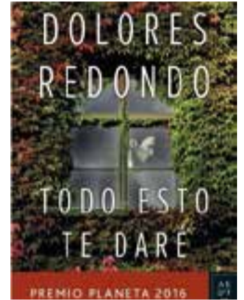
El llibre més prestat el 2018.

El rànquing dels més prestats és, començant per còmics infantils, Naruto i Bola de drac . Per a adults, els més buscats han estat els còmics Chobits i El Velo del cuervo. Tomo 1 . Les revistes Cocina vegetariana , Cuèrpomente i Lecturas també han estat les més prestades.