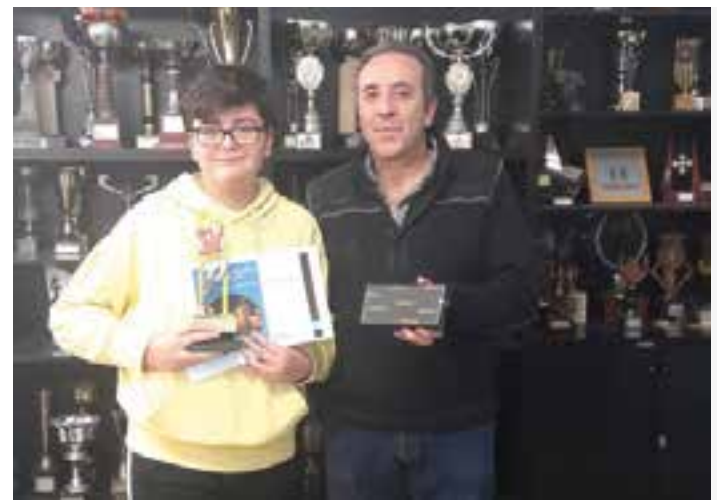
El guanyador de la 2a edició del torneig Gregorio Sánchez.

El torneig, dirigit als infants, en aquesta edició va gaudir del patrocini a càrrec de les empreses Rarsa i Agrosans, que van donar el suport a una de les proves que a poc a poc es consolida al calendari escaquista de la vila. + || REDACCIÓ