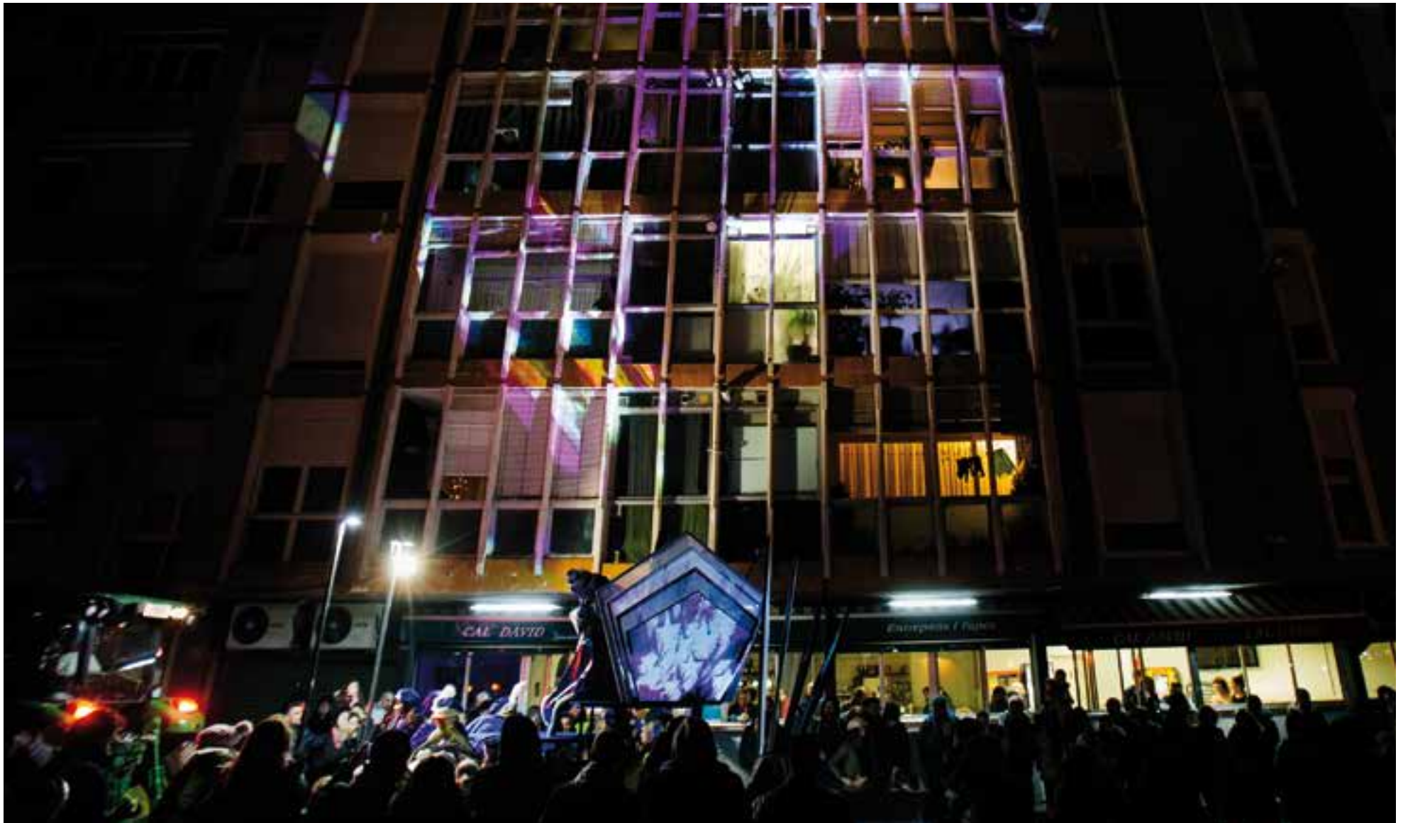
La carrossa del rei Melchior en el moment que passava pel carrer de Sant Pere d'Ullastre amb la projecció d'imatges de mapatge a la façana dels edificis.

El pas dels Reis Mags d'Orient pels carrers de Castellar, enguany a través d'un nou recorregut, va portar il·lusió a petits i grans