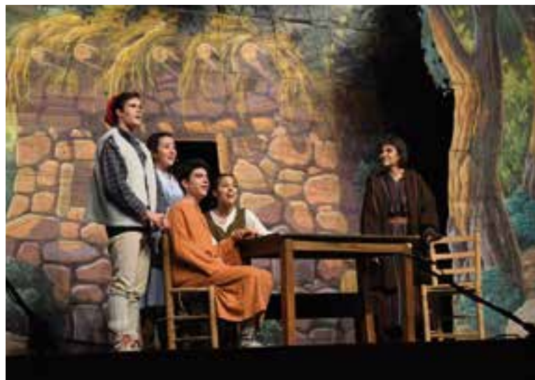
'Xiribec i Xiripiga. Els Pastors Cantaires de Betlem'. || R. PARERA

Entre el públic, hi havia persones grans que recordaven l'obra de quan ells eren joves, “amb els canvis que hem anat incorporant, n'estem contentíssims, sobretot perquè nosaltres no ens dediquem professionalment al teatre” , afegeix Martí. Els actors i directora fan l'obra de forma voluntària. “El cert és que el cant sempre m'ha interessat, i m'hi dedico, però el teatre musical és un hobby” . En aquest sentit, 'Xiribec i Xiripiga. Els Pastors Cantaires de Betlem' arriben al públic des de l'emoció. “És una obra feta amb el cor, més enllà de la part tècnica, arribem al públic des d'una altra banda” , segons Martí. Els actors a l'escena-