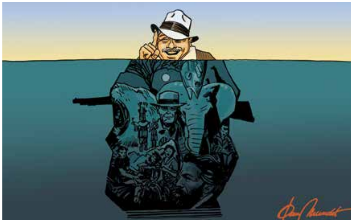
Motxilles flotants.

És tan important el que diem com el que callem. Aquesta és la base de la teoria de l'iceberg de Hemingway, que diu que el lector només ha de veure una part petitíssima del que passa a la història. La resta ha de quedar soterrada. Aquestes omissions, apilades les unes a sobre de les altres, formen una base que, si és prou sòlida, flota, i permet que