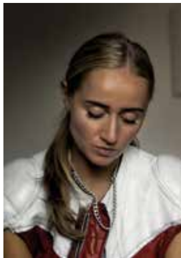
'Silvana', el DocsBarcelona del Mes. || C.

Un viatge des dels primers anys de la seva carrera com a artista underground fins a convertir-se en una