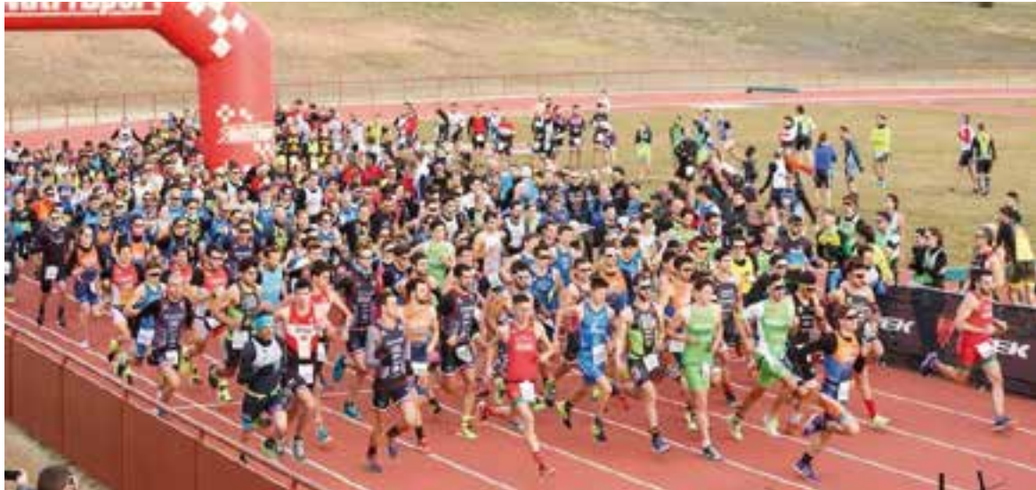
Sortida de la segona edició del duatló de carretera de Castellar a les pistes d'atletisme de Colobrers.