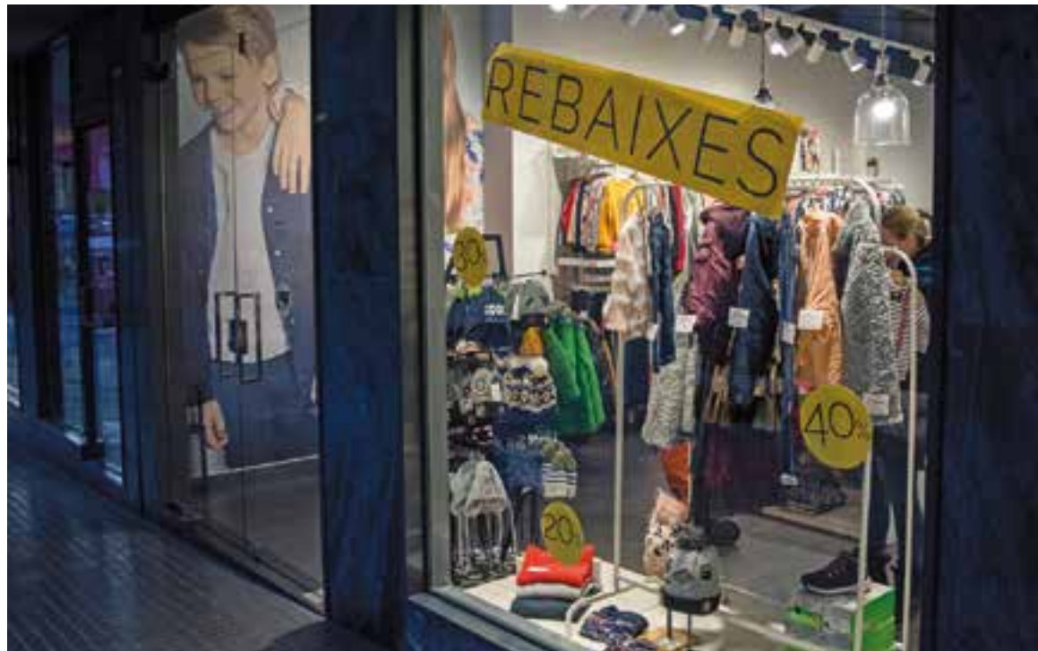
L'aparador de l'establiment Herois anunciant rebaxes d'entre el 20 i el 40%, en una imatge d'aquesta setmana.

A Catalunya, les associacions de botiguers han tornat a reclamar que es respecti el 7 de gener com a dia per posar en marxa les promocions. Segons defensen, el fet d'acordar una data té més impacte en el consumidor que, en el cas contrari, té la sensació que sempre pot comprar a preus rebaxats. Per al comerç de proximitat és més complicat mantenir els seus marges i entrar en la guerra de preus de les multinacionals. És per això que ara pressiona