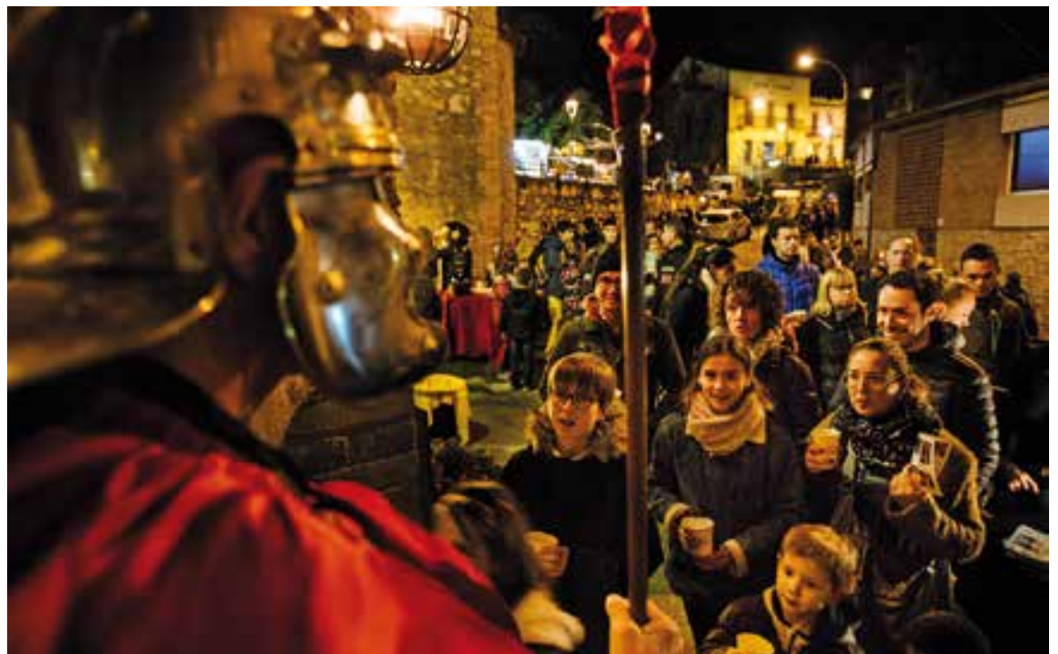
Entrada al recinte del Pessebre Vivent 2018.

Una altra de les novetats a la plaça va ser la figura de la leprosa, una idea que havia proposat mossèn