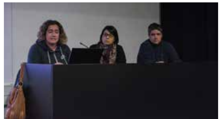
Reunió a la Sala d'Actes d'El Mirador, dimecres passat.

La Marató per la Diversitat comença a caminar. La Sala d'Actes d'El Mirador va acollir dimecres passat una trobada oberta per donar a conèixer aquesta iniciativa, que tindrà lloc el darrer cap de setmana de març. El projecte, que s'ha impulsat des del Consell Escolar i la Federació d'AMPAS de Castellar, té per objectiu recaptar fons per cobrir i implementar el servei escolar de personal vetllador o de logopèdia, entre d'altres. Tot plegat, perquè el Decret d'Educació Inclusiva no s'ha fet efectiu i ha deixat al descobert algun d'aquests serveis en els centres escolars. D'altra banda, la Marató per la Diversitat té el doble vessant de sensibilitzar la ciutadania vers la importància d'aconseguir una escola inclusiva, adaptada per a tots els alumnes. A hores d'ara, encara s'estan perfilant quines activitats es duran a terme a la marató castellarenca. Des de la comissió organitzadora demanen la col·laboració i participació de totes les entitats de la vila, i de tota la ciutadania per sumar esforços. † || R.G.