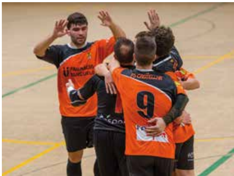
L'FS Castellar en la celebració d'un gol.