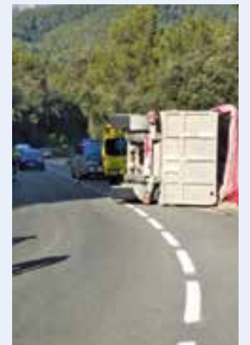
Camió bolcat a la C-1415.