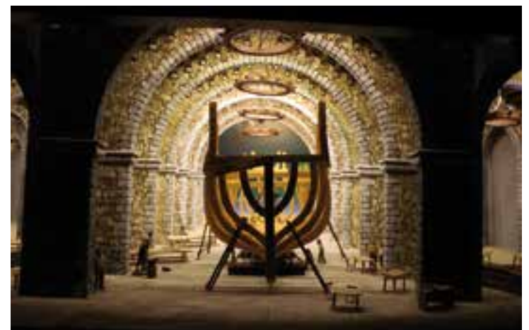
Un dels pessebres de la 68a exposició del Grup Pessebrista de Castellar. || M. A.

Enguany, el tema que centra els pessebres són els mitjans de transport. A la planta baixa i al pati hi ha 15 pessebres sobre aquesta temàtica, que se suma a la bíblica. Al primer pis, s'hi ha construït una maqueta de tren de 12 m 2 , en moviment, conjuntament amb Associació d'Amics del Ferrocarril - VALLESFER, que s'exposa juntament amb diverses maquetes de transports diferents, entre aquests, el cremallera de Montserrat. + || M. A.