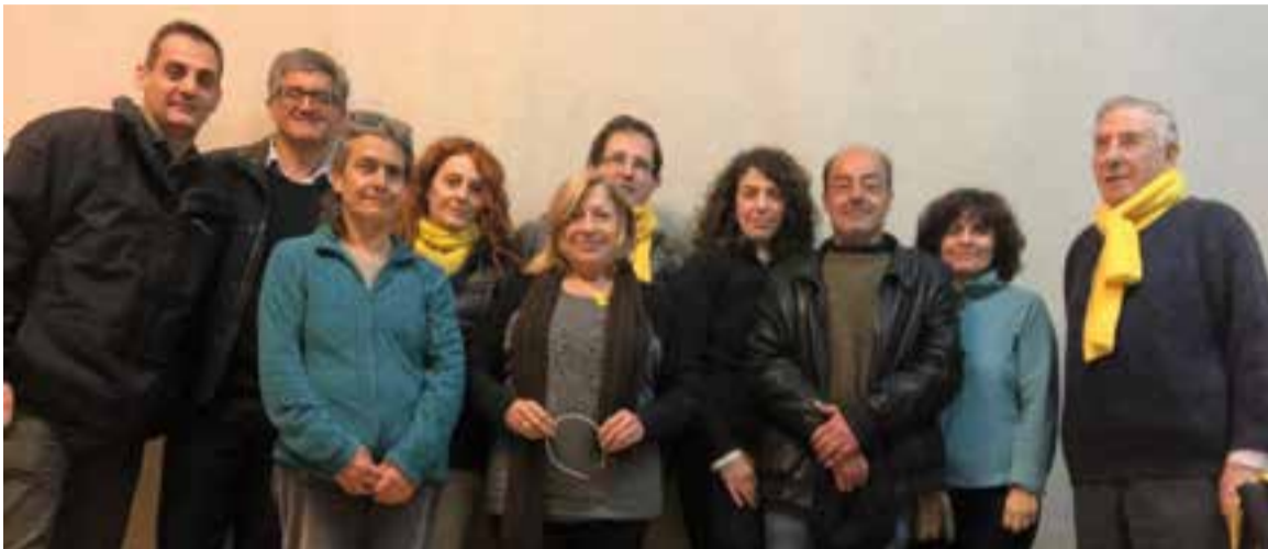
Grup de castellarencs que han impulsat el dejuni col·lectiu, en una imatge presa la setmana passada.

Promogut per l'ANC i el CDR, tindrà lloc el 22 i 23 de desembre a Cal Gorina