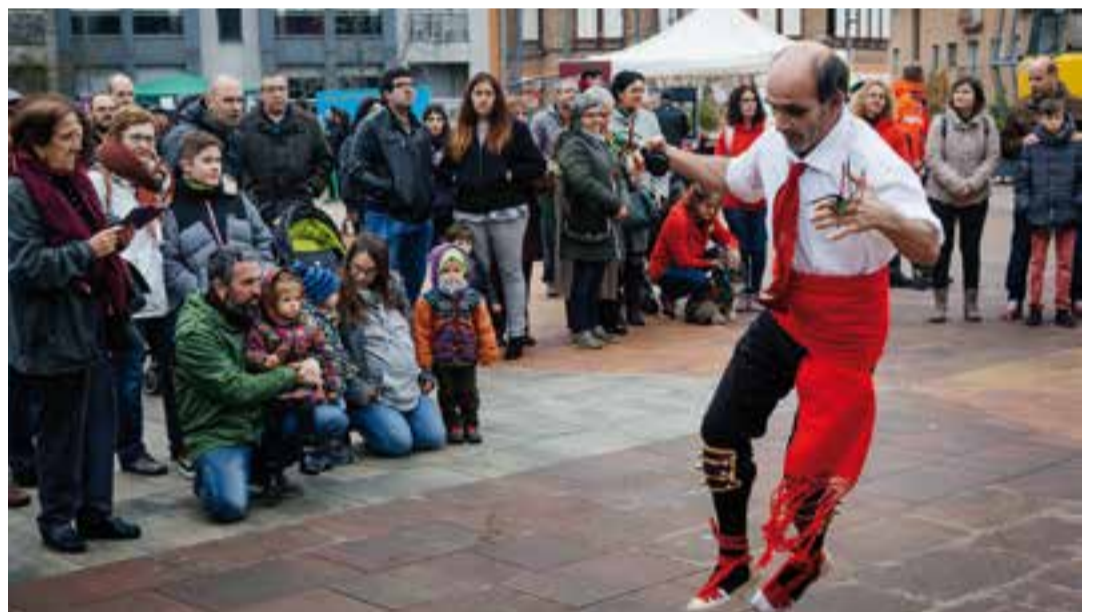
Dos moments de la matinal dedicada a La Marató de TV3, diumenge passat. || Q.PASCUAL