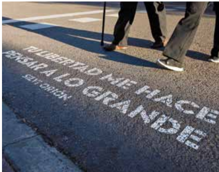
Aquesta iniciativa, a Madrid, s'anomena 'Versos al paso'.

Aturar-nos, llegir, reflexionar, mirar i crear. Aquestes accions les podem fer, d'aquí a uns mesos, just abans de travessar per 25 passos de vianants de Castellar. I serà possible gràcies a la iniciativa "Castellar, vila de versos", que dona continuïtat al projecte "Castellar, vila de llibres". Es tracta d'una nova proposta per promoure l'interès per la literatura entre la ciutadania i per recordar el valor de l'escriptura i la lectura. En aquest sentit, la finalitat és incentivar, d'una banda, la creativitat literària i el foment de la lectura a l'espai públic i, d'altra banda, la participació de la ciutadania en la construcció del paisatge urbà. "Volem donar-li continuïtat a l'efecte literari de la iniciativa "Vila de llibres". En 25 passos de