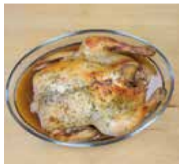
POLLASTRE DE NADAL

Per fer el farciment dels galets: trinxem la col, la pastanaga i el porro. Hia fegim la carn picada, un ou, el julivert tallat, all en pols i sal. Barregem la mescla. Agafem els galets crus i els farcim. Quan el brou estigui bullint, afegim els galets farcits i els deixem bullir durant l'estona que ens indiqui el paquet. Un cop cuits, els servim en plat fondo i hi afegim el brou.