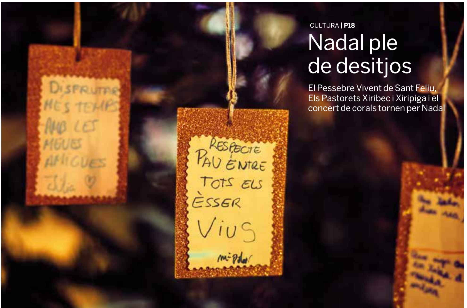
Arbre de Nadal de Sant Feliu amb desitjos de veïns i veïnes, una tradició que ha entrat amb força a la celebració del Nadal els darrers anys.

El Pessebre Vivent de Sant Feliu, Els Pastorets Xiribec i Xiripiga i el concert de corals tornen per Nadal