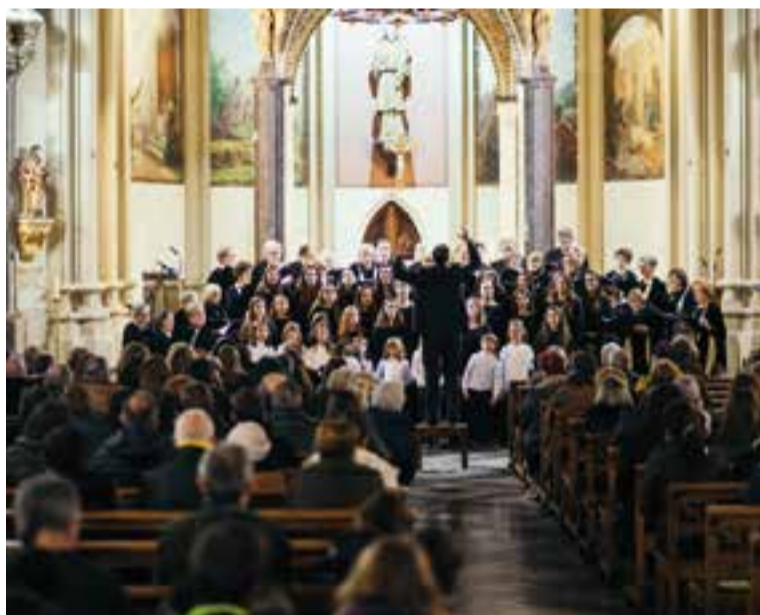
Moment del Concert de Nadal amb el Cor Sant Esteve i la Coral Xiribec.