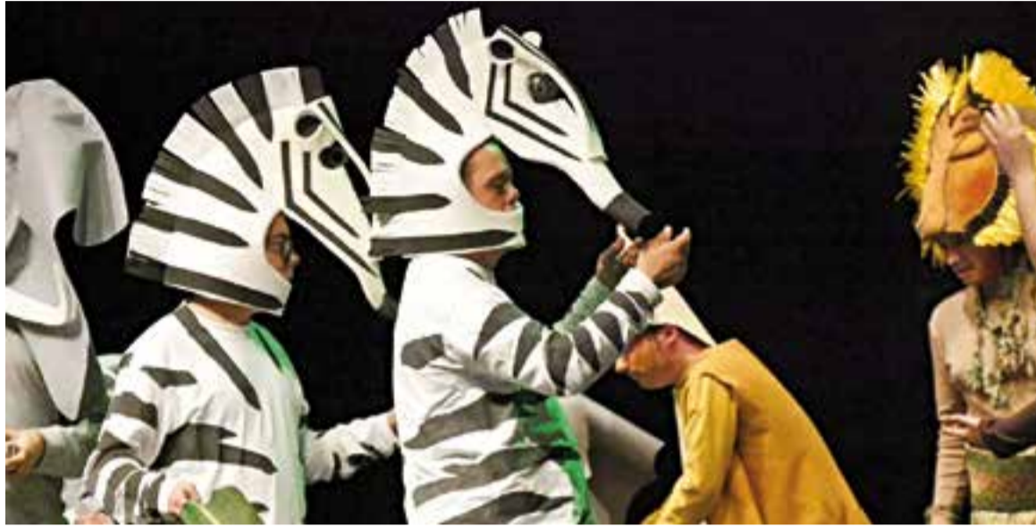
L'obra de TEB Castellar va omplir l'Auditori, dissabte passat a la tarda.

Els actors del Centre Ocupacional TEB Castellar, a través d'una activitat emmarcada en el dia Internacional de les Persones amb Diversitat Funcional, van fer que traguéssim les teranyines d' El Rei Lleó per tornar a gaudir de la seva essència, calcant-ne fidelment els trets principals. Va ser el 10è any que l'entitat va dur a terme una representació pels volts de Nadal, i