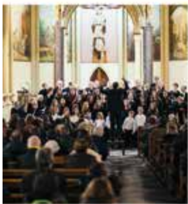
Cor Sant Esteve i Coral Xiribec