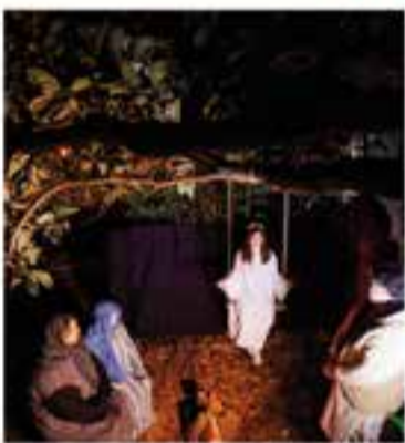
Pessebre Vivent de Sant Feliu del Racó

L'actuació comptarà amb la participació de la Coral Xiribec i del Kor Ítsia, el Cor Grans, el Cor Mitjans i el Cor Menuts del Cor Sant Esteve. El repertori dels temes que interpretaran inclourà un recull de nades i cançons d'arreu del món.