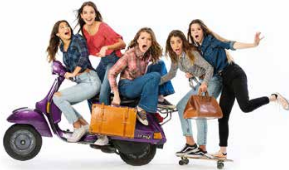
Imatge promocional de Macedònia, que treu el disc 'Escandaliciós'.

Un tema es diu "Equilibri" i explica diversos equilibris, des del necessari per pujar dalt d'una barca i no caure,