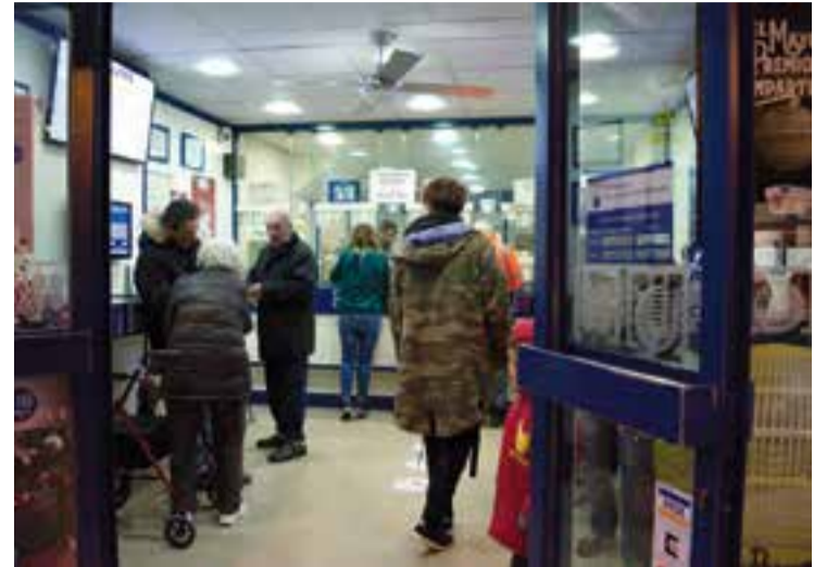
Els castellarencs esgoten fins l'últim moment per comprar loteria. || F. MUÑOZ