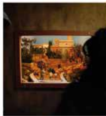
Associació Pessebrista de Sant Feliu del Racó

Vine a gaudir del Pessebre Vivent de Sant Feliu! A més, podràs participar a l'arbre dels desitjos, degustar caldote de Nadal, portar la carta a l'Ambaixador, guanyar una panera i gaudir, dissabte 29, de l'actuació del Cor Grans i Cor Mitjans del Cor Sant Esteve.