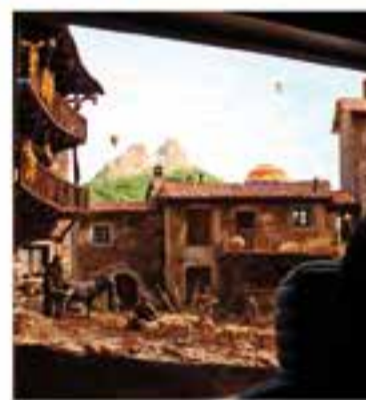
Grup Pessebrista de Castellar

Des de fa més de 30 anys Sant Feliu del Racó manté viva la tradició dels pessebres amb aquesta exposició de diversos diorames que es podran visitar durant les festes nadalènques.