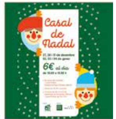
Colònies i Esplai Xiribec

Enguany els mitjans de transport són el tema que uneix tots els diorames de la planta baixa i també l'exposició del primer pis.