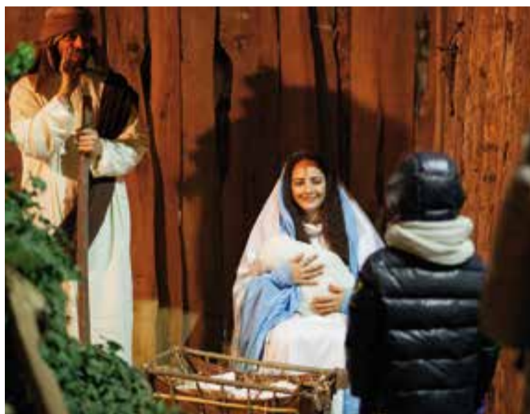
Escena del naixement de l'any 2017.

L'escena de les rentadores té atrezzo nou, “l'hem potenciat bastant” . També s'ha potenciat l'escena de l'Anunciació, abans del naixement, que ara serà a baix, als horts, on l'any passat hi havia els tres reis d'Orient. “Enguany, els reis encara no sabem on els posarem, potser a l'escoles, perquè la canalla els vegi de lluny” , diu la presidenta.