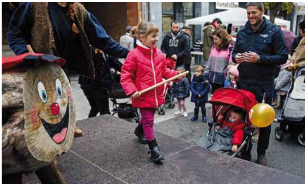
El Tió Gegant va ser l'activitat amb més èxit entre els infants de la Fira de Nadal.