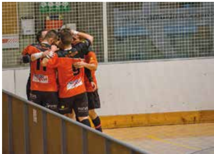
L'FS Castellar suma quatre jornades puntuant en lliga. || A.SAN ANDRÉS

Manel López va obrir el marcador pels visitants, que veien com els blanc-i-vermells els remuntaven amb tres gols abans del descans. Quim Juncosa aconseguia retallar diferències al límit del descans (3-2), afavorint el desenllaç positiu pels taronges. A la segona però, un gol als vuit minuts de joc posava les coses en pujada pels visitants, que tot i això van obtenir premi amb un doblat d'Àngel Olivares (36' i 37'), que els permet robar un punt i seguir escalant al grup 2 de Divisió d'Honor, en el qual ja ocupen la novena posició, i arribar pel davant del pròxim rival en lliga, el CFS Eixample. † || A. SAN ANDRÉS