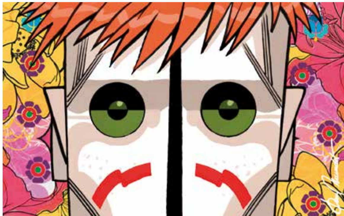
© Off on. || JOAN MUNDET

els trastorns mentals. A vegades expliquem amb tot luxe de detalls els símptomes que hem patit en una grip o en una lesió de turmell, i fins i tot els símptomes d'un càncer; però no fem el mateix amb la depressió. Doncs ja podríem començar-nos a espavilar. Ens convé la visibilitat com a mínim per tres raons. La primera: perquè els trastorns mentals no només afecten la pròpia salut sinó que també impacten en la de les per-