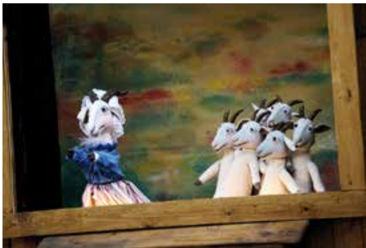
Les set cabretes, a l'espectacle 'El llop ferotge' de la Cia. del Príncep Totilau.