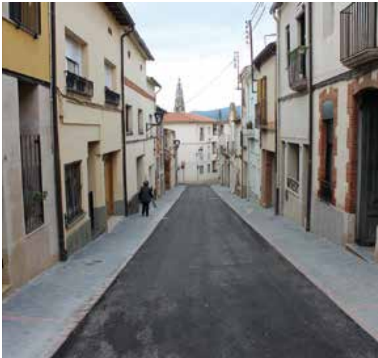
El carrer Nou després de la remodelació.