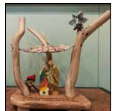
Pessebre de Josep Llinares.

A les 10.15 h es preveu l'esmorzar que es fa al peu de la Castellassa. L'esmorzar el porta cadascú, mentre els escaladors es preparen per a l'escalada. A les 10.45 h s'iniciarà el trasllat del Pessebre de mà en mà dels més petits, que se situaran al peu de la Castellassa. Paral·lelament, es farà la cantada de nadesles, i es farà la pujada del pessebre al cim. A les 11 h es farà un tastet de neules i torrons i, cap a les 11.45 h es preveu la instal·lació del pessebre al cim de la roca i la tornada cap a casa. ➔ || M. A.