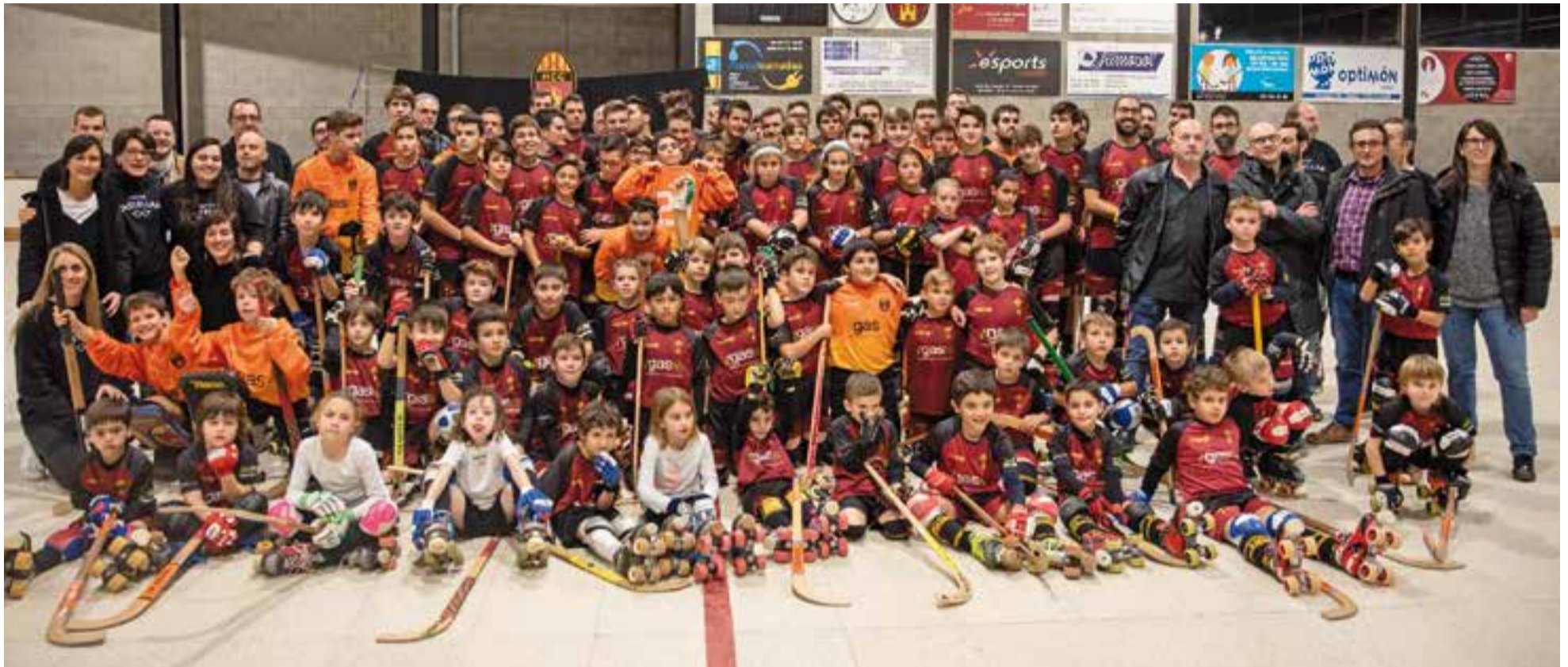
Els integrants del club en la foto de família durant la presentació dels equips de la temporada 2018-19, al pavelló Dani Pedrosa.

L'HC Castellar va presentar els 13 equips del club i va acabar la festa amb un sopar de germanor al Dani Pedrosa