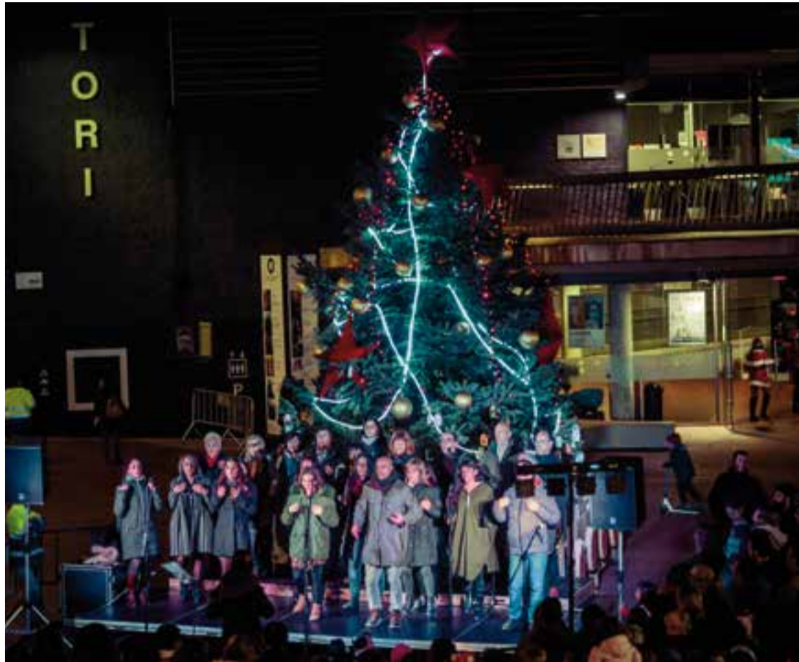
El cor de gòspel Di-versions va escalfar l'ambient durant l'encesa de l'arbre de Nadal.

Enguany, a les habituals cortines de llum LED s'hi han sumat prop d'una cinquantena d'elements decoratius lumínics que l'Ajuntament ha llogat per a la campanya de Nadal de 2018-2019. Cal destacar que la instal·lació de l'arbre és una iniciativa de Comerç Castellar, l'associació de paradistes del Mercat i de l'Ajuntament.