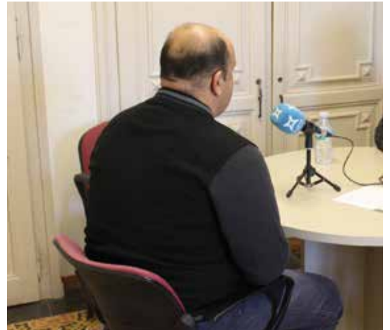
Mohammed durant un moment de l'entrevista que va concedir dimecres passat a L'Actual demanant que es preservi el seu anonim.

El missatge que vol compartir amb aquelles persones que no entenen per què els refugiats volen viure en altres països és molt clar: “Només volem viure en pau, una vida senzilla, sense guerra. Si no vius en pau a la teva comunitat, fas qualsevol cosa per marxar, perquè no morin els teus fills. Espero que