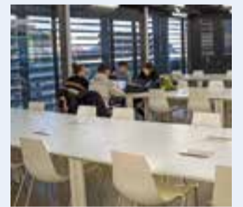
Opensurf, dilluns passat.

L'horari d'obertura és de 16.30 a 23 hores, de dilluns a dijous, tot i que el servei estarà tancat per Nadal, des del divendres 21 de desembre i fins al divendres 4 de gener, ambdós inclosos. Cal tenir en compte que a partir de les 20.30 hores l'accés s'haurà de fer per la porta del pàrquing situada a la plaça d'El Mirador, i no per la porta principal de l'edifici. A partir d'aquesta mateixa hora, a més, tampoc hi haurà servei de préstec d'ordinadors. + || REDACCIÓ