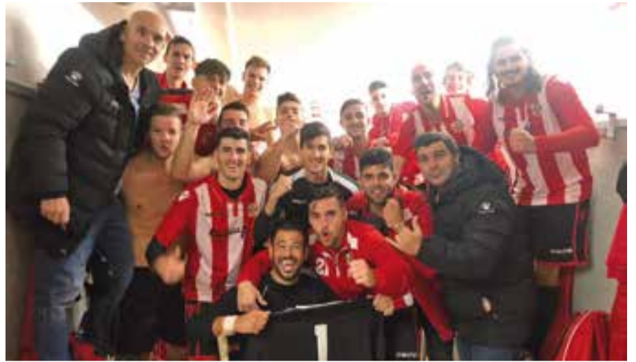
La UE Castellar celebra la victòria a Terrassa.