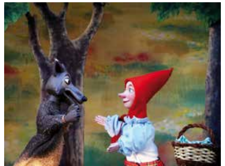
'El llop ferotge' de la Companyia del Príncep Totilau. || CEDIDA

Hervàs explica que es tracta d'un espectacle molt divertit fet amb titelles, màscares i interpretació d'actors i que el fet de tenir com a elements argumentals contes molt coneguts "fa que la gent ja sàpiga que ve a veure i no tingui tanta por de dur al teatre els seus fills i filles". ✦ || M. ANTÚNEZ