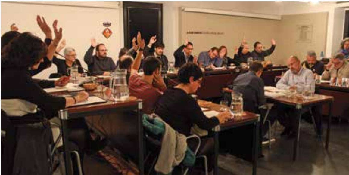
Una de les votacions del ple municipal de novembre, celebrat dimarts passat.