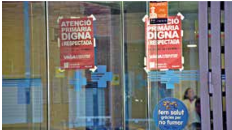
Cartells a la porta del CAP Castellar el primer dia de vaga.

A l'entrada del CAP de Castellar, s'hi podia llegir "atenció primària digna i respectada" en diferents