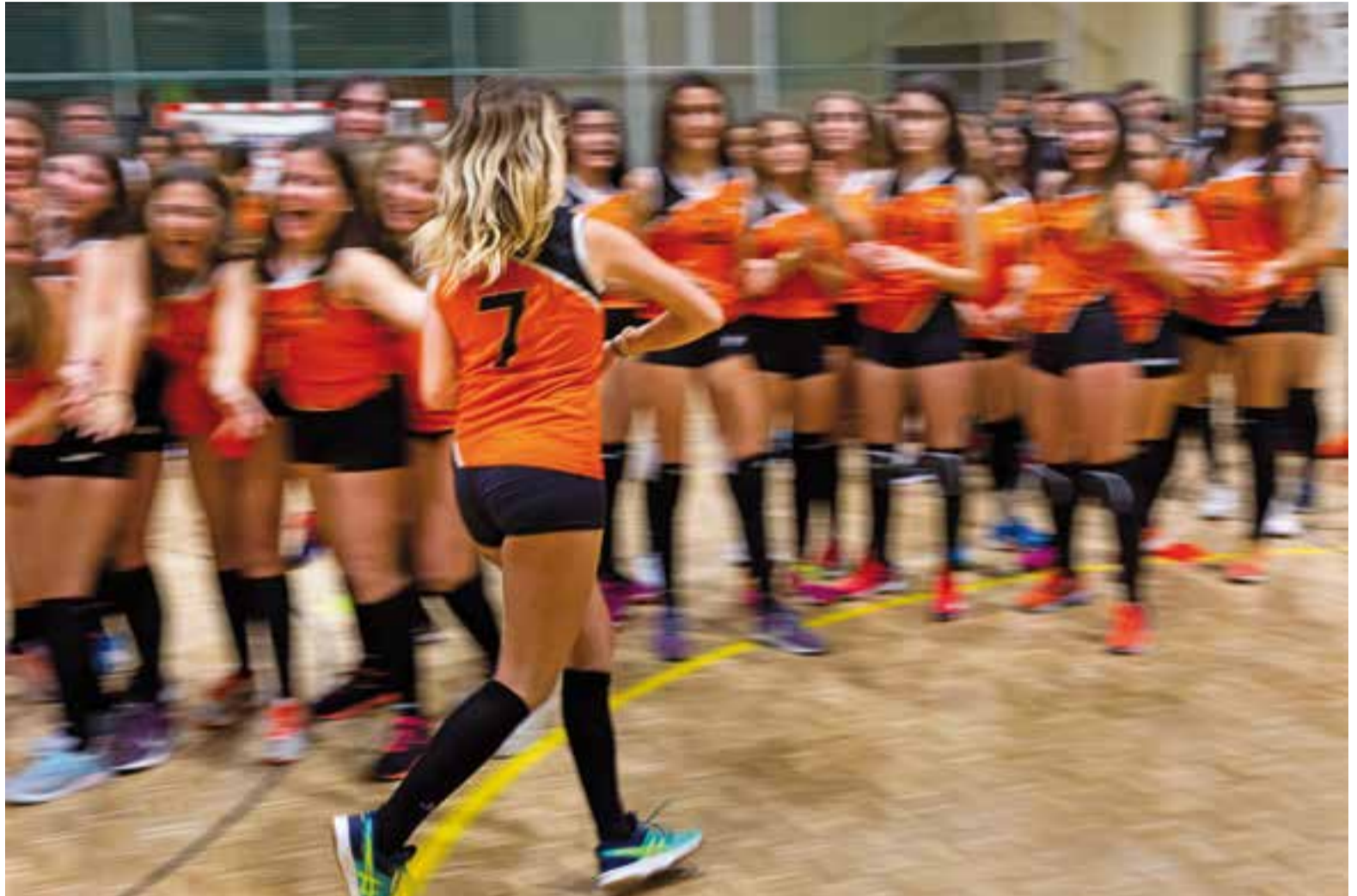
El vòlei ha anat guanyant protagonisme al Futbol Sala Castellar. En la imatge, una jugadora fa el passadís saludant les seves companyes.

celebrar l'aniversari d'una de les jugadores de l'equip màster o per tornar a veure sobre la pista a un mite com Josep Tous, ara enrolat a l'equip tècnic del sènior B.