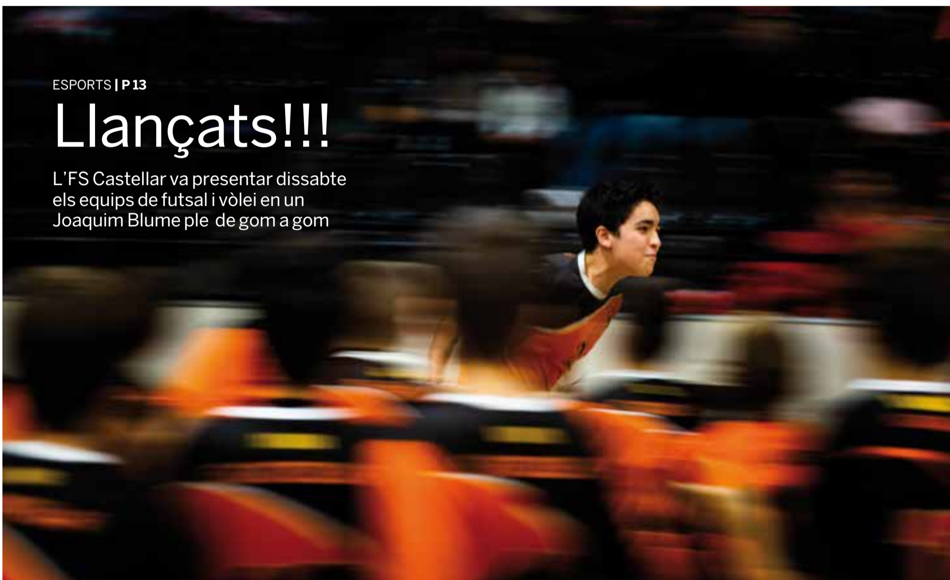
Un dels components del Futbol Sala Castellar corre per la pista del Joaquim Blume durant la presentació de tots els equips de les diferents categories que competeixen aquesta temporada.

L'FS Castellar va presentar dissabte els equips de futbol i vòlei en un Joaquim Blume ple de gom a gom