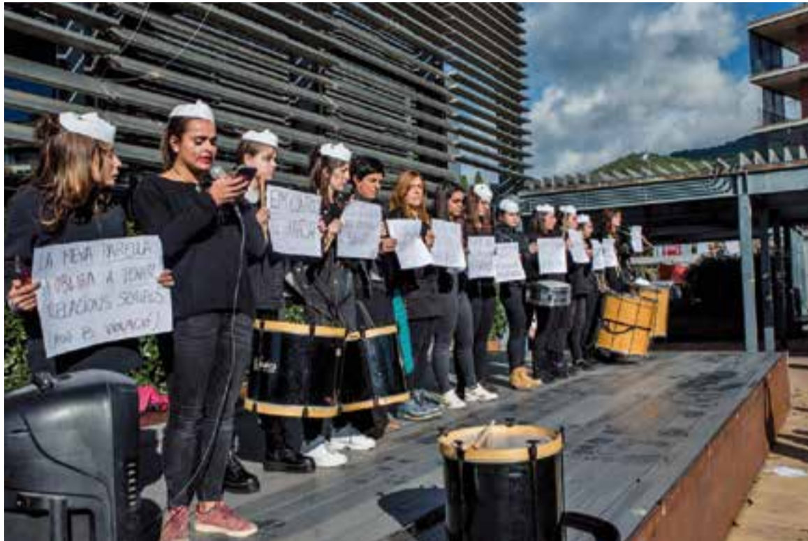
Una desena de dones de la Coordinadora Feminista, dissabte passat, durant la seva mobilització a la plaça del Mercat.