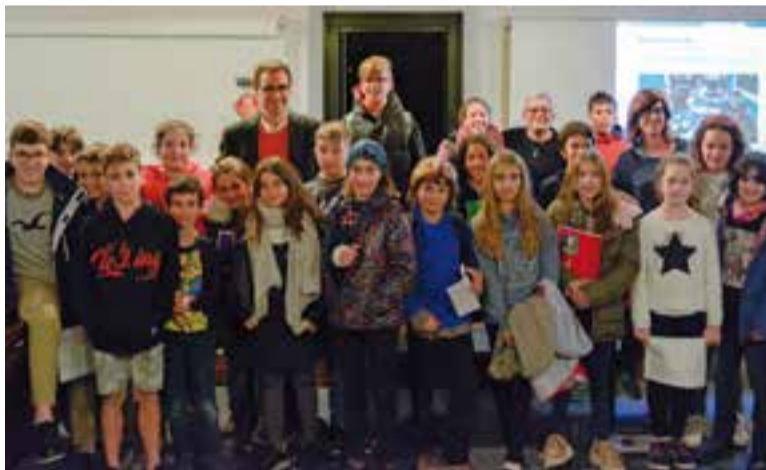
Foto de grup de la constitució del Consell d'Infants del curs 18-19. || F- MUÑOZ

Des de la seva creació ara fa nou cursos, 146 nens i nenes han estat representants del Consell d'Infants. + || REDACCIÓ