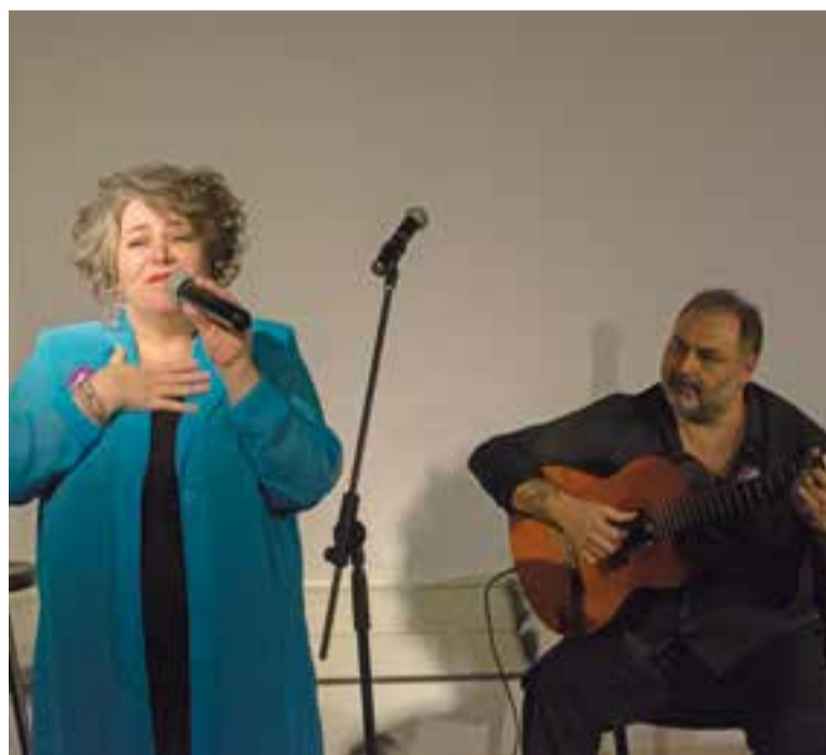
Actuació musical promoguda per Dona Cançó després de la lectura del manifest. || F.M.

ACCIÓ DE LA COORDINADORA FEMINISTA "Quan surto amb amigues m'oblida a enviar-li fotos constantment". "Només 1 de les 6 dones assassinades aquest any a Catalunya havia denunciat". "Entre 11 i 20 anys és