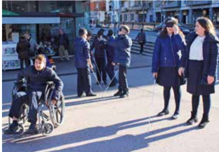
Alumnes de 6è de FEDAC-Castellar realitzant l'activitat d'Amputats Sant Jordi || C. D.

La programació es reprendrà dimarts que ve, amb una aproximació a l'art del macramé al Punt d'Informació a Persones amb Discapacitat (PIPAD, pl. Major, s/n). L'activitat, que s'ha programat de 10 a 12 hores, es repetirà en el mateix horari dimarts, 11 de desembre. D'altra banda, els dies 12, 13 i 14 de desembre es duran a terme diferents tastets: el primer, el dia 12, serà un tas-