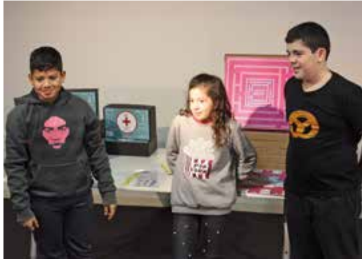
Alumnes d'El Sol i la Lluna en la presentació dels jocs de taula.