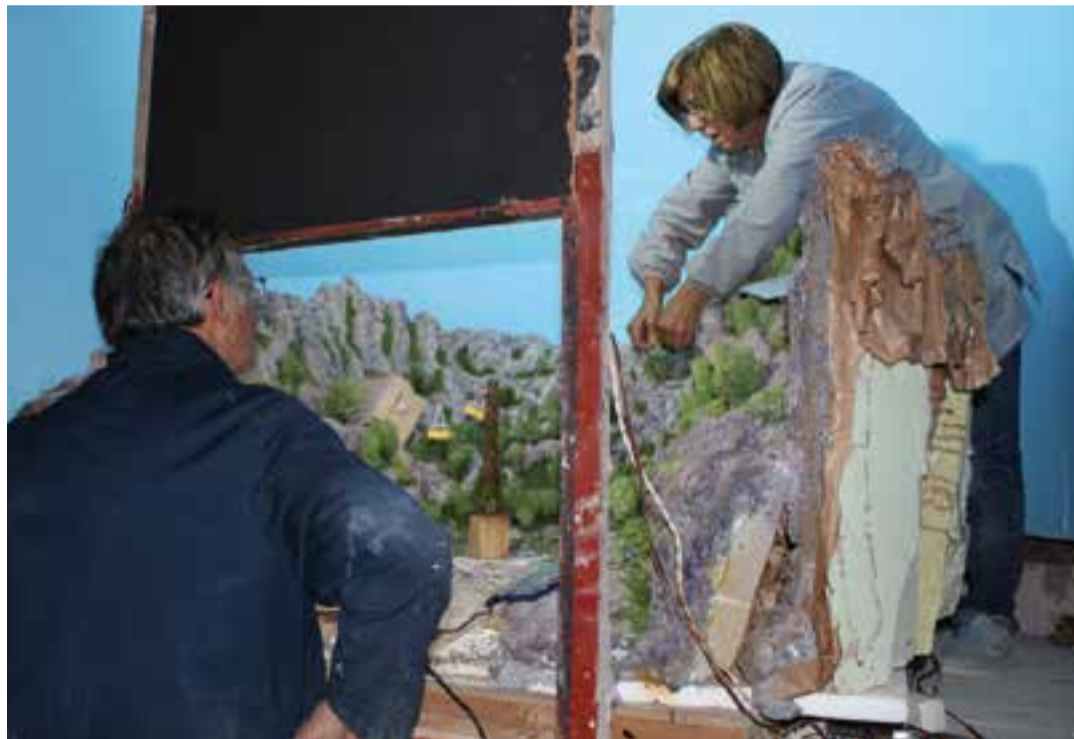
L'aeri de Montserrat és un dels quadres que es podrà veure a l'exposició del Grup Pessebrista de Castellar.

Els diorames estan ambientats en paisatges molt variats, indrets imagi-