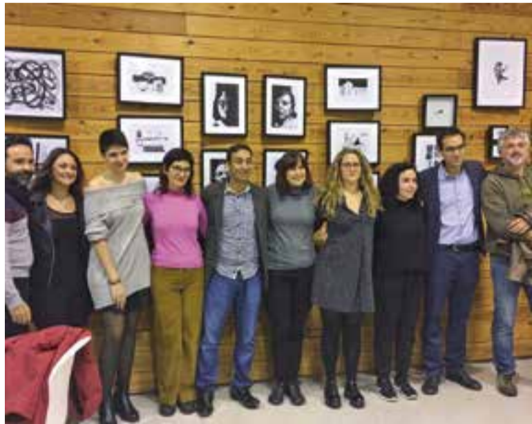
El grup d'artistes Off Collective va presentar-se divendres, a El Mirador.