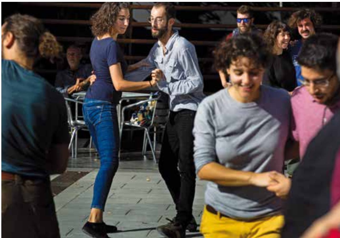
Alguns balladors seguint el ritme de la Castellar Swing Band a la plaça Calissó. || Q. PASCUAL

Des de castellarencs conduïts per la música fins a l'actuació i amants del swing, els que no se'n perden ni una, van omplir la jornada. Al llarg del matí, més d'un centenar de persones va passar per la plaça Calissó per gaudir del concert. + || GUILLEM PLANS