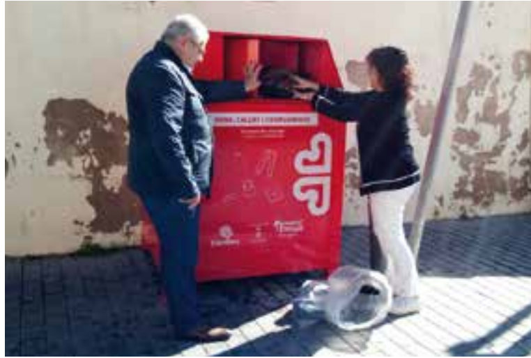
Davant de la parròquia hi ha un dels contenidors de roba de Càritas.

La roba es trasllada a una planta de 6.000 metres quadrats que la Fundació Formació i Treball té a Sant Esteve Sesrovires i des d'allà es gestiona la roba de segona mà procedent de donacions. "La roba passa per diferents processos i si és totalment inservible també s'aprofita per fer pasta de roba", assegura Cot. Seguint el model d'una peça outlet,