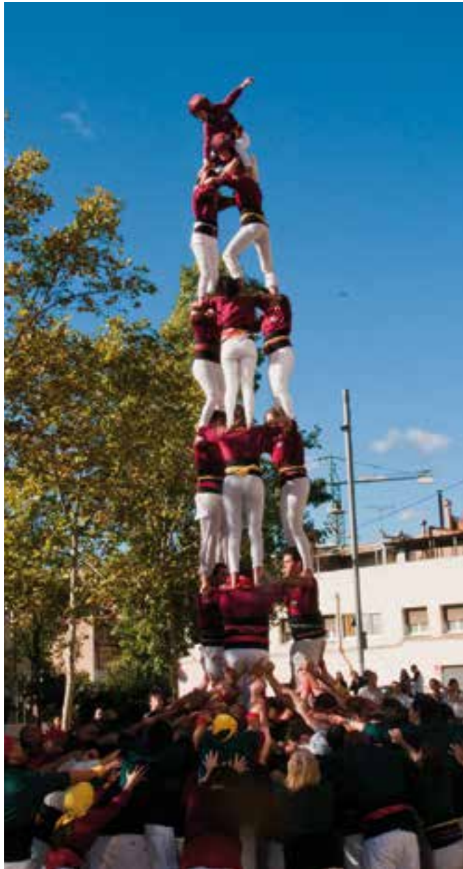
Els Capgirats executant el 3 de 7 a Caldes de Montbui.

Com a conseqüència d'aquesta gran actuació, els de Castellar rebran el Premi Baròmetre Casteller, que es dona a les colles que assoleixen un pis més durant la temporada. L'entrega del premi serà la propera Nit de Castells, una iniciativa de la Revista Castells. +|| REDACCIÓ