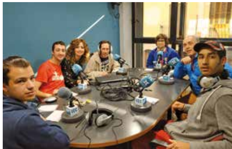
Alguns dels participants del Taller de Ràdio durant una gravació a l'estudi 1.

D'altra banda, l'Ajuntament de Castellar va oferir una recepció institucional als 16 esportistes de TEB Vallès i els seus respectius entrenadors, que van participar als Jocs Special Olympics 2018, a La Seu d'Urgell i Andorra la Vella, del 4 al 7 d'octubre. Aquest any, els 16 integrants han participat en una desena d'esports i han contribuït a guanyar 13 medalles d'or, 15 medalles de plata i 7 de bronze. +