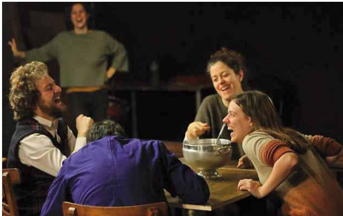
Un moment de l'obra 'Sopa de pollastre amb ordi', dirigida per Ferran Utzet, una producció de la Perla 29.

profundament emocionant, perquè tenim la família, unes relacions que amb el temps es van consolidant o distorsionant, i veure això sempre és bonic. Alhora, és una obra d'idees polítiques. Veure-la és emocionant i commovedor. És una obra de text que ens parla molt directament i a diferents nivells.