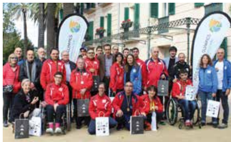
Foto de família amb els esportistes i els entrenadors al Palau Tolrà. || A.J. CASTELLAR