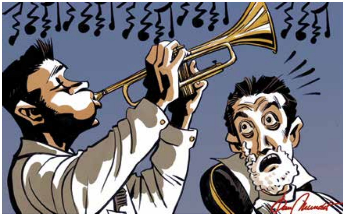
© Serenata barbera. || JOAN MUNDET

ci de la música com a semiprofessional i la pintura artística, vaig viure divertides anècdotes propiciades per aquesta combinació d'arts i oficis. No me'n puc estar d'explicar la d'un music col·lega que, si llavors ja haguessin existit les xarxes socials, hagués circulat de forma viral per YouTube, i de ben segur que hagués aconseguit un bon patrocinador que l'hauria catapultat cap a l'èxit internacional, alliberant-lo de l'obligació diària purament crematística. El cas és que el cantant i trompetista de l'Eiffel Quartet, grup musi-