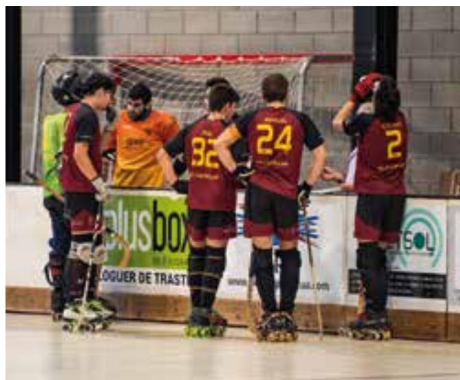
L'HC Castellar a la pista de l'HC Ripoll. || CEDIDA

"Hem fet un partit seriós, conscients de les baixes i coneixent les claus per aconseguir la victòria. Hem sabut controlar el ritme i arreglar el patiment de la primera part amb el rebot, per no haver de patir a la segona" va explicar el tècnic Raúl Jodra. +|| A. SAN ANDRÉS