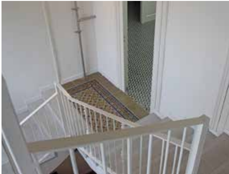
L'escala és una de les principals remodelacions de Torre Balada || R.GÓMEZ

Quant a la façana de l'edifici de Torre Balada, els treballs també han permès repassar-ne diverses àrees, de manera que s'han reparat les parts