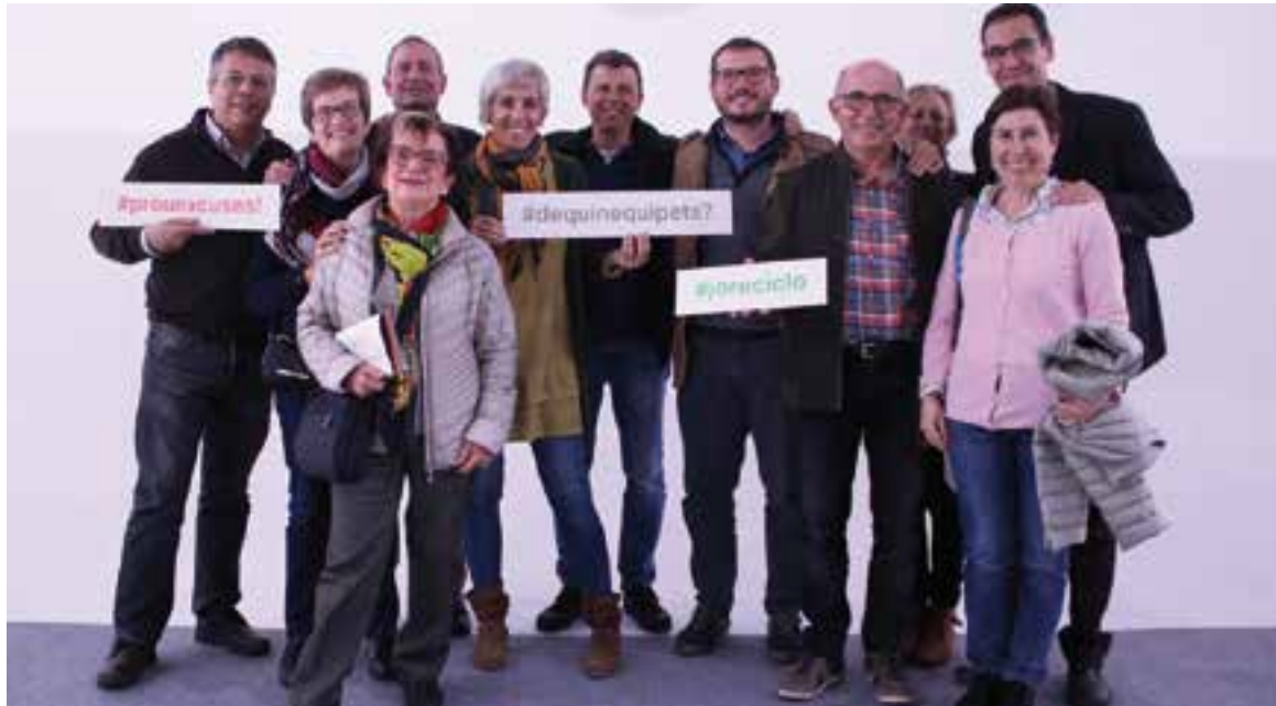
Alguns dels 'influencers' castellarencs que donen la cara a la campanya 'Excuses o separets?' amb l'alcalde i F. Mauri

Nou persones castellarenques protagonitzen una campanya per fomentar el reciclatge