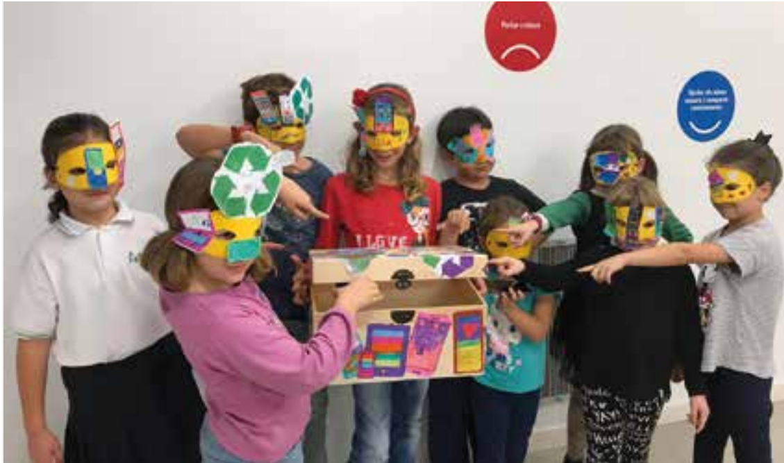
Taller 'Punt de recollida de telèfon mòbil', divendres passat, a El Mirador.