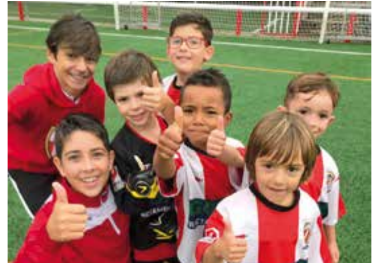
Alguns dels jugadors de l'equip debutant de la UE Castellar.