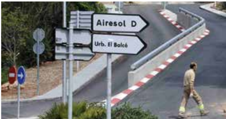
Imatge d'arxiu de l'accés a l'Aire-sol D i a El Balcó.

L'actuació, amb un pressupost de 30.000 euros, pretén resoldre les apagades com les que es van patir durant els aiguats del 15 i 16 d'octubre