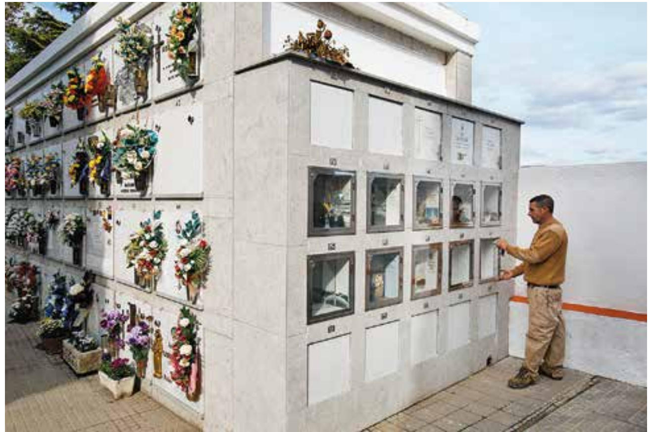
Un operari del cementiri municipal obrint un dels columbaris de què disposa el cementiri municipal || Q. PASCUAL

Són les que es van fer l'any passat enfront a 69 enterraments