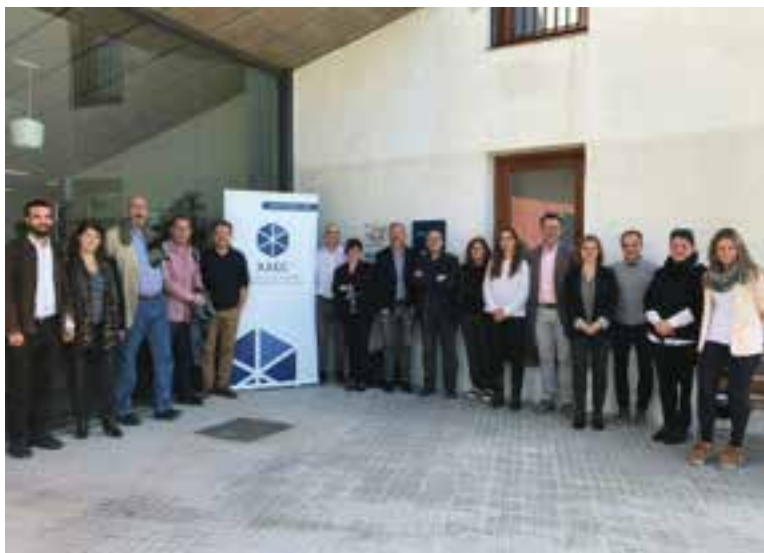
Presentació oficial de la Xarxa d'Allotjaments Empresarials de Catalunya.

Aquesta línia d'ajut ha anat evolucionant des de que l'Ajuntament la va obrir l'any 2015. El 2017, aquesta proposta municipal va comportar una despesa d'uns 6.400 euros i va beneficiar 8 empreses per a la contractació de 9 persones en situació d'atur. La nova aposta ara passa per incrementar els ajuts i la perllongació de les contractacions. + || REDACCIÓ