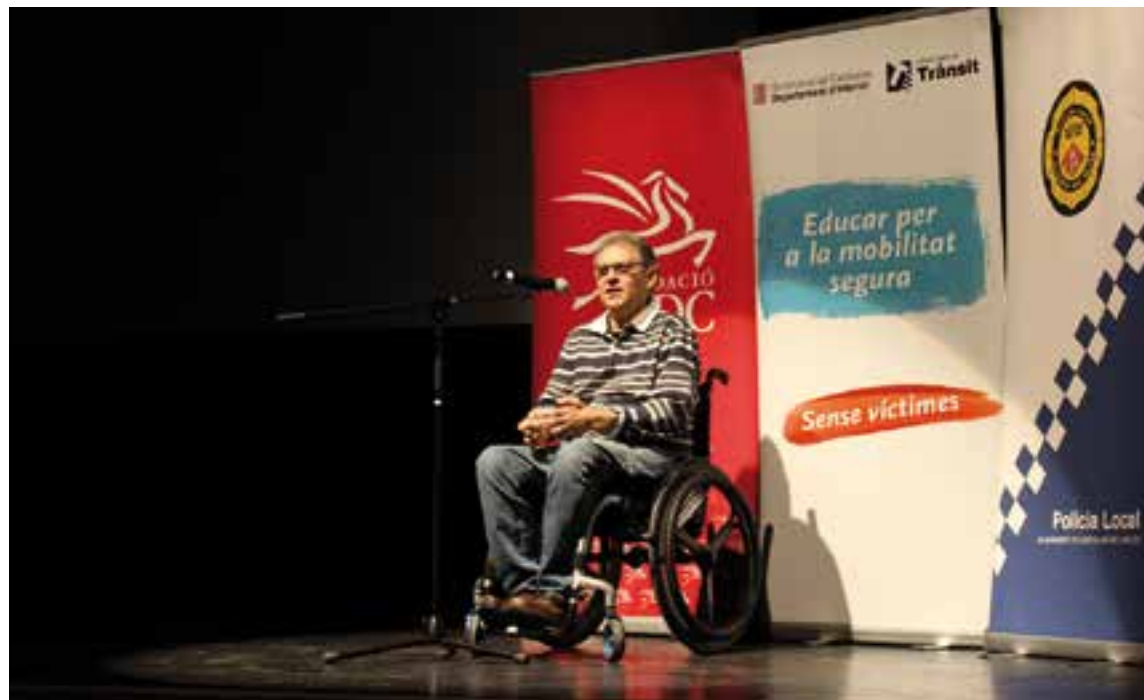
Un dels testimonis de 'Canvi de marxa' va explicar les conseqüències del sinistre que va patir.

La iniciativa educativa, impulsada per la fundació privada sense ànim de lucre Mutual de Conductors , amb el suport del Servei Català de Trànsit i la col·laboració de l'Ajuntament i la Policia Local de Castellar del Vallès, té l'objectiu de cons-