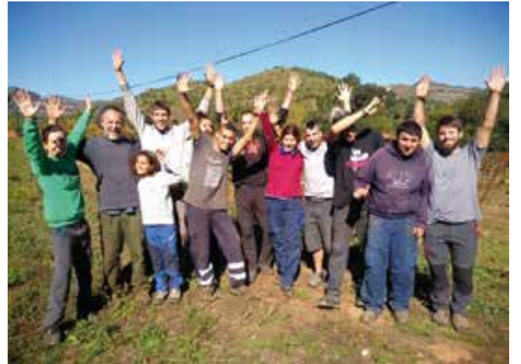
L'equip de la La Muntada i de L'Olivera celebren el final de la verema.