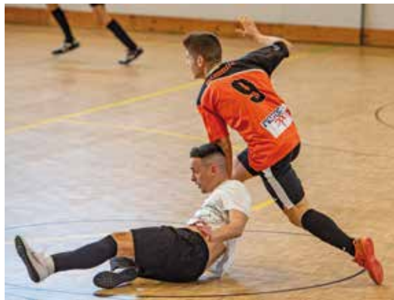
L'FS Castellar segueix sense sumar cap punt a Divisió d'Honor. || A. SAN ANDRÉS

Al minut dos de la segona aconseguien capgirar el partit, però el Cas-