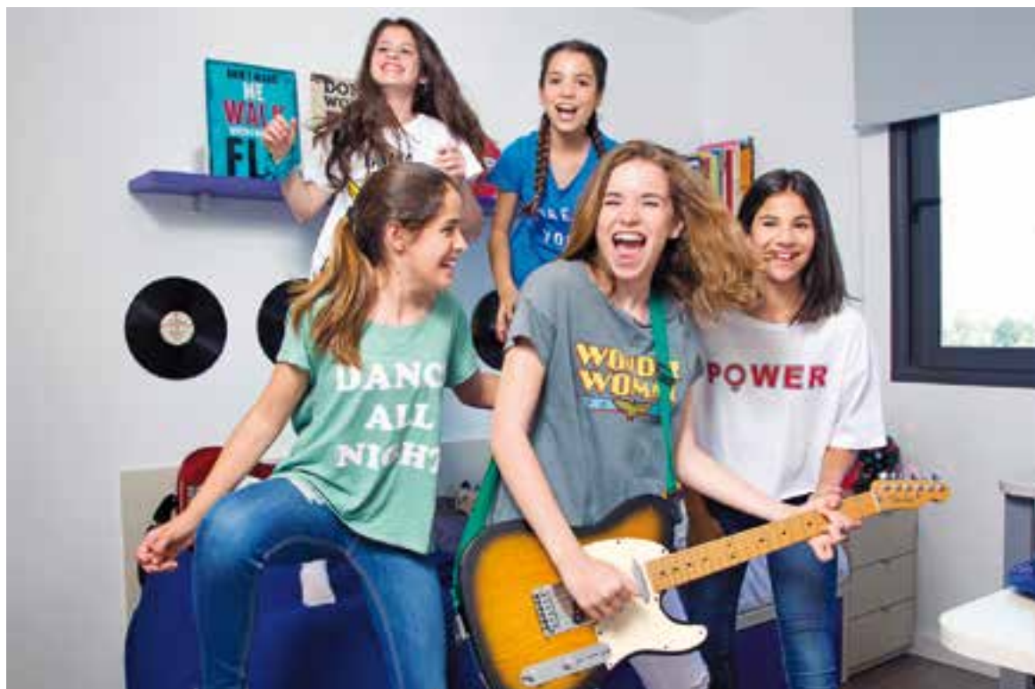
Macedònia actua aquest dissabte, a les 18 hores, a l'Auditori Municipal Miquel Pont.

És la primera gira amb aquesta generació de nenes de Macedònia.