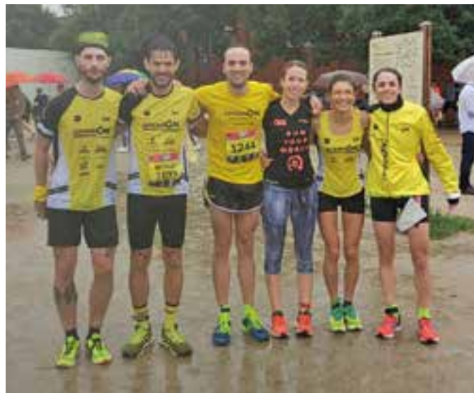
Els atletes del Dimension3 presents a la Primera Marató de Muntanya.