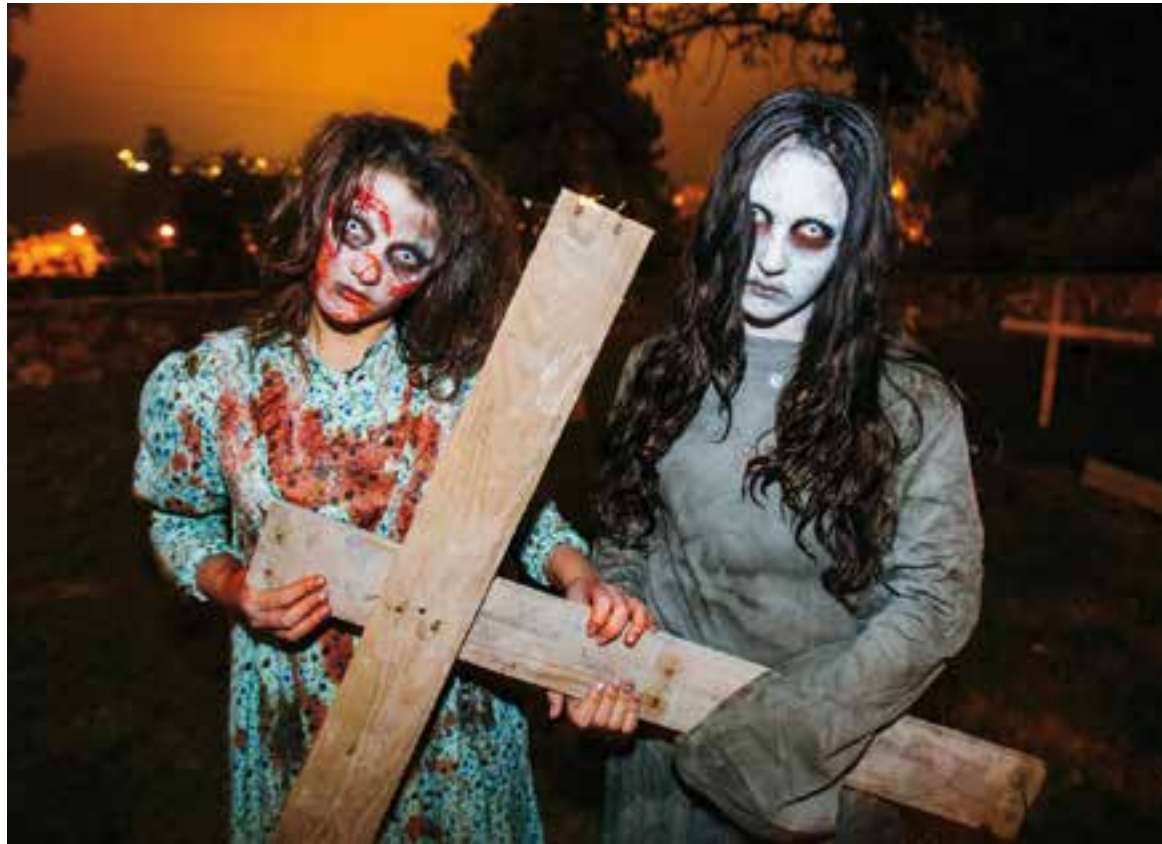
Dues de les protagonistes del passatge del terror del parc de Canyelles || Q. PASCUAL

Amb emoció, nervis, expectació i a voltes angoixa, esperen el seu torn al costat de l'església de Sant Esteve. Enguany, és l'entrada al passatge del terror que organitza Castellar Jove. "Diuen que abans era un cementiri", comenta un adolescent. "Espero passar por i que ens espantin", li respon un company. Amb la inconsciència i gosa-