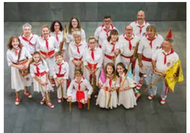
Foto de família del grup de Ball de Bastons de Castellar.

La ballada va estar marcada per la pluja, que no va impedir la celebració. "Tot i estar previst fer un recorregut dansat pel parc de Vallparadís fins al centre, finalment la vam dur a terme en forma de ballada estàtica dins l'Auditori de l'Escola Municipal de Música" . En aquesta ballada de lluïment, les colles van mostrar les diverses coreografies pròpies, en dues rondes, i es van executar dues danses conjuntes: el "Passi-ho bé" i el Ball de Bastons de la Territorial del Vallès, creat pels joves de diferents colles vallesanes i ballat per primer cop en aquesta bastonada. Per novembre i desembre ens queden activitats i ballades per fer. "Animem tothom qui vulgui que vingui a formar part d'aquesta família bastonera, tant si és gran o petit, i descobriran del que són capaços de fer picant els bastons" . † M. A.