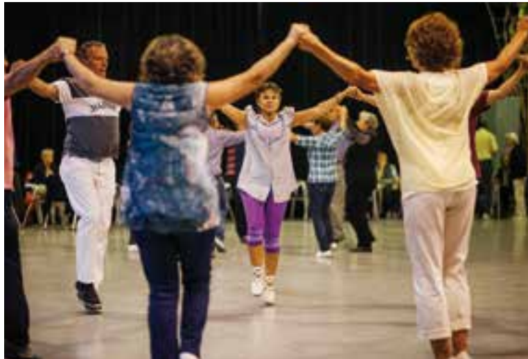
Diada Sardanista a la Sala Blava, l'any 2014. || Q. PASCUAL

El programa de la Diada inclou les sardanes següents: Sardanes a Castellar , de J.J. Beumala; Un bon badaloní , de J. Paulí; Capvespre a la Ràpita , d'A. Abad; Somni de plaça , de X. Piñol; 30 anys A Sac , d'E. Ortí; Per tu, Sílvia , de S. Galbany; Cap de Creus , de R. Cabrisés; Niu d'amor , R. Viladesau; Un somriure encisador , de J. Làzaro; Els de Castellar , de F. Mas Ros; Tota una història , de C. Santiago; Colla Roca , de J. Leon; Clotilde , de C. Rovira; L'Aplec de Santa Perpètua , de J. Auferil; Castellar, perla del Vallès , de R. Vilà; La Flama de la sar-