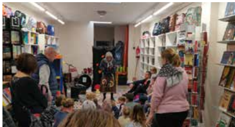
Taller de panellets del Villaró i l'espectacle 'Les peripècies de la castanyera'.

carrer Major" . Fins i tot, a la tarda, quan va ploure més, els assistents a la darrera actuació d'Artcàdia van poder fer una xocolatada a la Sala de Butxaca de l'Ateneu "que ens va fer, a manera de comiat, la pastisseria Andreu" -que acaba de traslladar-se al carrer Sala Boadella".