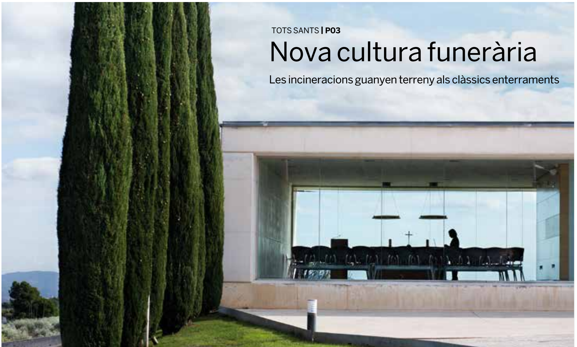
Imatge d'una de les instal·lacions del tanatori de Castellar, al recinte del cementiri, en una imatge de dimarts passat.

Les incineracions guanyen terreny als clàssics enterraments