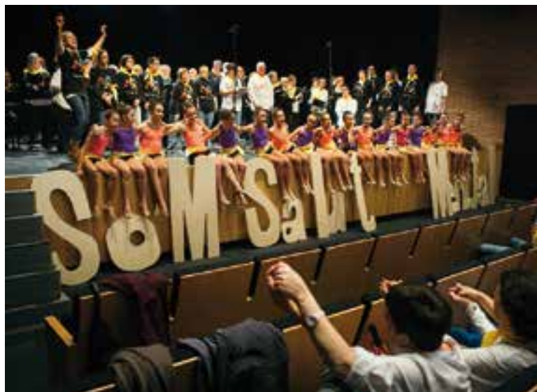
Un dels moments amb la participació de tots els que van actuar a l'espectacle. || Q. PASCUAL

La música es va escampar per tots els racons de l'Auditori Municipal, dissabte passat