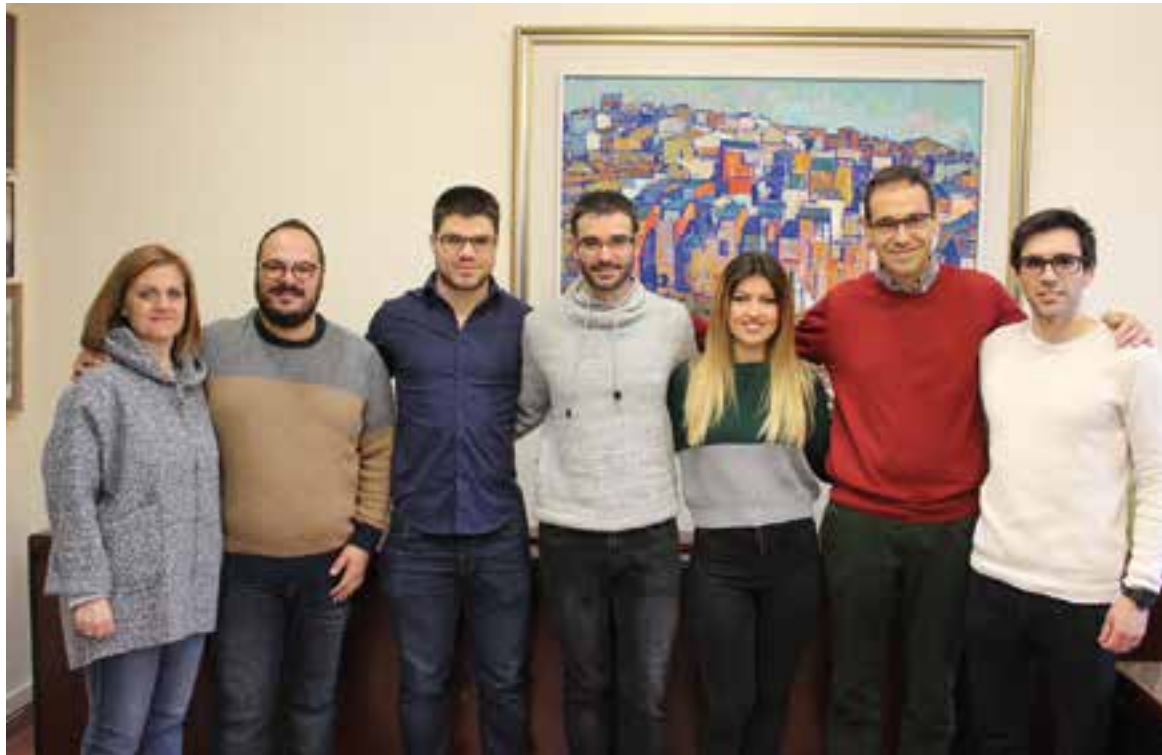
Els quatre joves que han estat contractats a través del Pla de Garantia Juvenil amb l'alcalde i dos regidors del govern.