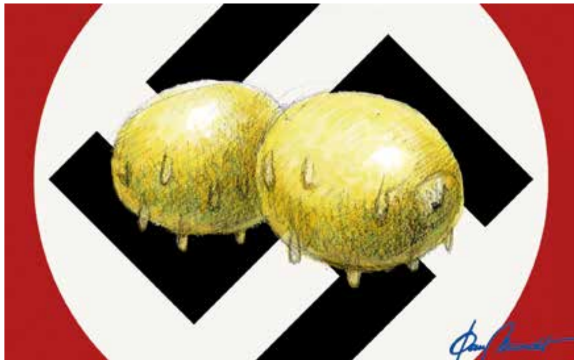
© Dies grocs àcids. || JOAN MUNDET

“Com pot ser doncs que, un cop som adults algú es neguitegi i actui violentament quan té al davant un element groc?”