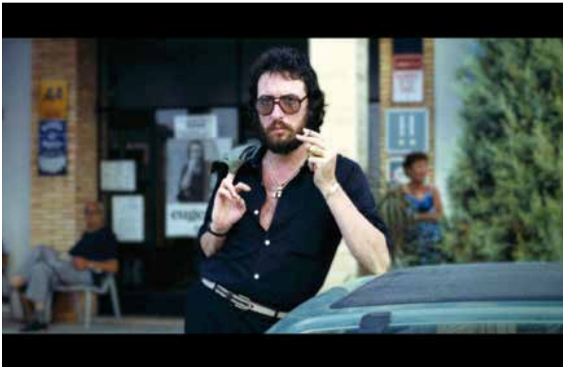
'Eugenio' és el DocsBarcelona del Mes que explica la vida del popular humorista català.