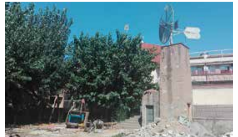
Les obres a la plaça Folch i Torres és de les darreres actuacions en marxa.

Des de Junts per Castellar, a més, es considera que s'ha fet una mala programació de les obres: "Potser que abans de començar noves obres acabem les que ja estan encetades". En concret, apunten que les obres del carrer Nou van començar quatre mesos i van amb retades, "o les de les escales dels "enanitos" a Sant Feliu, que fa tants anys que duren que els veïns proposen anomenar-les escales de la "Sagrada Família". +