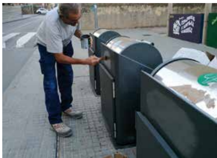
Un ciutadà tapa el lema 'Llibertat presos polítics' a la plaça Francesc Macià. || CEDIDA

Ciutadans de Castellar van fer una acció dimarts passat a la vila per treure i eliminar símbols grocs i llaços apareguts a l'espai públic. Segons la formació taronja, l'equip de govern municipal sembla que "o bé recolza les bretolades a l'espai públic o no vol molestar", malgrat les repetides instàncies que, segons Ciutadans, han presentat a l'Ajuntament "reclamant el respecte i bo ús dels espais públics". + || CEDIDA