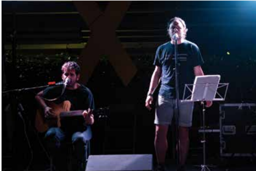
Els Collons del Pare Rababa, que van actuar diumenge passat per commemorar l'1-O, també hi seran al Correllengua.