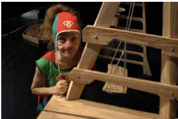
La pallasa La Bleda protagonitza 'Superbleda' a l'Auditori Municipal.

Paral·lelament, el Correllengua ha previst una exposició amb els diferents treballs relacionats amb el tema del Correllengua 2018 "Nova cançó", que han elaborat les escoles Sant Esteve, El Sol i la lluna i l'Emili Carles Tolrà. "La farem al Mercat Municipal perquè sigui més visible que altres anys i durarà una setmana, del 6 al 13". +