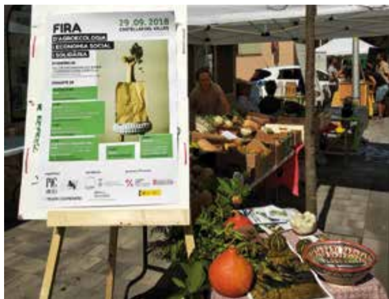
La fira ha ofert productes de proximitat i de qualitat.