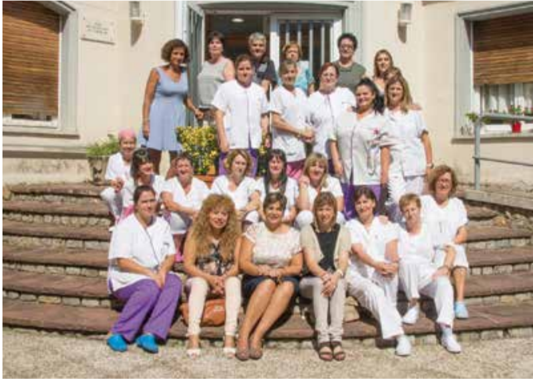
Foto de grup del personal actual de la Fundació de l'Obra Social Benèfica a l'entrada de l'edifici.

Al llarg d'aquests 90 anys, la institució ha passat per moltes vicissituds. L'Obra Social Benèfica ha requerit en molts moments de subscripcions de socis -hi ha hagut dues subscripcions populars a l'any 1928 i als anys 50-, donacions tant a nivell empresarial com particular i convenis i subvencions amb l'Ajuntament i la Generalitat. "Últimament veníem d'una època molt turbulenta, amb molts problemes de personal i econòmics. Tot i que a l'Obra Social els problemes econòmics són crònics, el meu predecessor va posar ordre i jo vaig intentar invertir i fer que la casa lluis més", explica