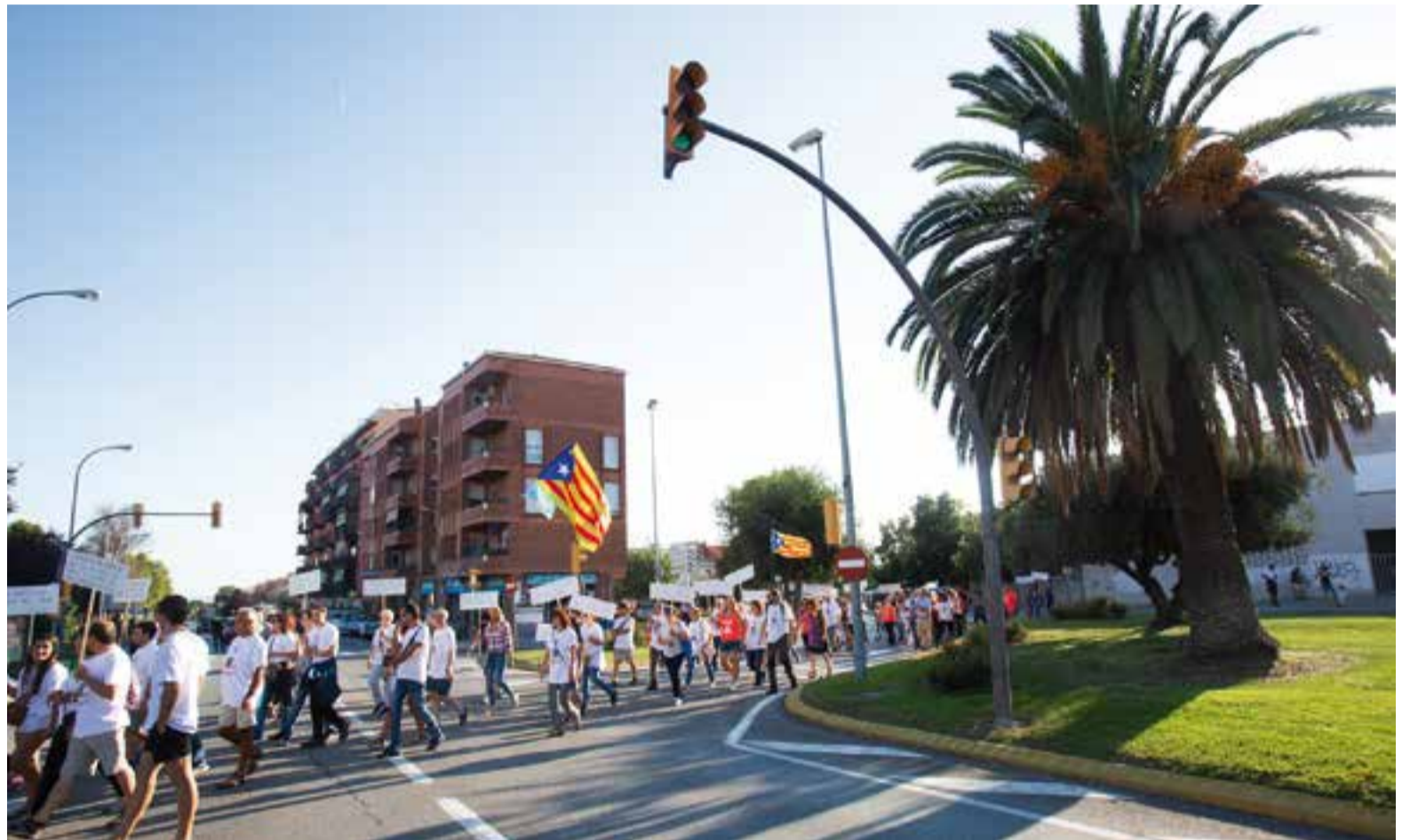
La Marxa Popular que recorria els diferents col·legis que van ser seu electoral de l'1 d'octubre, al seu pas pels Pedrissos després de passar per l'INS Castellar.

La commemoració de l'1 d'octubre ha estat organitzada conjuntament per diverses comissions ciutadanes, formades per entitats de la vila i persones a títol individual, a més de la implicació dels CDR i de l'ANC Castellar. També