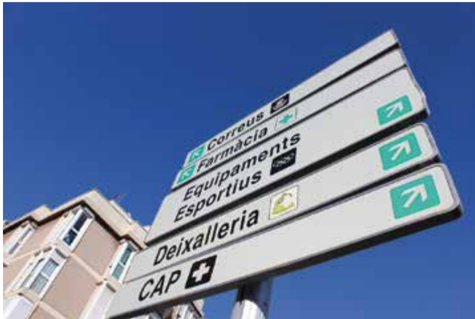
Els treballs inclouen la retirada de senyals que han caducat.

El projecte de senyalització també té com a finalitat bàsica guiar