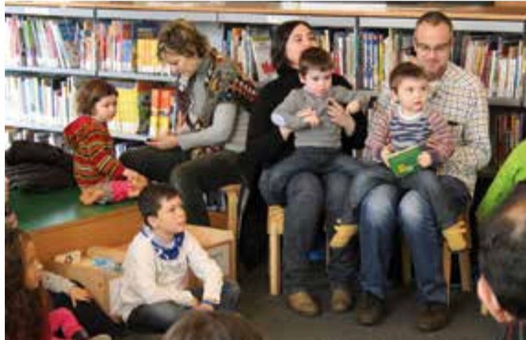
L'Hora del conte es traslladarà a Cal Calissó durant les obres.

Pel que fa a la planta soterrani, s'hi habilitarà una nova sortida d'emergència i es reformaran els magatzems per tal d'optimitzar l'espai. A més, es renovaran les llume-