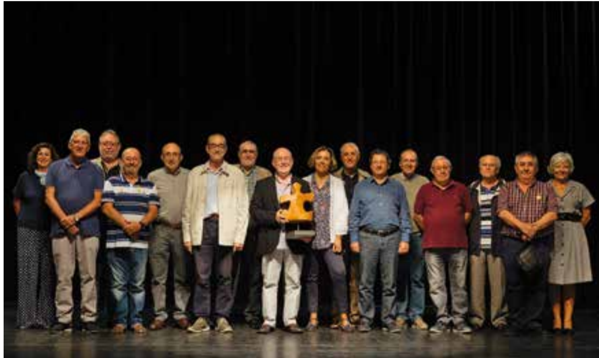
La nova executiva de L'Aula en la sessió inaugural del curs, dimarts passat