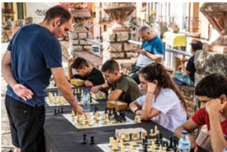
Participants de les partides ràpides d'escacs de la Festa Major '18. || A. SAN ANDRÉS

El CB Castellar comença afinat la temporada, amb una important victòria que els deixa com a líders de la categoria, abans de visitar la difícil pista del Círcol Cotonificio de Badalona. + || A. SAN ANDRÉS