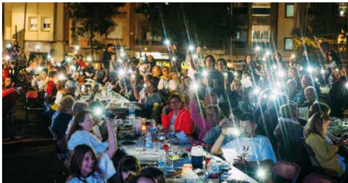
El sopar popular que culminava els actes de diumenge va aplegar unes 500 persones a la plaça d'El Mirador.

Finalment, el text defensava la legitimitat del referèndum i el fet de trobar una solució democràtica al conflicte, i, "si la majoria del poble de Catalunya ho desitja, fer efectiva la República Catalana" . +