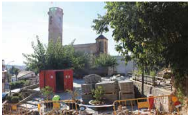
Els treballs es faran durant l'octubre || AJ. CASTELLAR

L'execució del projecte de senyalització, que està previst que finalitzi el mes de febrer, anirà a càrrec de l'empresa Chaper SL i tindrà un cost d'execució de 48.400 euros. ➔