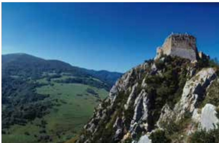
Castell de Montsegur, punt d'arribada de la ruta dels càtars.

A banda de la col·laboració amb la projecció d'aquest divendres, l'entitat projectarà diversos films americans: Tres anuncis en las afueras , de Marin McDonagh, el dia 28 de setembre. El cicle continuarà amb The Florida Project , de Sean Baker, el dia 19 d'octubre. I el 16 de novembre serà el torn de Lucky , de John Carroll. El dia 30 de novembre es podrà veure Yo, Tonya , de Craig Gillespie. Les projeccions del divendres també comptaran amb la cinta El insulto , de Ziad Doueri, un film libanès, en aquest cas. El CCCV també obrirà la programació municipal de cinema en diumenge el dia 7 d'octubre amb la projecció de Petitot , de Carles Bosch. Es tracta d'una proposta musical inclosa a la programació del Correllengua 2018. El DocsBarcelona del Mes, coorganitzat per Cal Gorina, LAula i el CCCV continuarà amb una projecció el 5 d'octubre, amb Eugenio , de Jordi Rovira i Xavier Baig. El 9 de novembre s'ha previst Of Fathers and Sons , de Talal Derki, i el 14 de desembre, Last Days in Shibati , de Hendrick Dusollier. +