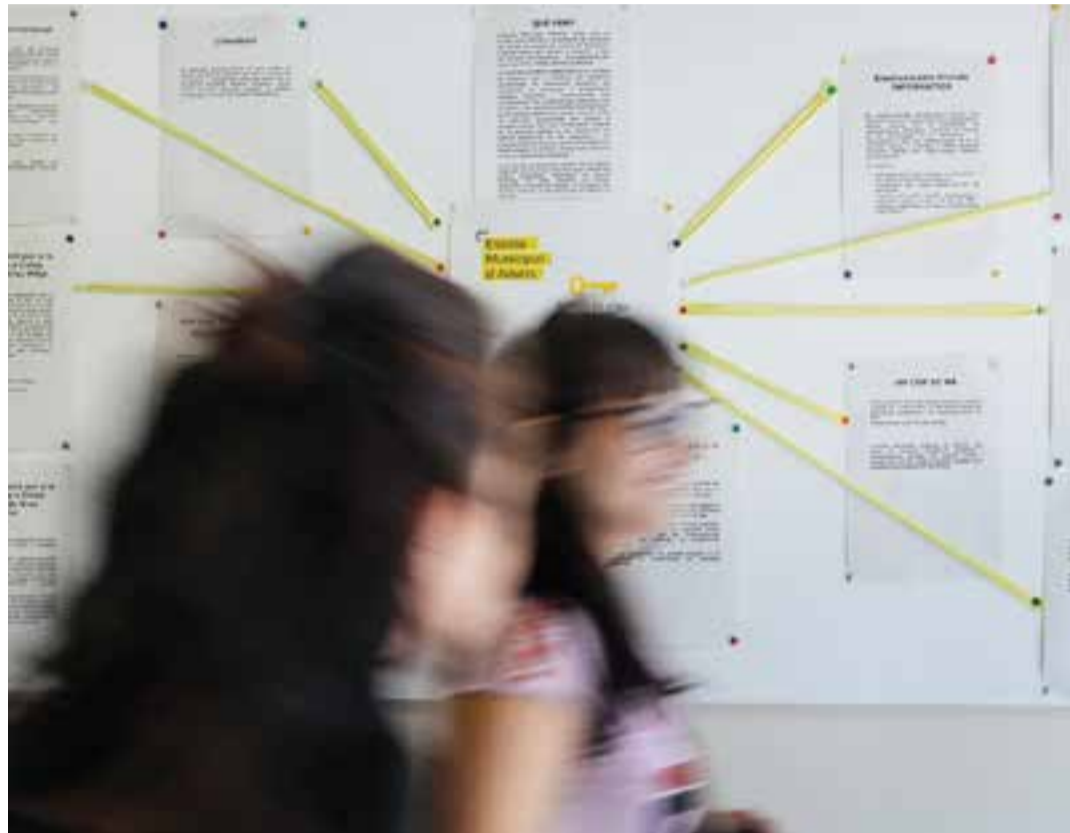
Unes estudiantos passen per davant d'un plafó d'anuncis de l'escola, on es pot veure l'oferta de cursos.

Precisament, una de les novetats en l'oferta educativa del centre aquest any és el curs d'iniciació a la informàtica, que ja compta amb una desena d'alumnes. Al curs es treballaran nocions bàsiques d'informàtica com l'entorn Windows (carpetes, arxius, finestres, disc extern de memòria, etcètera), entorn Google (eines de cerca, Drive -textos, presentacions, formularis, full de càlcul, etc.-), Gmail, Google fotos, Youtube, aplicacions mòbils, gravació i edició de vídeo, xarxes socials, entre d'altres temes. Enguany, l'Escola d'Adults ofereix el curs cinquè d'anglès tot i que l'oferta és diferent al matí respecte a la tarda. Així, al matí, s'ofereixen els cursos 2n i 3r - el que dona l'equivalència MECR A2.2- mentre