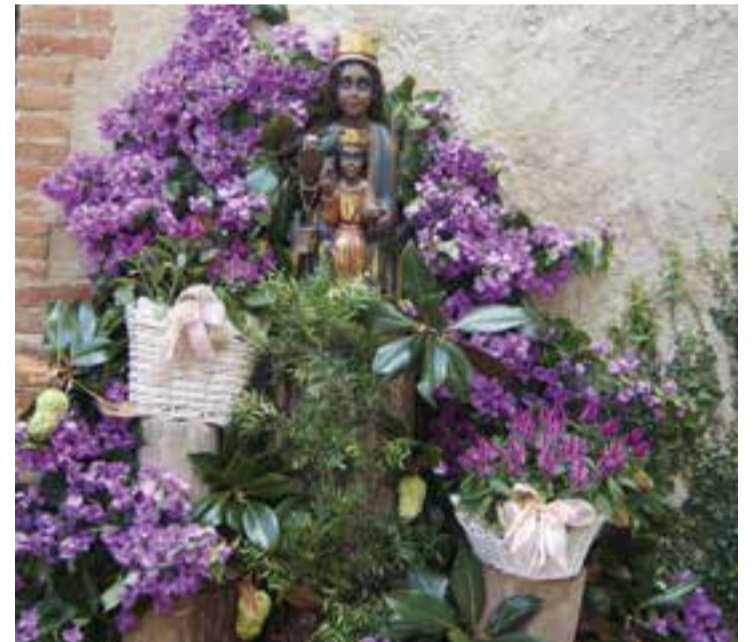
Altar a la marededeu de les Arenes en motiu de l'Aplec.

Un cop finalitzada la missa, el grup d'havaneres Port Vell va oferir un repertori clàssic de cançó marinera i de taverna que va agardar molt. Per a cloure la trobada, es van posar a la venda uns nous goigs en color, que commemoren els 25 anys d'existència dels Amics de l'ermita de les Arenes. +