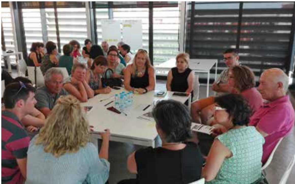
Un dels tallers participatius que es va fer durant la primera etapa del Pla Estratègic 20/20

S'han programat tres tallers sobre l'àmbit social, econòmic i territorial