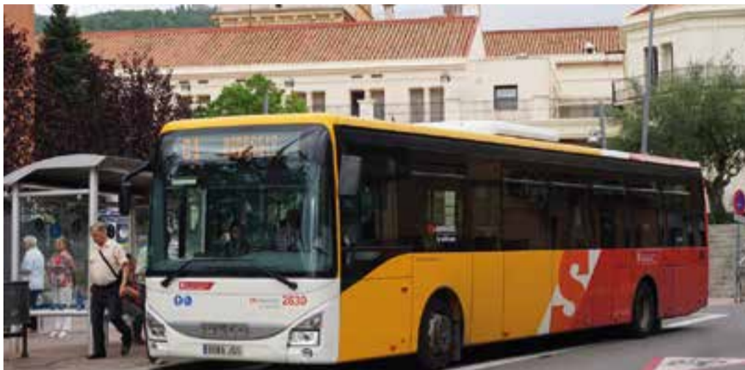
La línia d'autobusos C1 de la Vallesana és un dels principals mitjans de transport per als estudiants

Quant al termini per demanar les subvencions, tant de forma telemàtica al web municipal com presencialment al Servei d'Atenció Ciutadana d'El Mirador,