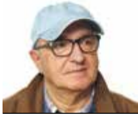
JACINT TORRENTS Escriptor