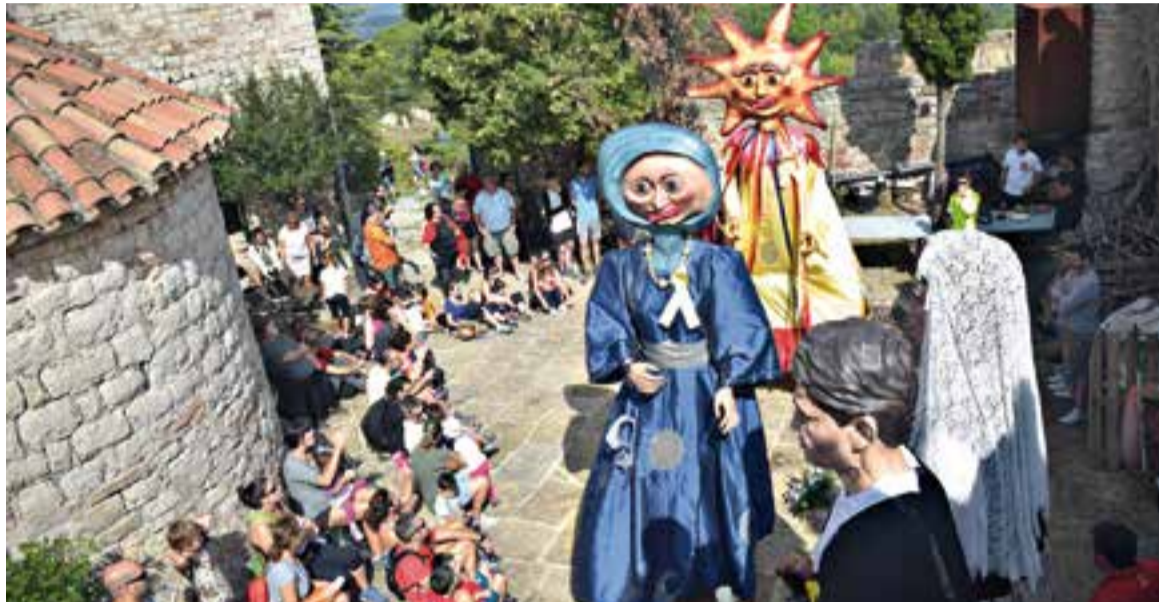
Com és habitual, els Gegants de Castellar van fer el cim caminant acompanyats d'una vintena de persones.

"El Puig de la Creu és un lloc emblemàtic, i cada vegada té més