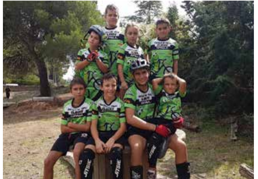
Els integrants de l'Escola de trial 'ELBIXU' a la Copa Catalana.