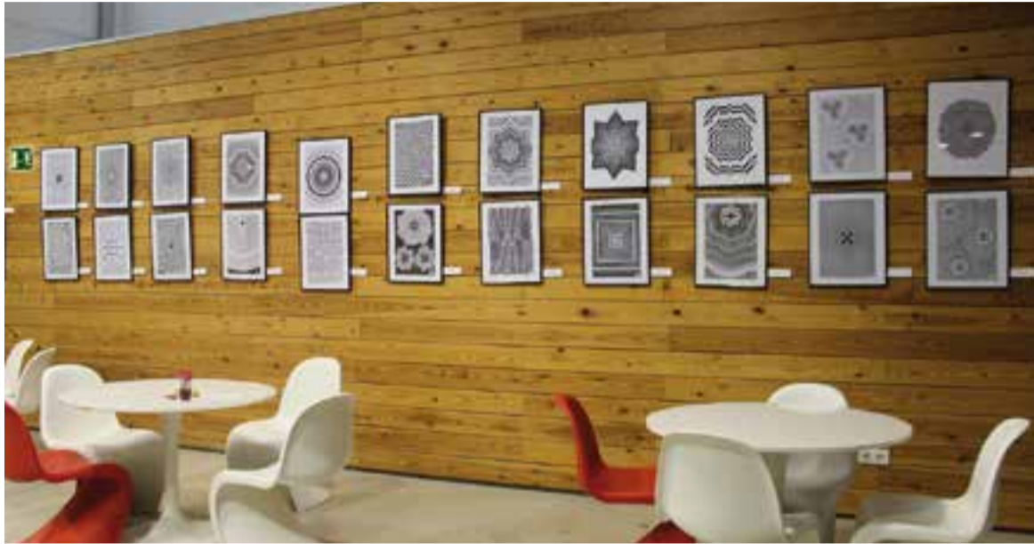
Exposició de pintures de Blai Catafal a l'Espai Sales d'El Mirador. || M. ANTÚNEZ