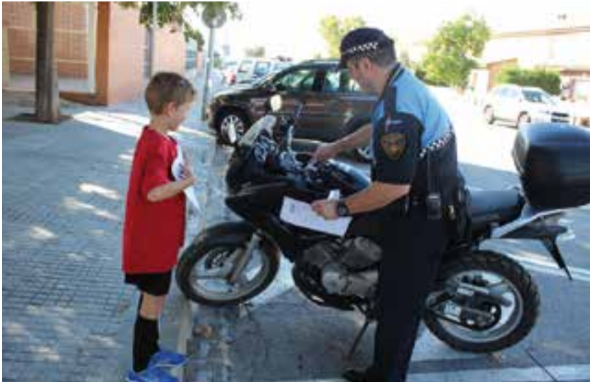
Un alumne del Mestre Pla, acompanyat d'un agent, posa un avís sobre una moto.