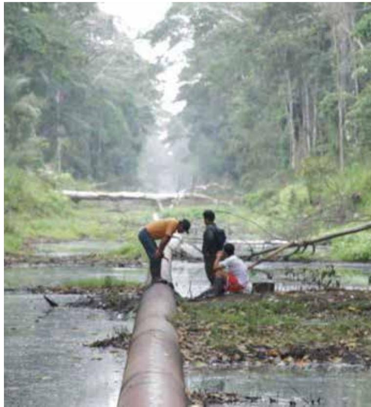
Imatge del documental 'Lágrimas de aceite' que es projecta a l'Auditori.

EL TRIMESTRE DEL CCCV | El Club Cinema Castellar Vallès ha donat a conèixer la resta de la programació documental i de ficció pel proper trimestre, marcada per la presència de títols nord-americans de tall independent