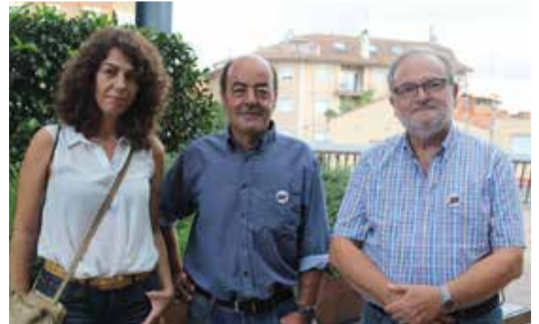
El grup fotogràfic de la Comissió de l'1-0 de Castellar, dimarts passat