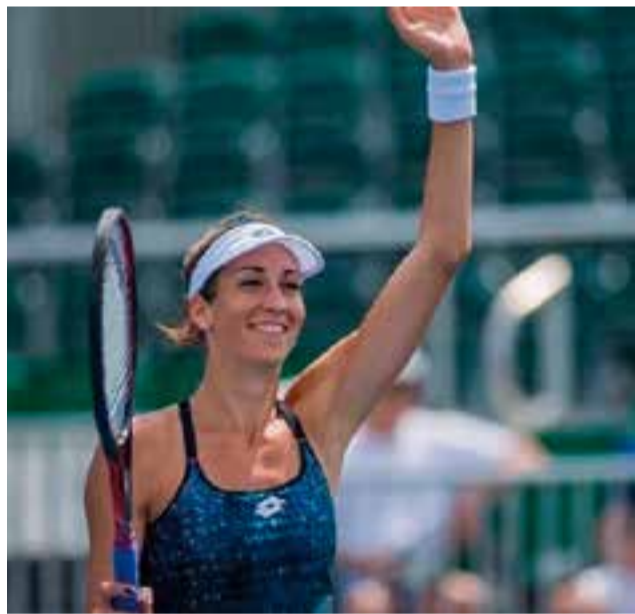
La tenista castellarenca durant la disputa d'un torneig.