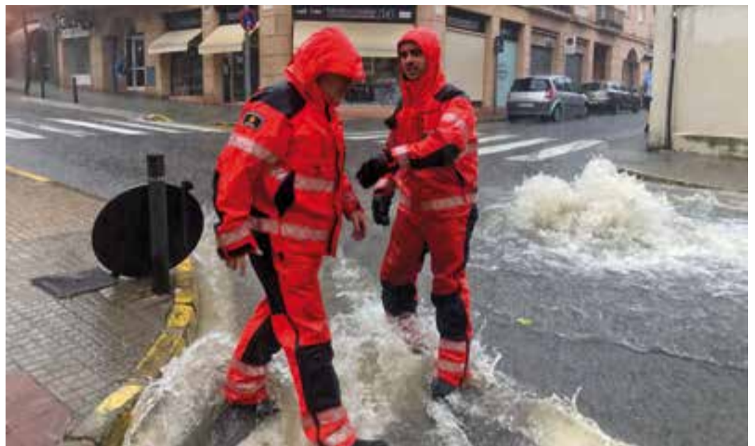
Dos bombers al carrer Passeig traient les tapes d'embornal en un moment de forta pluja.

A l'àrea industrial del Pla de la Bruguera, al carrer de Priorat, 58, es va haver de salvar del perill de caiguda “el sostre d'una nau, que va cedir” , diu Altarriba. A més, també es va fer algun sanejament de façana, “com és ara el del carrer Fàbregas, cantonada passeig, per netejar un voladís” . Es van detectar també forats a la calçada a causa de l'aigua, al carrer Doctor Rovira, on es va fer sortida de bombers, i a l'alçada de la Dona Acollidora, on ja no va caldre l'assistència. Segons apunta també la policia municipal, un grup semafòric del carrer Pedrissos, i d'altres, es van quedar sense electricitat i un vehicle va quedar amb dues rodes en una tapa de clavegueram. A l'avinguda II de setembre, un contenidor es va moure de lloc, afectant un vehicle. +