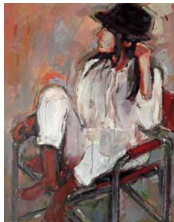
Quadre d'Esteve Prat que es podrà veure a l'exposició.

El pintor castellarenc Esteve Prat inaugura una nova exposició aquest setembre. Es podrà visitar a la Galeria d'Art Terraferma al carrer Bisbe Ruano, 15, de Lleida. Consta de 6 obres de mesures 70X50cm sobre paper amb tècnica mixta i de temàtica "la figura". A banda de la primera exposició aquest mes, Esteve Prat prepara una altra exposició pel febrer - març del 2019, a Barcelona, i pel maig, una a Tarragona i una altra a Terrassa.