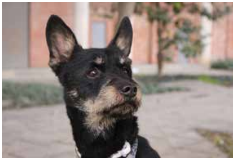
En Blacky es troba a Caldes Animal en adopció solidària, sense cost.

CRIDA PER A LLARS D'ACOLLIDA I ADOPCIÓ En xifres, a Caldes Animal hi ha 62 gats i 53 gossos que han estat recollits als carrers i places de Castellar del Vallès. D'aquests, 11 gossos i 12 gats es troben en situació d'adopció solidària, és a dir, sense cost per a l'adoptant. Davant d'aquest escenari, l'Ajuntament ha fet una crida a la ciutadania per cercar amb urgència