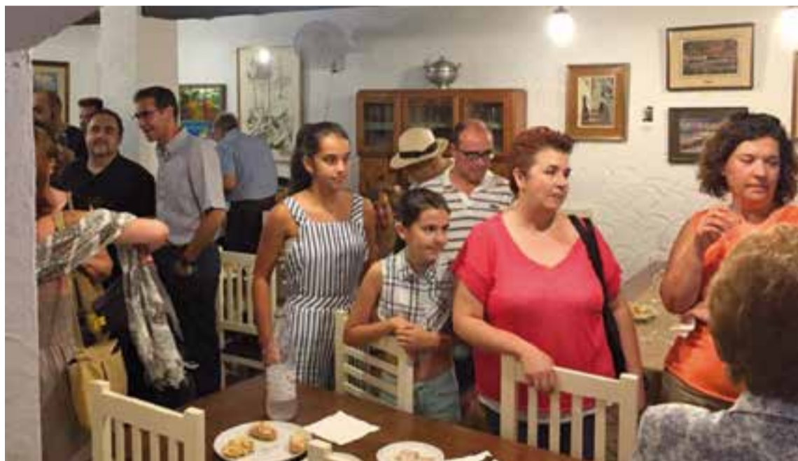
Un moment de la inauguració de l'exposició a la Taberna del Gall.