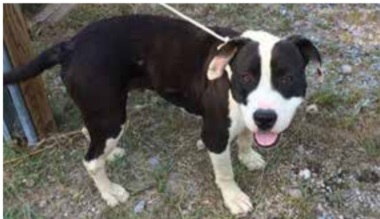
En Titan va arribar el juliol passat a la protectora i està en adopció.

llars d'acollida i promoure les adopcions de gats i gossos. Caldes Animal exposa que aquesta "situació de saturació" també l'estan patint altres protectores com les de Sabadell, Mataró i Granollers.