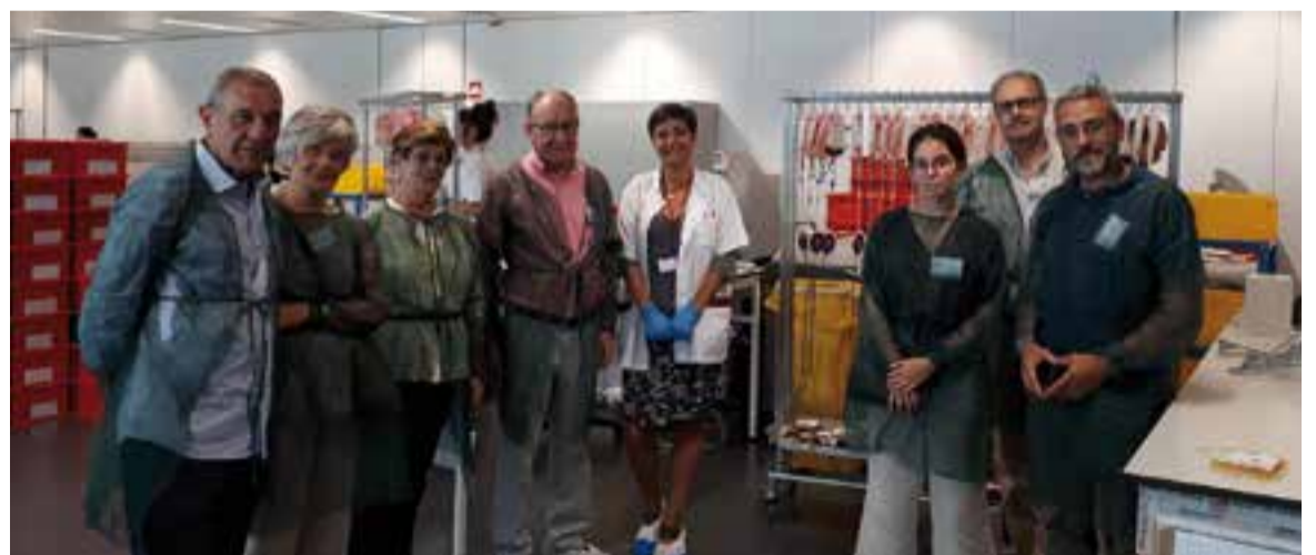
Comitiva castellarenca durant la visita al Banc de Sang i de Teixits de Catalunya la setmana passada

Durant el recorregut, el grup va descobrir el procés de tractament i emmagatzematge de la sang, i els diversos departaments que conformen aquesta institució pública vinculada al Departament de Salut. "També tenen un banc de teixits amb ossos, pell, ulls o cordons umbilicals, entre d'altres. A més de facilitar sang als hospitals, disposen d'un centre de recerca. És un edifici intel·ligent, l'últim crit en tecnologia", detalla Moix.