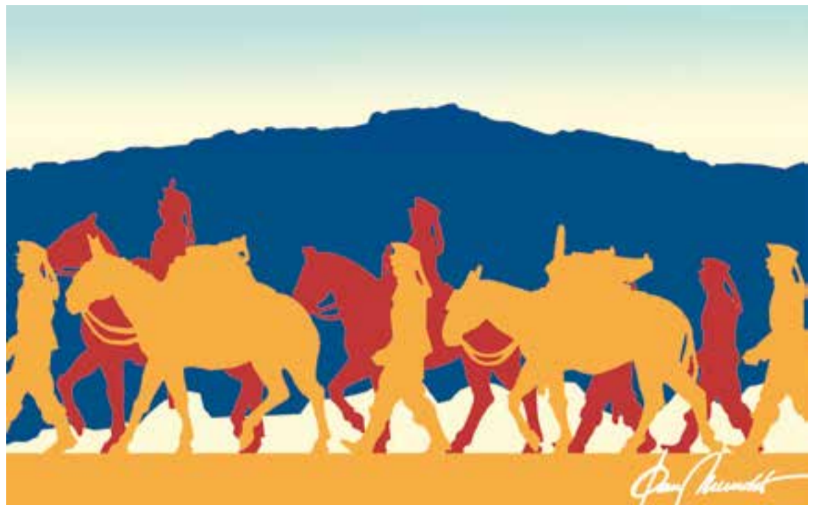
© Maniobres militars 1916. || JOAN MUNDET

s'estatgen dotze soldats. Les actes municipals deixen constància de l'arribada a la població d'aquest grup de militars en pràctiques; així l'acta de Ple del 15 d'octubre de 1916 concreta que l'Alcaldia ha rebut el comunicat on s'informa de la seva estada a la població. L'acta següent, de 22 d'octubre, parla dels subministres de pa, civada, palla, llenya i petroli que l'Ajuntament havia de facilitar als soldats mentre estiguessin al poble així com de les indemnitzacions que el Regiment va abonar pels desperfectes causats pels cavalls en algunes de les quadres on es guardaven.