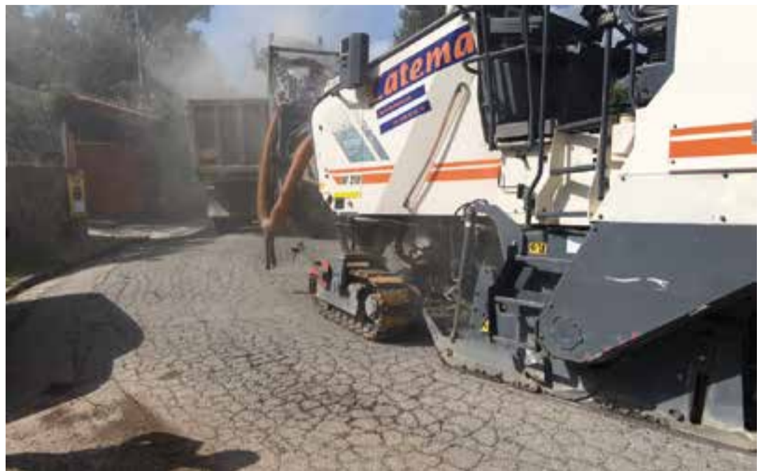
Obres d'asfaltat del carrer Comagrossa, d'El Balcó, en una imatge de dilluns passat.

Un dels carrers més transitats per la Festa Major és el carrer Major, que actualment està en obres per convertir-lo en una via de plataforma única. González ha confirmat que entre el 3 i el 5 de setembre es farà l'asfaltat del carrer des del carrer Església fins a la plaça Calissó, inclòs el carrer Colom, "just a punt per a la Festa Major" . També s'aprofitarà per asfaltar el carrer Anselm Clavé on encara queden per completar algunes voreres i algunes cruïlles.