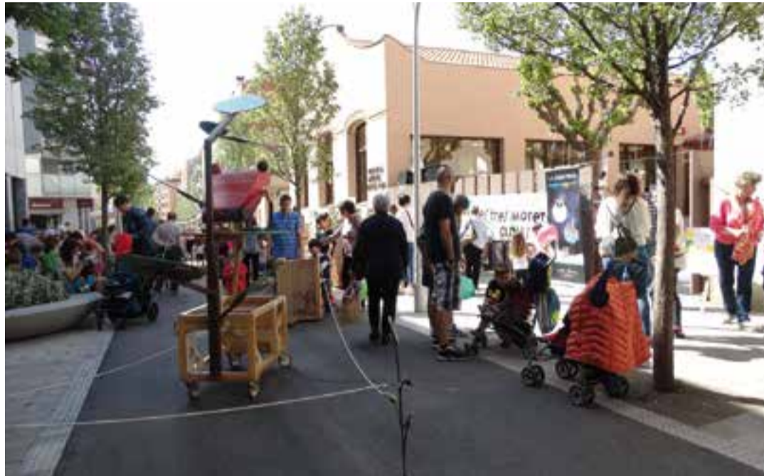
Festa del 20è aniversari de la ludoteca municipal al carrer Sala Boadella l'abril d'aquest any. || M. ANTÚNEZ

Per al nou curs, la Ludoteca mantindrà la resta d'espais i propostes que ofereix habitualment. Així, es continuarà oferint el servei diari, les tardes de dilluns a divendres, de 17 a 19.30 hores, per on el curs 2017-2018 van passar 350 infants diferents, 260 dels quals amb entrada puntual, 105 fent-hi una inscripció mensual i alguns altres utilitzant les dues modalitats. Cal tenir en compte que la majoria de les entrades puntuals s'han adquirit a través dels abonaments de 10 entrades (durant el curs 2017-2018 se n'han venut 69) que poden ser compartits per més d'un infant de P3 a 6è de primària, ja que no són nominals. Per adquirir-los, només cal adreçar-se al Servei d'Atenció Ciutadana (SAC). Les famílies que l'han ad-