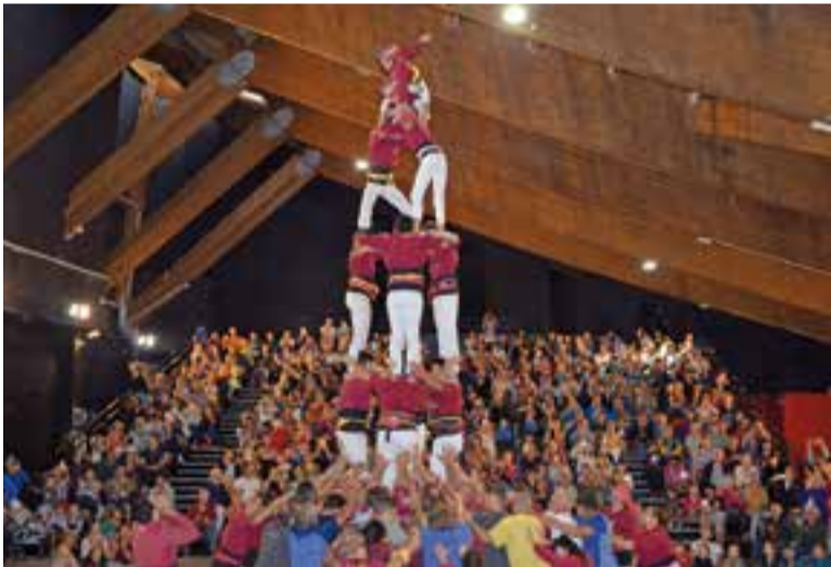
Exhibició castellera dels Castellers de Castellar als Angles.

Un any més, els Capgirats valoren molt positivament l'experiència, ja que dona a conèixer els castells a un públic que no sempre està acostumat a veure'n i porta el nom del poble de Castellar del Vallès més enllà de la frontera. +