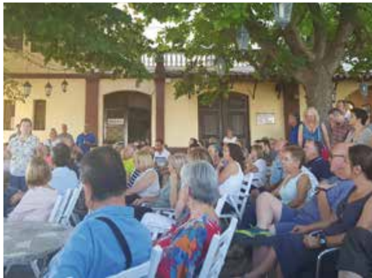
Reunió dels veïns contraris a la instal·lació de l'antena a la Penya Arlequinada.

Segons expliquen des de la Penya Arlequinada fa un parell de mesos la junta de l'Associació de veïns de Can Font – Can Avellaneda va acudir al club per demanar la possibilitat d'instal·lar una antena pels veïns, ja que l'empresa Cellnex s'havia posat en contacte amb l'associació de veïns i ells no disposaven de cap terreny on instal·lar-la. A la primera reunió que es va fer entre les tres parts (Associació, Penya i Cellnex), d'entrada la Penya va dir que no posarien cap antena. Però, malgrat la negativa inicial, des del club van decidir informar-se sobre els avantatges i els desavantatges de la instal·lació per poder traslladar-ho a la junta directiva i a l'assemblea de socis de la