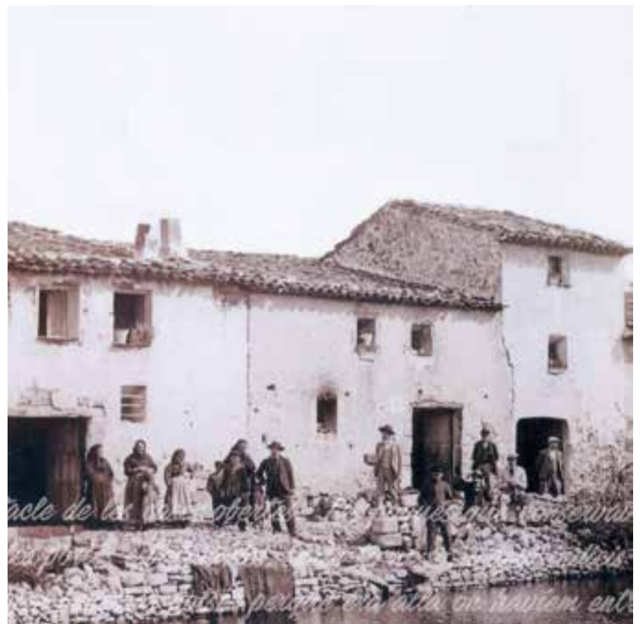
Una imatge de l'exposició que es podrà veure al Centre d'Estudis de Castellà.