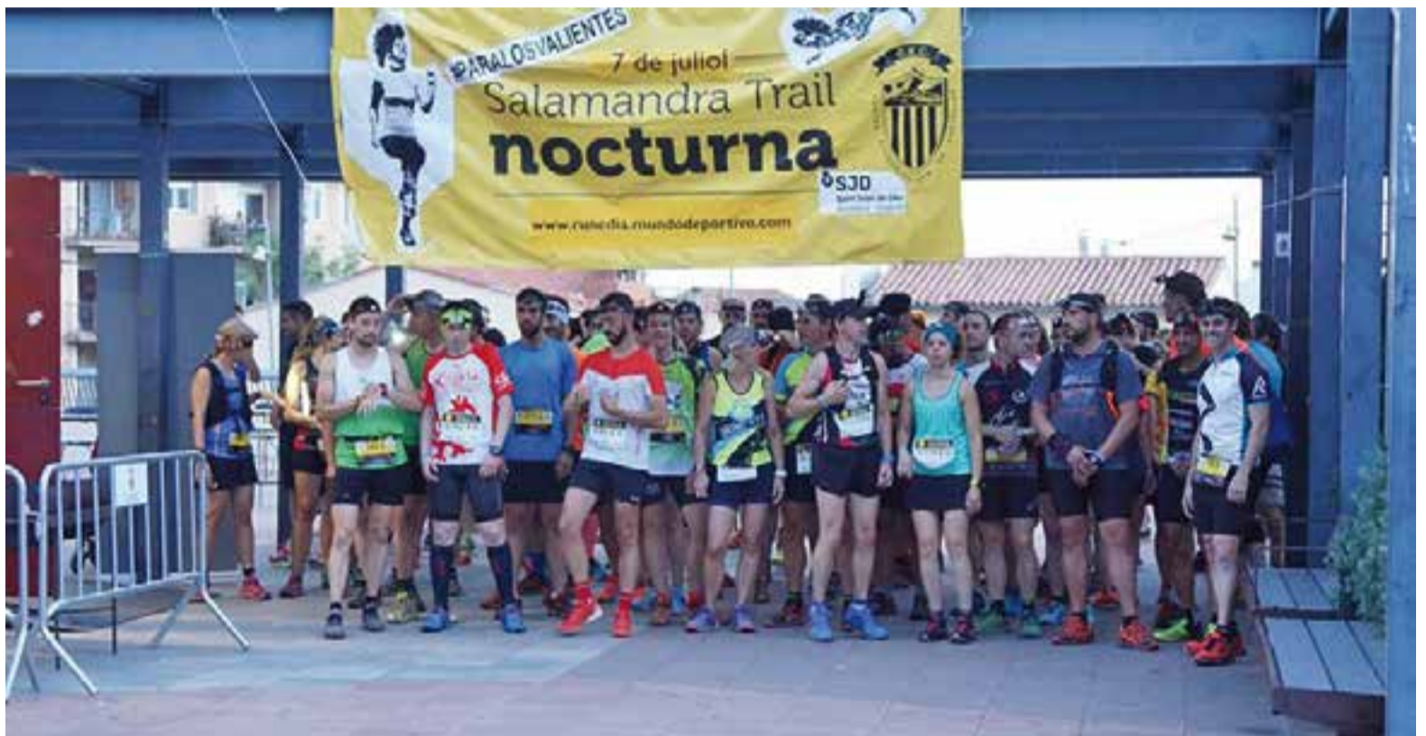
Els corredors de la quarta edició de la Salamandra Trail Nocturna, en el moment de la sortida.