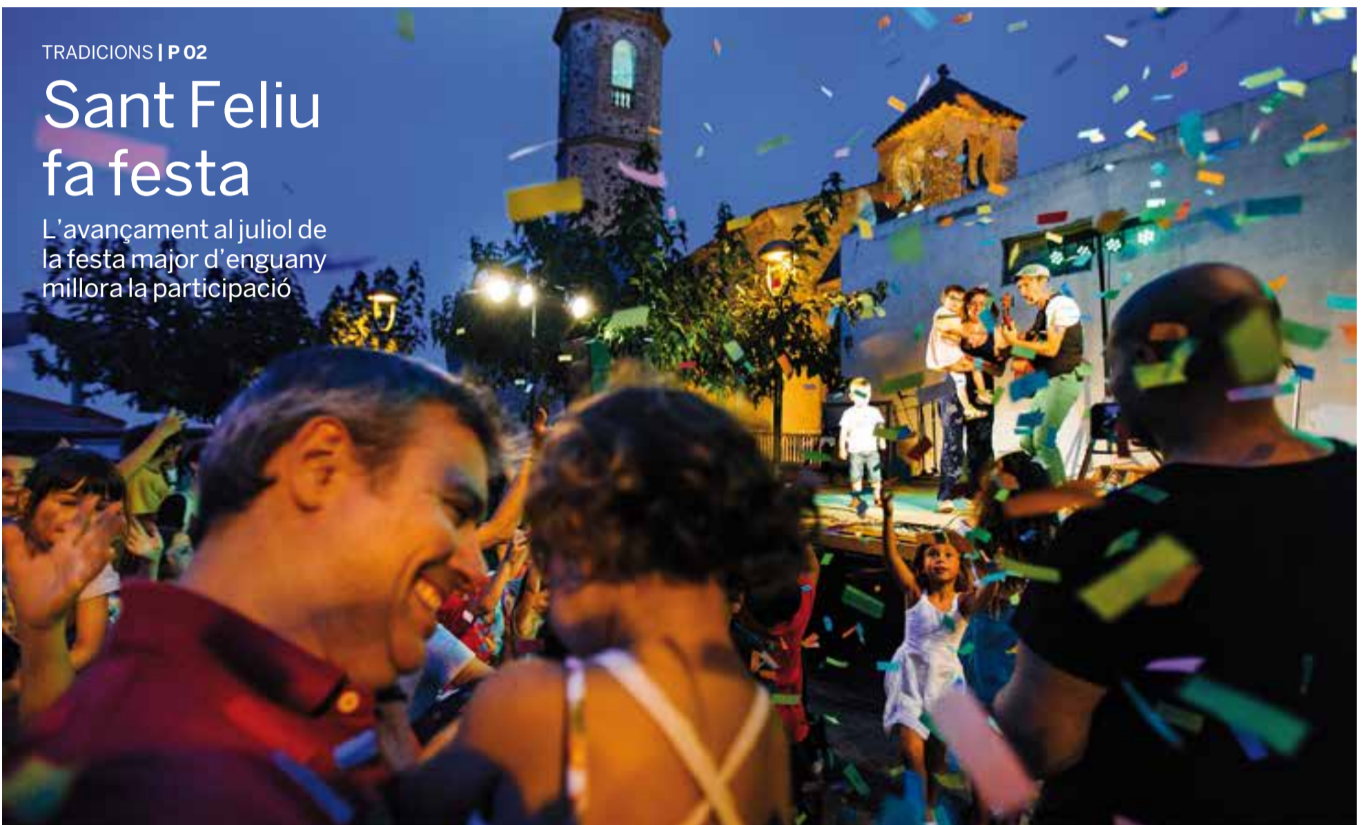
L'espectacle infantil Landry el Rumero va ser una de les activitats més atractives de la festa major de Sant Feliu, divendres passat.

L'avançament al juliol de la festa major d'enguany millora la participació