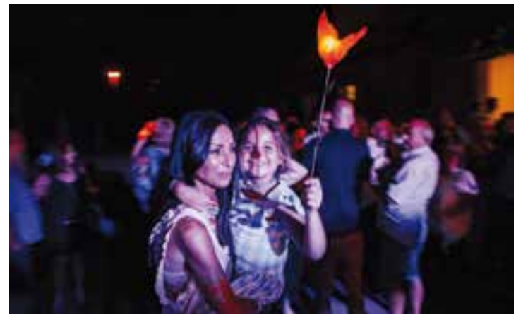
Ball del fanalet durant la Festa Major de Can Font i Ca n'Avellaneda 2017. || Q. P.

A les 14 h de la tarda, es farà el dinar de germanor, al bar de la Penya. A les 16 h es podrà gaudir d'un espectacle amb el Mag Pipo i, a les 17 h, de màgia amb el Mag Víctor. A les 19 h, les havaneres amb els Mariners d'Egara amenitzaran la vetllada, també amb rom cremat. A les 20 h s'ha previst el "chupinazo" de final de Festa Major. + || M. ANTÚNEZ