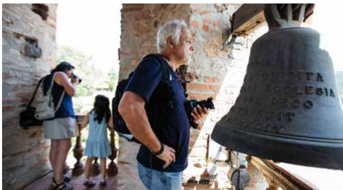
La pujada al campanar va ser una de les activitats que va oferir unes boniques vistes de Sant Feliu i de la comarca.

A la nit, els Diables de l'Esbart Teatral de Castellar es van encarregar de posar el colofó a la celebració, omplint d'espurnes els carrers i ballant al ritme del tradicional Correfocs de cloenda. D'aquesta manera, Sant Feliu es va acomiadar de la seva primera Festa Major celebrada al juliol. ✦