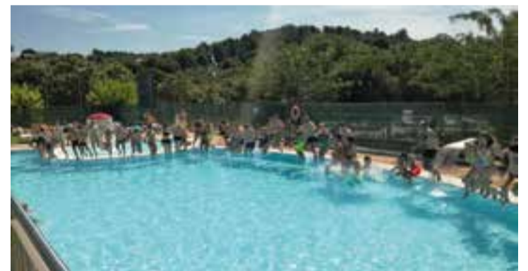
Moment del salt multitudinari del 'Mulla't' a la piscina descoberta.

En el conjunt de tot Catalunya, més de 110.000 persones es van sumar a la celebració del 25è aniversari del Mulla't per l'Esclerosi Múltiple. En total s'han recaptat 350.000 euros, que es destinaran a l'Esclerosi Múltiple infantil. El plat fort va tenir lloc a les 12.00 hores a la Plaça del Mar de Barcelona amb un concert del grup juvenil Macedònia, que va interpretar la cançó Mulla't que ha compostat especialment pels 25 anys de la campanya. +|| REDACCIÓ