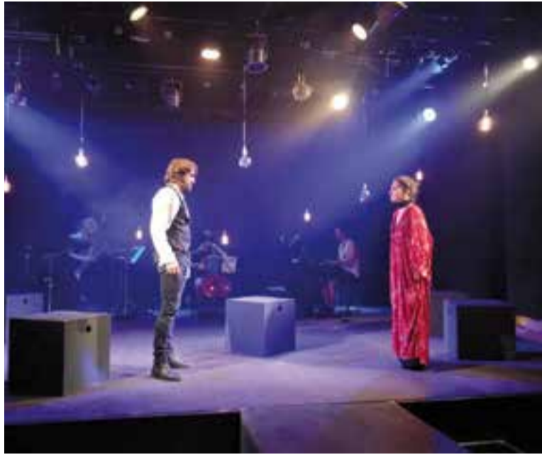
Hamlet, a l'esquerra, s'encara amb la seva mare Gertrudis.

Aquest passat cap de setmana, al teatre La Bàscula de Sabadell es va representar la coneguda tragèdia de Shakespeare 'Hamlet', en una versió de teatre musical creada per Escènics, una escola de teatre de Sabadell que ja ha vist estrenats diversos muntatges anteriors en els quals ha treballat.