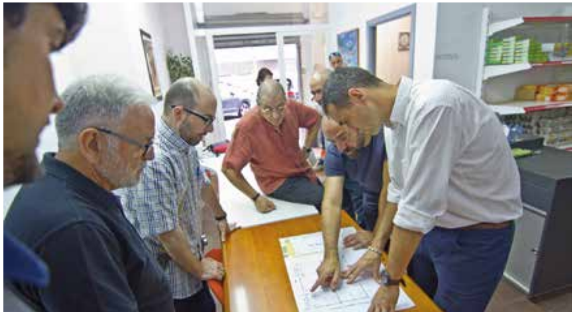
L'arquitecte tècnic de l'Ajuntament mostra els plànols de l'ampliació del local de Càritas Castellar - Via Solidària.

Cal recordar que Càritas Castellar - Via Solidària participa del projecte "Recooperem", una iniciativa d'aprofitament alimentari del sobrant dels menjadors escolars. A Castellar, els àpats emmagatzemats són traslladats a les dependències de Càritas Castellar per voluntaris de l'entitat, des d'on es distribueixen posteriorment a famílies amb necessitats socioeconòmiques. Respecte a això, mossèn Txema Cot, rector