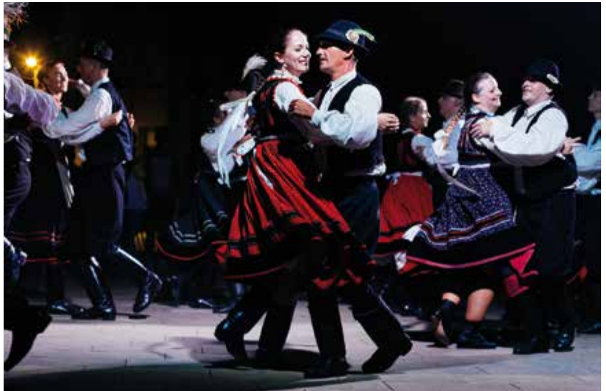
El grup Kéve de Ráckeve en plena actuació divendres passat a la plaça d'El Mirador .

"Txas!". Un dels balladors treia un flagell i el feia espetegar contra el ciment de la plaça del Mirador. Els espectadors, a uns metres, restaven sorpresos. "Hei, Hei, Hei!" , cantava un home, amb veu greu, des de dalt