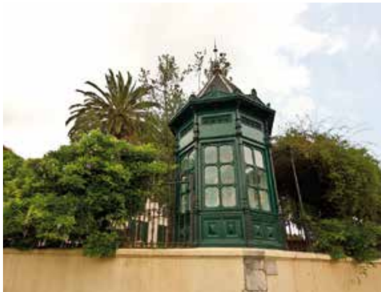
L'emblemàtica glorieta dels Jardins del Palau Tolrà, ja rehabilitada.

D'altra banda, també s'ha intervingut en la zona enjardinada, on gairebé no s'havia actuat des de la inauguració del Palau Tolrà com a seu consistorial, l'any 1994. S'han pavimentat els camins de