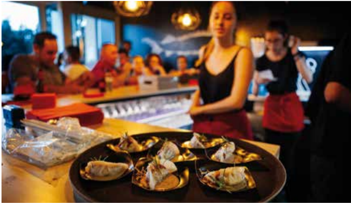
La tapa 'Gyoza' del Mito Sushi va ser la guanyadora de l'any passat.

Fins diumenge se celebra la cinquena edició de la ruta i concurs de tapes CorreTapa amb 15 establiments participants