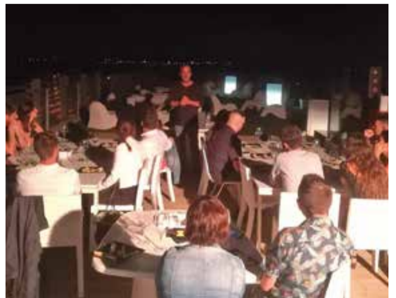
Primera nit de maridatge a la terrassa d'El Mirador divendres passat.

Per aquest divendres 13 de juliol hi ha una proposta de maridatge de cerveses i tapes fredes. Fernández ha seleccionat una gamma de sis cerveses Montseny que van des de les més suaus fins a la negra “que proposaré maridar-la amb xocolata” . L'activitat està limitada a persones de fins a 29 anys. En cas que no s'omplissin les places -pels dies 20 i 27- es donaria accés a persones d'entre 30 i 35 anys que estaran en una llista d'espera. +