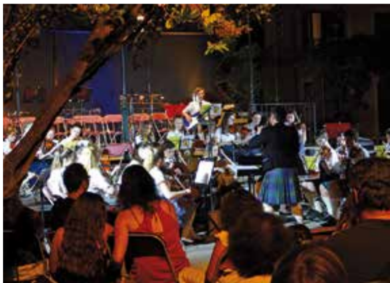
L'Ayrshire Fiddle Orchestra va actuar als Jardins del Palau Tolrà

l'entitat castellarenca: l'amor desinteressat per mantenir viva la cultura. Els Kéve de Ráckeve van fundar-se l'any 1983, vuit anys després que el Ball de Gitanes es constituís com a entitat en actiu de forma continuada. La porta de Castellar segueix oberta per rebre'ls l'any vinent, una altra vegada.