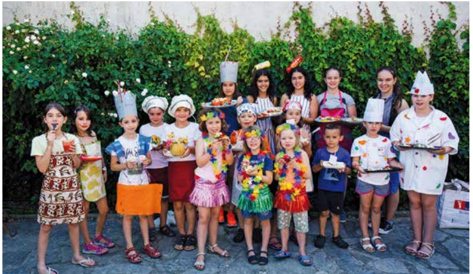
L'activitat dels petits cuiners va acollir receptes creatives i gustoses elaborades pels més menuts de la festa major.

La celebració de la Festa Major, un any més, va estar pensada perquè el poble s'hi bolqués. “Ens basem en activitats que són de cor, on la gent s'implica molt i no tenen un cost important”, comentava Dalmau, que feia molt bon balanç de la rebuda de les activitats infantils, “on la canalla gaudeix molt”, com el ka-