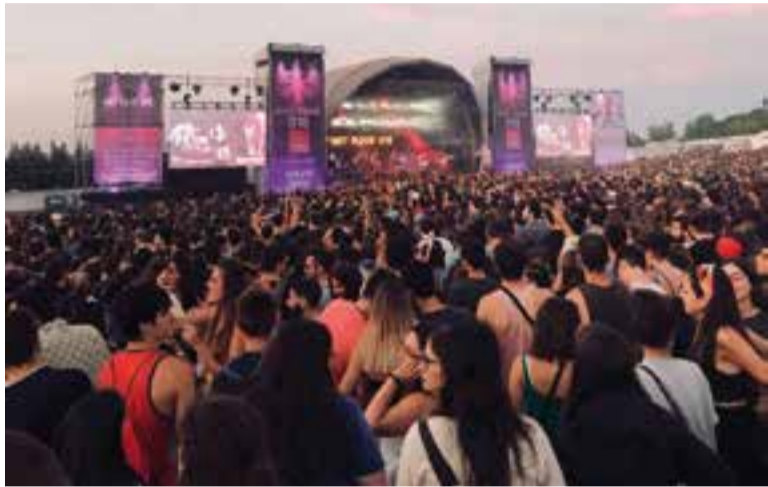
Els castellarencs van veure sortir el sol al Canet Rock. || U. GERMA

El Canet Rock és un dels festivals musicals preferits pels castellarencs