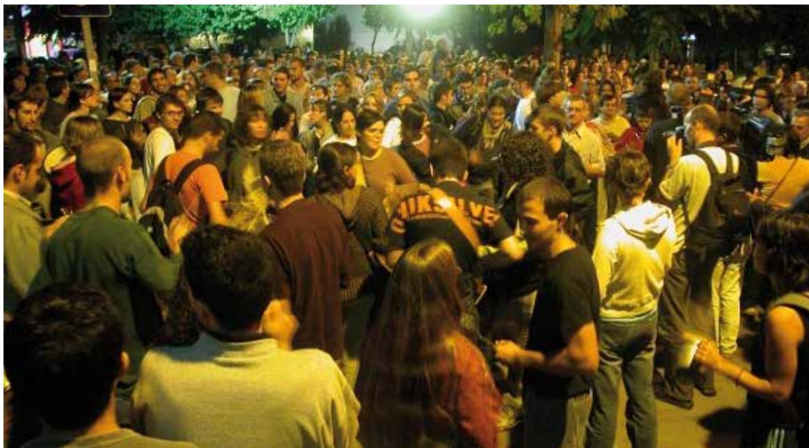
Multitudinària cassolada antifeixista el setembre de 2003 després dels greus incidents viscuts a la vila.