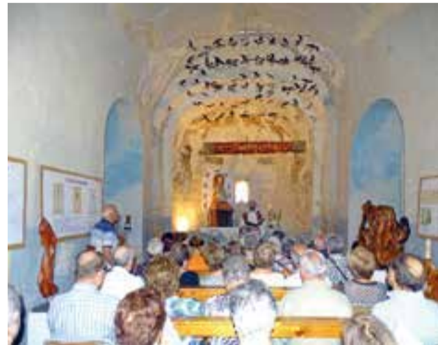
Missa a l'ermita de Sant Pere d'Ullastre, per Sant Pere. || J. LLINARES