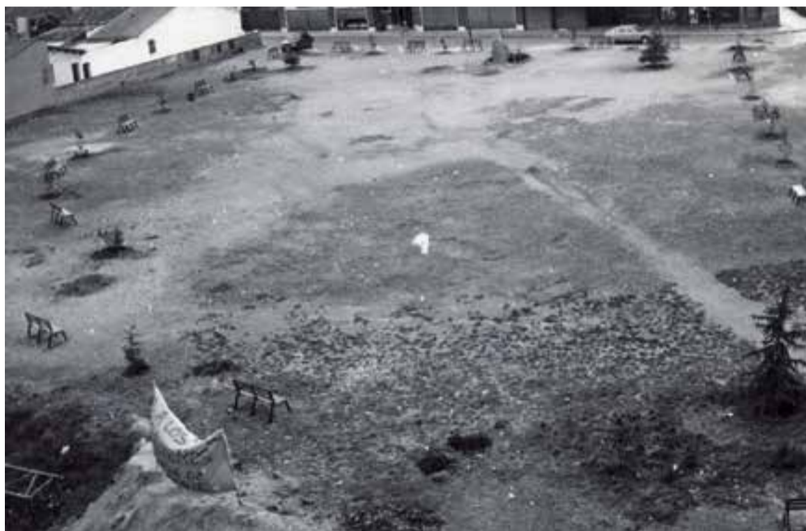
Imatge de la plaça Llibertat l'any 1979 que va viure diverses mobilitzacions populars.