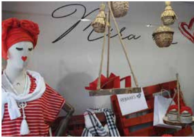
Aparador de rebaixes de la botiga Mira'm a la carretera de Sentmenat.