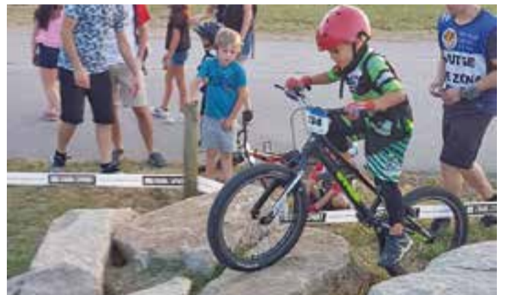
Un dels pilots de l'Escola de Trial 'ELBIXU' a la Copa Osona.