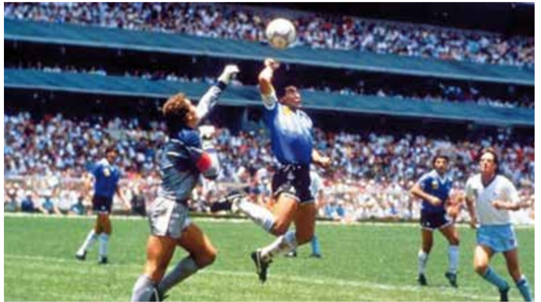
Diego Armando Maradona just en el moment anterior a anotar amb la mà el primer gol de l'Argentina a l'estadi Azteca.

En la mateixa línia que Calm, però en un punt més intermedi, trobem a Nakor Bueno, exdavanter castellanenc del FC Barcelona B, Lleida i Castelló entre d'altres: "El veig interessant quan es fa servir per a jugades deter-