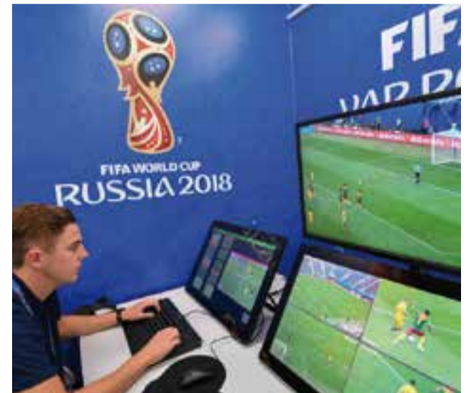
Una sala de videoconferència del video auditor (VAR) al centre de comunicacions del Mundial de Rússia a Moscú durant un partit.

Hi ha tot tipus d'opinions per a un sistema que donarà molt a parlar durant els pròxims anys, on s'haurà de veure si evita noves mans de déu. +