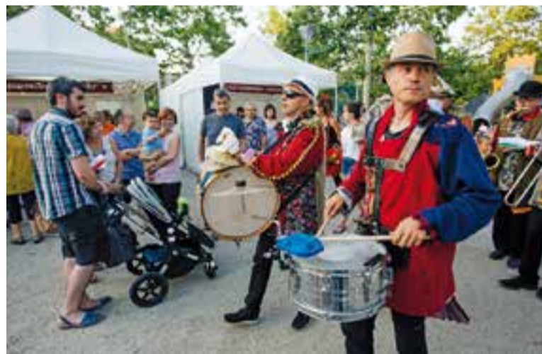
La Zampone Brass Band va ser l'encarregada d'obrir la festa.

La música i les ballarugues s'apoderen de la festa. I ja ningú té present la bruixeria. Al cel, però, s'intueix, esplèndida, una forma circular enlluernadora. És nit de lluna plena. +