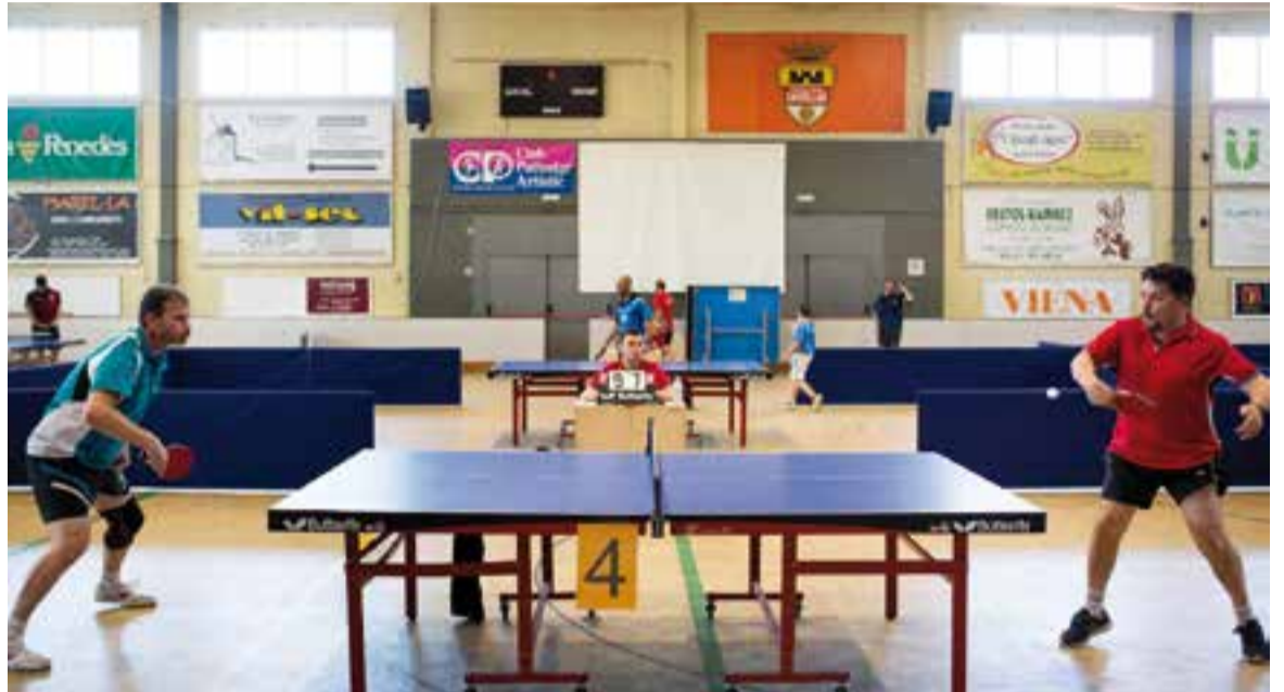
Dos jugadors al IX Memorial Carles Simón Ventura de l'ATT Castellar, al pavelló Joaquim Blume.

Una novetat important d'aquest any, és que per primer cop el Castellar va inscriure un equip a la lliga de veterans. Aquesta lliga es juga els di-