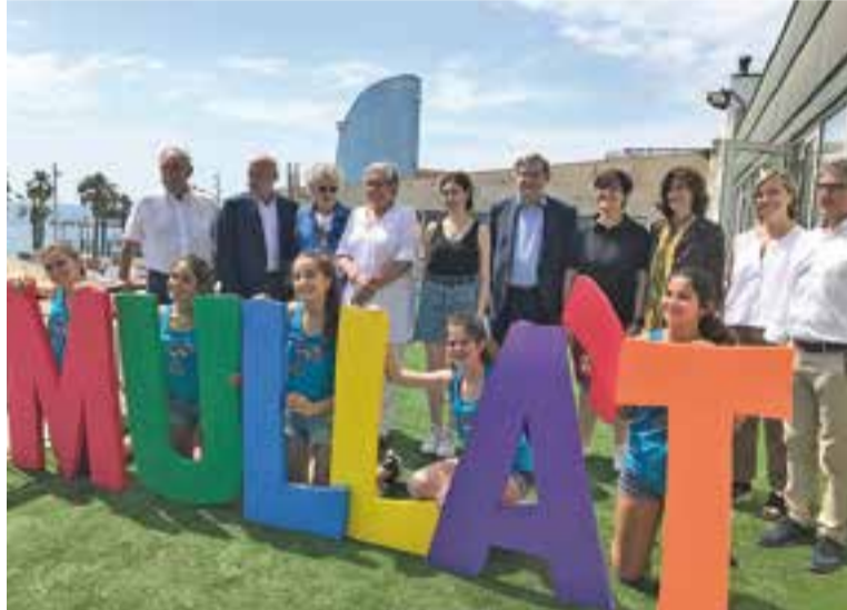
Macedònia s'ha sumat als 25 anys del Mulla't gravant un videoclip. || FEM

El Mulla't per l'Esclerosi Múltiple es va celebrar per primer cop el 17 de setembre de 1994 a 67 piscines de Catalunya. D'aquestes, 27 han celebrat el Mulla't cada any de forma ininterrompuda. En aquests 25 anys, l'esdeveniment impulsat per la Fundació Esclerosi Múltiple, s'ha anat consolidant fins a celebrar-se a