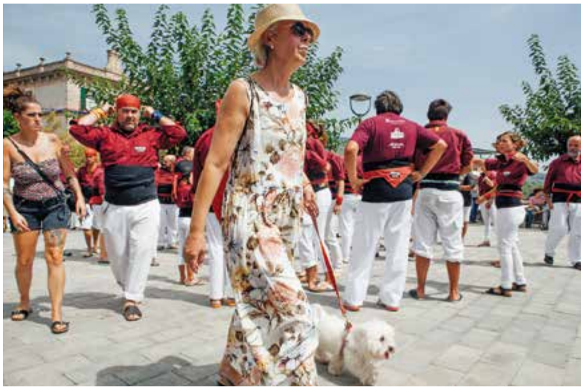
L'actuació dels castellers de Castellar serà diumenge a les 12 h. a la plaça Doctor Puig.

La celebració canvia de dates i es farà aquest cap de setmana amb moltes propostes per a totes les edats