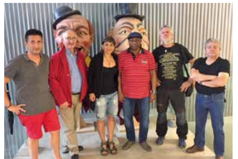
Els membres del grup motor de Castellar de Catalunya en Comú

Finalment Castellar en Comú també vol remarcar que el projecte "combina la lluita social amb els moviments socials, així com la necessitat de fer treball institucional" . +