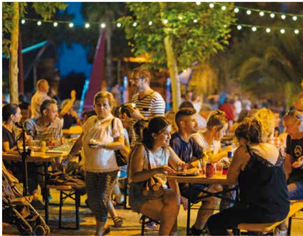
La plaça Catalunya es va omplir de gom a gom durant el cap de setmana per gaudir d'espectacles i gastronomia. || Q. PASCUAL

Per guarir-se de malsons, una pedra d'ametista a sota del coixí. Per inhibir el mal d'ull, una turmalina a la butxaca. El quars blanc, per ga-