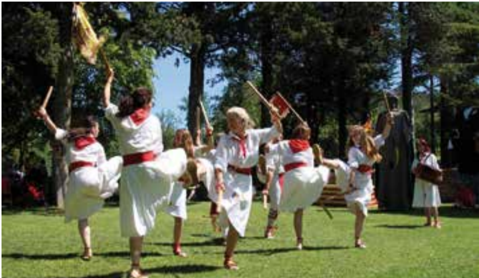
El Ball de Bastons de Castellar va actuar al Castell de Montesquiu, a Sant Quirze de Besora.