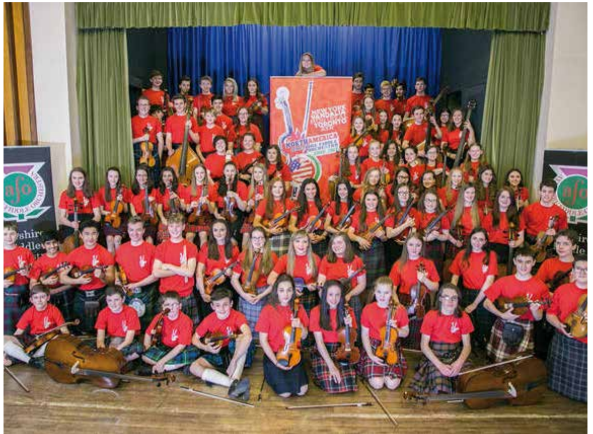
Ayrshire Fiddle Orchestra d'Escòcia actuen aquest divendres als Jardins del Palau Tolrà.

L'Ayrshire Fiddle Orchestra no només tocarà a Castellar aquest divendres sinó que també ho va fer dimecres al Teatre Auditori de Sant Cugat “i dissabte toquen a la cripta de la Sagrada Família” . + || MARINA ANTÚNEZ