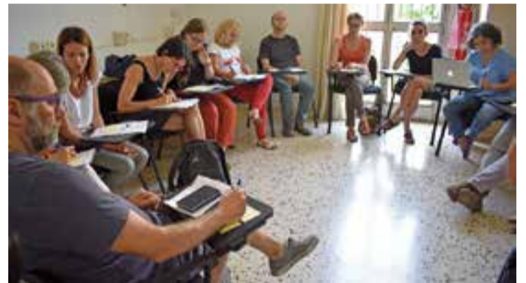
Jornada de treball celebrada el 28 de juny a Vilanova i la Geltrú. || CEDIDA

Castellar del Vallès va participar el 28 de juny passat en una jornada de treball de la Xarxa de Municipis per l'Economia Social i Solidària (XMESS) que es va celebrar a Vilanova i la Geltrú amb l'objectiu principal de seguir compartint aprenentatges des del municipalisme per poder promoure i facilitar l'Economia Social i Solidària (ESS) al territori. Castellar del Vallès es va integrar a la Xarxa de Municipis per l'Economia Social i Solidària el maig de 2017, quan s'hi van adherir formalment 31 ajuntaments. Actualment són 36 els consistoris que en formen part. L'objectiu fundacional de la XMESS és promoure, reforçar i consolidar l'economia social i solidària, fixar objectius i estratègies comunes i fomentar la cooperació i l'acció conjunta dels diferents municipis a l'hora d'impulsar polítiques públiques. Estracta, doncs, d'intensificar una estratègia territorial compartida, per fer de l'Economia Cooperativa, Social, Solidària (ESS) un dels instruments de superació de les desigualtats socials, de generació d'ocupació de qualitat i, en definitiva, d'impuls d'un nou model socioeconòmic més democràtic, just i sostenible. + || REDACCIÓ