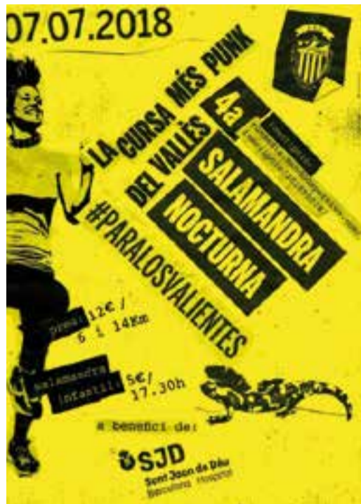
Cartell de la 4a edició de la Salamandra Nocturna. || CEC

El preu de la inscripció és de 12 € per les categories grans i de 5 per la kids. Els beneficis de la cursa organitzada pel CEC aniran destinats a la construcció del Pediatric Cancer Center Barcelona portat a terme per l'Hospital Sant Joan de Déu de Barcelona, pel que l'organització ha adoptat el hastag #paralosvalientes, centrat a la campanya del centre mèdic de la ciutat Comtal. Les inscripcions poden fer-se a https://runedia.mundodeportivo.com/ + || A. SAN ANDRÉS