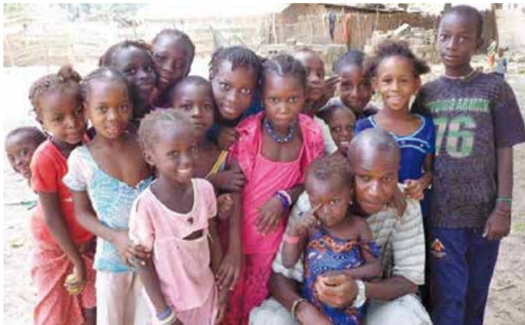
Nens i nens de l'orfenat La Joie des Orphelins, al Senegal, on l'entitat Cantem Àfrica coopera.

"La proposta parteix de la selecció de deu cançons tradicionals africanes", segueix Mas, "cinc del Senegal i cinc més de Moçambic", en concret d'origen mandinga, wòlof, xangana i ronga. Són cançons que parlen de temes universals, "de coses properes, de temes humans", dels infants, les mares que treballen al camp, rituals de diverses comunitats, del coratge, de la valentia, de l'esforç i, fins i tot, de la mort. Per lligar aquesta selecció de melodies i fer-les atractives per als infants, "vaig demanar a Josep Lluís Badal, amb qui m'uneix una bona amistat, un conte que