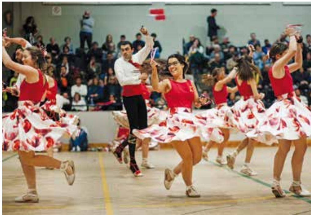
La colla dels Solters va oferir moments d'un dinamisme espectacular.

La Colla dels Infants, de 9 a 13 anys, va interpretar les tradicionals