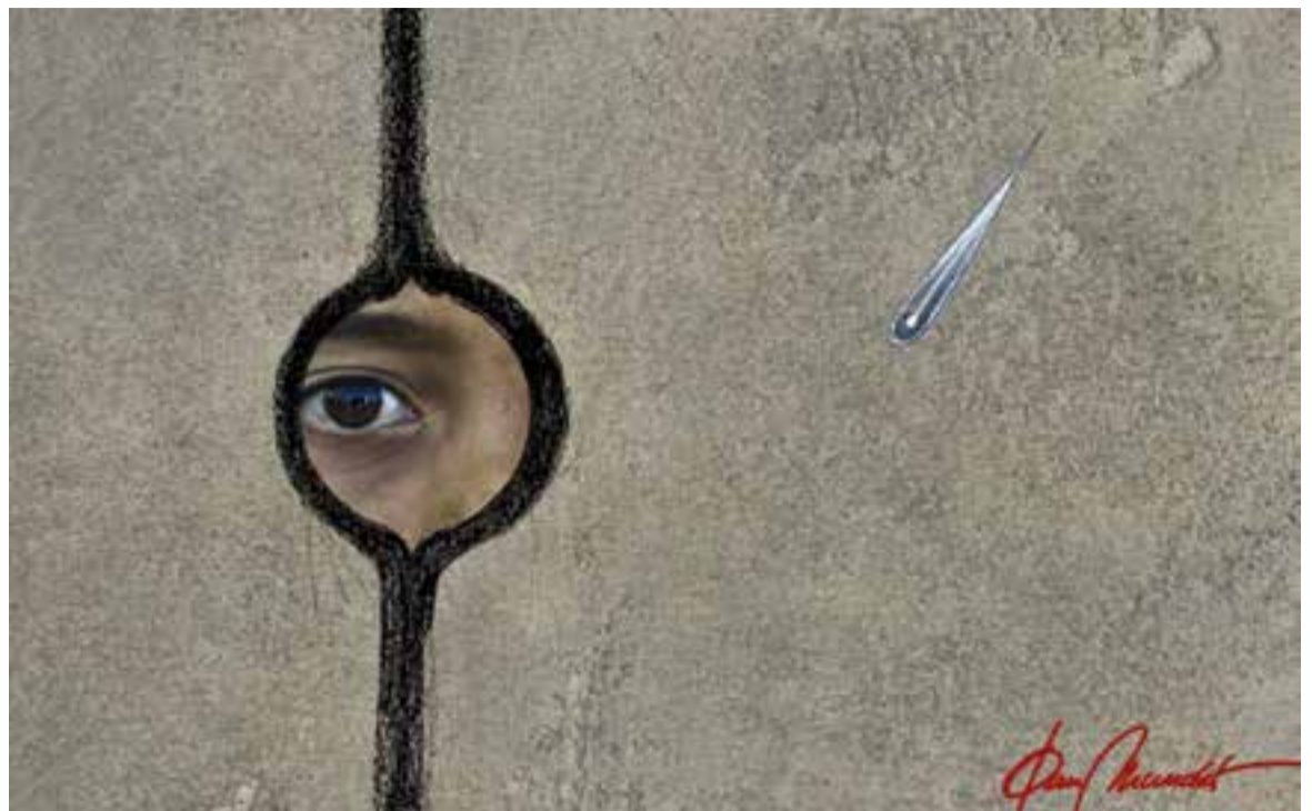
© La gota contra la paret. || JOAN MUNDET

que sigui persona, ajudar aquesta gent. Quan els rescatem, ens sentim molt contents, feliços d'haver donat un cop de mà. Desgraciadament, a vegades no és possible i hem de presenciar coses terribles: morts, nens... En aquestes ocasions, he de fer el que més odio del món: la inspecció dels cadàvers. N'he fet moltes. Potser massa. Molt dels meus amics i col·legues em diuen: "Has vist tants cadàvers que ja hi deus estar avesat". No és veritat. Com es pot acostumar algú a veure nens morts o dones embarassades? Doncs que han donat a llum durant el naufragi i estan encara amb el cordó umbilical". I, tanmateix, totes aquestes persones que, després de múltiples penúries, arriben a les costes europees són confinades en camps, dormint sovint en precàries tendes de campanya, entre el fang, passant fred, enmig d'un malson de misèria i insalubritat. Però, com comenten els voluntaris que han viscut aquesta realitat a peu dels camps, hi ha al-