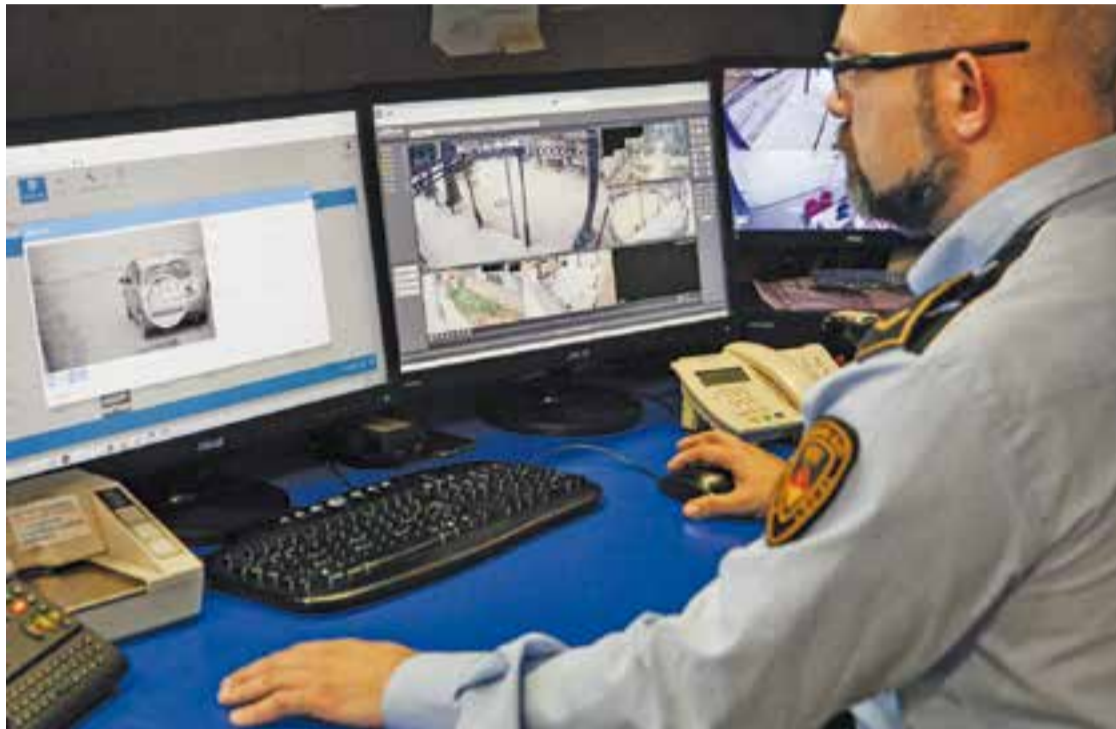
Des de la prefectura de Cal Botafoc la Policia Local controla les càmeres instal·lades en el municipi.

El sistema de videovigilància de Sant Feliu del Racó i les urbanitzacions advertirà automàticament