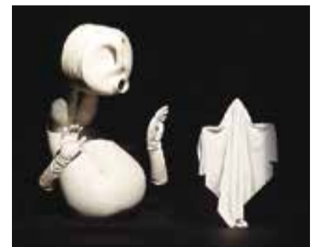
Moment de l'espectacle 'Faboo, l'encant de la imaginació'. || CEDIDA

Al principi, els nens i nenes que veuen aparèixer Faboo resten en silenci, intentant entendre o desxifrar què és el que tenen a l'escenari. Un dels infants crida: - No fas por!. I a escena ja no hi ha cap actriu ajaguda, des d'aquell moment hi ha un personatge estrafolari, un bebè, un adolescent, una mare amb un fill. El fil de vida que creix en la justa mesura a l'Auditori, sense arribar a cansar ni avorir; i conveng, sobretot per ser un espectacle diferent del que tradicionalment s'associa al familiar. + || MARINA ANTÚNEZ