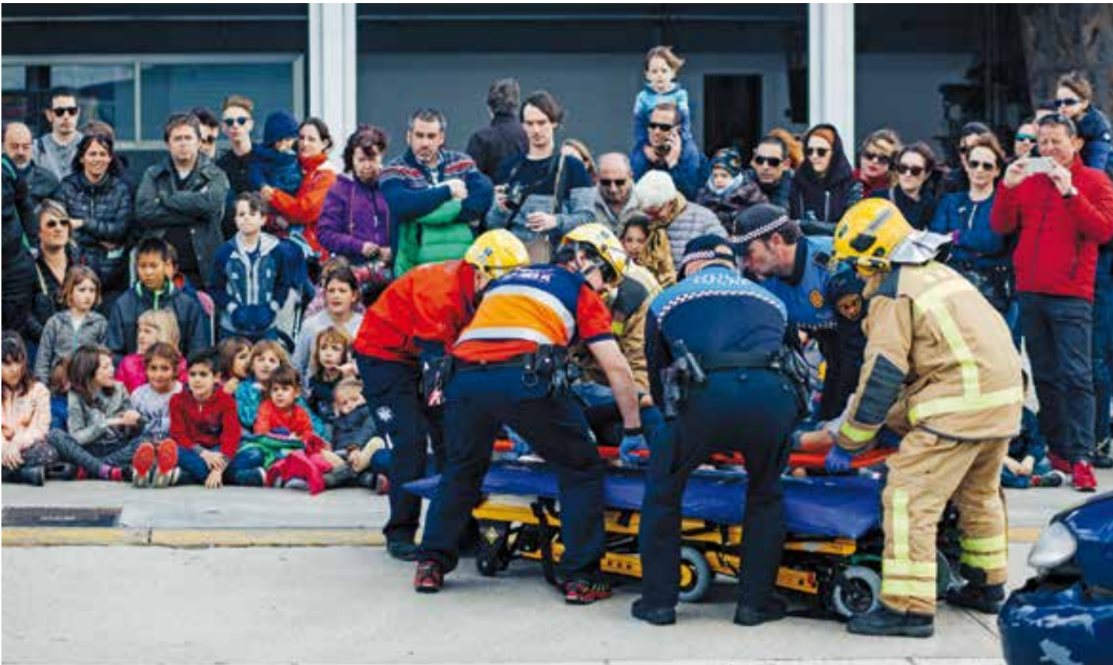
Durant la celebració de la festa dels bombers, es va organitzar un simulacre de rescat.