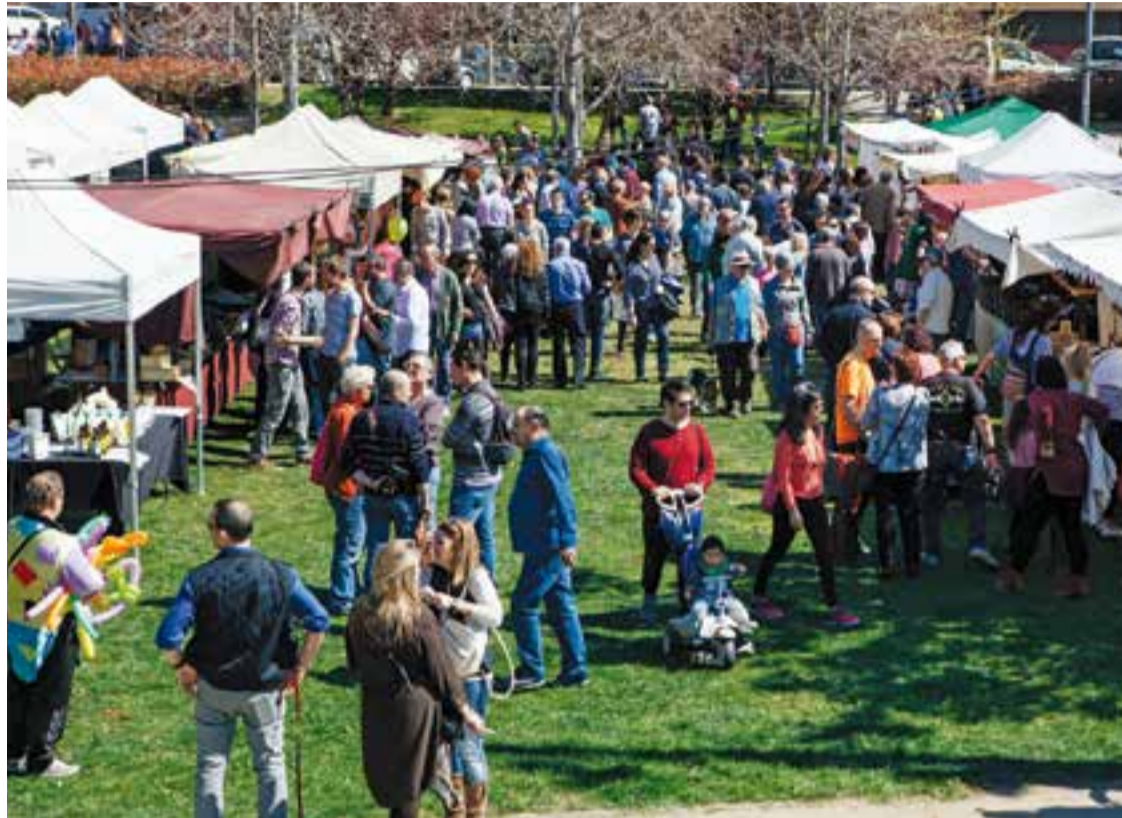
La fira d'artesans de Sant Josep s'ubicarà enguany a la plaça d'El Mirador. A la imatge, l'edició de l'any passat.

A la fira de Sant Josep també es podran tastar productes vinguts de fora del territori català. Concretament, hi haurà dues parada dedicades a les Illes Balears, Gadea Ar-