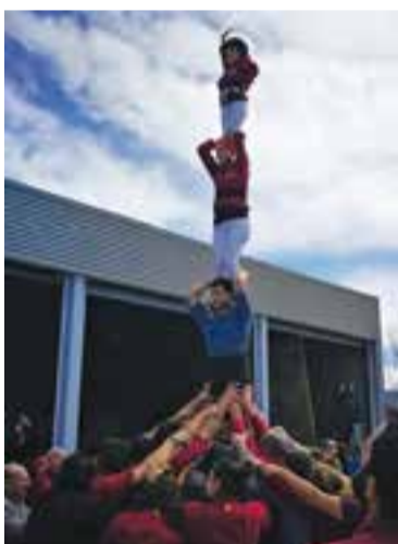
Els Capgirats, al Parc de bombers. || C.

ra. Aquest cop, uns 90 castellers i les seves famílies van reunir-se per gaudir d'una botifarrada, amb bona companyia i un dia molt assolellat. Part de la colla castellera va passar, una estona abans, a visitar els bombers de la vila, que van celebrar la festa del Patró. Allà mateix al parc van oferir una petita exhibició castellera, "un pilar compartit amb un membre del cos de bombers com a segon". També van realitzar un taller casteller per a tothom. Aquest proper diumenge, a les 12 h, els castellers actuen amb els Minyons de Terrassa i Castellers de l'Hospitalet al barri de Can Palet de Terrassa. + || M. A.