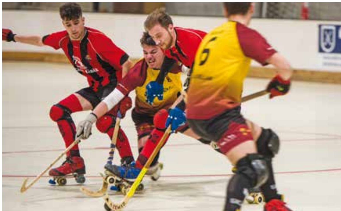
Armand Plans lluita una pilota amb la defensa del Reus Deportiu al Dani Pedrosa.

El partit es començava a igualar i a 8:35 pel final de la primera, els granes cometien un penal aprofitat per retallar distàncies. Al cap de tres minuts, Xavi Vernet veia la targeta blava