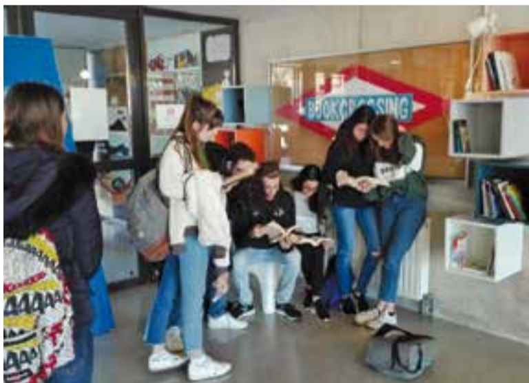
Alumnes de l'INS Puig de la Creu utilitzant el servei de 'Bookcrossing'. || CEDIDA

A l'espai, també hi ha un suro, "que serveix alhora per donar notícia de novetats editorials, proposar frases que promocionin la lectura i per fer-se ressò d'activitats relacionades amb el llibre". + || M. ANTÚNEZ