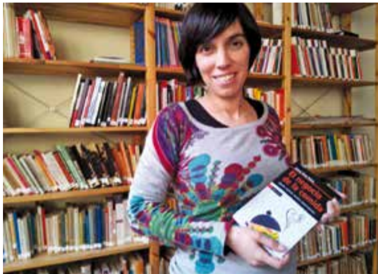
La investigadora ha publicat diversos llibres com 'El negocio de la comida'.

La investigadora, que ha publicat diversos llibres sobre l'alimentació i el negoci de la indústria alimentària, és optimista i creu que l'administració s'ha de sumar a una demanda creixent