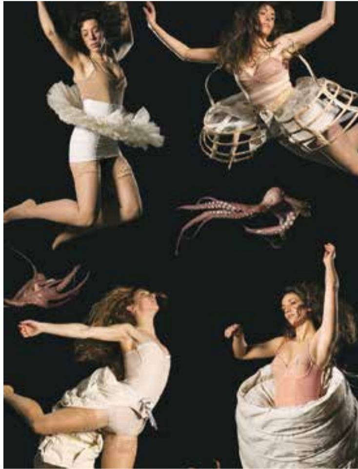
Muntatge per ‘Barbes de balena’ d’Els Pirates Teatre.