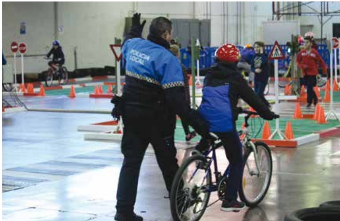
Sessió pràctica del curs d'educació viària a l'Espai Tolrà, dimecres de la setmana passada.

Durant les classes, els agents de la Policia Local també han explicat als alumnes quins són els senyals de trànsit bàsics i quines són les normes principals que els infants han de seguir com a conductors de bicicletes