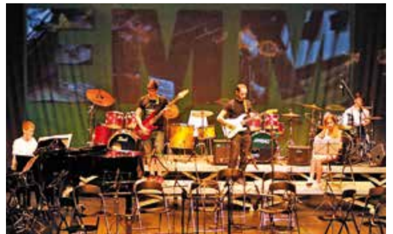
Músics de l’Escola Municipal de Música Torre Balada. || ARXIU

D’altra banda, el 21 i 22 de març, l’alumnat oferirà audicions a l’Auditori i l’11 i el 25 d’abril tocaran combos i grups de saxo a Cal Calissó. † || M. A.