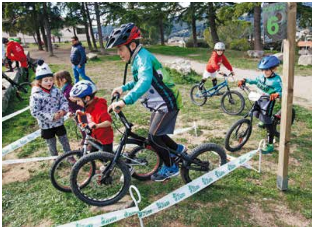
Els participants a la segona prova de l'Open ELBIXU en una de les zones del traçat.

participants van poder gaudir d'un bon temps, tot i que les baixes temperatures de primera hora van deixar glaçat a més d'un pilot.