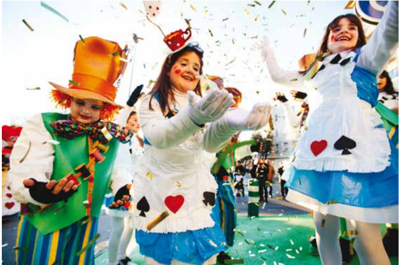
L'escola Joan Blanquer es va inspirar en la pel·lícula d'Alicia al país de les meravelles de Tim Burton. || Q. PASCUAL

El Joan Blanquer, a continuació, també feia submergir la vila en el món de fantasia de Disney, en aquest amb