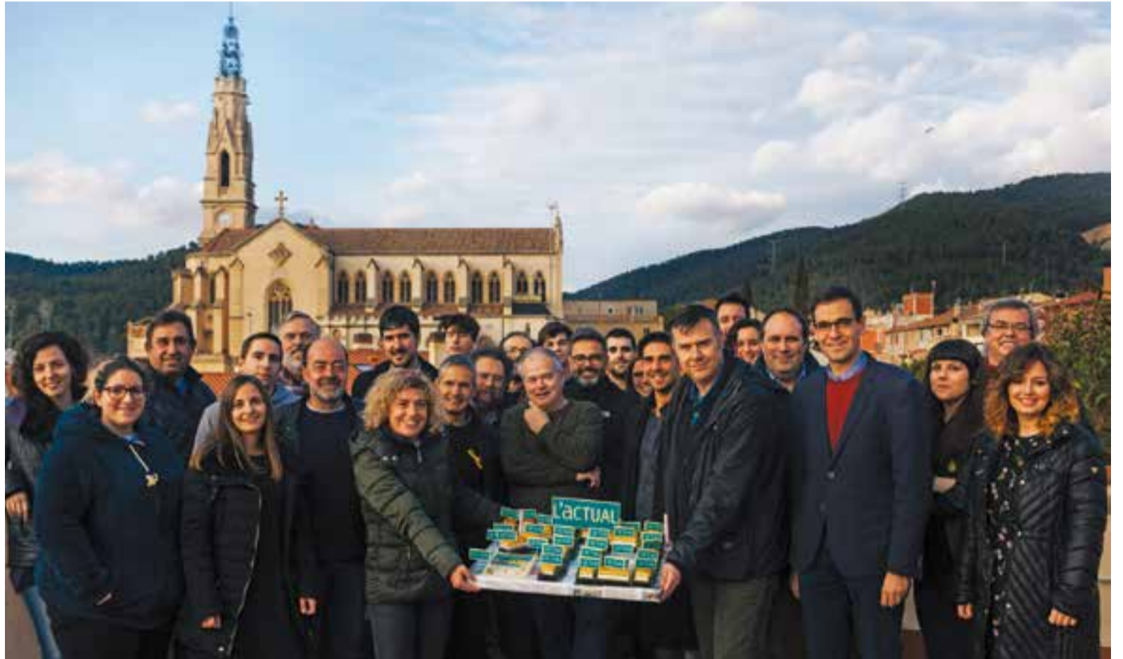
Dimecres passat es va fer una trobada a la seu de Ràdio Castellar i L'ACTUAL amb empleats, col·laboradors i membres del Consell de Comunicació d'aquests 10 anys.

Aquesta setmana, treballadors, col·laboradors i membres del Consell de Comunicació d'aquests deu anys van fer una trobada a la redacció de L'ACTUAL i Ràdio Castellar per bufar 10 espelmes d'un projecte comunicatiu que a finals d'aquest any arribarà a l'edició número 500, un número rodó que servirà per organitzar diversos actes i exposicions i per elaborar un suplement especial commemoratiu. ✦