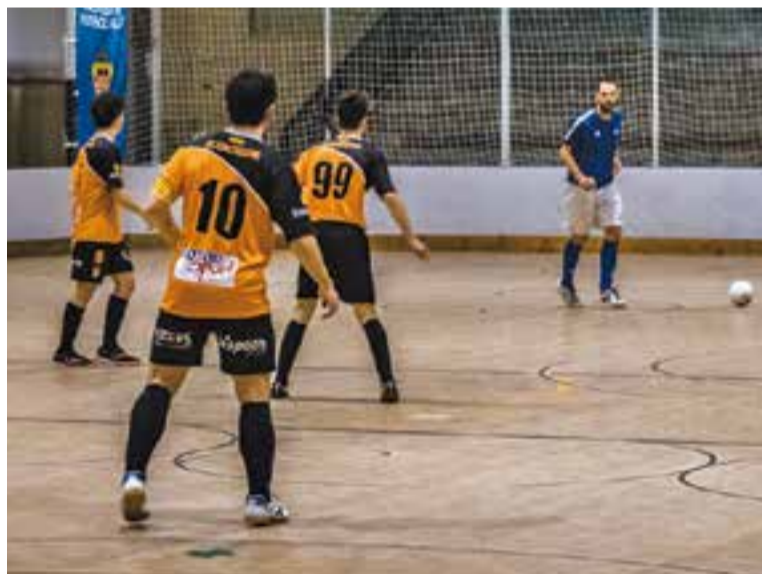
Imatge d'arxiu d'un partit al Joaquim Blume.

Enfront del Lliçà, el començament no era del tot dolent, arribant al descans amb un desfavorable 2-3 que no deixava res tancat. A la segona, de nou la debacle, amb un equip que troba a faltar en excés els tres jugadors clau de les passades tempo-