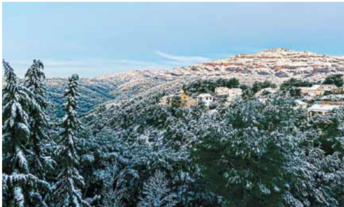
Dues estampes que va deixar la nevada entre dilluns i dimarts a Castellar del Vallès a les urbanitzacions d'El Racó i el Balcó.

Les afectacions més importants a causa de la nevada es van concentrar en alguns carrers d'El Balcó i d'El Racó, on va ser necessari circular amb cadenes en els carrers més costeruts, com al de les Jeies. A més, la línia d'autobús C4, que con-