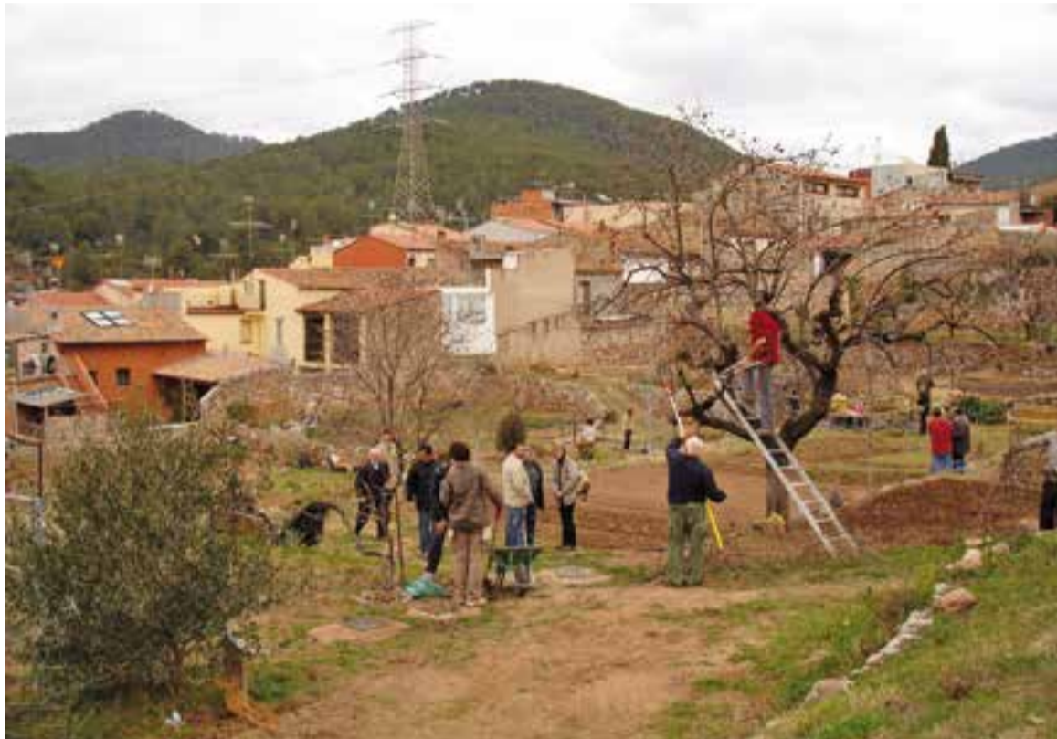
Foto del 17 de febrer de 2008 de la inauguració de les parcel·les dels horts de Cal Botafoc.

Els horts de Cal Botafoc des d'un principi era un espai públic dedicat a la jardineria mediterrània i a l'agricultura ecològica amb finalitats d'oci i divulgatives pels centres educatius del municipi. L'hortolana Lolita López va fer durant cinc anys de guia als centres escolars que visitaven la zona amb alumnes de 2 a 6 anys. Les visites "començaven a mitjan març