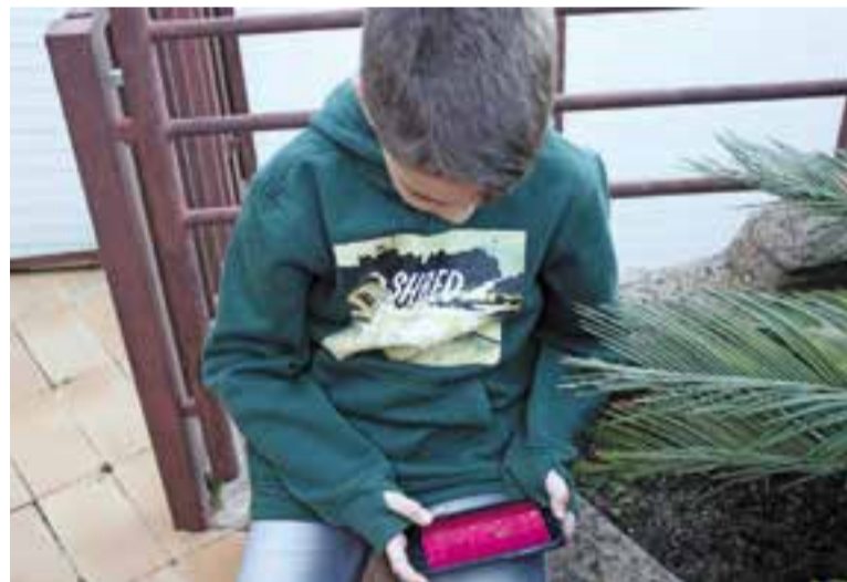
Un infant juga amb un telèfon mòbil.

que passen molt temps i viuen sense control en les xarxes socials tenen més problemes de frustració, enveja i tristesa. Quan algú puja una foto a Instagram, sobretot en el món adolescent, estarà pendent dels “likes” i de si li arriben o no. Aquesta incertesa genera nerviosisme, excitació i por a la vegada, un bon còctel que invita a repetir, encara que el resultat no sigui l'esperat.