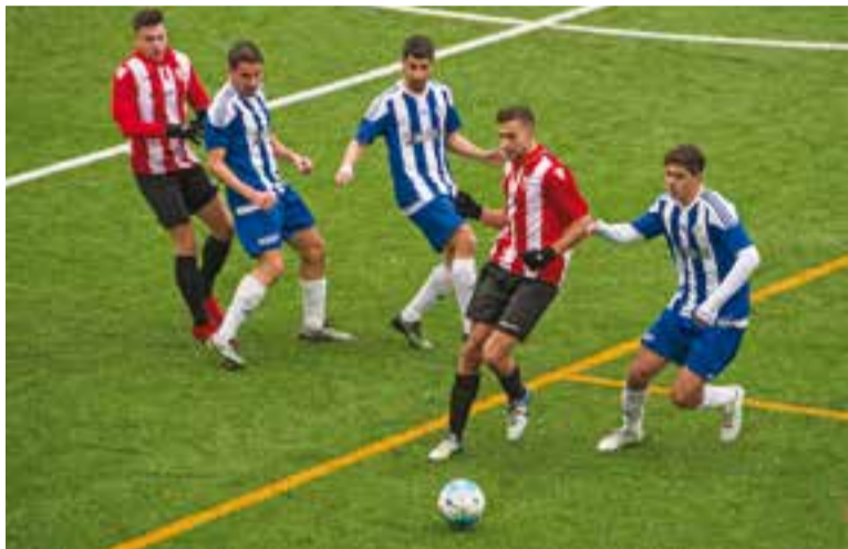
Una jugada del partit de diumenge al Pepín Valls.

Tres errors defensius a la primera part deixen als locals sense opcions