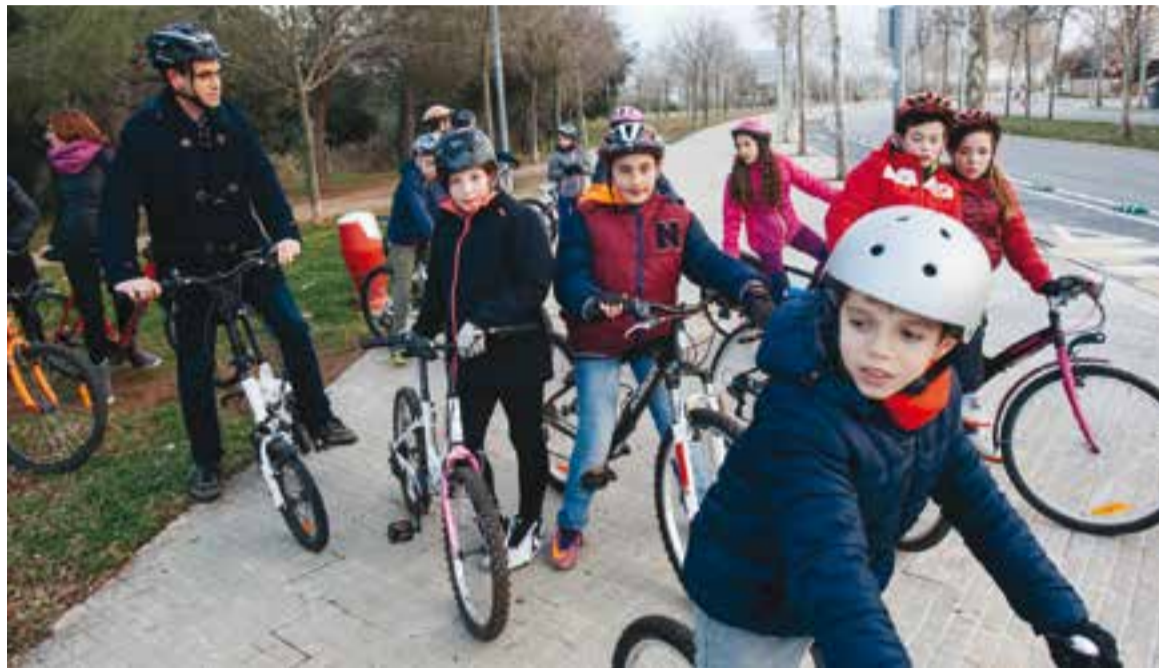
Els membres del Consell d'Infants i l'alcalde van estrenar dijous passat el carril bici de Castellà

Una altra de les mesures que s'han dut a terme ha estat la senyalització del carril amb pilones al seu inici i final o en punts més conflictius. Al llarg de la calçada també s'han