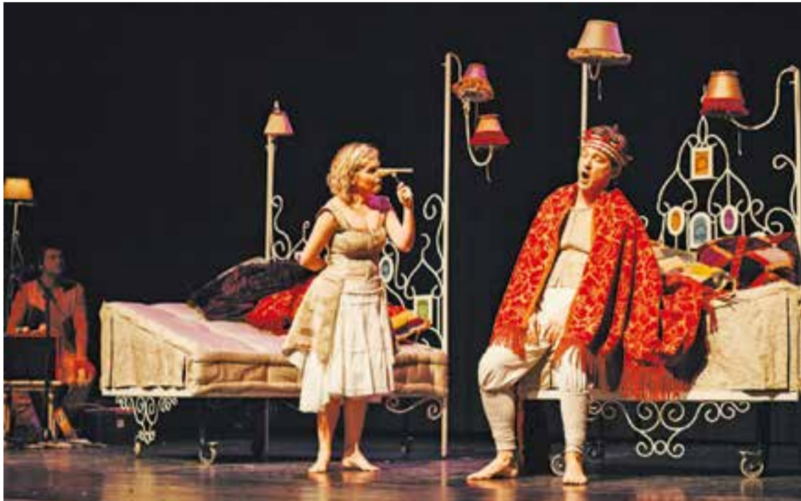
Moment de l'espectacle 'L'endrapasomnis' de Teatre al detall amb La Tresca i la Verdesca