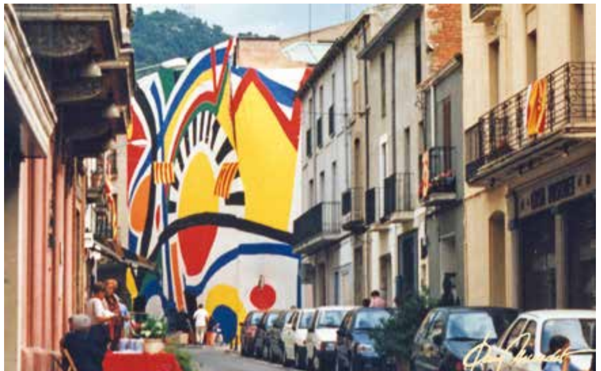
© Acció carrer Major 1998 Joan Mundet ETC. || JOAN MUNDET

Continuant per l'altra banda del carrer,