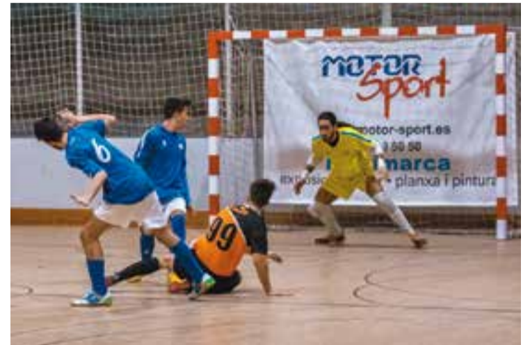
Imatge d'un partit del FS Castellar d'aquesta temporada.

Tot i que encara queda algun temps per la Setmana Santa, el FS Farmàcia Yangüela Castellar segueix vivint el seu particular Via Crucis en lliga i va tornar a caure derrotat enfront del Lloret - Costa Brava per 9 a 2, complicant-se en extrem la salvació.