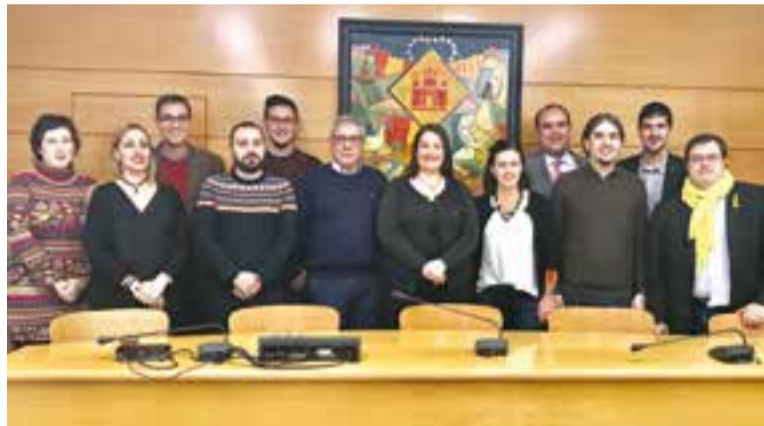
La reunió es va produir divendres passat a l'Ajuntament de Barberà.

Durant la trobada, els ajuntaments van compartir la preocupació per la situació del servei d'Urgències de l'Hospital Parc Taulí i van posar en comú les diferents realitats que viu cada municipi, on destaquen la no cobertura de baixes del personal sanitari o deficiències en el servei de pediatria, i sobretot, la situació actual de les urgències a l'atenció primària. "Hi ha un pla de xoc en funcio-