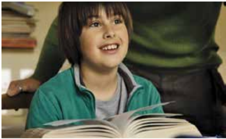
'L' hora dels deures'.