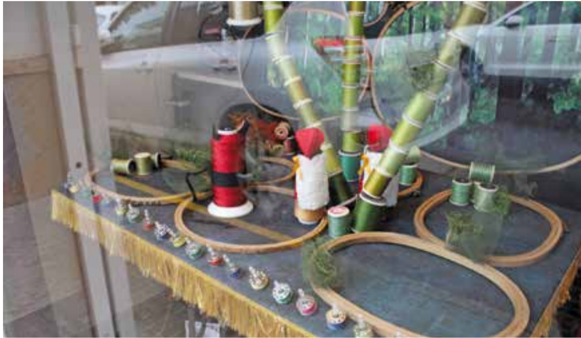
Un detall de l'aparador de Brodats Mariona amb els pastorets Lluquet i Rovelló i Satanàs.

Brodats Mariona ha resultat premiat enguany per sisè any consecutiu; l'any passat va assolir el primer premi local i el de tota la demarcació de la Cambra de Comerç de Sabadell, el 2015 va assolir el tercer premi local, el 2014 va guanyar la primera posició local i la segona de la demarcació, i els anys 2013 i 2012 va quedar, respectivament, en tercera i segona posició locals.