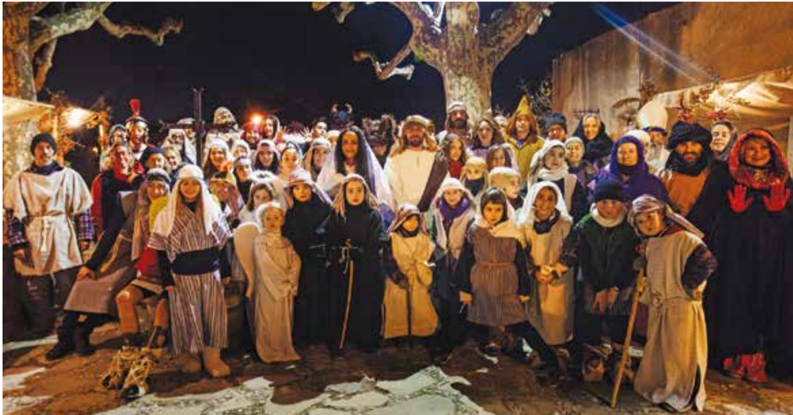
Foto de família dels participants del Pessebre Vivent 2017 a Sant Feliu del Racó.

Les novetats figuratives i musicals del gran escenari pessebrista conquereixen el públic