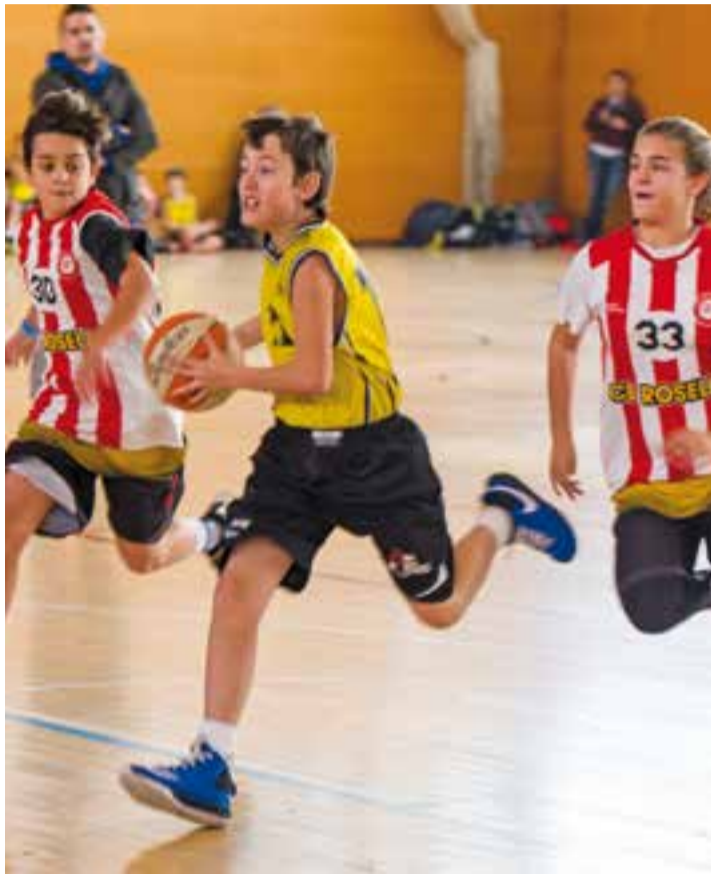
Jugada del partit de l'edició 2017 del Memorial Parcerisa.

A l'avantsala del partit, el cadet femení s'enfrontarà al CB Canovelles (9.00 h) i el júnior masculí ho farà enfront del CB Parets en la 40a edició del Memorial Parcerisa, un altre de les cites ineludibles del gener castellarenc. A les 12.00 h, tots els equips del club seran presentats a l'afició. †