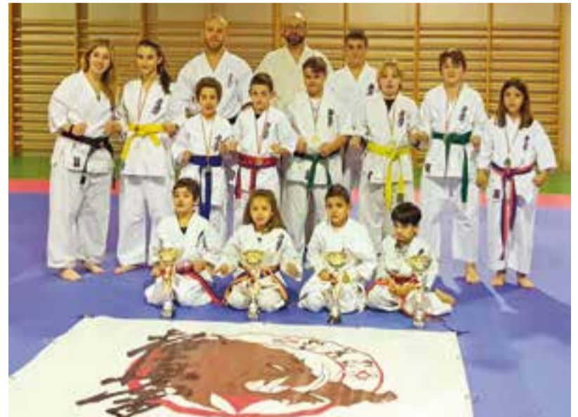
Els karateques del Club Kyokushin amb els èxits aconseguits al campionat.