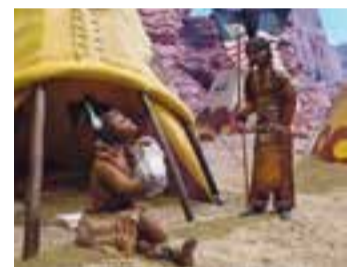
Escena del naixement.