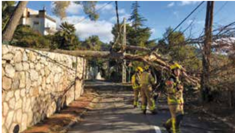
Un dels serveis dels Bombers a Sant Feliu del Racó durant la ventada.

Mobiliari urbà: senyal doblegada i fanal caigut al carrer de Sala Boadella així com també