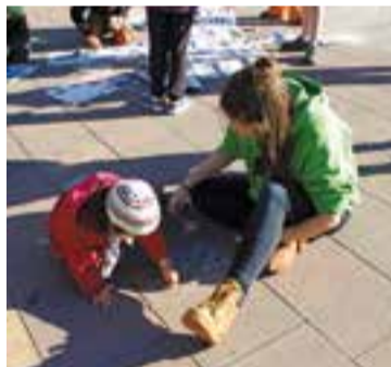
Infants pintant llufes a terra. || M. A.

Algunes de les persones que es van apropar a la festa, van poder conèixer de prop l'esplai i es van interessar per la tasca que porten a terme durant l'any. + || M. ANTÚNEZ