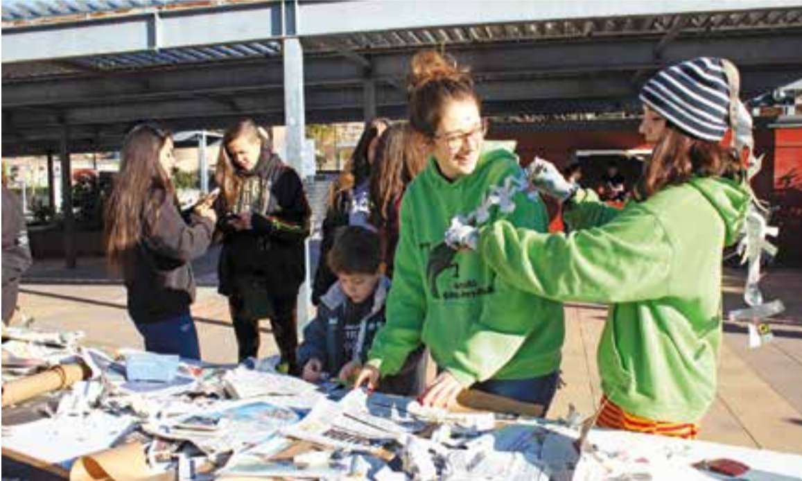
Els monitors de l'Esplai Sargantana retallen llufes per enganxar a la gent de Castellar.

L'Esplai Sargantana va coordinar l'activitat matinal relacionada amb el dia dels Sants Innocents, el passat 28 de desembre