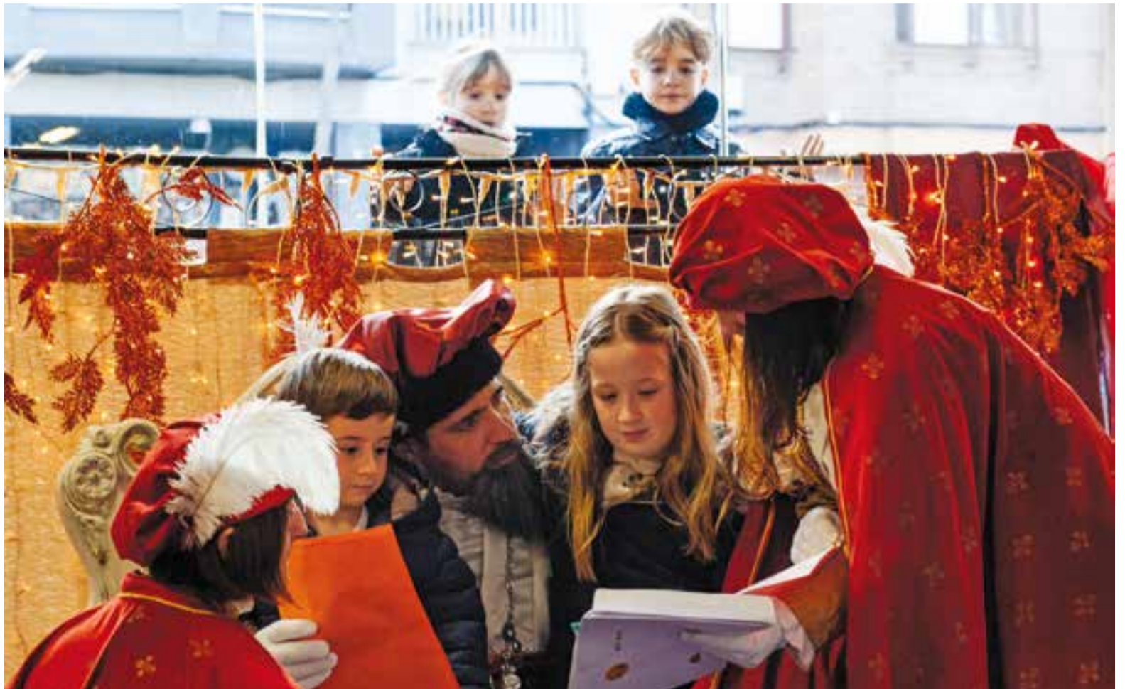
Uns infants miren l'Ambaixador reial, que va atendre els nens castellarencs durant els dies previs a l'arribada dels Reis d'Orient.