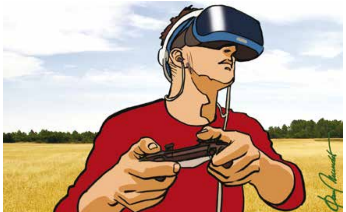
© Ni a dins ni a fora, a l'altra banda. || JOAN MUNDET

"Sigui en el dispositiu que sigui, els videojocs s'han fet un espai al costat del cinema i la indústria musical"