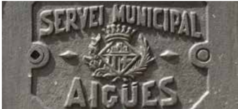
Tapa d'un punt de connexió d'aigües de la vila.

Tal com informava L'ACTUAL de la setmana passada, els embassaments d'aigua de les conques internes s'han situat al voltant del 49% de la seva capacitat. A Castellar, l'últim dia de pluja abundant va ser a mitjans d'octubre, un episodi de dia i mig de precipitacions, on van caure 82 litres per metre quadrat. En aquest sentit, segons dades facilitades per la regidoria de Medi Ambient de l'Ajuntament, els pous de la font de la Riera es troben a una profunditat de 59,20 metres d'un total de 100 metres de fondària. La manca de precipitacions ha propiciat que l'aquífer propi del municipi es trobi en el nivell més baix des del febrer de l'any 2015.