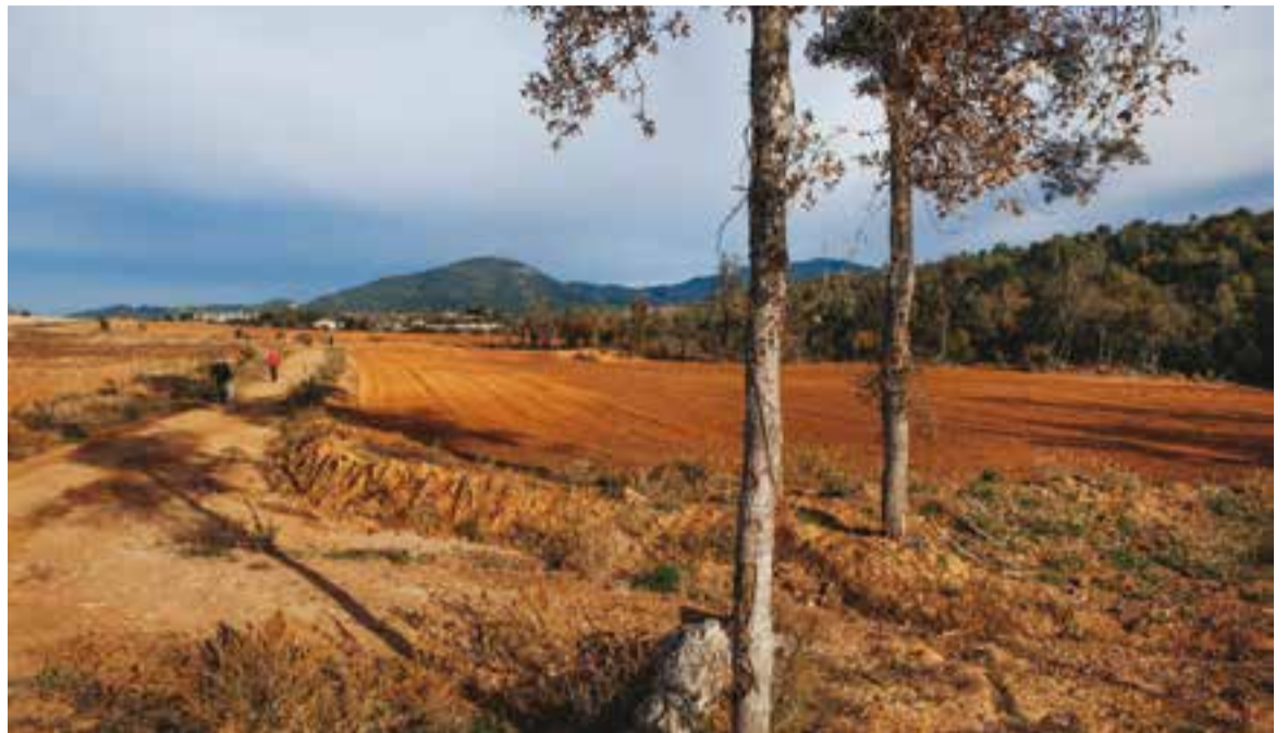
Espais de la zona de Can Casamada que eren boscos abans de les ventades i que ara han esdevinguts conreus.

La majoria de les zones boscoses de Castellar són de propietat privada. Una trentena de propietaris forestals van quedar afectats i es van haver d'encarregar de netejar la seva finca. Tres anys després, encara hi ha algunes zones que pel fet que són de difícil accés no s'han netejat. “Tenim de tot. Les zones de més fàcil accés es van poder netejar, però les més muntanyoses, alguns propietaris no van tenir