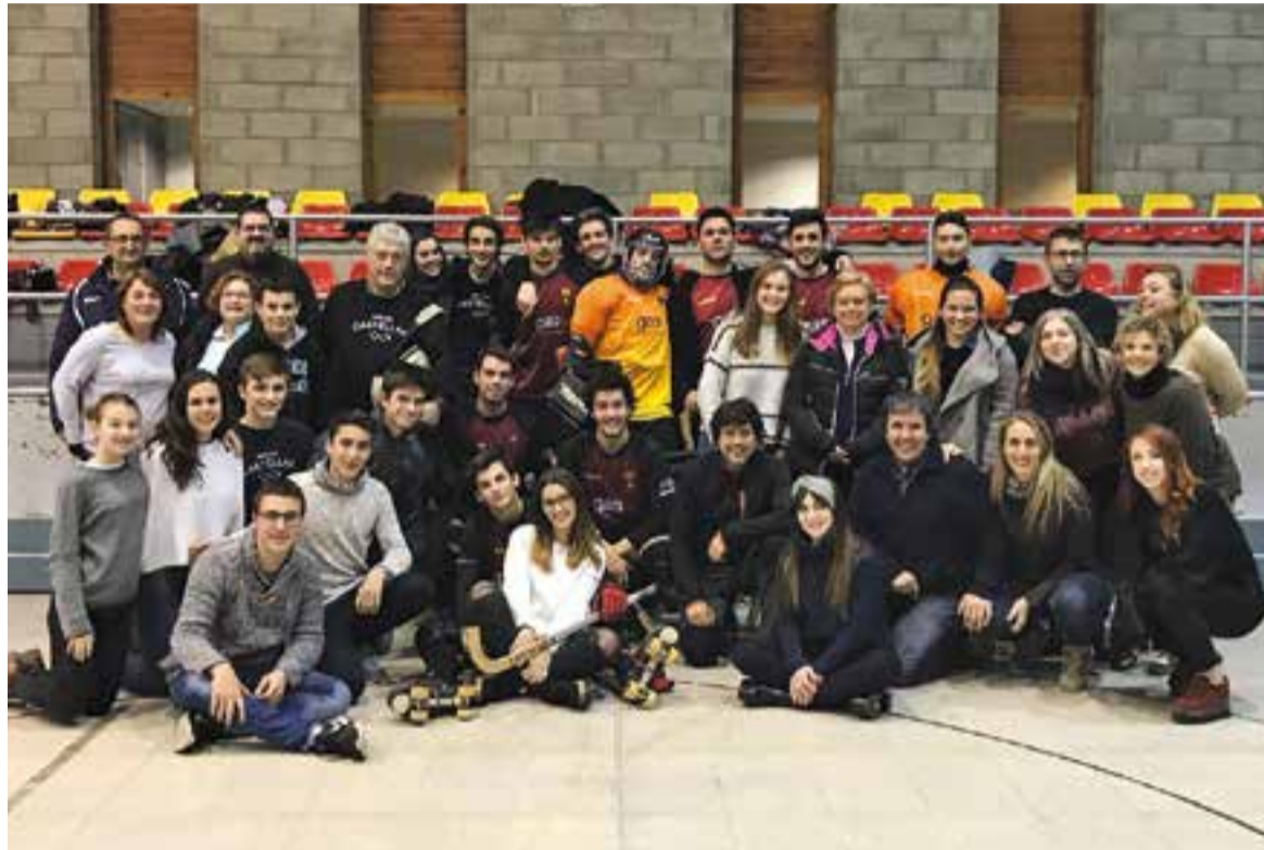
Jugadors i aficionats de l'HC Castellar junts al pavelló andorrà, després de la gran victòria a domicili.

Només un equip havia aconseguit guanyar a la pista de l'Andorra aquesta temporada. El trajecte és llarg, la pista és freda i l'hora de joc, intempestiva. En la visita dels grans, dues claus van decantar la balança: la capacitat resolutiva davant de porteria i la maduresa en els instants finals. Aspectes que van faltar en partits anteriors en què es van escapar punts en els últims cinc minuts de partit. Com en els enfrontaments