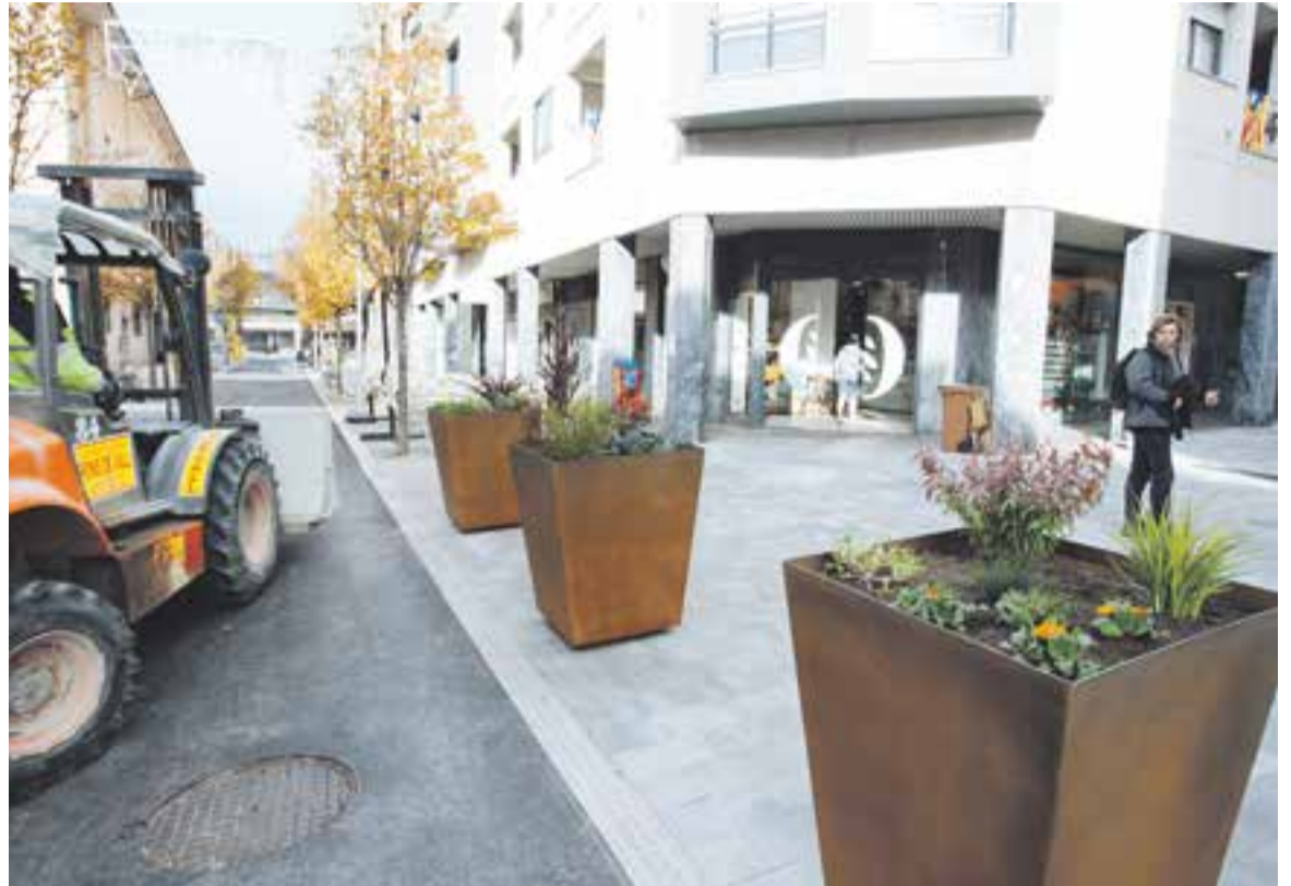
Dimecres passat, es van instal·lar jardineres i mobiliari urbà a l'entorn del carrer Hospital amb Sala Boadella.

D'altra banda, el carrer Major també serà objecte d'intervenció amb