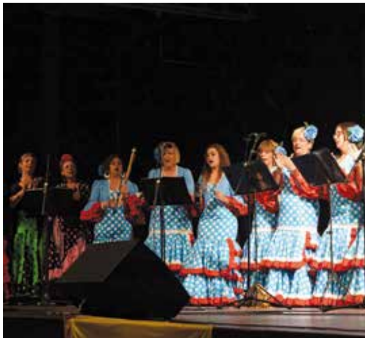
Concert rociero que va tenir lloc el desembre de 2016.

Enguany, hi participaran el Coro Pastora y Reina, de Santa Coloma de Gramanet; la Hermandad Nuestra Señora del Rocío, de Sabadell; el Coro Alba Rociera, de Sentmenat; el Coro Amigos PARA Siempre, de Can Rull; el Coro Almas Marismeñas, del barri d'Els Merinals de Sabadell; el Cuerpo de Baile de la Casa de Andalucía de Castellar del Vallès, i el Coro Aires Rocieros Castellarencs, de Castellar. L'entrada és gratuïta i oberta a tothom. Per a més informació es pot contactar amb els responsables a través del telèfon 937148739 i 669770954. + || M.A.