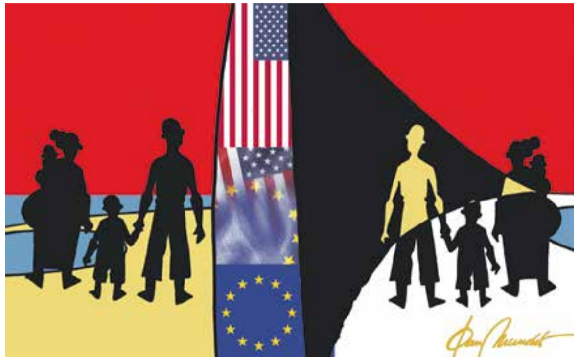
© Refugiats d'arreu. || JOAN MUNDET

nostra, al Mediterrani, i en especial a la frontera sud, la que és responsabilitat de l'Estat Espanyol. Persones, majoritàriament nois de països subsaharians, que intenten saltar la tanca o vorejar-la per mar en una embarcació precària. Totes elles volen arribar a les costes de Ceuta i Melilla per entrar a Europa, i ho fan per vies il·legals i que no