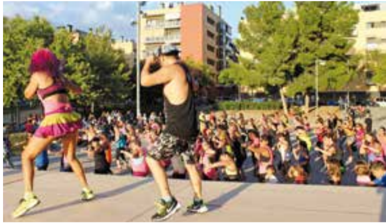
Classe magistral de Zumba per Festa Major amb les Zumberes de Castellar

Les malalties infeccioses són la causa d'1 de cada 3 morts al món i són un problema important de salut pública. Són causades per microorganismes patògens (bacteris, virus, fongs i protozoous) que entren al cos i es multipliquen, fins que produeixen la malaltia. Cada microorganisme s'instal·la i prolifera en un lloc diferent del cos humà, depenent de la seva via d'entrada i característiques.