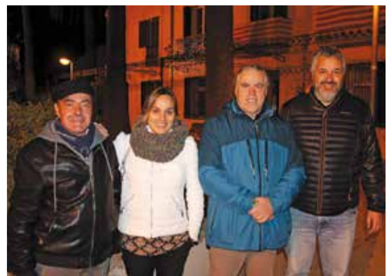
Els quatre regidors d'ERC als Jardins del Palau Tolrà, dimecres passat. || J. RIUS

Homet considera que aquestes eleccions han generat força expectatives entre la població com ho demostra que la formació ja té registrats a Castellar del Vallès per a aquestes eleccions 60 apoderats, "una xifra molt superior a la que tenim respecte a altres eleccions", constata. + || JORDI RIUS