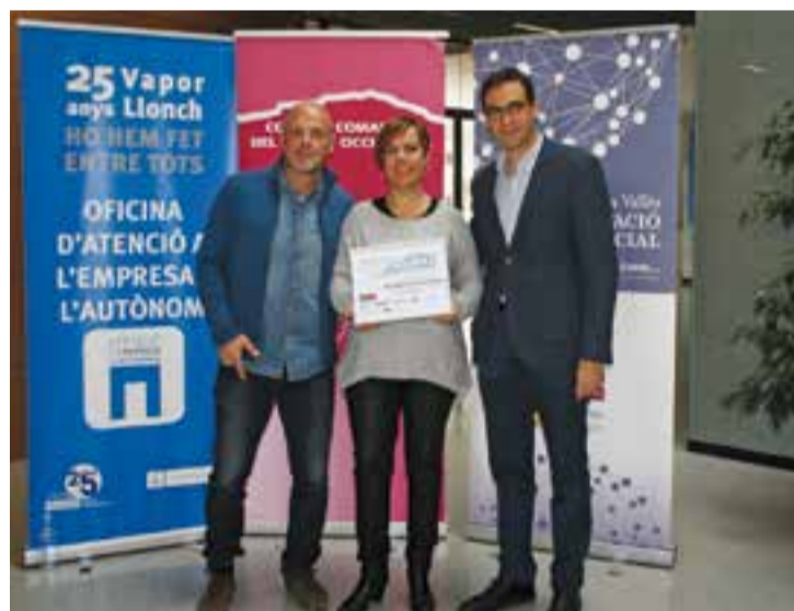
Resident Odontologia van rebre el premi del CCVOC dimecres passat

A més de Resident Odontologia, també han estat premiats els projectes Càtering social: "menjar bo i just", Arte Paliativo i Bicity Eco-lògic. Cal destacar que els guardonats rebran assessorament personalitzat per madurar i tirar endavant amb el projecte i una aportació econòmica de 2.500 euros per impulsar el model de negoci. + || REDACCIÓ