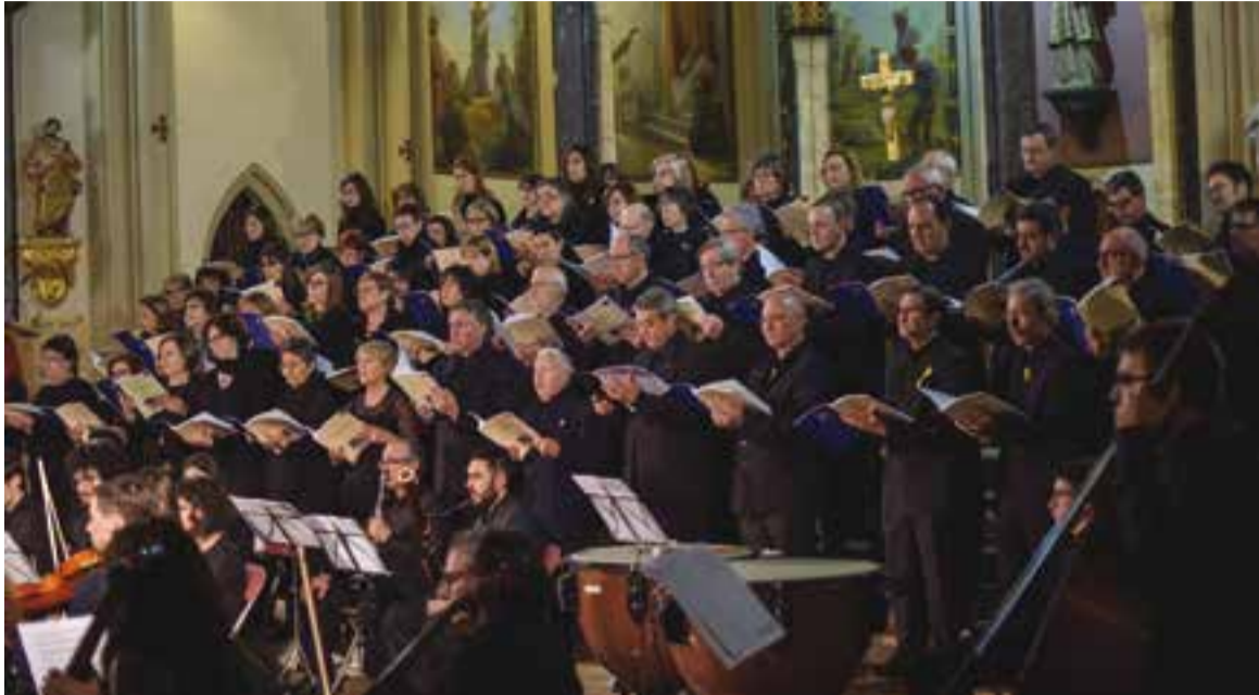
La coral And&amp;Cat, en acció a l'església de Sant Esteve, està formada per 85 cantaires aproximadament. || G. PLANS