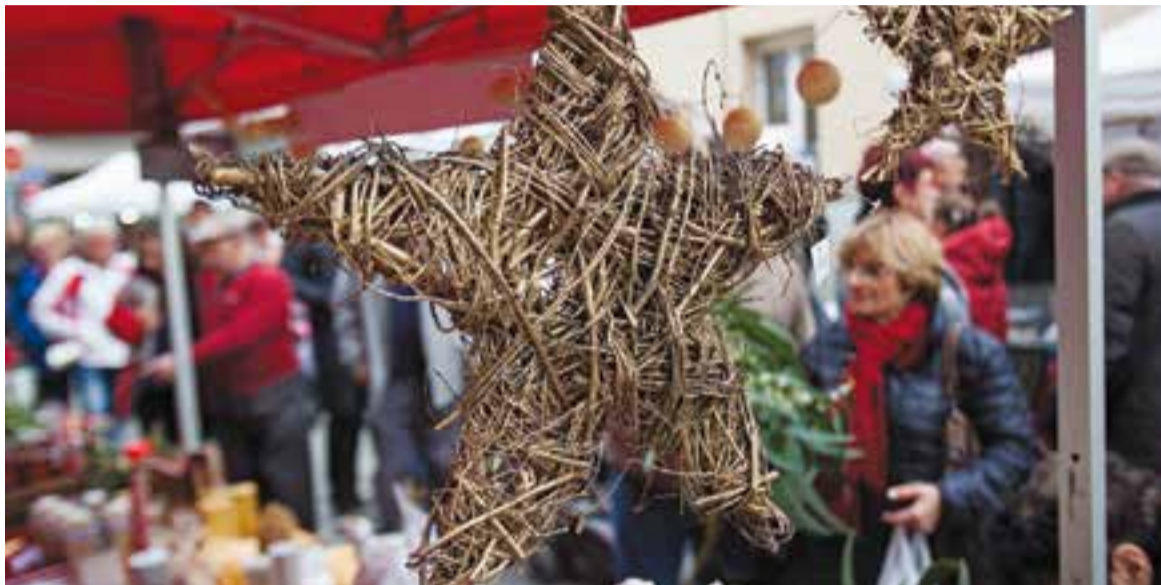
Els vilatans podran trobar una àmplia oferta d'elements nadalencs i articles de regal per aquestes festes. || Q. PASCUAL