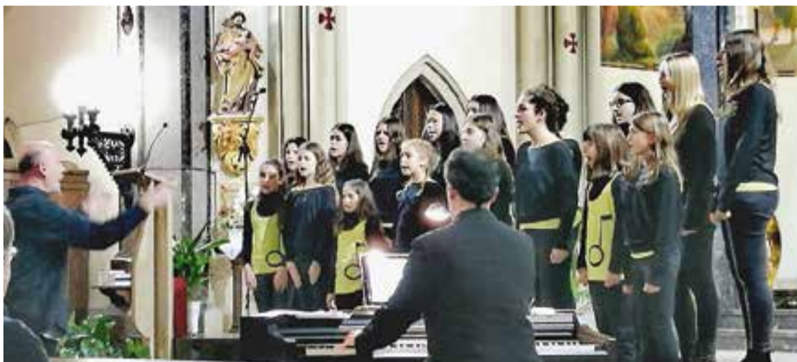
Moment del Concert de Nadal a l'església, de l'any 2016. || E. BENAVENT

El Cor Sant Esteve, Kor Ítsia i Coral Xiribec tornen a l'església de St Esteve