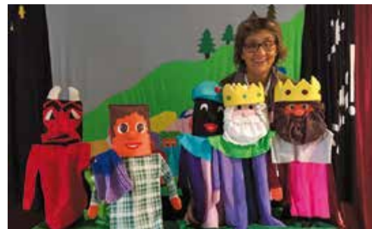
Rosa Fité durant el seu espectacle 'Spa mocions'.

La Creu Roja Joventut ha programat dos espectacles en el marc de la campanya de joguines que organitza l'associació. Per dissabte 16, a les 17.30, hi ha una sessió de contes per a petits amb la popular ronadallaire Rosa Fité. S'ha programat a la Sala de Petit Format de l'Ateneu amb el nom ‘Una de pastorets!’, un espectacle infantil on es posen de relleu les nostres tradicions nadal lenques a través d'una divertida i entranyable història de pastorets amb titelles. Per participar-hi cal aportar una joguina. El mateix dia, a les 21.30 h, Fité presentarà de nou ‘Spa mocions’, per a adults. Als espectacles, s'explicaran els projectes adreçats a la joventut organitzats per la Creu Roja + || M.A.