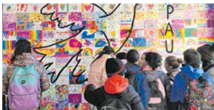
Murals pacifistes a l'Institut Castellar i l'Escola Joan Blanquer.

dre desitjos de pau. “Ho vam fer amb la lectura d'un manifest i la interpretació conjunta d'una cançó. Al llarg de la setmana anterior, també vam construir un gran mural entre tots i totes,