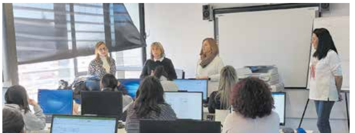
Inici dels cursos de FO a El Mirador: a dalt, el d'atenció socio sanitària en institucions i a baix, el de gestió administrativa.