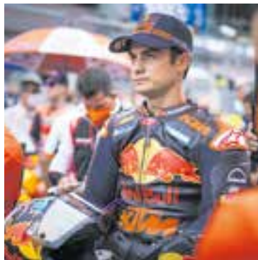
Dani Pedrosa torna el 30 d'abril.

El 26 continua amb el desenvolupament de les motos austríaques, que aquest any pilotaran Brad Binder i Jack Miller en l'equip oficial. †