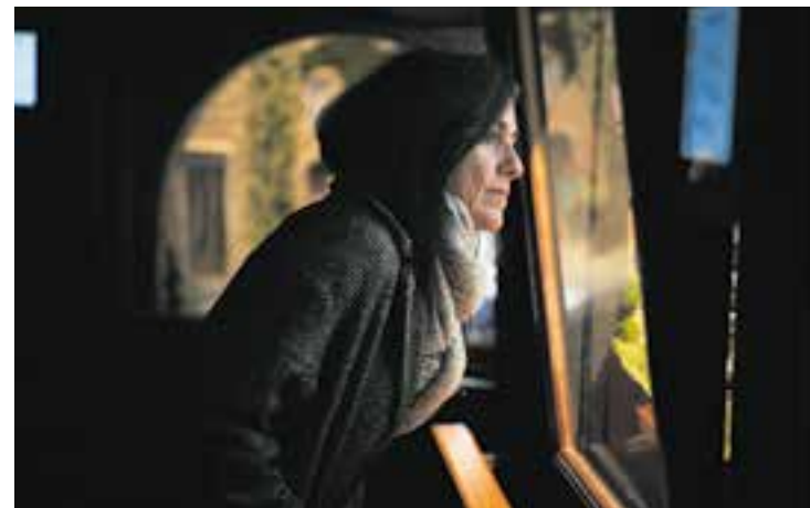
Una de les visitants als pessebres de Castellar, per les festes de Nadal. || Q. P.

L'exposició es va inaugurar el 3 de desembre del 2022 i es desmuntarà a finals de maig del 2023. El dia 5, coincidint amb el tancament per al públic, es farà el sorteig d'unes figures d'Alina Antonell. ➔ || M. A.