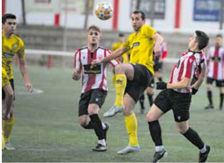
El Voltregà va trencar la ratxa de nou victòries consecutives del Castellar.

L'empat era un resultat que no satisfia cap dels dos equips, i un Voltregà que va saber portar el joc a la