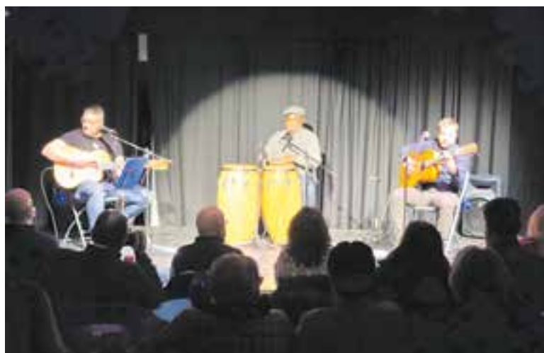
Moment del concert de Compadres, a L'Alcavot Espai Cultural.