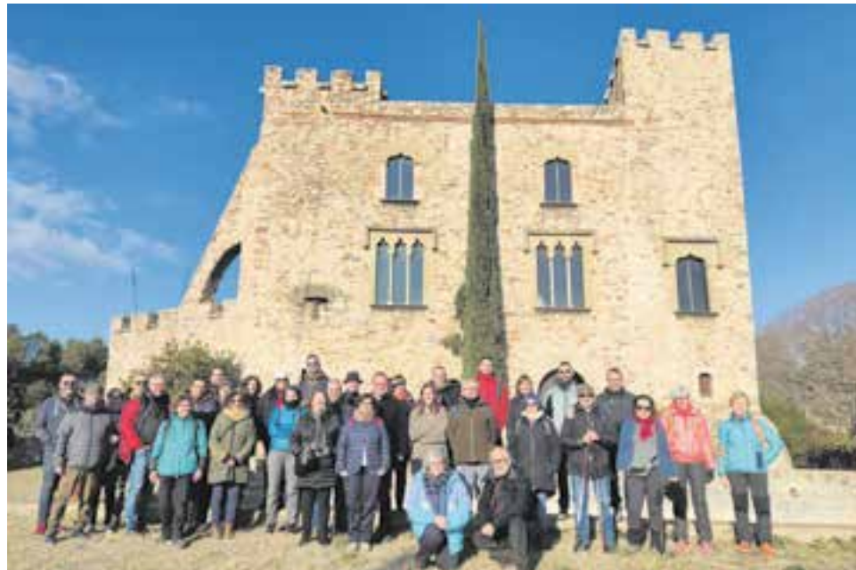
Foto de grup amb els participants a la sortida davant del castell de Clasquerí.

En els darrers 25 anys, Castellar del Vallès ha tingut un augment de població notable i hi ha molta població que ni tan sols sap que Castellar té un castell. "Amb aquests itineraris també es busca que la gent entengui