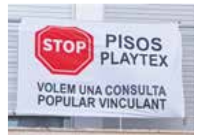
Una de les pancartes penjades.

“No permetrem que, ara que s'acosten les eleccions, certs interessos polítics puguin causar a la