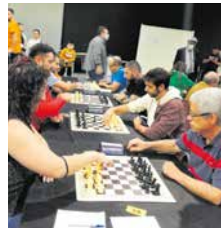
El CEC amb quatre equips a la Lliga Catalana.

Aquest cap de setmana passat va arrencar una nova edició de la Lliga Catalana d'escacs en què el Club d'Escacs de Castellar participa amb quatre equips. L'equip A jugarà en la Primera Divisió, mentre que el B i el C ho faran a Tercera i el sub-12, en la categoria reservada als menors d'edat.