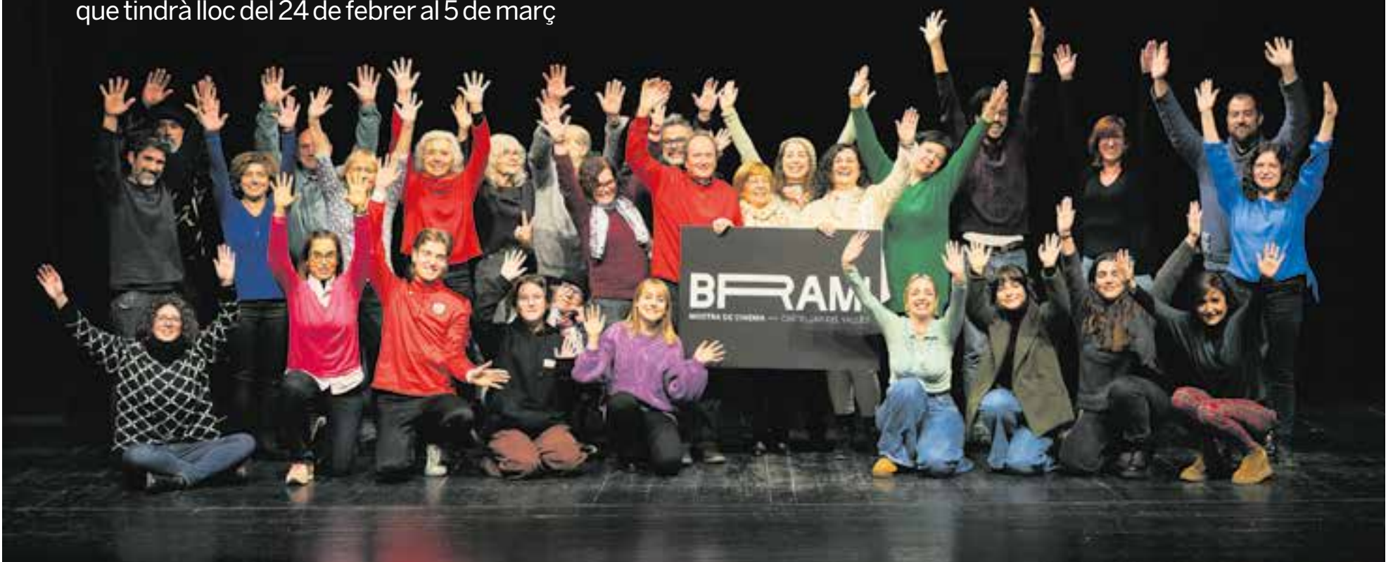
Els diferents participants i responsables de la mostra de cinema social es van fer una foto de família dimecres a la tarda després de presentar les novetats d'aquesta edició. || Q. PASCUAL

Es projectaran 17 pel·lícules a la mostra que tindrà lloc del 24 de febrer al 5 de març