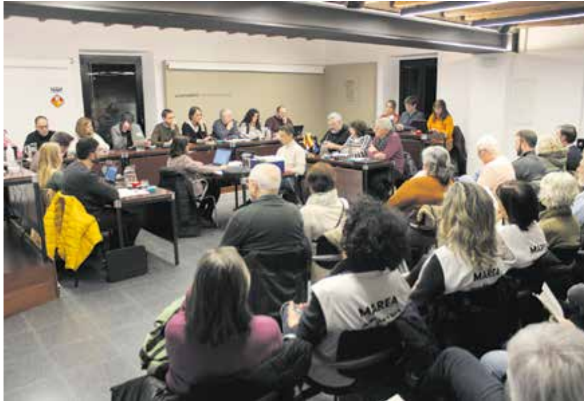
Després de molts mesos sense gaire públic, Ca l'Alberola es va omplir amb representants de la plataforma Sanitat Digna.

El debat més extens del ple es va dur a terme en la moció sobre infraestructures plantejada per Som de Castellar-PSC i que va tirar endavant amb el vot a favor de Junts i Cs, l'abstenció d'ERC i el vot contrari de la CUP. Segons va explicar el tinent d'alcalde de Territori i Mobilitat, Pepe González, "Castellar pateix un dèficit d'infraestructures que condiciona el nostre desenvolupament i, el que és més important, genera estrès i