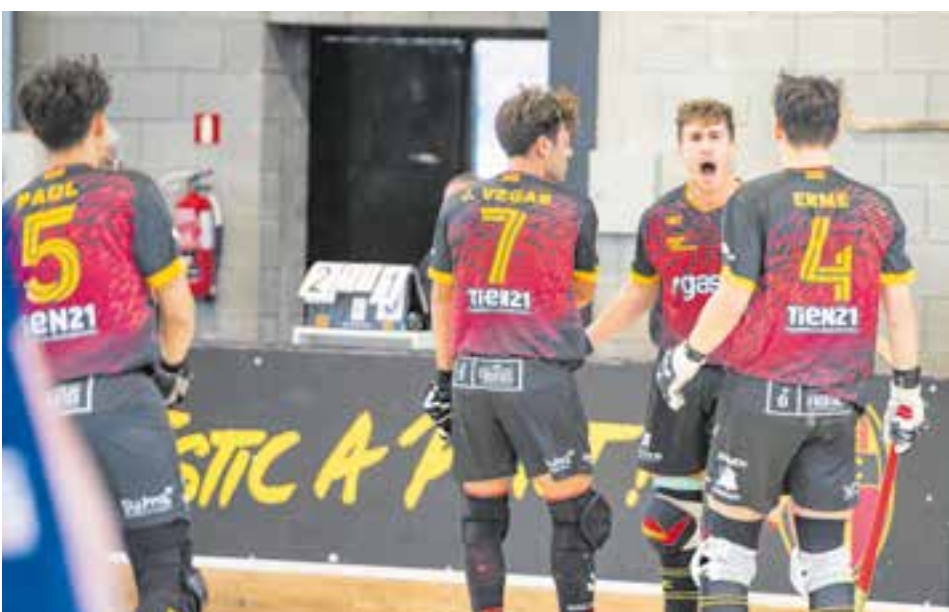
A l'HC Castellar només pot esperar per veure si és campió de grup.