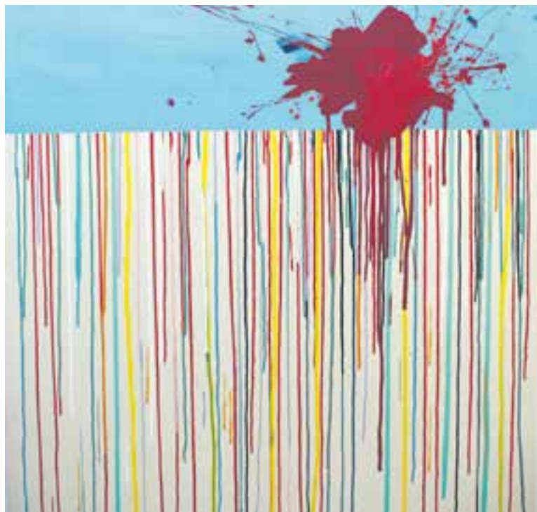
Un dels quadres de Carles Azcón que s'exposen al Calissó Cultural.

Actualment, l'artista treballa a l'espai d'art contemporani La Puntual (al Mercantí de Sant Cugat del Vallès) i està compromès amb causes solidàries, en especial, amb el canvi climàtic. Aquesta sensibi-