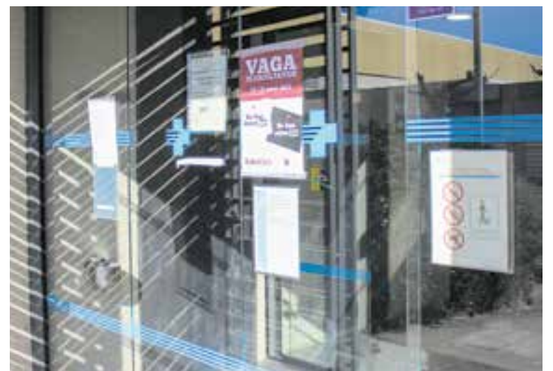
A les portes de CAP encara es pot veure el cartell informant de la vaga. || C. DÍAZ

Pel que fa a la millora de les condicions assistencials i el benestar dels professionals, s'aplicaran millores en les condicions i el temps d'atenció als pacients; s'optimitzaran les agendes dels facultatius; es realitzaran estudis de càrregues de treball; s'implementaran mecanismes per desburocratitzar les consultes i es dotarà el personal de més temps per a la formació i recerca. + || C. DOMENE