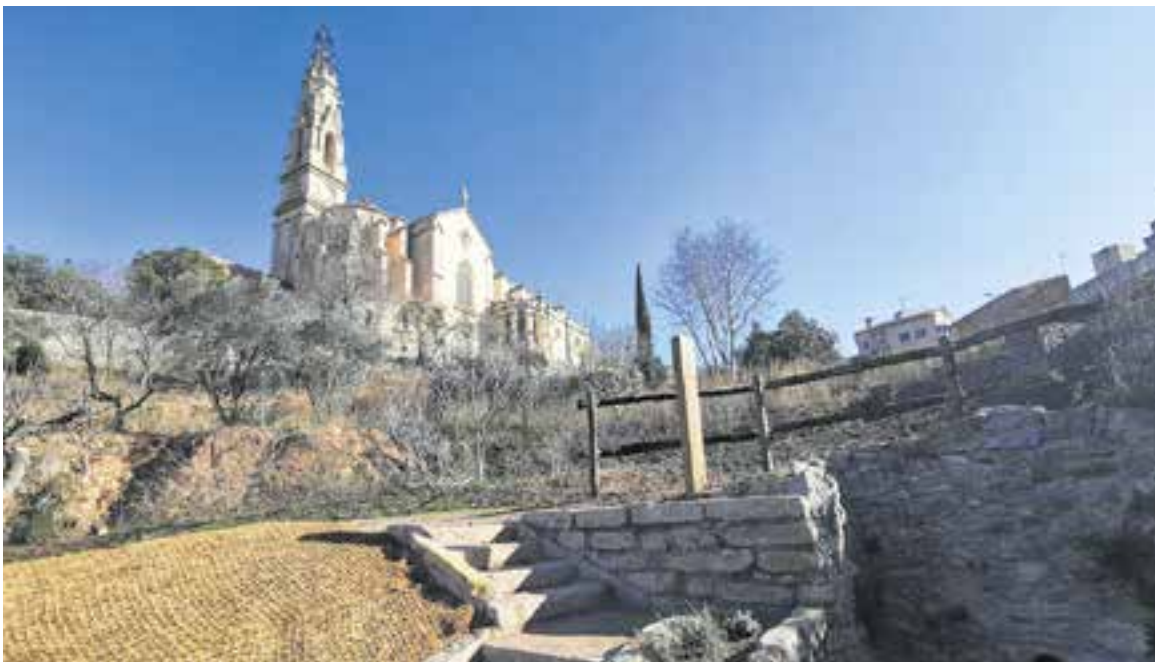
Pràcticament tot el camí arranjat compta amb una vista de l'església de Sant Esteve de Castellar del Vallès. || AJ. CASTELLAR

Una escala connecta el parc amb el camí que passa per sobre del torrent