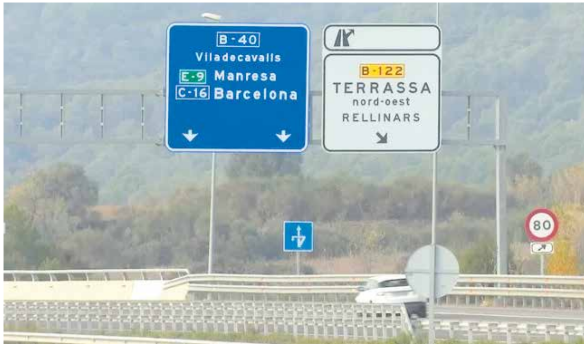
Imatge de fa uns mesos de la B-40 a la zona nord de Terrassa.

El cop de timó donat en l'últim moment per ERC torna a donar vida a una infraestructura que ha estat finalment el principal escull per salvar els pressupostos de la Generalitat per al 2023. Ho va explicar el president de la Generalitat Pere