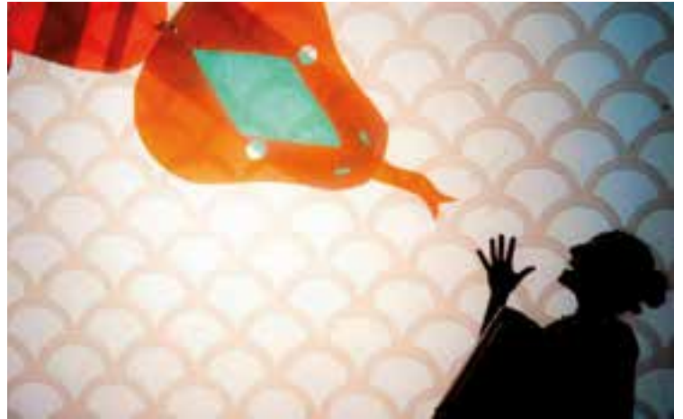
Un dels moments de 'Sona la llum!', de la companyia La Curiosa.