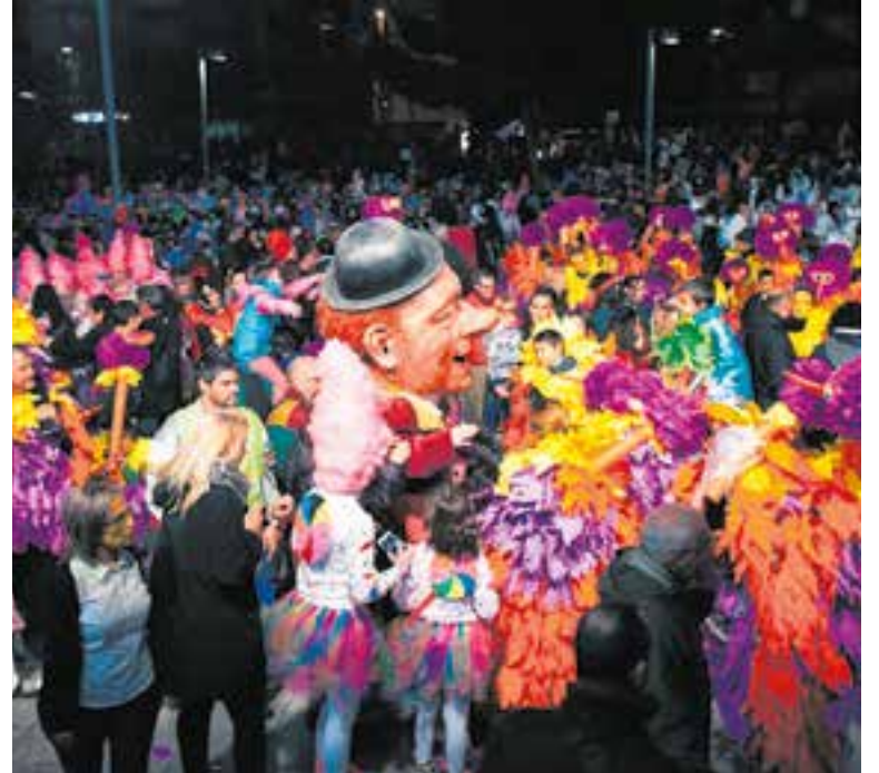
Imatges de la Rua de Carnaval de fa 5 anys, a l'arribada a l'Espai Tolrà.

Una de les novetats d'enguany és que s'incrementa la dotació dels premis a comparses i carrosses fins a 900 euros. L'Ajuntament de Castellar concedirà tres premis, corresponents a les categories de millor carrossa, millor comparsa i millor disfressa. Per determinar el veredict, el jurat tindrà en compte criteris d'originalitat, de qualitat i d'ambientació en totes tres categories. A més, pel que fa a les carrosses i les comparses, també es valorarà la seva integració en el conjunt. ➔