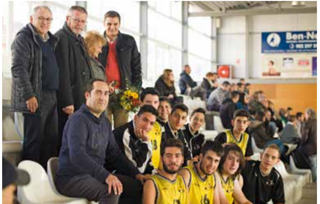
L'equip júnior després de l'entrega del trofeu de guanyadors, amb la directiva i la família Parcerissa. || A.S.A.

"Ha estat una jornada fantàstica. Poder conèixer als rivals i aprendre d'ells és una molt bona experiència" va explicar el jugador castellarenc. +