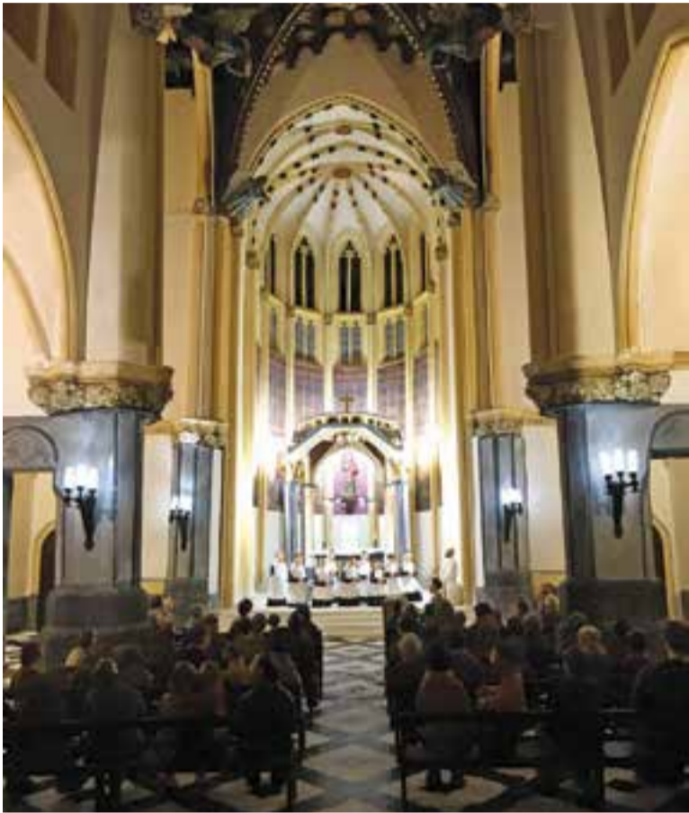
Diorama de Joan Juni a l'exposició de pessebre del Grup Pessebrista. || J. JUNI

Es poden seguir visitant tots el diumenges fins al 5 de febrer