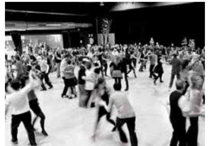
Ball swing de SonaSwing a la Sala Blava de l'Espai Tolrà. || CEDIDA

SonaSwing és una entitat castellarenca creada al 2013 i dedicada a l'aprenentatge del ball lindyhop , swing, blues i algunes de les seves variants. + || M.A.