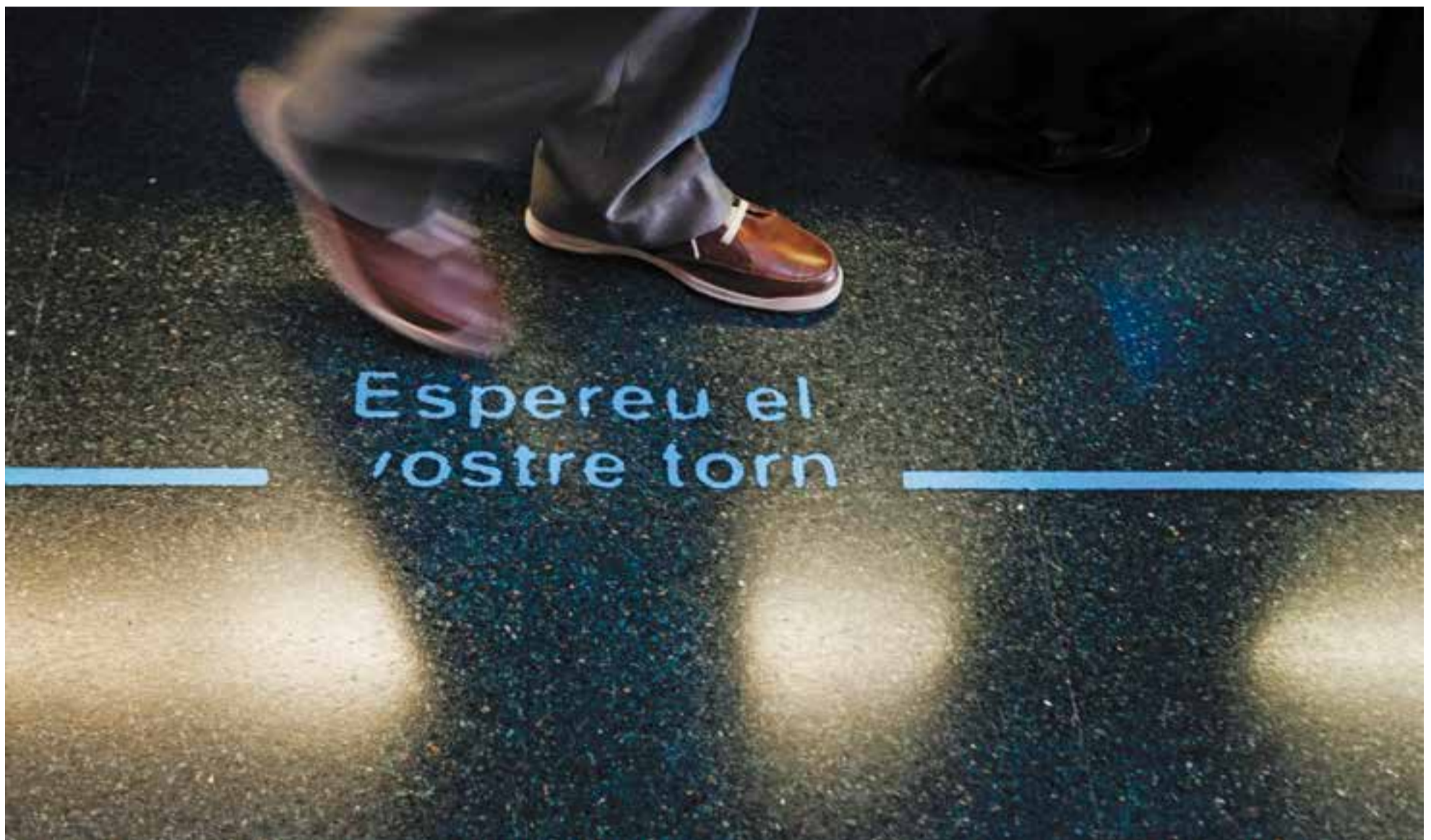
El servei d'urgències del CAP Castellar registra una mitjana diària de 140 visites més per l'epidèmia de grip. Les Urgències de l'Hospital Taulí també estan desbordades. || Q. PASCUAL