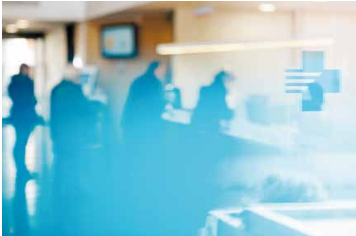
El servei d'urgències del CAP de Castellar rep aquests dies més visites del que és habitual.

La situació de col·lapse podria agreujar-se en les properes jornades ja que a hores d'ara encara no s'ha assolit el pic de l'epidèmia de grip. S'espera que la setmana que ve es multipliquin els casos d'aquesta malaltia. Per tal de descongestionar els serveis d'urgències i alliberar-los per als casos més greus, Martínez recorda que en cas de presentar un quadre de grip, si la febre no supera els 38,5 graus durant més d'un dia, o si el malalt no forma part d'un col·lectiu de risc, no és necessari visitar el CAP. "Els símptomes de la grip són dolor muscular, cansament, tos, mal de cap, conges-