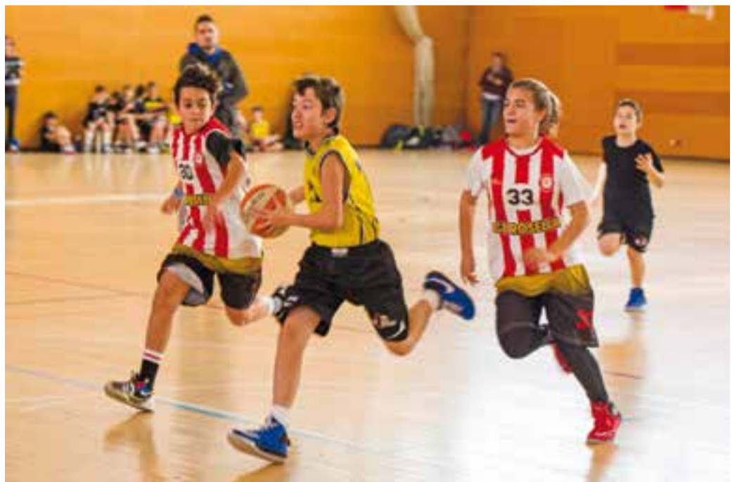
Després del Parcerissa, les categories inferiors van jugar tres partits de manera simultània. || A.S.A.