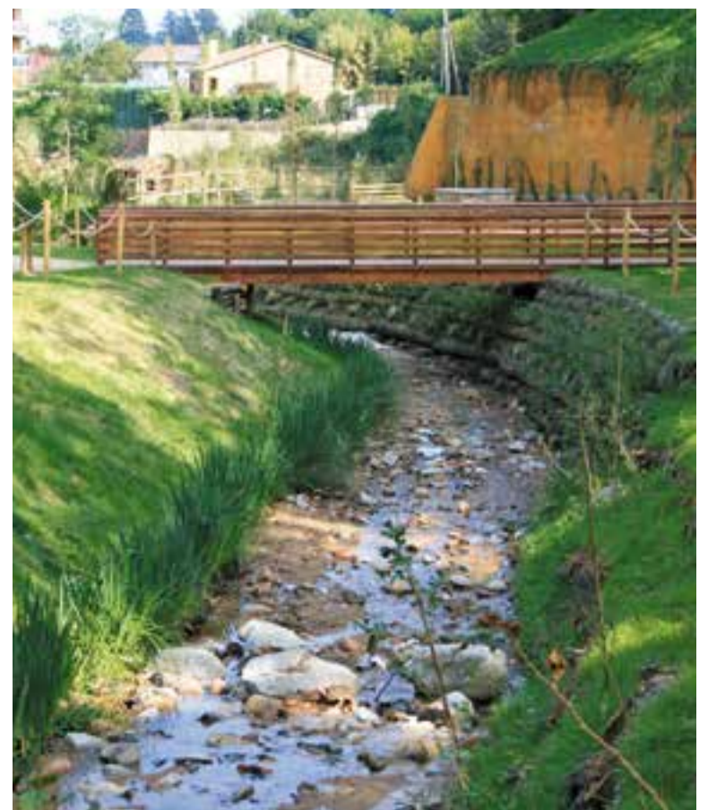
Un exemple de recuperació d'espai natural que ha realitzat Naturalea.

També està duent a terme un projecte pilot de restauració fluvial a la riera de Cànoves (al terme municipal de Cànoves i Samalús) juntament amb la Universitat de Barcelona, el Consorci per la Defensa de la conca del Besòs i el finançament de la Fundació BBVA. Es vol estudiar com mitigar els efectes de l'entrada d'aigua provinent de les depuradores, en rius mediterranis intermitents. ✦