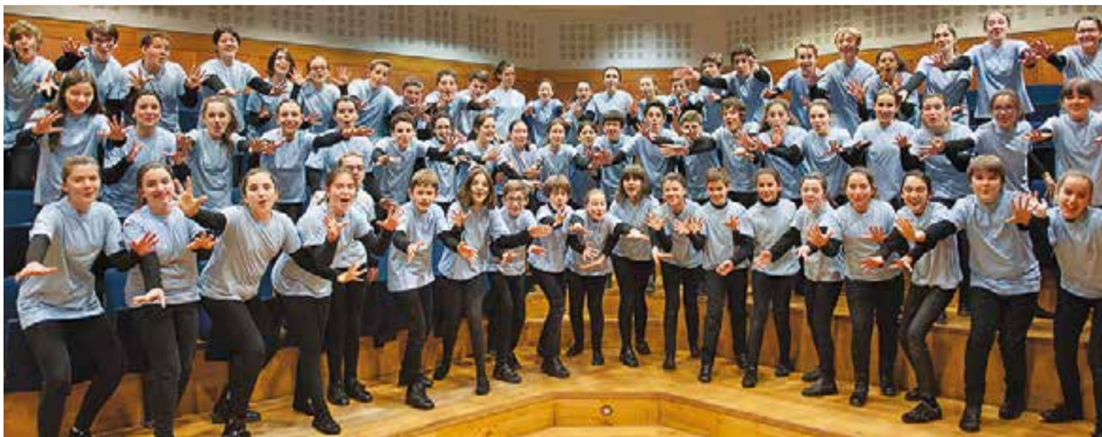
Cor de l'Orfeón Donostiarra OrfeoiTxiqui.

El cor d'infants ha estat convidat pel Cor Sant Esteve, que clou així el 30è aniversari