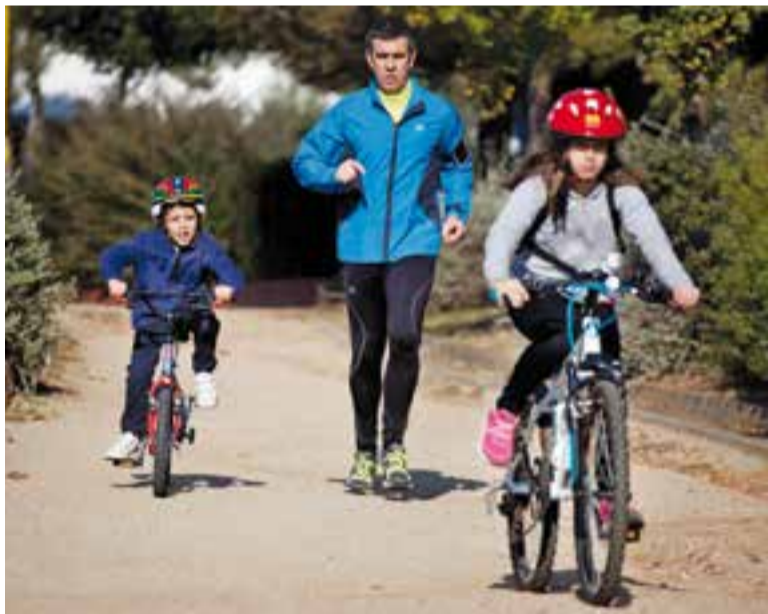
Aquest recorregut és molt freqüentat per practicar esport

Segons la formació l'Ajuntament de Castellar va sol·licitar l'any 2004 un pressupost per enllumenar el camí el qual superava els 200.000 euros. +