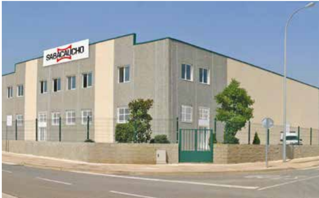
L'empresa Sabacaucho es troba al carrer Maresme del polígon del Pla de la Bruguera.

L'empresa, que es dedica a la fabricació de cautxú i polímers elàstics, ha comprat una nova nau al carrer Maresme