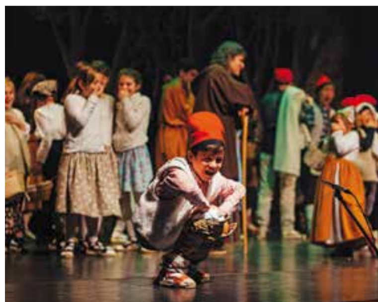
El caganer de 'Xiribec i Xiripiga, els pastors Cantaires de Betlem'.

Durant més de 30 anys, Colònies i Esplai Xiribec ha dut a terme, de forma continuada, la representació dels Pastors Cantaires de mos-