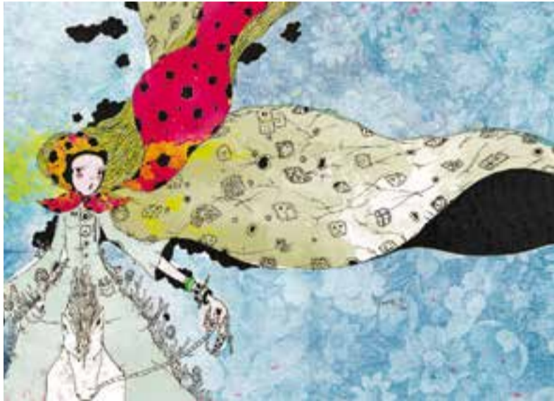
Una de les il·lustracions de Pedro Giménez, que exposa tot el gener a Cal Calissó. || P. G.

Dissabte ens visita Sin Noticias de Alicia i diumenge s'obre una exposició