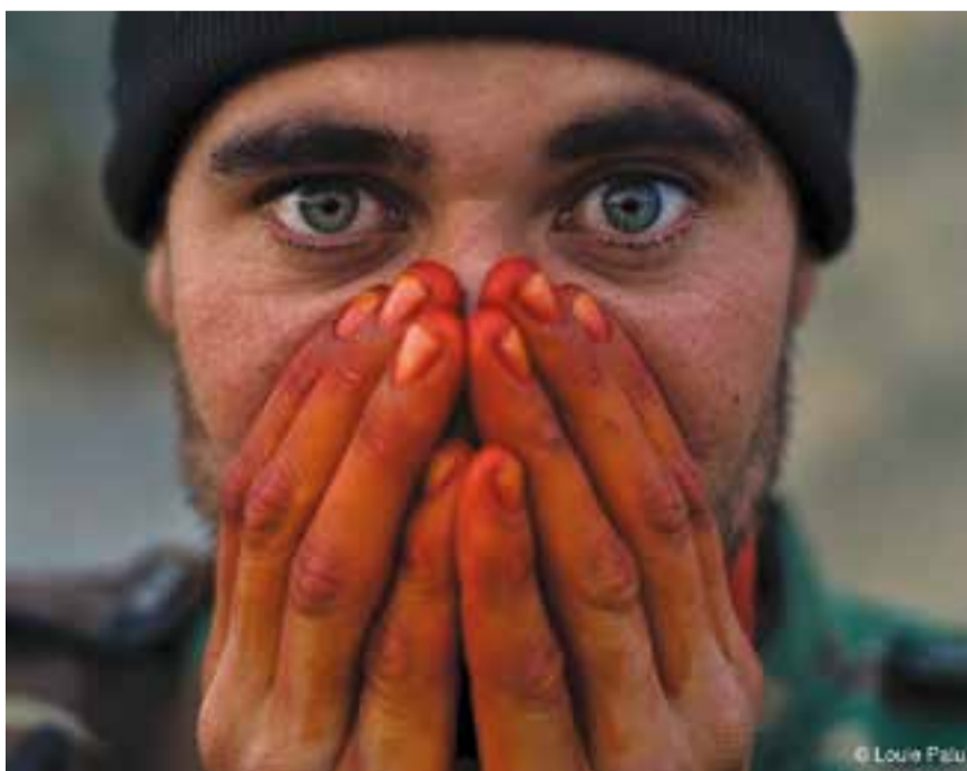
Imatge del documental 'Diaris de Kandahar'. || L. PALU

Diaris de Kandahar és el seu primer llargmetratge documental. La història de Louie Palu és la d'un fotoperiodista al front de combat a Kandahar, al sud de l'Afganistan. A través dels diaris que va escriure entre el 2006 i el 2010 descobrim la seva evolució psicològica enmig d'una violència absurda, desconnectada de la realitat. Ell ha experimentat la cruïlla i la monotonia de la guerra en primera persona.