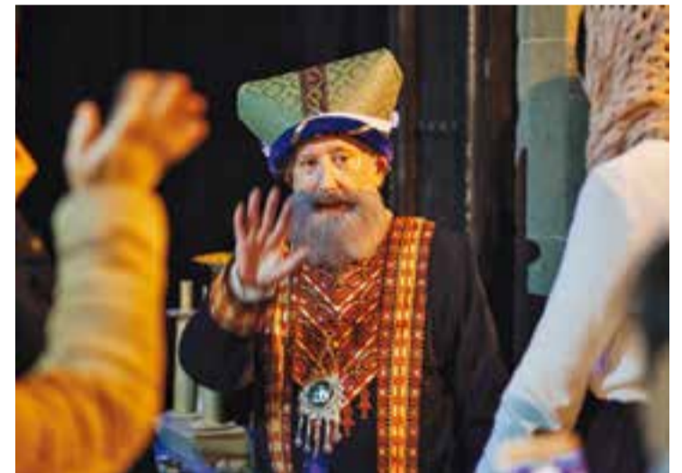
Un dels participants del Pessebre Vivent d'enguany. || Q. PASCUAL

Fent balanç del pessebre Vivent, hi ha alguns aspectes que s'intentaran millorar en properes edicions, com per exemple, l'infern: "Hauríem de buscar-li un racó propi, lluny del camí de pas, un espai on els figurants puguin escenificar l'escena, sense fer por, és clar" , afegeix Ballester. + || M.A.