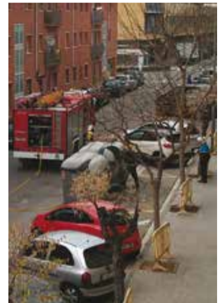
Bombers al carrer Tarragona. || C. DOMENE

A més, si les cendres estan enceses, s'inicia un procés de combustió que pot durar hores però que culmina amb l'incendi del contenidor amb el consegüent perill de propagació a altres contenidors, vehicles propers, arbres o tendals d'edificis i, fins i tot, escampar-se pels habitatges. + || C.DOMENE