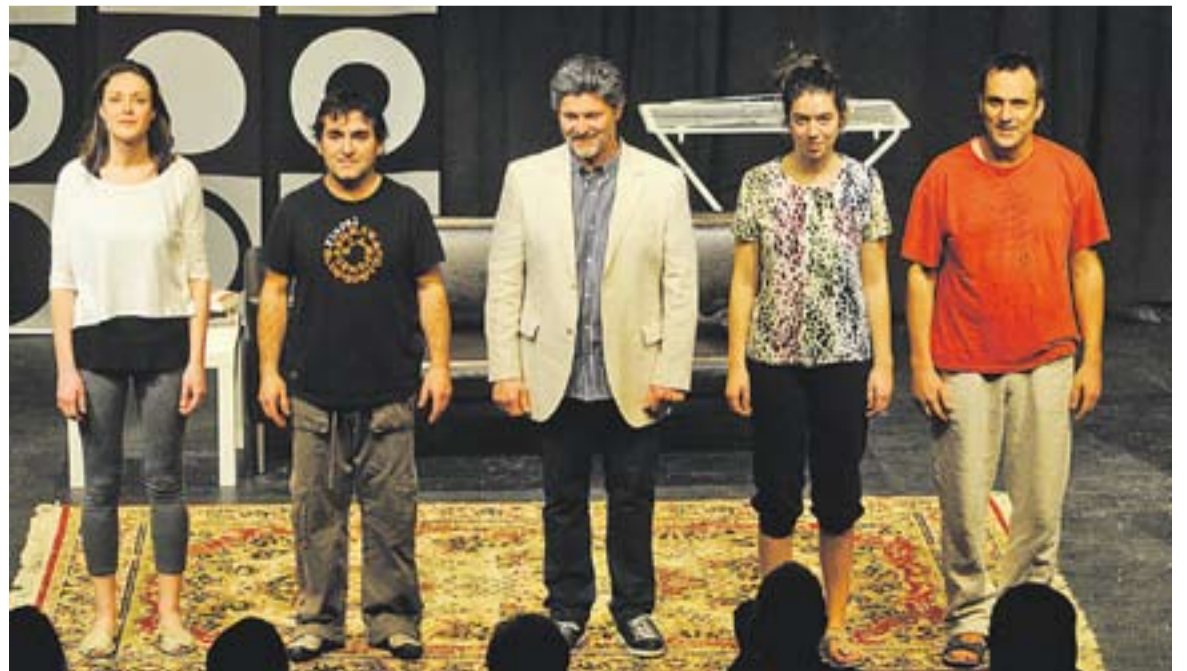
© 'Burundanga' de la Cia. Entre Cametes es tornarà a representar entre l'1 i el 17 de novembre. || J. GRAELLS