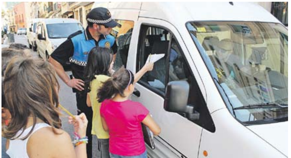
© Els infants posen una 'multa' a un conductor que no portava el cinturó de seguretat. || C. DÍAZ

La majoria de casuístiques detectades a les patrulles infantils feien referència a grafitis, guals mal senyalitzats, brutícia al carrers, vianants