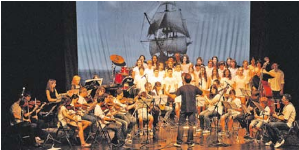
© Concert de l'Escola de Música Torre Balada a l'Auditori | J. GRAELLS