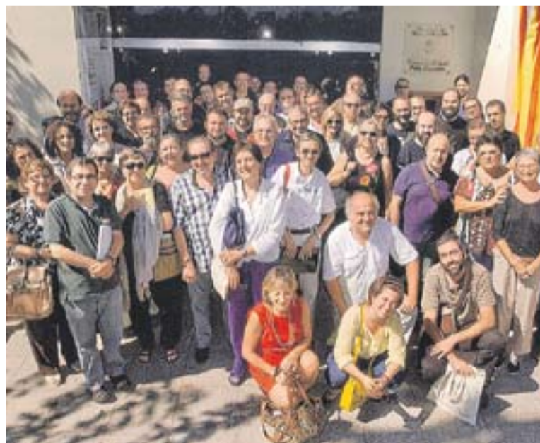
© Assistents a la trobada al Puig de les Arques de Cassà de la Selva.