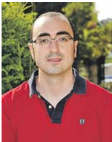
© Oscar Lomas. || J. GRAELLS

Per poder-se acollir a aquests ajuts, les famílies havien de complir diversos requisits, el més important relacionat amb la renda familiar. +