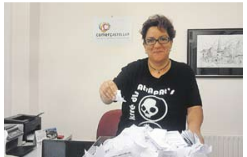
Un moment del sorteig dels tres xecs de 100 euros

Aquest mes també s'ha engegat des de Comerç Castellar la segona promoció trimestral de 3 premis de 100€. Els comerços adherits tornaran a lliurar als seus clients una butlleta per tal de donar-los l'oportunitat de participar en el sorteig que es farà el mes de desembre i on es tornaran a sortejar 3 premis de 100€. +