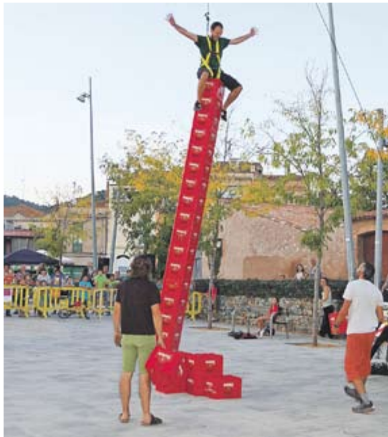
Una imatge del concurs d'Escalabirres celebrat dissabte a la tarda.