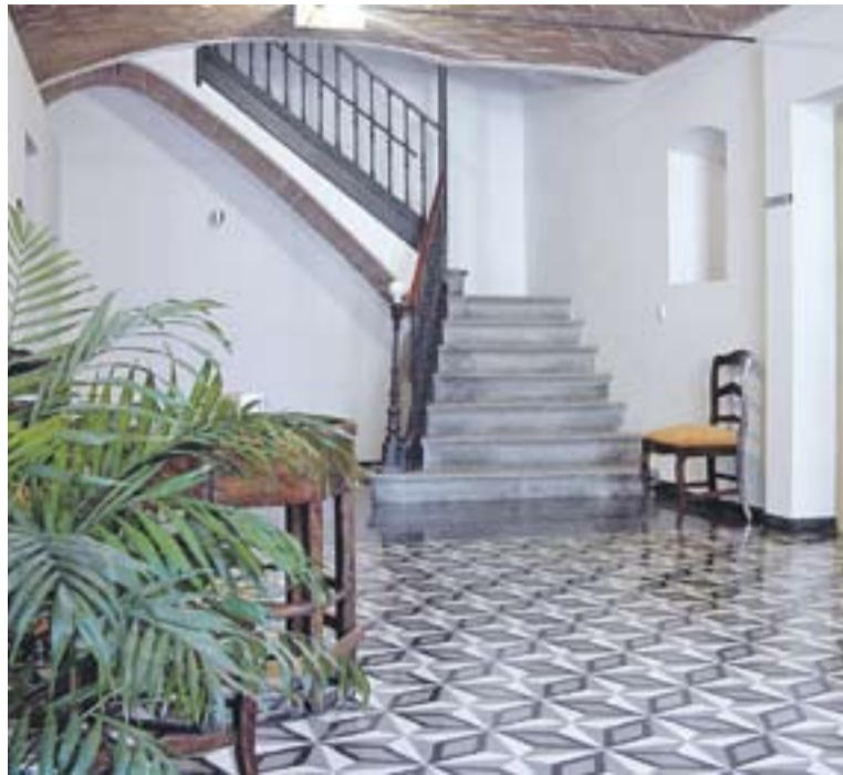
© Jutjat de Pau de Ca l'Alberola. abans -esquerra- i després de la seva restauració, un dels exemples que s'explicaran a la conferència d'avui. || J. LLOBET