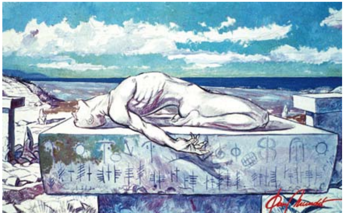
© Menorques particulars. || JOAN MUNDET

La meua estança a Menorca va coincidir amb l'exposició d'un pintor castellanenc, el meu col·lega Enric Aguilar