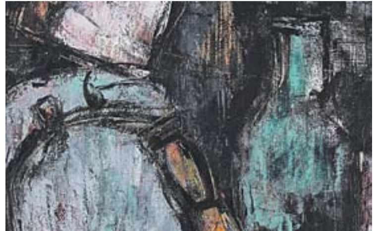
© Quadre de Valls-Areny que es projectarà digitalment a El Mirador. || CEDIDA