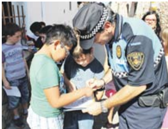
© a l'esquerra, taller pràctic de recollida d'incidències. A la dreta, dia sense cotxes a l'escola El Casal || C. DÍAZ / EL CASAL