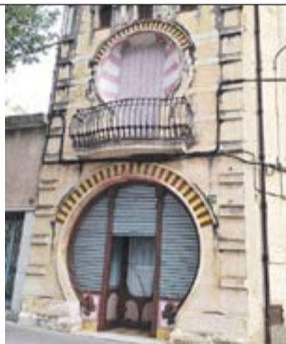
Casa modernista Autora: Carme Padrisa