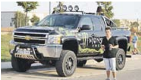
Vehicle Monster a l'Skate Park Autor: Óscar Moreno

Envia'ns fotos fetes amb el mòbil: lactual@castellarvalles.cat