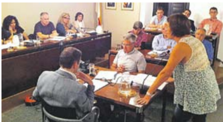
Portaveu de l'AMPA del J. Blanquer demanant el canvi de la parada de bus.

dell, el xoc d'opinions al plenari va arribar a l'hora de les mocions