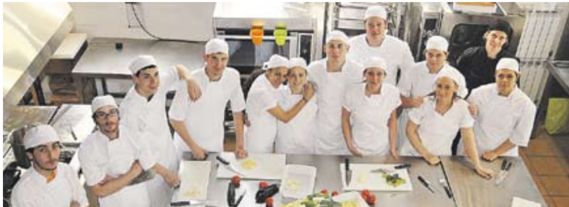
Un dels programes d'inserció laboral que ja s'han fet a Castellar, en aquest cas de cuina, impulsat pel COPEVO.

Castellar compta actualment amb 1.975 persones desocupades, de les quals el 32% no reben cap tipus de prestació. Així es recull a l'Informe de prestacions per desocupació al Vallès Occidental i els seus municipis, publicat pel Consorci per l'Ocupació i la Promoció Econòmica del Vallès Occidental.