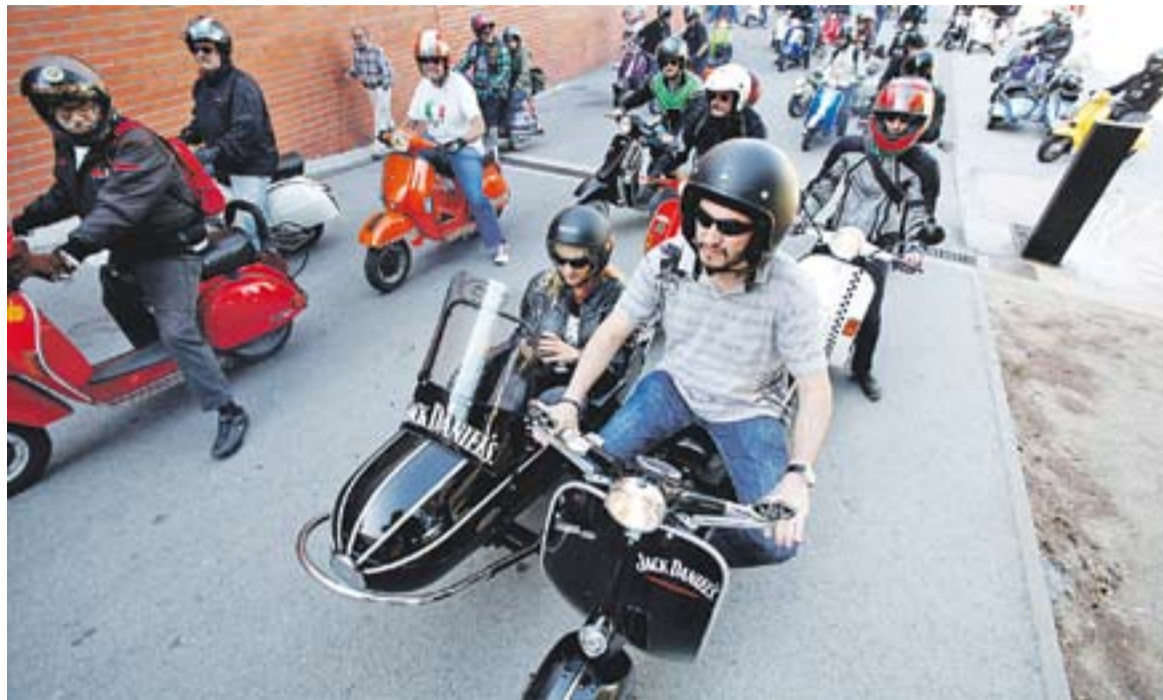
Sortida de Vespes a l'Espai Tolrà dissabte passat al matí.

Des de bon matí, les Vespes es van anar acumulant a la porta de l'Espai Tolrà per motiu de l'esmorzar que es celebrava per tots els inscrits. Més tard, va tenir lloc la Ruta Motera, en què els motoristes van pujar-se a les Vespes i van anar a Sant Llorenç de Munt i l'Obac. Un cop van tornar al migdia, es va fer una paellada en què