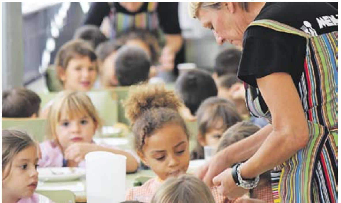
Imatge del menjador escolar del Sant Esteve la setmana passada.

Gràcies a aquesta subvenció, l'Ajuntament cobrirà les sol-