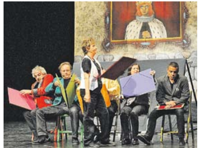
© 'El Retaule del flautista' es torna a representar aquest diumenge. || J. GRAELLS

El col·lectiu Grapa mantindrà oberta una exposició sobre l'obra del pintor Valls-Areny del 10 al 31 d'octubre, "la programació sardanista també té cites destacades durant la tardor, com l'aplec o la diada sardanista" , Martínez. A més, els espectacles teatrals es completaran a la Sala de Petit Format amb la reposició, de l'1 al 17 de novembre, de l'obra de la companyia Entre Cametes Burundanga , "que tant èxit va tenir en la seva estrena" . També cal destacar les programacions d'activitats obertes de la Biblioteca Antoni Tort i la Ludoteca Les 3 Moreres. +