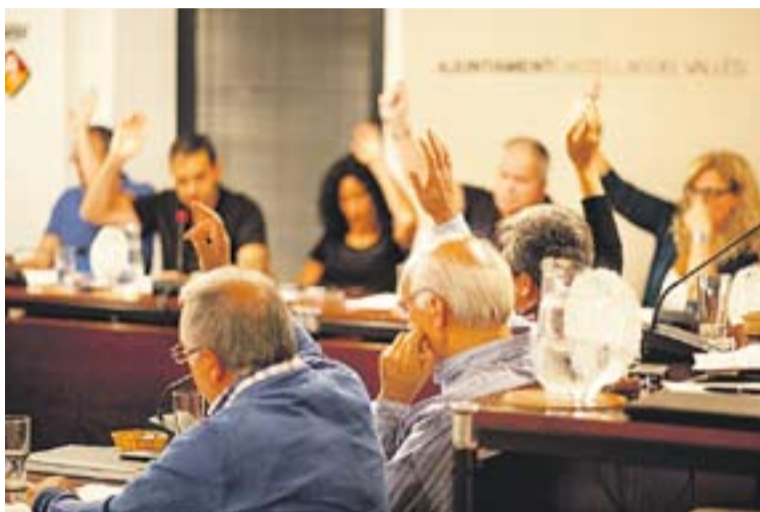
Una votació al ple de dimarts passat.

Després d'aprovar per unanimitat la revisió de l'ordenança de sorolls i vibracions, i el conveni intermunicipal per a la prestació del servei de taxi que regularà la prestació conjunta d'aquest servei a Castellar, Polinyà, Sant Quirze i Saba-