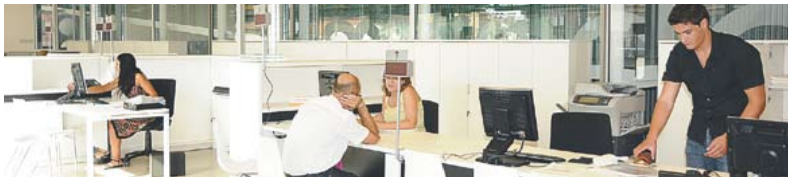
El Servei d'Atenció al Contribuent de Castellar del Vallès, ubicat a El Mirador.