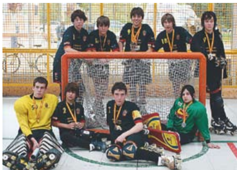
© L'aleví A del HC Castellar va quedar campió de Catalunya i segon d'Espanya. || J.G.