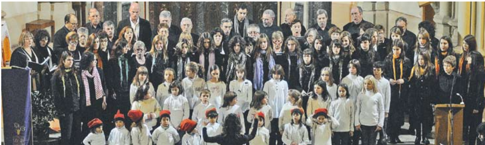
Actuació de les Corals Sant Esteve i Xiribec durant el tradicional concert de Nadal.

La Coral Sant Esteve, la Xiribec, la Sant Josep, l'Escola Torre Balada, Espaiart i l'Estudi XX omplen de música aquestes dates