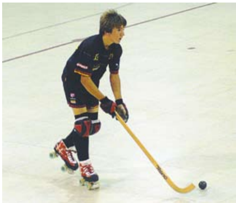
L'infantil A és un dels equips que s'ha classificat per la següent fase.

L'eliminatòria, sense dubte, més igualada de totes va ser la de l'aleví. Després d'haver quedat primers de grup, els tocava també el Sant Cugat i el 3 a 4 aconseguit al partit d'anada els va valer l'accés. Els castellarencs van igualar aquest cap de setmana a tres a la tornada en un enfrontament vibrant en el qual van poder fer