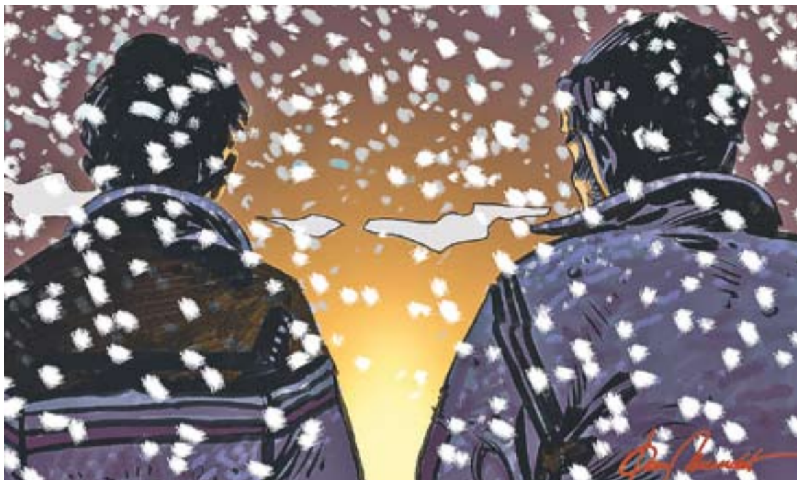
© Fum, fum, fum... || JOAN MUNDET

d'una festa pagana, sinó que el clima cristià del moment va anar canviant el sentit de l'antiga festa del Natalis Solis Invicti. Molts elements populars nadalencs no són als evangelis, sinó que deuen venir dels apòcrifs o