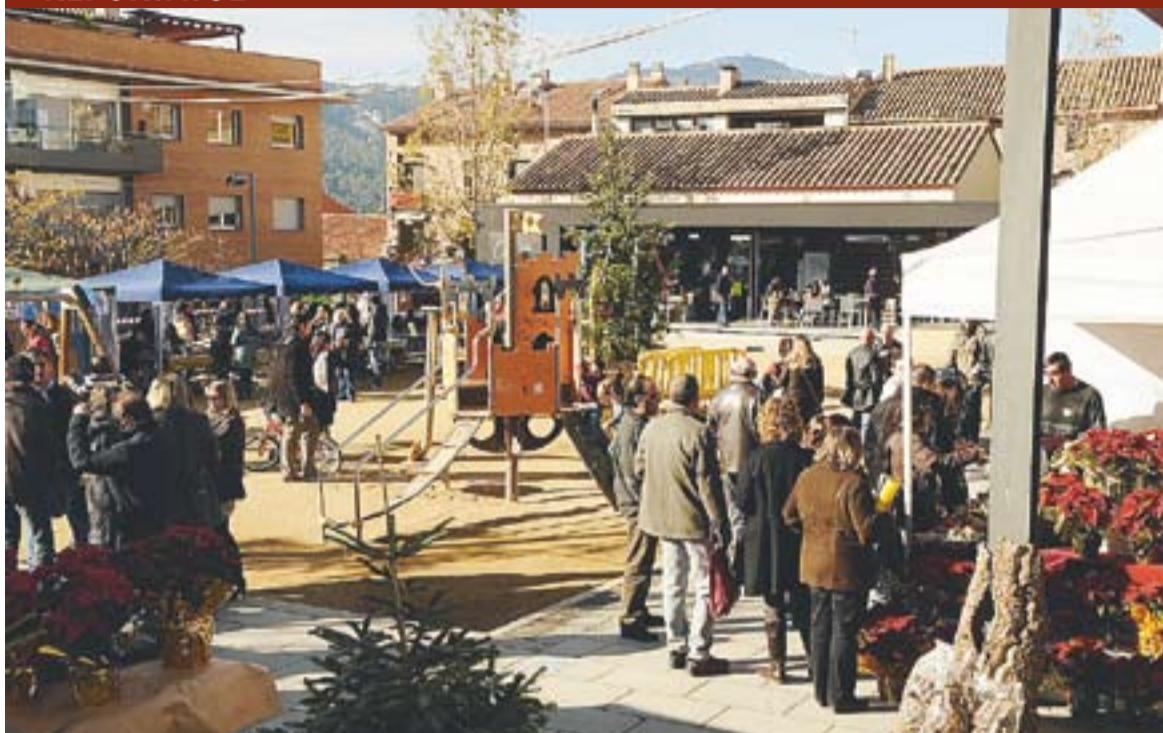
© La plaça Calissó, punt central de les activitats de la Marató. || JOSEP GRAELLS