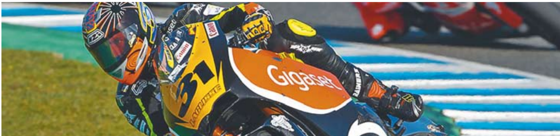
© El pilot de motociclisme Carmelo Morales ha tornat a fer història amb un nou doblat aquest 2010: el Campionat d'Espanya i el Campionat d'Europa de Velocitat. || TEAM LAGLISSE