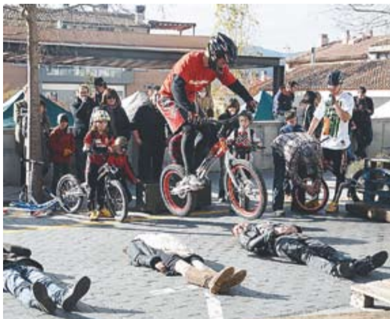
El bicictrial va ser una de les activitats de més èxit.

El punt calent de la solidaritat castellarenca es va ubicar a la plaça Calissó: durant tot el diumenge es van organitzar diferents actes com, per exemple, exhibi-