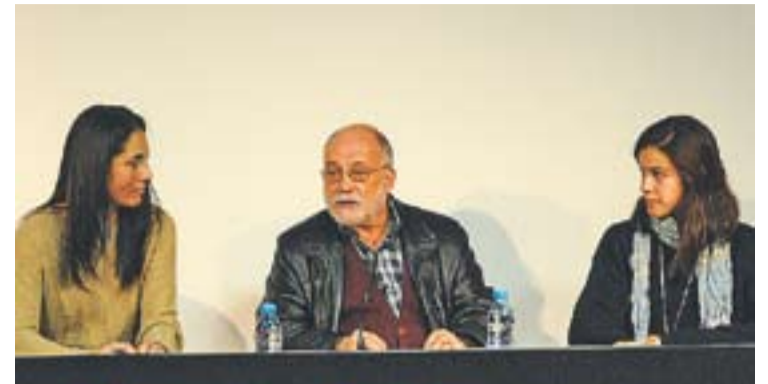
© Oliveres, enmig de dues alumnes a l'acte que es va realitzar a l'Auditori. || J.G.

El recorregut del projecte castellarenc, que ja s'ha exhibit a la televisió grega, no acaba al certamen de Pyrgos. A proposta dels alumnes, el curt es presentarà a altres concursos i festivals de cinema amateur, com és el cas del de València o Tarragona. +