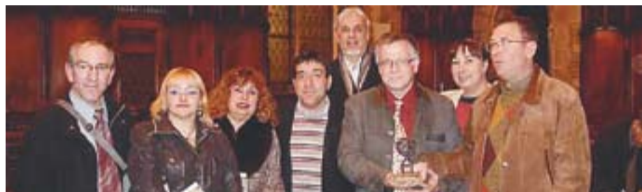
Lliurament del premi als Pessebristes a l'Ajuntament de Barcelona.

ESTUDI XX EN CONCERT || De cara al diumenge de Sant Esteve, l'Estudi XX Cor farà un concert nadalenc a l'Auditori, tocant tant el ves-sant religiós com el més popular i creant un clima de serenitat i alhora d'esperança. +