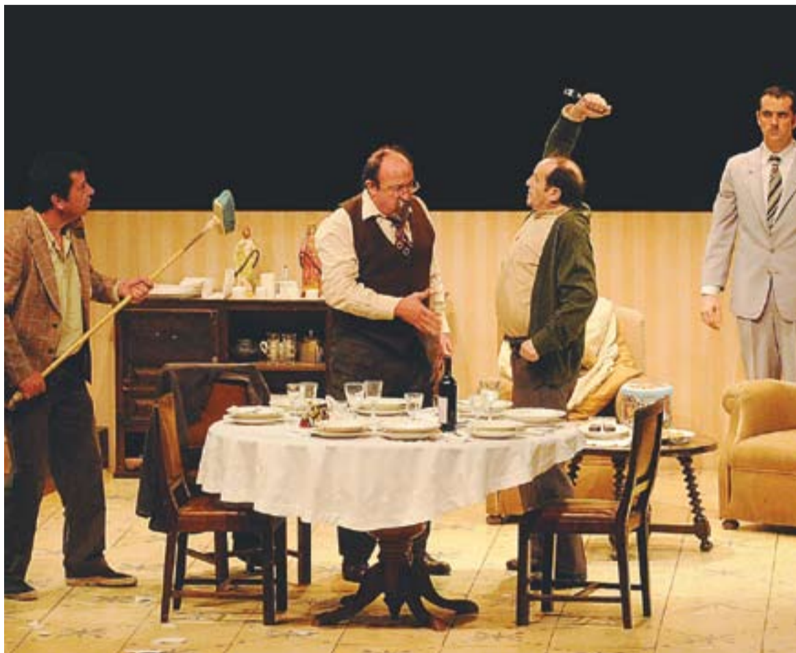
⊙ L'obra de teatre 'Natale in casa Cupiello' va ser l'espectacle més vist: va atraure 250 espectadors. || JOSEP GRAELLS

Aquesta bona dada confirma que l'auditori es consolida com la sala principal d'espectacles a Castellar. El balanç de la Temporada estable és molt positiu, ja que mai s'havia arribat a una xifra d'espectadors tan alta. S'iniciava la temporada amb Un déu salvatge . Continuava la música de l'orquestra de cambra Terrassa 48 amb L'efecte Mozart . Al novembre es va programar la dansa de la cia. Art Transit Dansa. Després, arribaria l'obra La casa sota la sorra amb