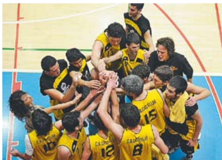
Els jugadors del CB Castellar celebren l'ascens al Prat.