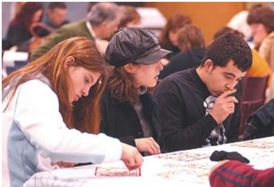
Sessió de Quinto a la Peña Solera en una edició anterior.

CASALS D'HIVERN || D'altra banda, a Castellar també s'hi han organitzat jocs i d'altres activitats per als infants i joves del municipi. D'una banda, l'Ajuntament posarà en marxa els Casals d'hivern el 27 de desembre. L'oferta s'adreça a nens i nenes de P3 a 6è de primària i tindrà lloc els dies 27, 28, 29, 30 i 31 de desembre i els 3, 4 i 5 de gener, de 9 a 13.30 hores. D'altra banda, el Moviment de Colònies i Esplai també ha preparat un casal del 27 al 31 de desembre i del 3 al 5 de gener per a infants de 4 a 12 anys i per a joves de 12 a 14, de 10 a 13.30 hores. L'Esplai Sargantana, per la seva banda, també ha organitzat una proposta divertida: la Festa de la Llufa, que tindrà lloc el proper 28 de desembre, coincidint amb el Dia dels Sants Innocents. Enguany, les activitats tindran lloc entre les 10 i les 13 hores. Hi haurà xocolatada, cançons, danses i actuacions amb el grup d'animació Llamàntol Fúcsia.