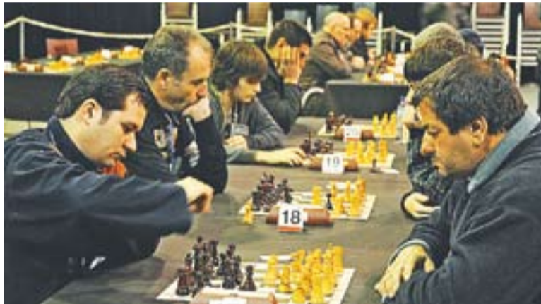
Un moment del torneig d'escacs de dissabte passat.