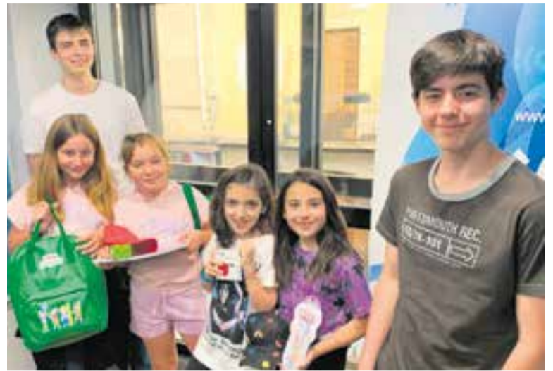
Els equips de Les Especiales i Les Tres Maries amb els presentadors, en la final.