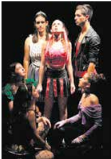
Imatge del musical 'Six'.

El creixement de les ciutats va provocar que moltes d'aquestes creus, aixecades originalment a l'exterior de pobles i ciutats, acabessin integrades en el seu nucli urbà. ✦