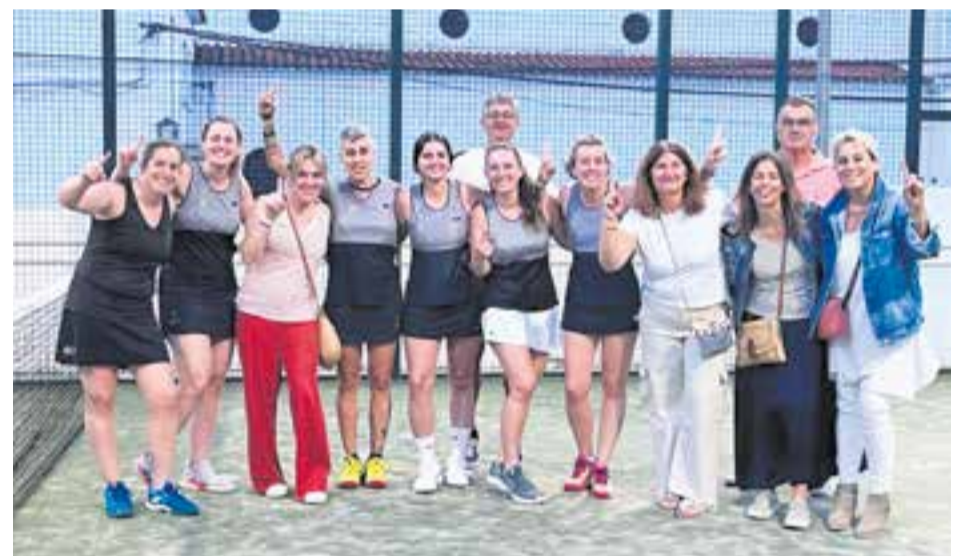
L'equip B de Racó Esports jugarà la temporada que ve en la 1a categoria de la Lliga Catalana.

L'equip A de Racó Esports ha perdut la categoria a 3a, on la Penya Arlequinada B jugarà el play-off. El CT Castellar A ha acabat 5è a 3a g. B. + || REDACCIÓ