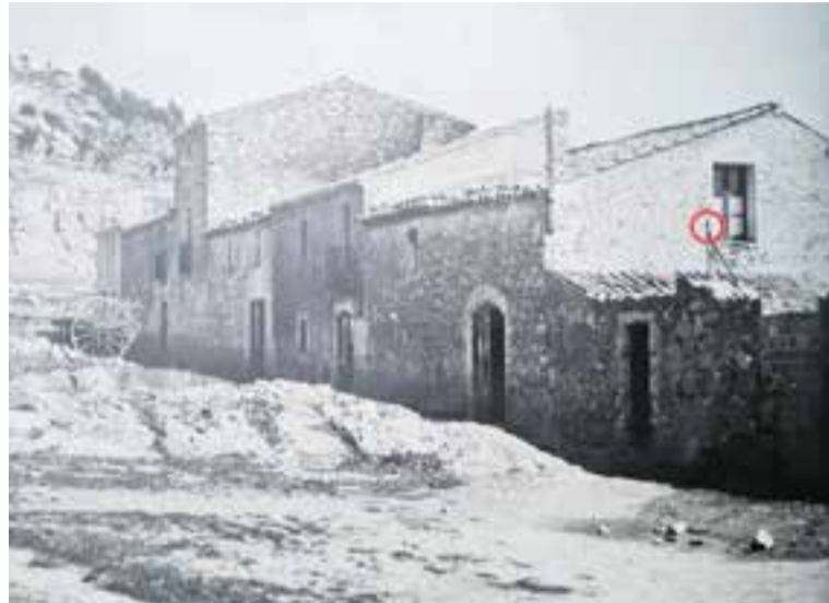
A l'esquerra, la creu de terme reproduïda a 'El llibre de Castellar', de Ll. Vergés i Solà, a Cal Pèlachs. A la dreta, la rèplica actual.

Aquestes creus estan documentades a Catalunya a partir del segle X. Es posaven als límits de parròquies, de propietats privades o per delimitar l'espai destinat a enterraments.