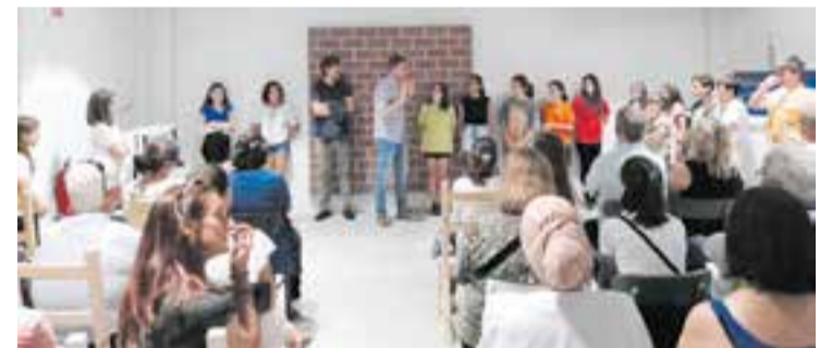
La cloenda dels consells d'Infants i Adolescents es va fer a La Fàbrica.

Enguany, el Consell d'Infants de Castellar ha estat format per 21 alumnes de 5è i 6è de totes les escoles del municipi, mentre que el Consell d'Adolescents ha estat format per 4 joves. + || REDACCIÓ