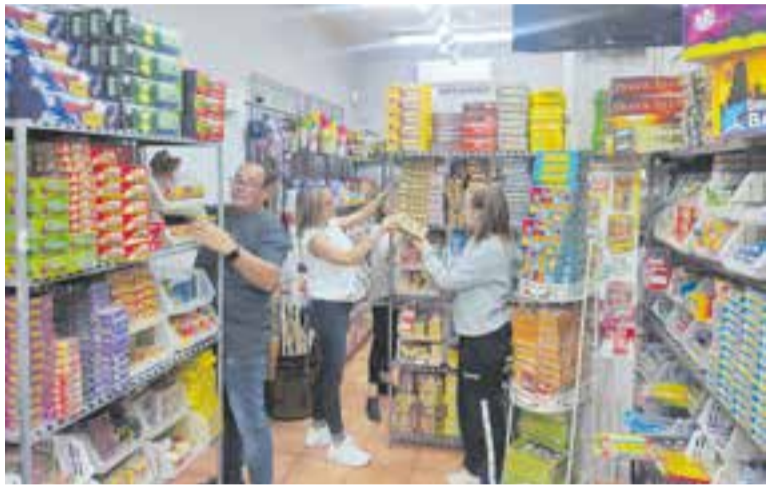
La família 'Davidana' posant la botiga a punt abans de començar l'oferta 2x1.

Els petards, com la resta de productes, també s'han apujat de preu