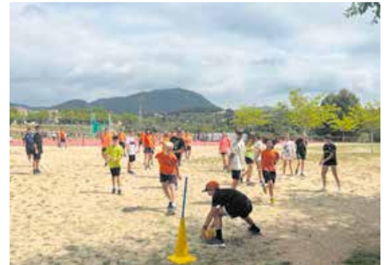
La jornada va comptar amb diverses proves de caire no competitiu.