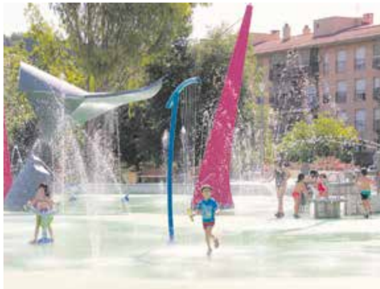
Una imatge d'arxiu de l'àrea de jocs d'aigua de la plaça Catalunya.

La instal·lació, entesa com a refugi climàtic, tindrà un horari més limitat