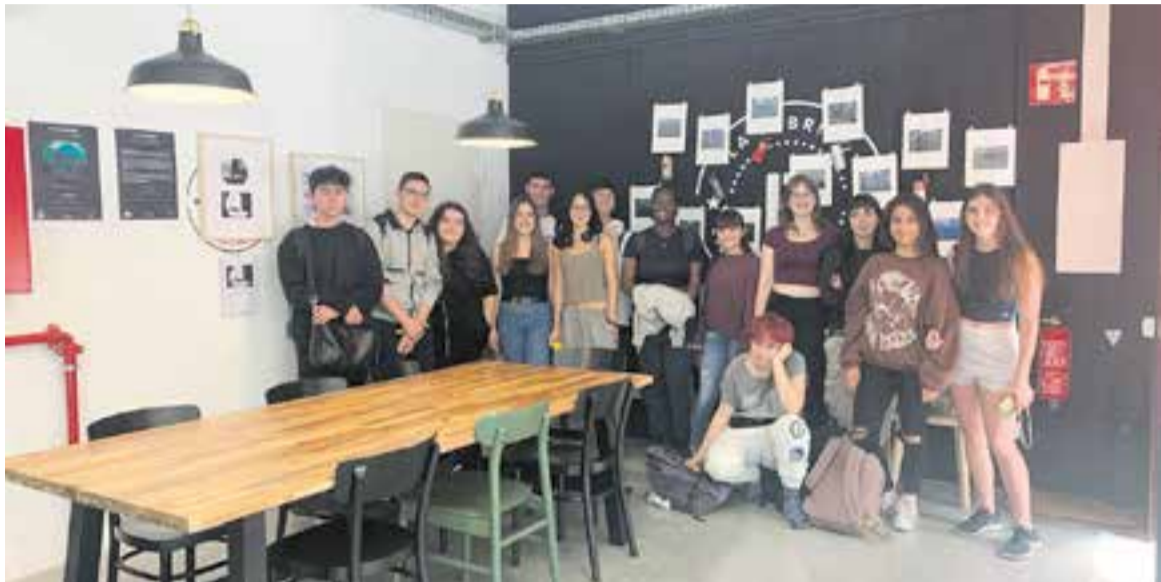
L'alumnat de 1r de batxillerat de l'Institut Castellar estrena la mostra fotogràfica 'CityScapes' a La Fàbrica.

L'Institut Castellar va inaugurar, el 5 de juny, el projecte CityScapes , un projecte que neix del treball d'investigació i de l'experimentació desenvolupada per un grup d'alumnes de 1r curs de Batxillerat Artístic d'aquest institut durant un període de quatre mesos.