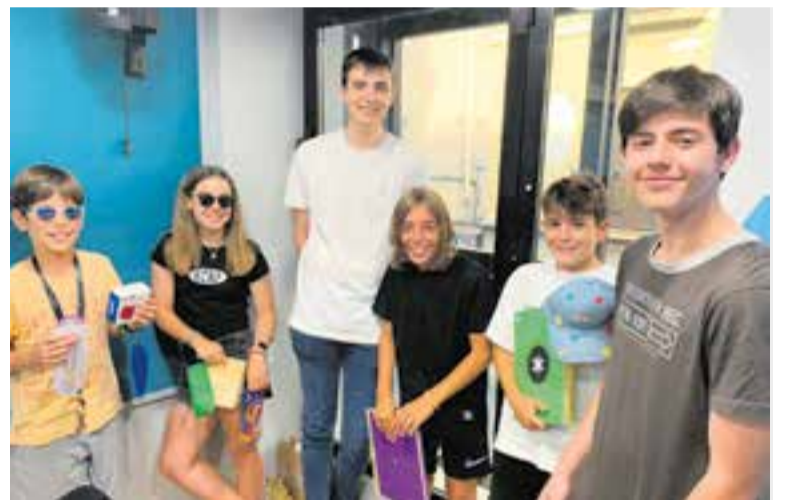
Els equips de B&C i CR en la final del programa QKK! de Ràdio Castellar. || R. G.