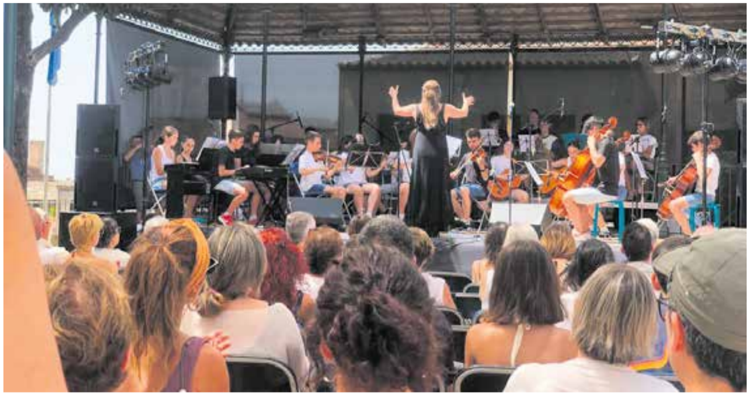
Moment de la celebració del Dia Mundial de la Música, l'any 2022, als Jardins del Palau Tolrà. || A. PARERA

Enguany hi participen les escoles i entitats Acció Musical Castellar - Artcàdia, Associació Casa d'Andalusia de Castellar del Vallès (Aires Rocieros Castellarencs), l'Associació de Jubilats i Pensionistes de Castellar del Vallès (Coral Olivera), la Castellar Swing Band, el Cor Sant Esteve, la Coral Pas a Pas, la Coral Xi-