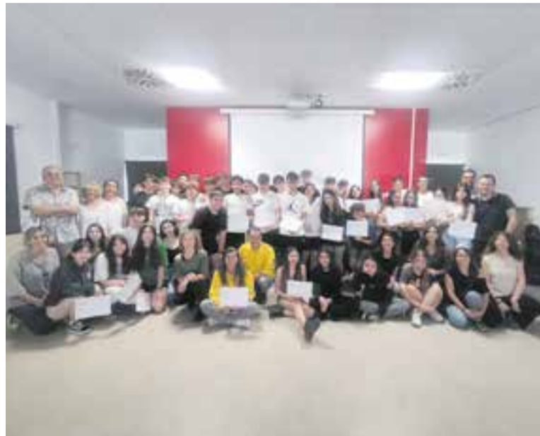
A l'esquerra, foto de família a l'acte de cloenda a l'Institut Escola Sant Esteve. A la dreta, un grup d'alumnes de FEDAC Castellar explicant la seva experiència.