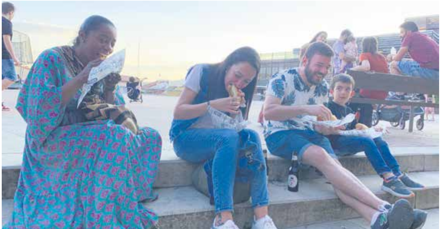
Una família degusta a la plaça d'El Mirador la proposta del Frankfurt Castellar, un frankfurt amb pulled pork de Cárnicas Merche, ceba d'Agrosans i salsa especial

A partir de les 19h de la tarda, per 4 euros, el Corretapa ofereix una beguda i un platet. El maridatge amb la tapa és variat: a gust del consumidor i del restaurador. “Alguns establiments ofereixen cervesa, d'altres cava, aigua i refrescos, o fins i tot una copeta de vi” , va apuntar Màrmol. Totes les parades de la ruta disposen d'un programa de mà per consultar tots els detalls dels plats, la ruta o els horaris, informació que també es pot trobar a l'aplicació del Corretapa o als perfils d'Instagram