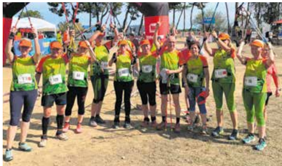
L'equip del Centre Excursionista present en el Campionat de Catalunya de Marxa Nòrdica.