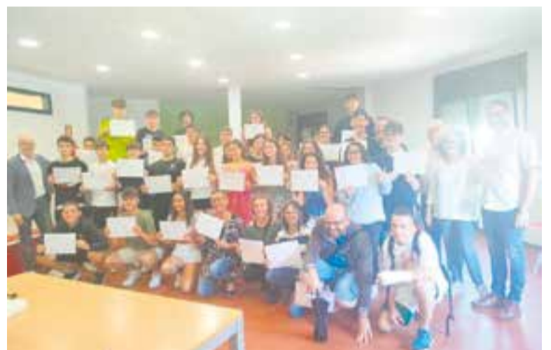
Alumnes, professors i entitats del servei comunitari de El Casal.