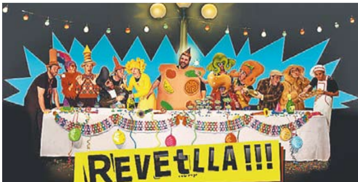
© Cartell de promoció de l'espectacle de la Cia. Deparranda titulat 'Revetlla'. || CEDIDA

lla és una plaça on hi ha un fanal d'estil modernista amb llums de colors penjats. Als laterals, uns plafons simulen la col·locació d'elements pirotècnics, així com el faristol d'una petita orquestrina. Aquests mateixos plafons són reversibles. En l'altra cara s'intenta simular un obrador d'una pastisseria, per a l'escena de la coca de Sant Joan.