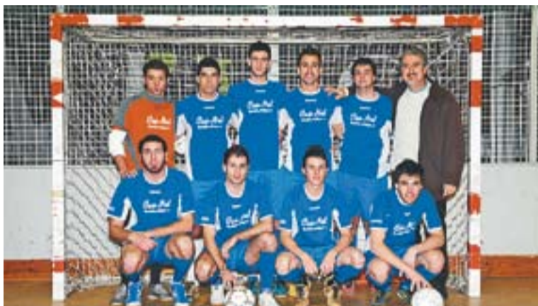
⊙ A l'esquerra, l'equip Manteniments, líder de la lliga social després de guanyar al Cas-Net -fotografia de la dreta-.