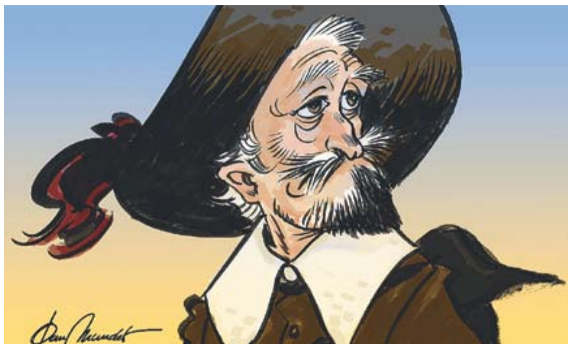
© El mestre de Cervera. || JOAN MUNDET

Evidentment que cada centre, en funció de les seves necessitats, aplicava d'una forma o altra aquesta normativa. A vegades, però, aquesta aplicació no encaixava en el text de la llei i grinyolava des del punt de vista legal. El nou decret d'autonomia de centres pretén obrir una mica la porta per poder dissenyar l'organització interna d'un centre en funció del seu projecte educatiu.