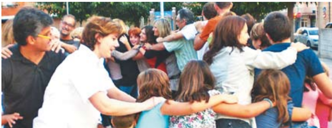
© Una activitat de carrer del Moviment de Colònies i Esplai. || ARXIU

L'esplai també continua amb l'espai lúdic de les diverses colles, muntant activitats de lleure educatiu per infants, nois i noies dels 4 als 14 anys. Es porta a terme cada dissabte, de les 9 a les 14 hores. L'agrupament dels inscrits es fa per edats i s'assigna un monitor o monitora per a cada grup. +