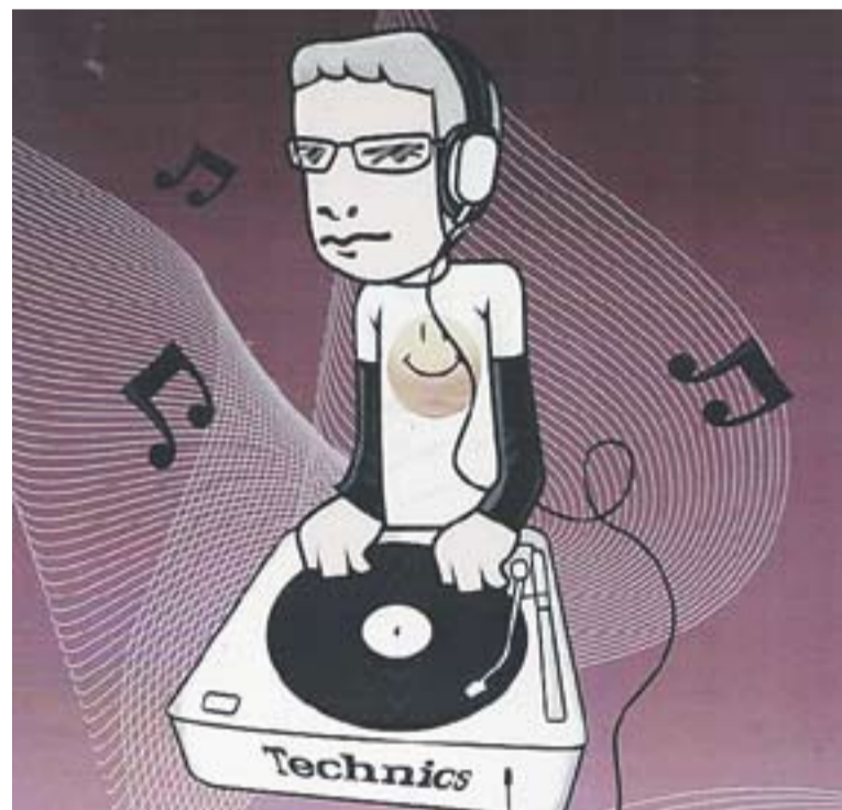
Els Selector Retrodisco són els convidats per Carnestoltes, el dia 13.

Dijous 25, a Artismónis es presentarà el guanyador del Primer concurs de monòlegs Calissó. Divendres 26 tornen Calissó Jam Band i dissabte s'estrenen les DJ Lollyloops. Diumenge 28, es podrà escoltar música i poemes amb Núria Feliu. +