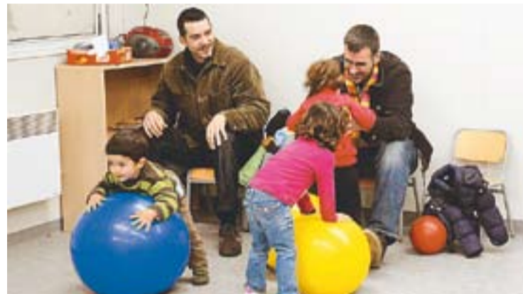
Una de les classes d'El Sol i la Lluna durant les jornades de portes obertes.