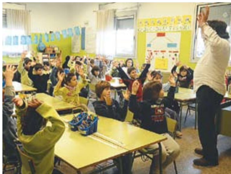
© Els alumnes del CEIP Sant Esteve seguint les instruccions del Bufalletres. || J.G.

molt bons resultats i segons en ha comentat el Bufalletres els nens de Castellar hi han mostrat molt d'interès”. En conjunt, doncs, la Guia Didàctica són 650 activitats de perfils molt diferents i que, de moment, quan només ha passat un trimestre de curs, “han funcionat força bé amb una molt bona participació”. Es tracta de diferents propostes perquè els més petits coneguin l'entorn, com són les visites a l'hort o al mercat, però també la cultura amb obres de teatre o audicions de música. +