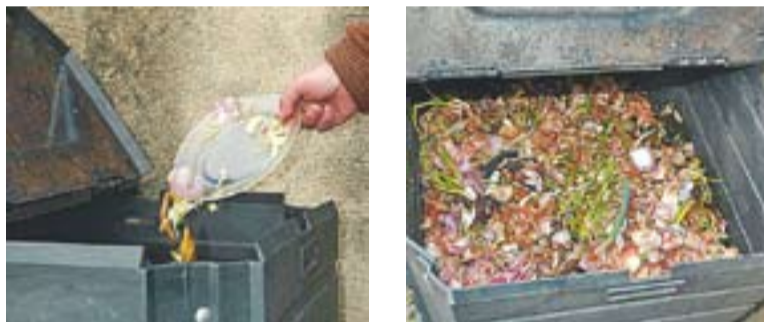
© Imatge dels compostadors casolans instal·lats a Castellar. || ARXIU

de tractament”, diu Canalís. L'Ajuntament va iniciar l'experiència pilot per al foment del compostatge casolà durant la 8a Setmana Verda, que va tenir lloc durant el mes d'octubre del 2003. Des d'aleshores, a Castellar s'han concedit un total de 81 subvencions: sis durant el 2003, 11 durant el 2004, 15 l'any 2005, nou el 2006,