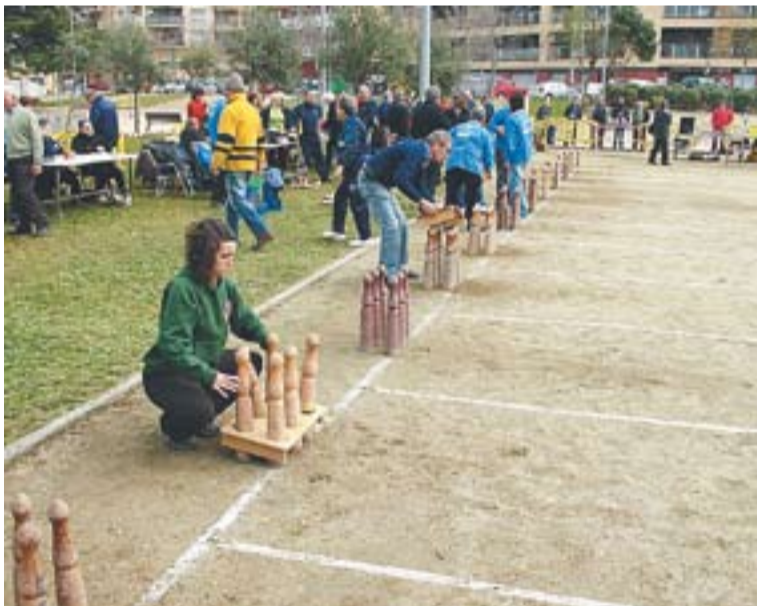
⊙ Imatges de la jornada disputada diumenge a Castellar.