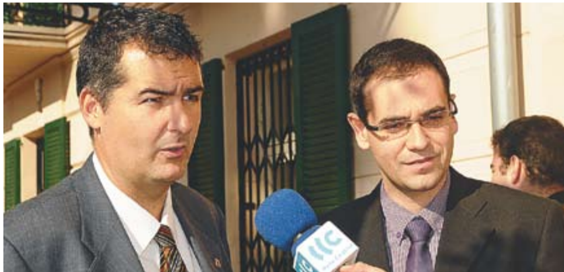
© Jordi Bosch, Secretari General de Telecomunicacions, i l'alcalde Ignasi Giménez durant l'atenció a la premsa. || JOSEP GRAELLS

Durant les hores que va ser a Castellar, Bosch va poder veure de primera mà, acompanyat per l'alcalde i per diferents regidors del consistori, l'evolució de les obres d'aquest espai de la plaça Major que ha de ser un centre cultural, educatiu, formatiu i cívic que ha de generar activitats de coneixement. Aquest equipament treballarà també per potenciar l'accés de la ciutadania a la societat del coneixement i permetrà augmentar les capacitats innovadores de la població.