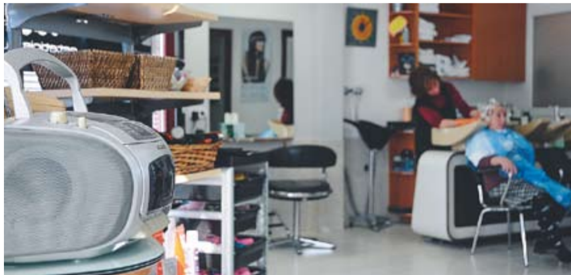
⊙ Les perruqueries han demanat als seus clients que es portin la música des de casa i que sigui original.

La Societat General d'Autors i Editors, la SGAE, no deixa indiferent a ningú. Fa pocs dies saltava la notícia que les perruqueries catalanes havien començat una guerra contra ells per la tarifa que ara exigeix l'entitat a aquests establiments. Moltes perruqueries de la comarca del Vallès Occidental han començat a penjar cartells en els quals es demana als clients que es portin la música de casa i que sigui original. I és que el fet que les perruqueries hagin de pagar per tenir connectada la ràdio no deixa de sorprendre als perruquers de la vila. Per exemple, Ja-