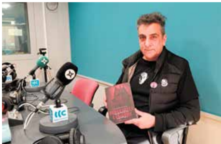
Flores presentant el seu llibre a Ràdio Castellar. || M. ANTÚNEZ