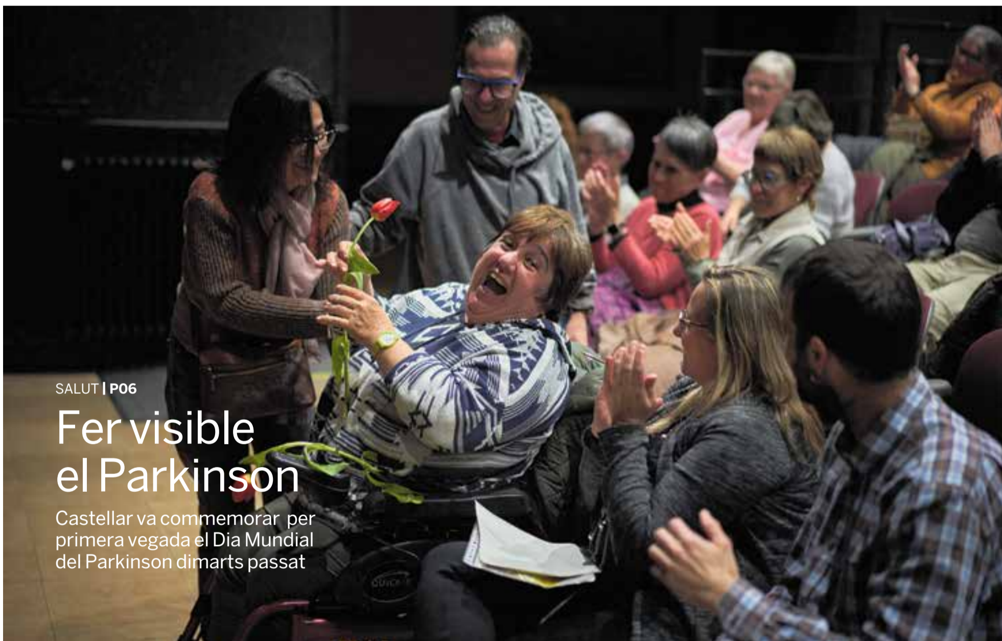
Durant l'espectacle 'Perfectamente im-perfectos', que va omplir l'Ateneu, es van regalar tulipes entre el públic, la flor que simbolitza la malaltia de Parkinson, que afecta 30.000 persones a Catalunya.

Castellar va commemorar per primera vegada el Dia Mundial del Parkinson dimarts passat