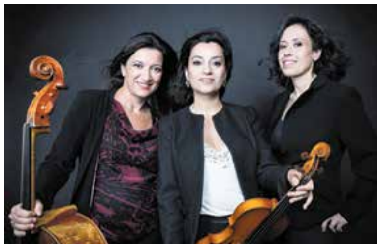
El Trio Freixas protagonitza el concert de les Audicions Íntimes del 18.

El Trio Freixas va debutar al festival Barcelona Obertura el març del 2023 amb un homenatge al compositor Jordi Cervelló. +