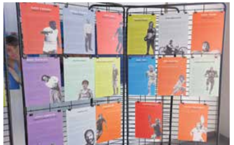
Imatge de l'exposició al vestíbul del Complex Esportiu Puigverd.

El Consell Comarcal del Vallès Occidental ha posat a disposició dels ajuntaments aquesta iniciativa comissionada per l'entitat Panteres Grogues amb l'objectiu que la ciutadania pugui conèixer exemples d'esportistes LGTBI+, juntament amb casos de discriminació i violència LGTBI-fòbiques. +