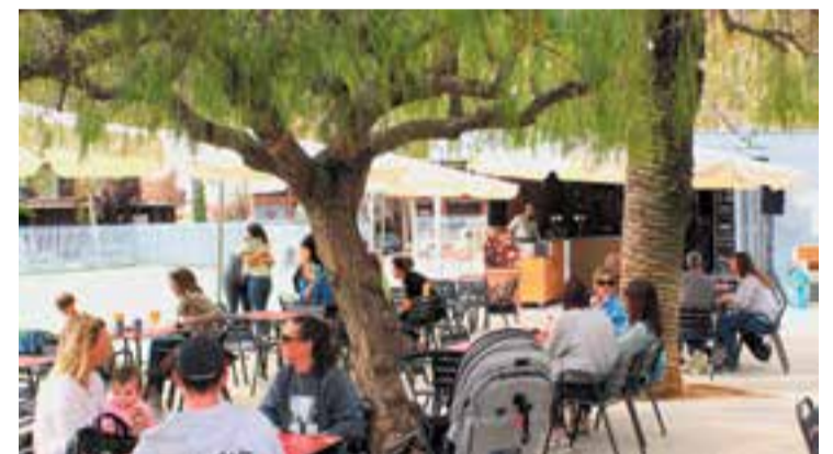
Un instant del vermut musical de dissabte passat.