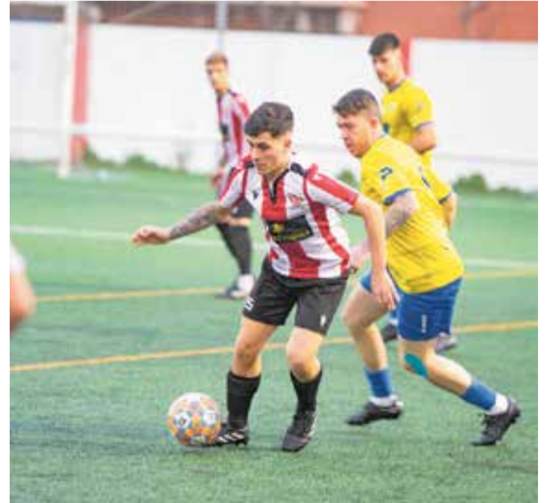
La UE Castellar suma tres derrotes consecutives després de Tàrrrega.

Tot i sumar la tercera derrota consecutiva i només un punt dels últims 15, l'equip manté la sisena posició, però veu com se li apropen els rivals per darrere, amb el Borges Blanques a un punt i el Sant Cugat a tres. El Júpiter no va aprofitar la derrota per ampliar l'avantatge, i va caure per 0-1 contra el Sant Cugat i continua un punt per sobre.