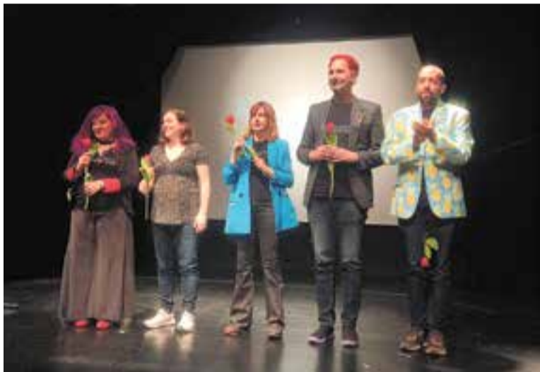
Els cinc humoristes de l'espectacle 'Perfectamente im-perfectos' a l'Ateneu. || C. D.

Èxit, de públic i de complicitat a l'espectacle 'Perfectamente im-perfectos'