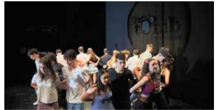
Alumnes de l'escola El Casal van fer dues exhibicions de dansa. || Q. PASCUAL

ca i salut emocional, entre d'altres. Aquesta edició va comptar amb la participació d'alumnes d'El Casal, El Sant Esteve, l'INS Castellar, el Bonavista i el Mestre Pla. Una de les propostes més sorprenents va ser justament la del Mestre Pla, centrada a explicar l'apadrinament que fa l'escola de ximpanzés maltractats al Congo. Aquest centre ha establert contacte amb el Projecte Jane Goodall, que permet apadrinar ximpanzés en situació de vulnerabilitat a canvi del reciclatge de mòbils. + || REDACCIÓ