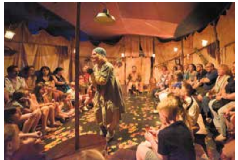
Un instant de l'obra 'Frederick' de Teatre al Detall. || CEDIDA

L'artefacte teatral que componien la posada en escena, la poètica del text i la interpretació dels actors va deixar bocabadats els més petits, i la metàfora dels temps en què la covid ens controlava l'existència va entendre els més grans. Sempre amb una delicadesa al Detall. ➔ || J. CLAPÉS