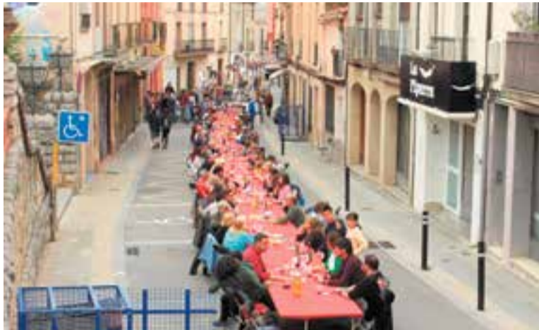
La taula que va acollir el veïnat al carrer Major.