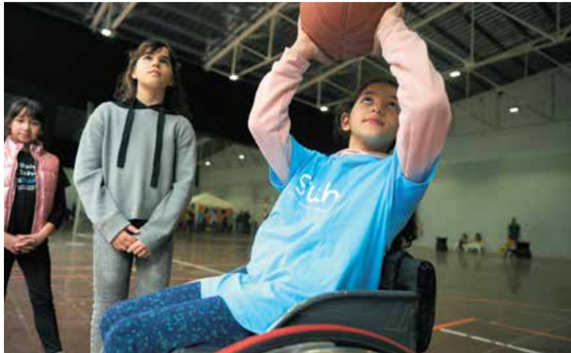
Enguany, l'Espai Firal torna a acollir activitats amb cadira de rodes, entre moltes altres pensades per a tothom.

Aquesta temàtica de l'oceà es treballarà durant tot l'any, i per això han creat uns personatges: la balena, l'estrella de mar, el cavallet... i cadascun tindrà la seva història. "L'estrella, per exemple, es mou molt poc, però per a ella no és un problema, perquè és així. El que ens agrada és que cada mes surti una història i que es puguin explicar a les escoles per treballar la diversitat i tots aquests aspectes que per a nosaltres són importants, i creiem que per a la societat també, perquè hi hagi un canvi de mirada" . De fet, des de Suma+ fan una crida de cara a la gent a qui li agradi escriure i vulguin fer petits relats: "Per escenificar les peculiaritats que fan que visquis d'una manera o una altra