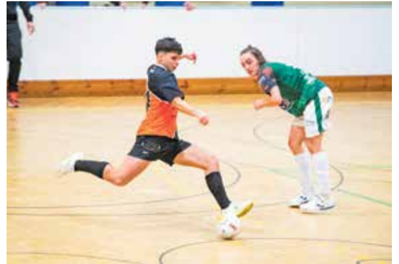
El futsal encara la recta final per aconseguir la salvació.