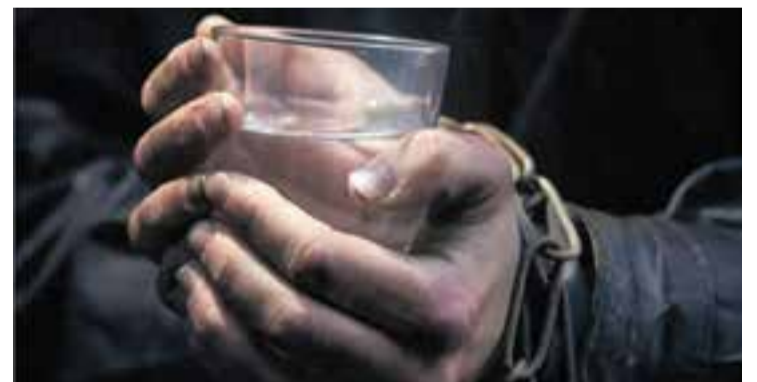
Fragment del cartell del film 'Un vas d'aigua per a l'Elio', de Pere J. Ventura. || Q. P.