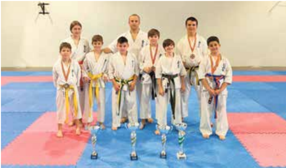
Els lluitadors del Club Kyokushin Castellar, amb els premis obtinguts a Santa Susanna.