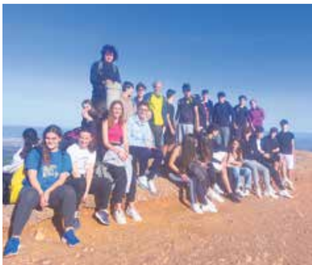
© Alumnat al cim del Montcau

Montserrat també és una font inesgotable d'inspiració literària. Des de temps immemorials, aquesta muntanya ha captivat la imaginació de poetes, escriptors i artistes.