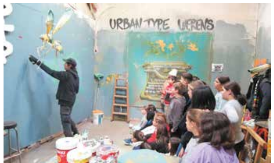
© El Werens ens mostra el seu taller i com elabora un dels seus símbols més característics.

Teo i Roger: "Em va emocionar poder pintar amb esprais i col·laborar amb el grafiti final"