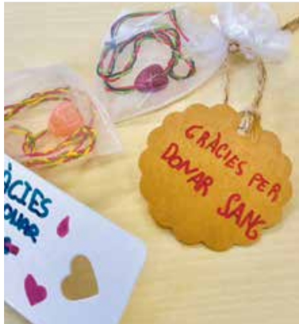
© Imatge del detall que els infants van fer per regalar als donants.