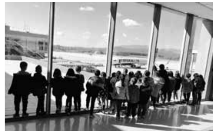
© Esbrinem els secrets de l'aeroport de Girona.