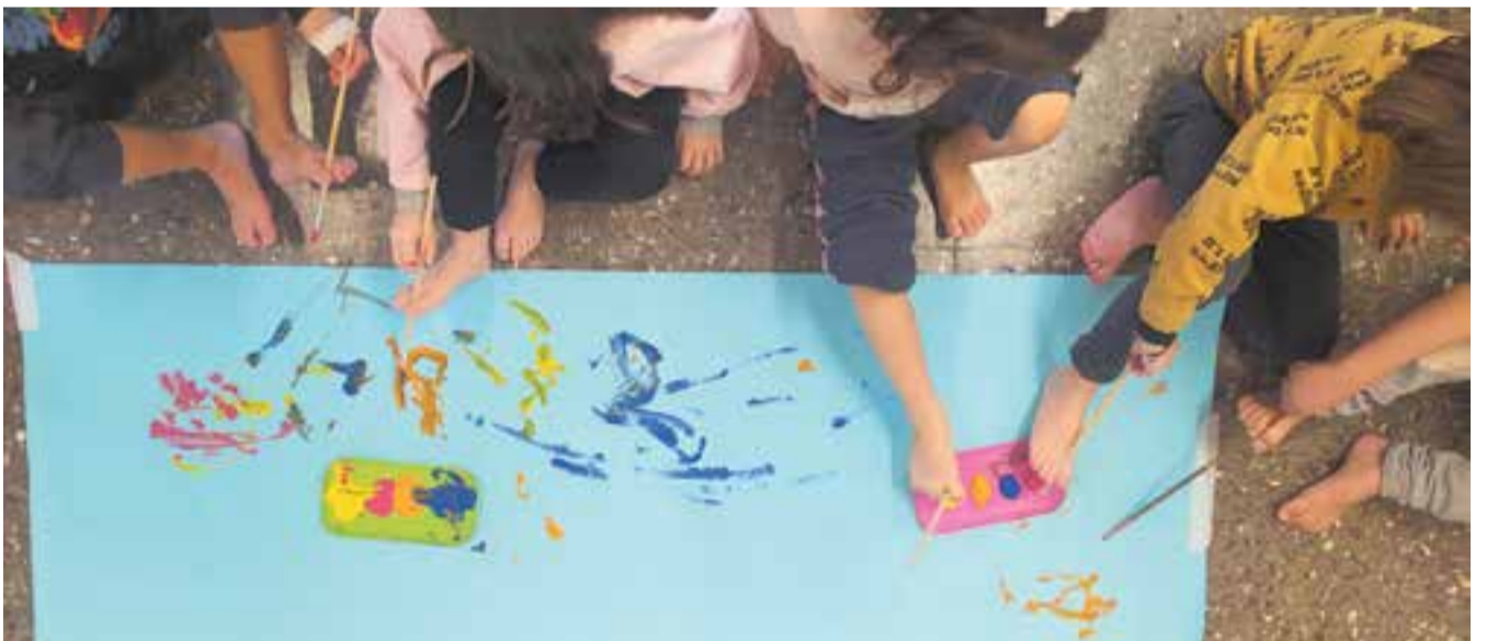
© Pintant amb els peus al taller de mobilitat reduïda.