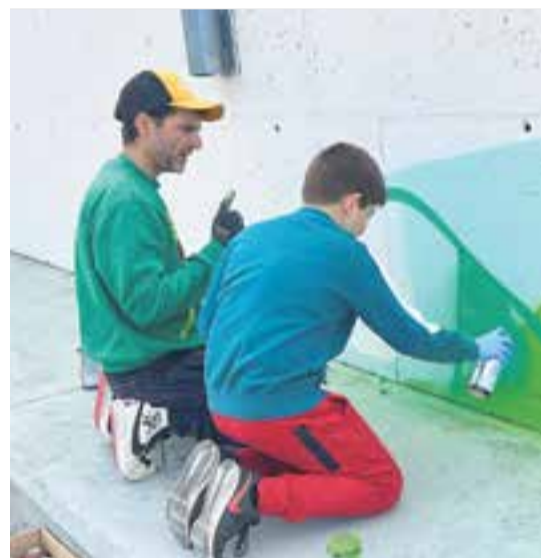
© El Tage53 ens guia per tal de portar a terme el nostre projecte final.