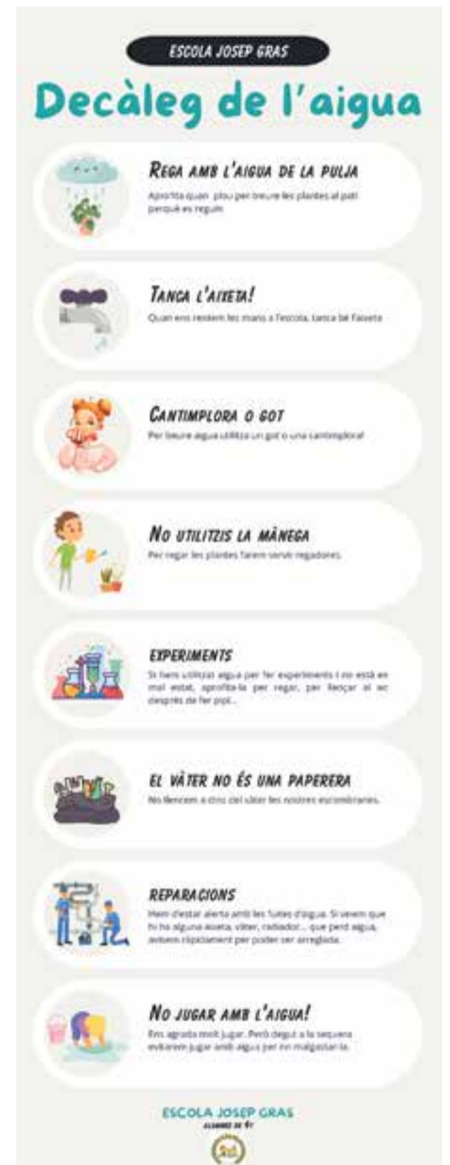
© Decàleg de l'aigua elaborat per l'alumnat de 4t de primària.

“Sigues el canvi que vols veure en el món”, Gandhi.