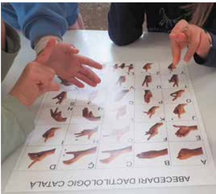
© Provant el nom amb l'abecedari dactilològic.