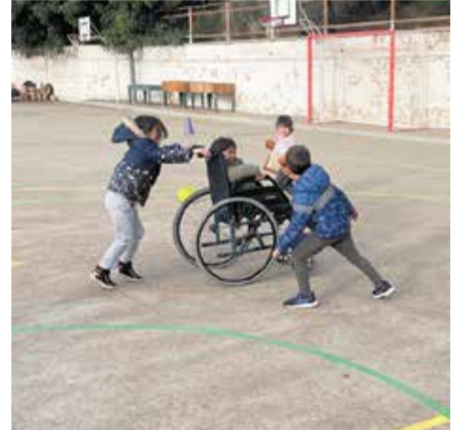
© Joc cooperatiu de mobilitat reduïda.