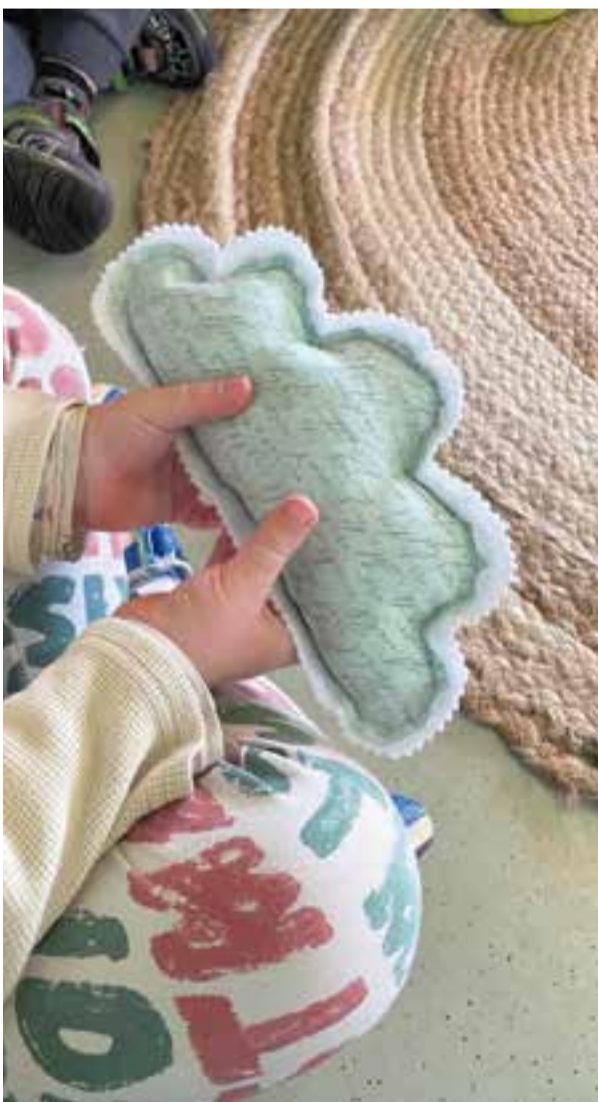
© L'objecte que dona la paraula a l5.