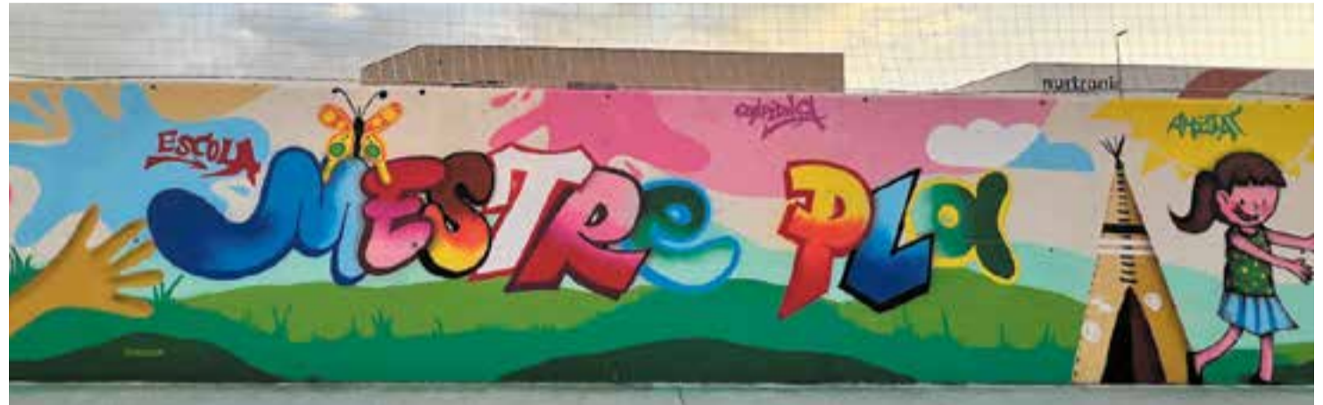
© Elaborem el producte final del nostre ProjectArt: un grafiti al pati de l'escola.

Vam finalitzar el projecte elaborant un grafiti al pati del nostre centre. Hi ha col·laborat tot l'alumnat de l'escola, tant en el disseny com en la seva creació, mitjançant aerosols. Simbolitza allò que més apreciem del nostre entorn escolar.