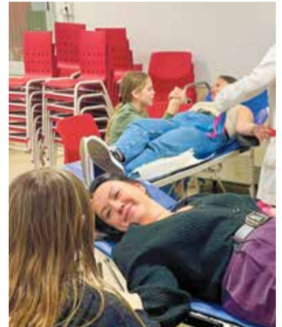
© Zona habilitada per fer l'extracció de sang al centre.