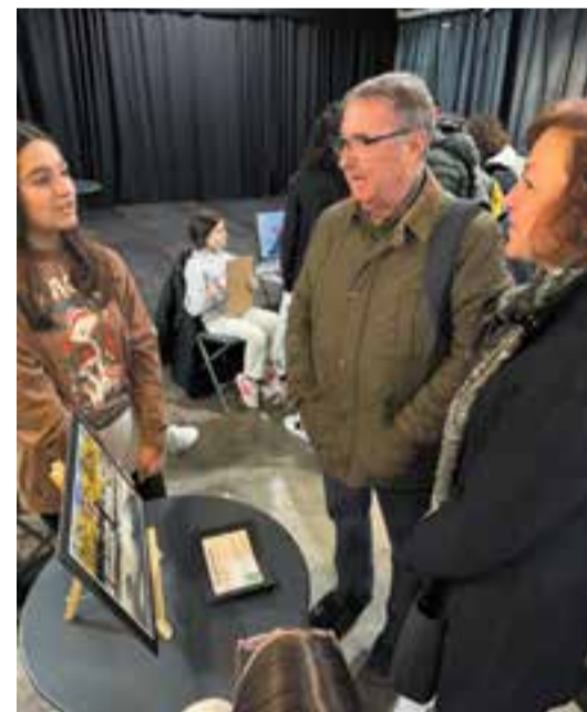
© Gran participació de les famílies habilitada per fer l'extracció de sang al centre.