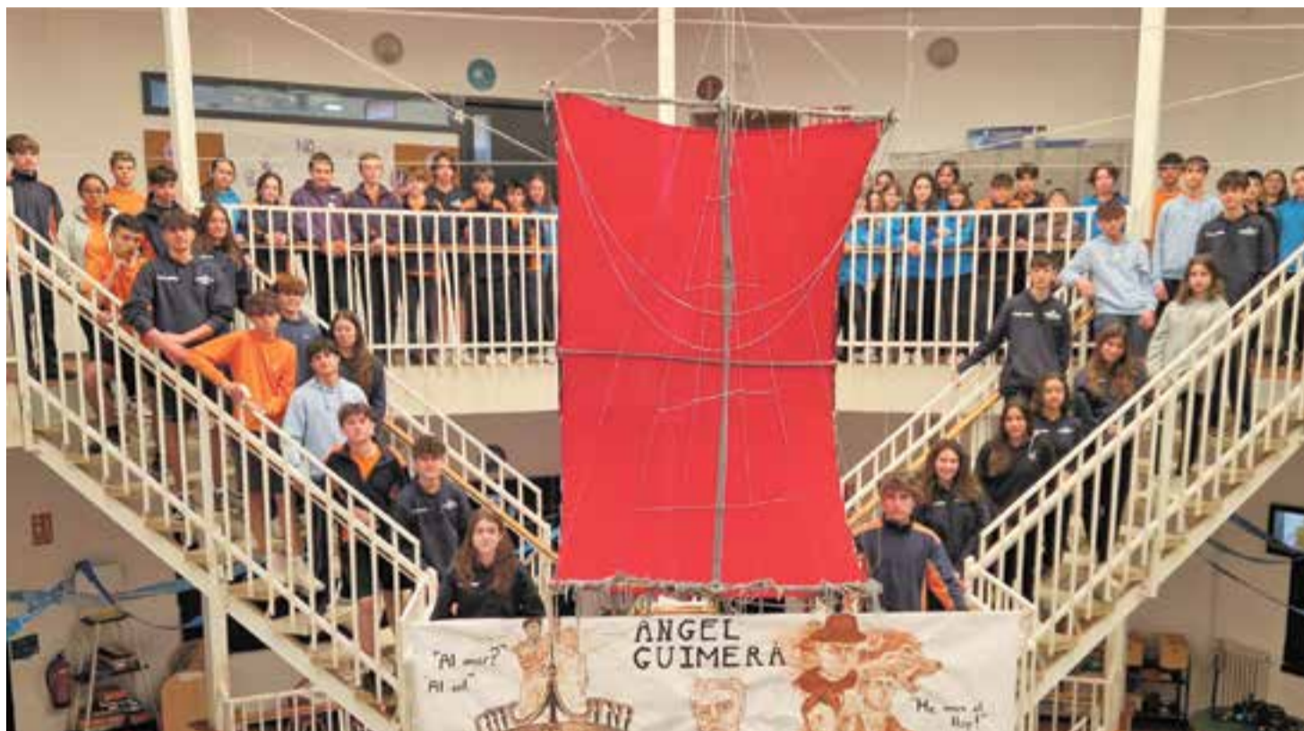
© Sant Jordi amb commemoració d'Àngel Guimerà.

Això només és un petit recull d'activitats que porten la insígnia d'El Casal, els valors i la felicitat de la qual ens hem impregnat durant tots aquests anys, la família en la qual hem crescut i que ens ha acompanyat sempre. És un segell que deixa empremta i que ens ensenya una altra manera d'ensenyar i d'aprendre.