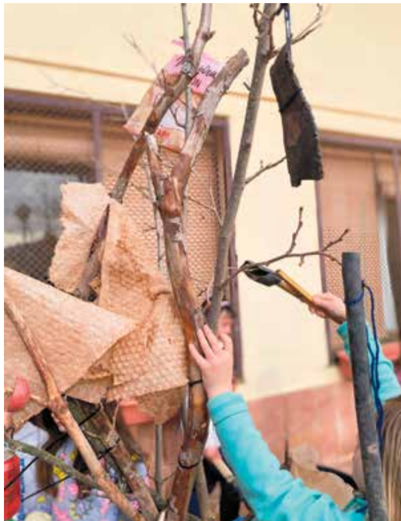
© Arbres de la brossa. Acció artística i reivindicativa sobre la recollida de brossa.

Tota l'escola fem projectes i ens en quedem al tinter, com la descoberta del