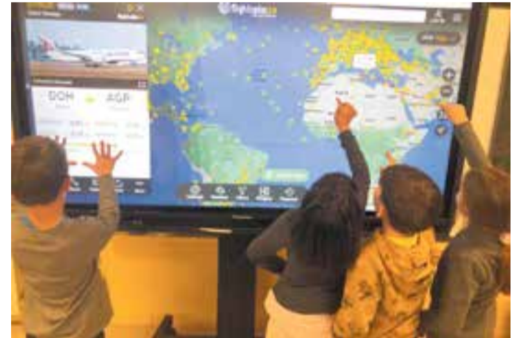
© Descubrim la informació dels vols en temps real.