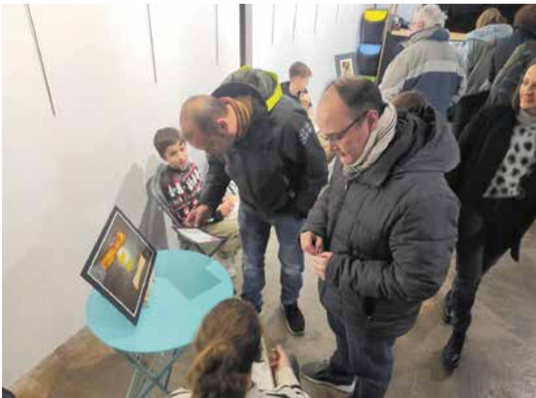
© Gran participació de les famílies habilitada per fer l'extracció de sang al centre.