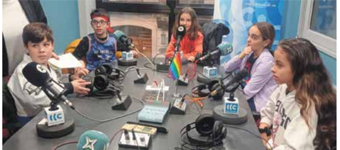
© Alumnat a Ràdio Castellar explicant la campanya de donació de sang.

Per informar i conscienciar la població vam elaborar cartells publicitaris i tríptics confeccionats per l'alumnat en què s'animava els castellarencs a fer aquest gest solidari.