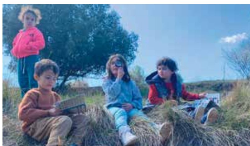
© L'entorn ens permet compartir i aprendre acompanyats.