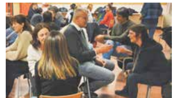
© Activitat de dinamització amb famílies de 6è.