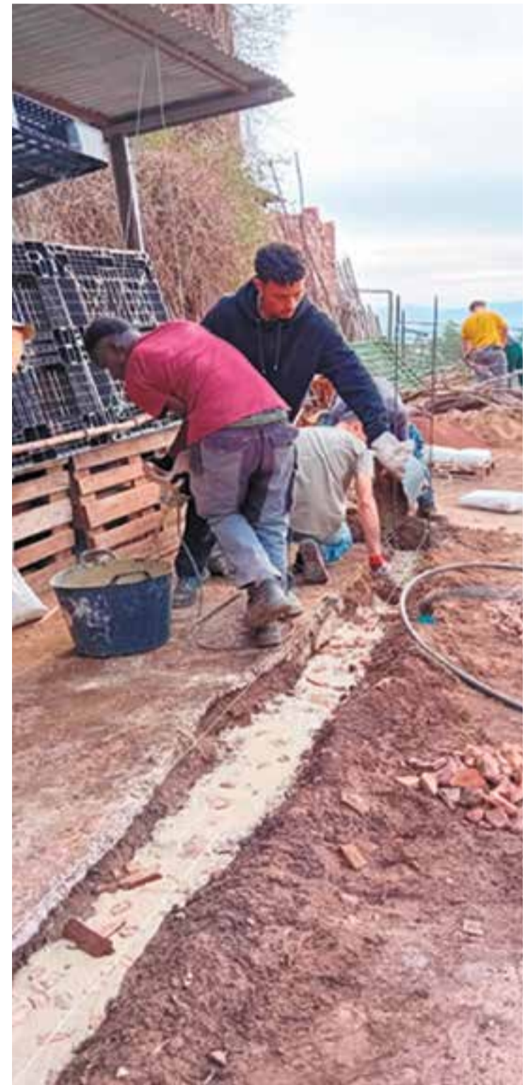
© Preparació dels fonaments del mur.