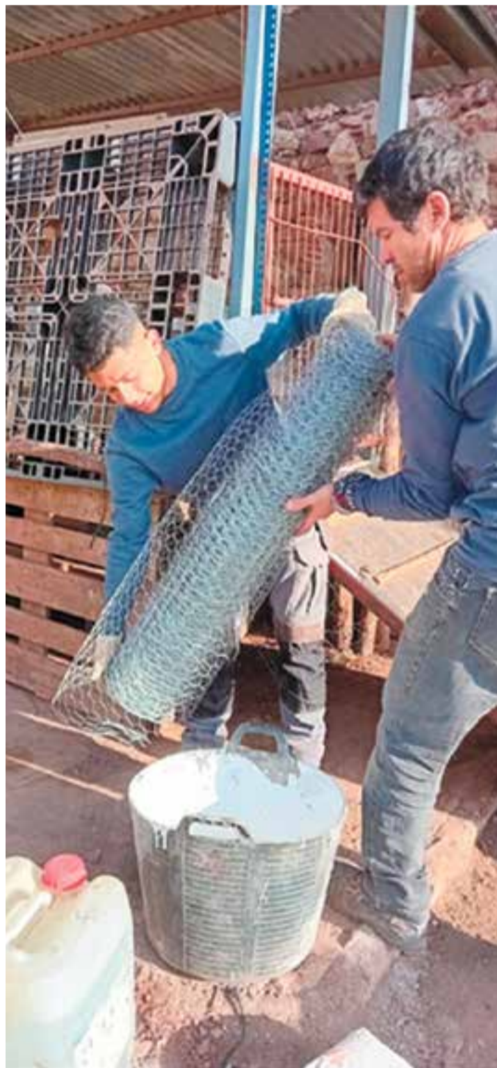
© Preparació de l'estructura del mur de la sala de muntar amb malla de galliner.

Durant aquesta setmana vam posar en pràctica el treball en equip amb la resta de l'alumnat del centre, vam fer servir la maquinària en un espai real de treball i els epis de forma correcta per a cada projecte i situació. L'any que ve esperem repetir, perquè ha sigut una experiència molt positiva!