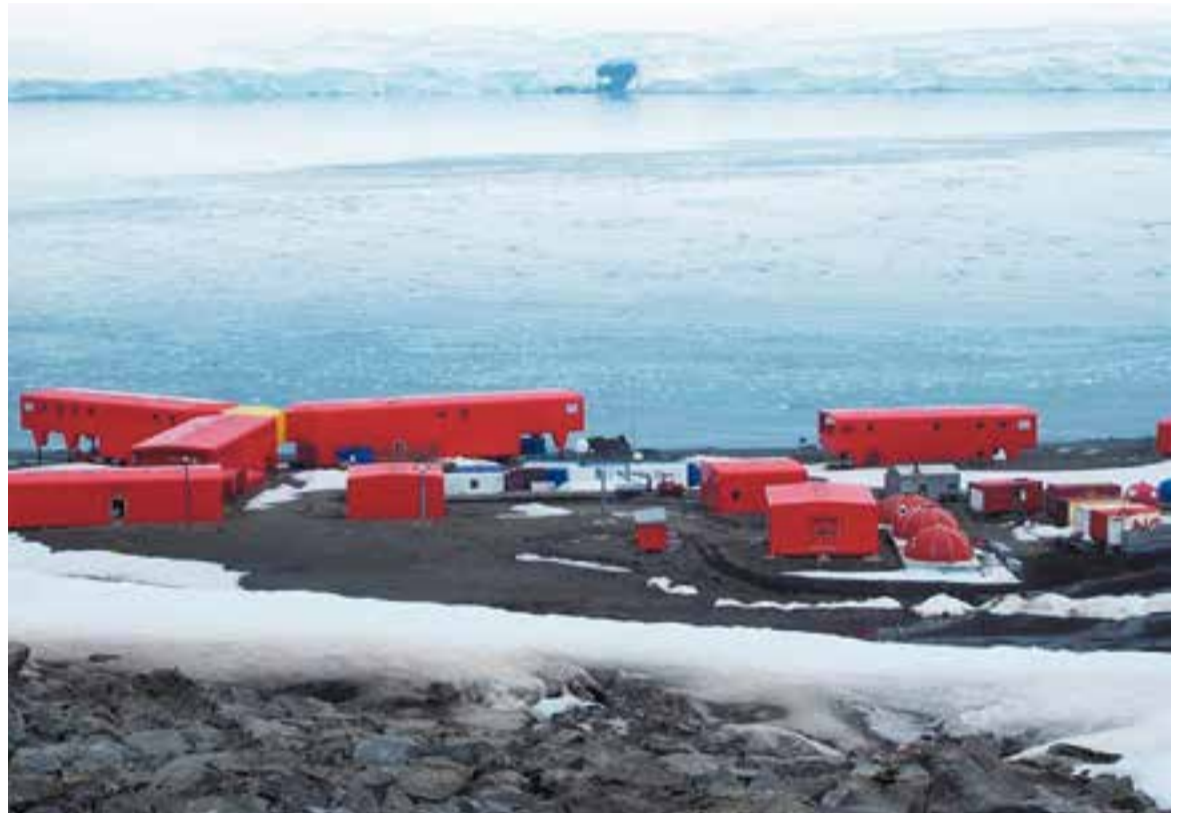
© Base espanyola de l'Antàrtida, Juan Carlos I.

A partir d'aquí vam treballar per grups d'experts, en què cada grup es va fer especialista d'un àmbit diferent: la contaminació de l'aigua dolça, dels mars i oceans, de l'atmosfera (efecte d'hivernacle, el forat a la capa d'ozó, la pluja àcida), del sòl, lumínica, acústica i la problemàtica dels plàstics. Unes preguntes de recerca guiaven allò que havíem de buscar i treballar per presentar-ho després a la resta de companys i companyes. Vam elaborar, també, unes infografies per a crear un plafó d'Infocontamina al centre.