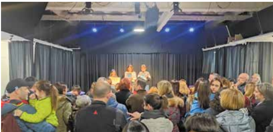
© L'Alcavot estava ple de gom a gom

A FEDAC creiem que els i les alumnes hem de ser els protagonistes del nostre aprenentatge