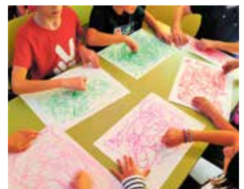
© A través del dibuix i amb els ulls tancats expressem el que sentim.