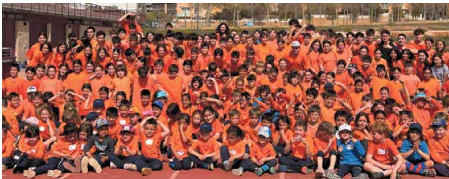
© Jornada esportiva dinamitzada pels alumnes de 4t d'ESO.