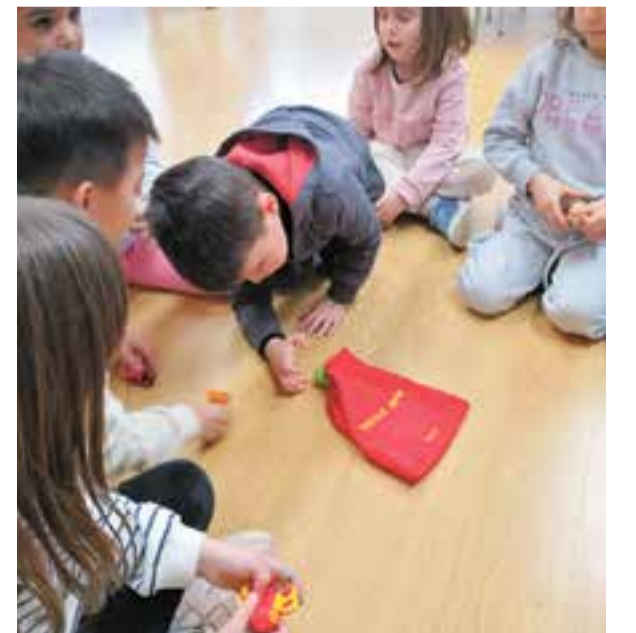
© Joc del toca-toca, taller de ceguesa.