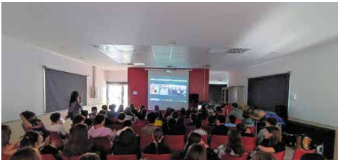
© Connexió en directe amb la parella de científics de la base espanyola a l'Antàrtida.