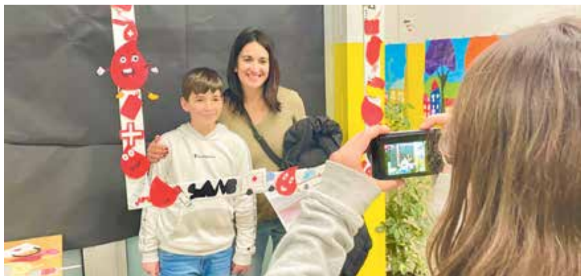
© Donants fent-se una foto immortalitzant el moment.