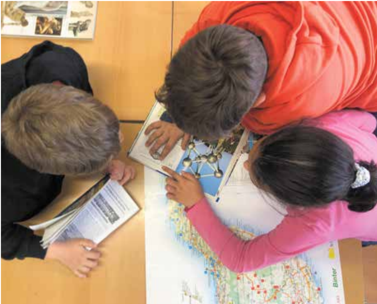
© Practiquem la lectura coneixent ciutats i països d'arreu del món.