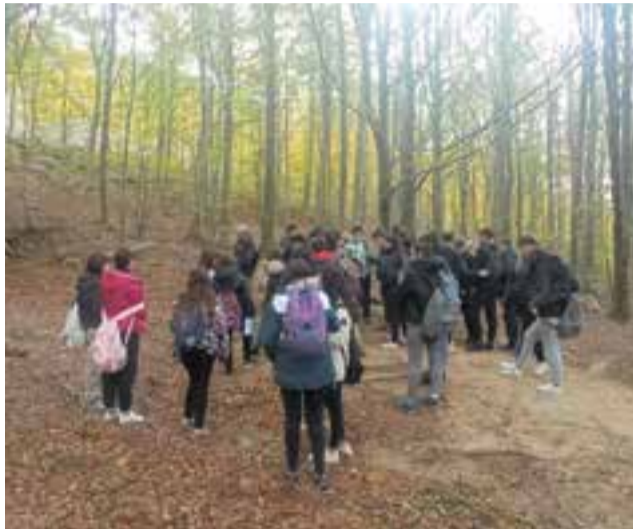
© Alumnat per la fageda de Morou, al Montseny.

Els parcs del Montseny, Montserrat i Sant Llorenç del Munt, a la tardor, l'hivern i la primavera, han estat els llocs i les estacions treballats aquest curs.