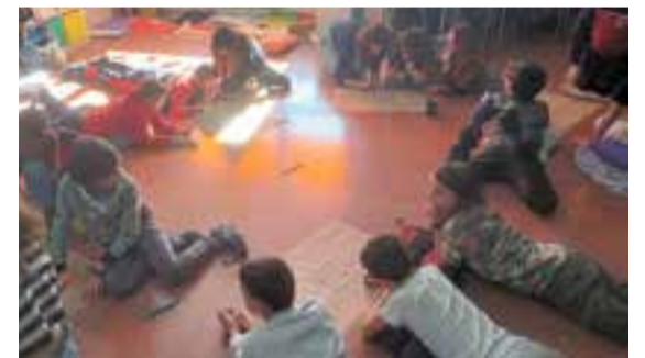
© Activitat principal cooperativa amb alumnat de 6è.