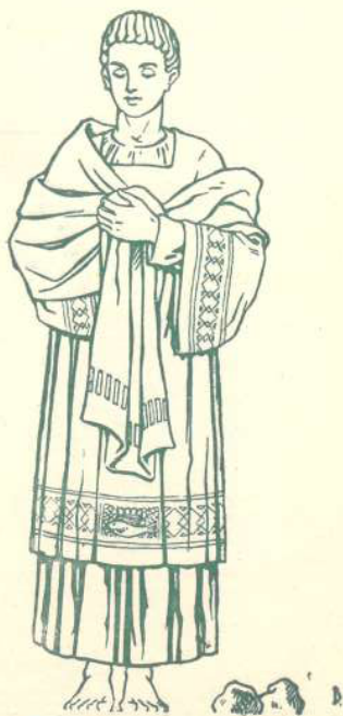
San Esteban, protomártir Patrón de Castellà del Vallès