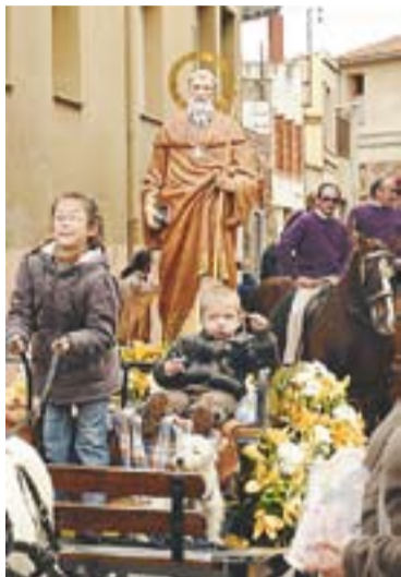
© Sant Antoni Abat. || J.G.