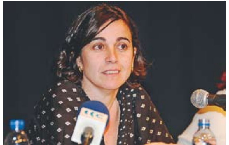
La periodista escoltant una de les intervencions del públic.

Els alumnes que omplien la Sala de Petit Format de l'Ateneu van començar a formular preguntes sobre el periodisme i qüestions d'actualitat. També es va parlar del cas del vídeo dels Bombers a Horta de Sant Joan que alguns mitjans van ensenyar a la seva pàgina web. Heredia va indicar que les imatges "no aporten res de contingut" i més aviat són "per a la investigació judicial" . +