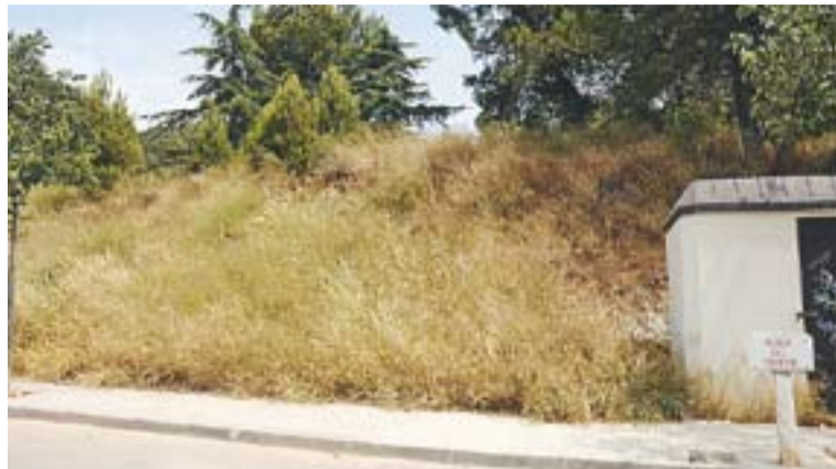
Els terrenys de la Soleia del Cosidor on s'ha de fer el tercer institut de la vila.