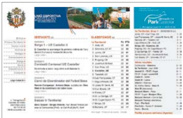
La pàgina principal del nou web de la Unió Esportiva Castellar. || J.M.

El club crea nou web 'www.uecastellar.cat' en una clara aposta per la comunicació