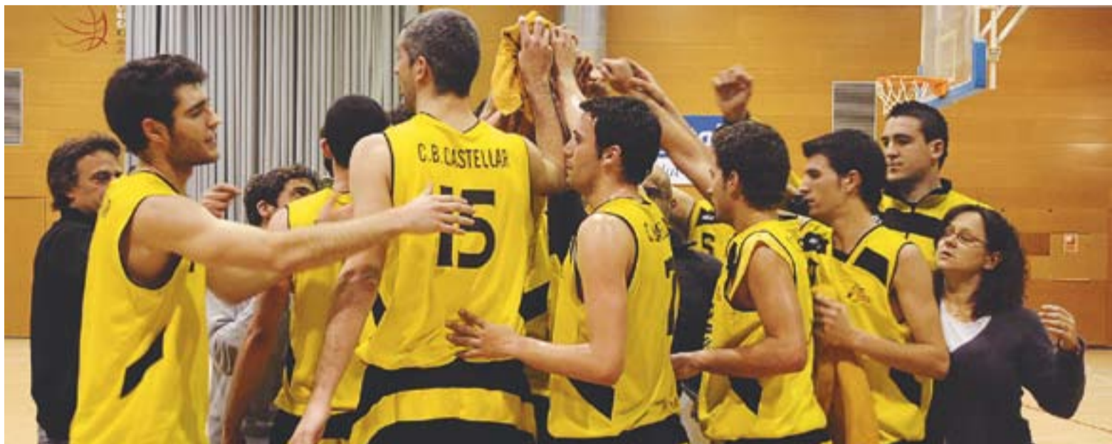
⊕ Jugadors i cos tècnic del Club Bàsquet Castellar fan pinya en un enfrontament de lliga al pavelló Puigverd. || JOSEP GRAELLS

Però el primer pas és aquest cap de setmana i a domicili. Els castellarencs juguen diumenge a Sant Pere de Ribes contra l'equip