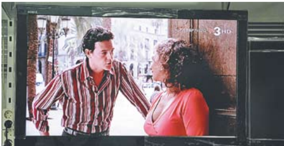
Una televisió de nova generació que ja compta amb un receptor de TDT incorporat.