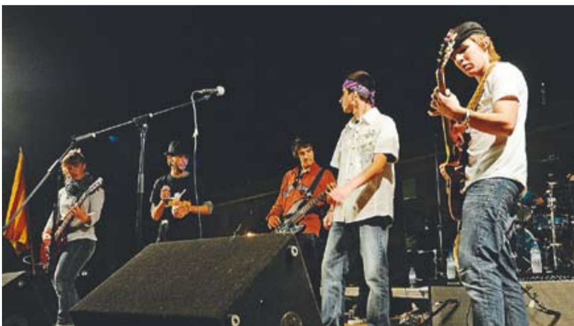
El grup castellanenc Antaviana serà un dels conjunts protagonistes de la Migdiada Jove.