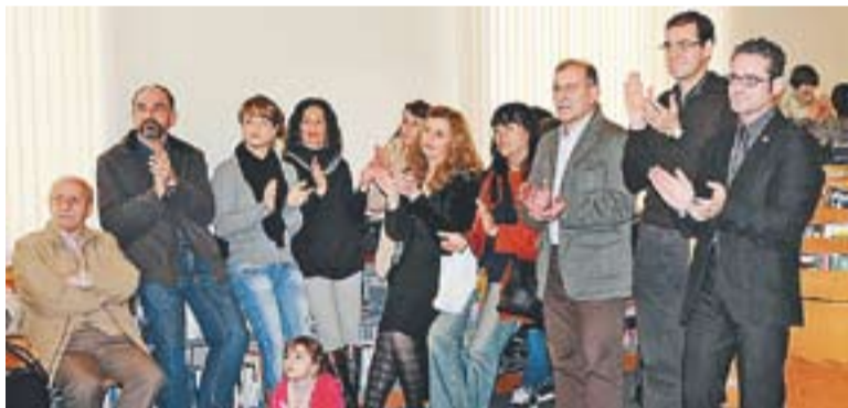
© Les autoritats també van aplaudir els 25 anys de la Biblioteca. || J.G.