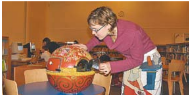
Un dels actes organitzats en anteriors celebracions del 8 de març.

da titulada Tots iguals a la feina . La biblioteca municipal Antoni Tort també s'ha volgut afegir a la celebració i el dissabte 13, les històries de l'Hora del Conte Infantil tractaran sobre Dones, mujeres, chicas y niñas para todas y todos . L'Escola d'Adults també ha preparat una exposició que es podrà veure fins el dia 22 anomenada Branques d'olivera . Podeu consultar tots els actes a la pàgina 14 d'aquest número de L'Actual . +