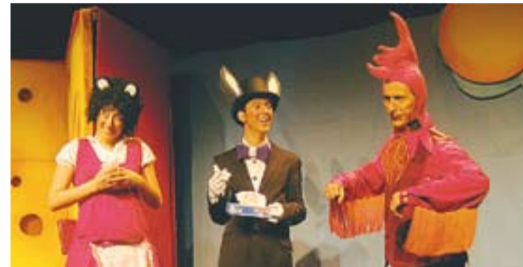
Moment de l'espectacle 'La rateta que escombrava l'escaleta'.

LA RODA PRODUCCIONS || Aquesta companyia va néixer l'any 2002 a Gavà i agrupa professionals del món artístic i audiovisual, tant en l'apartat creatiu com tècnic. El seu objectiu és generar projectes teatrals produïts per la pròpia empresa. Fa espectacles per a públic infantil i adult. +