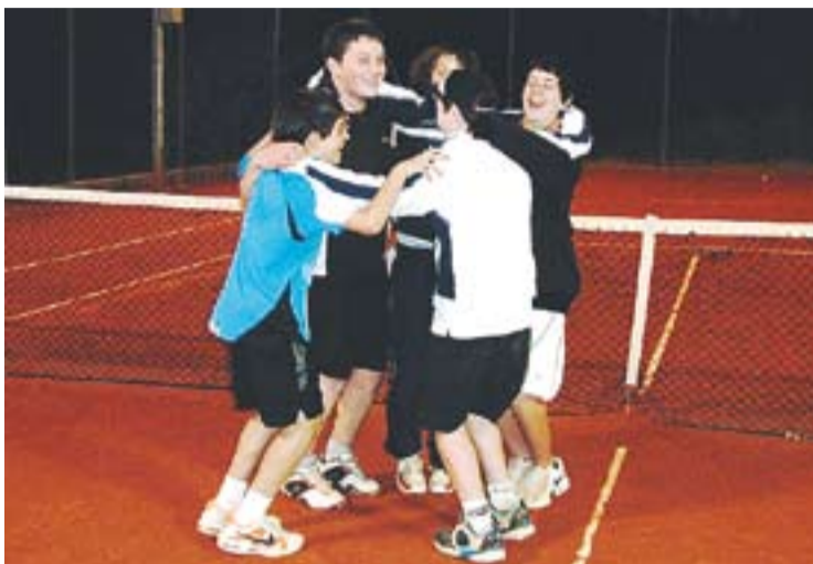
© Els castellanencs celebren el passi a semifinals. || CTC