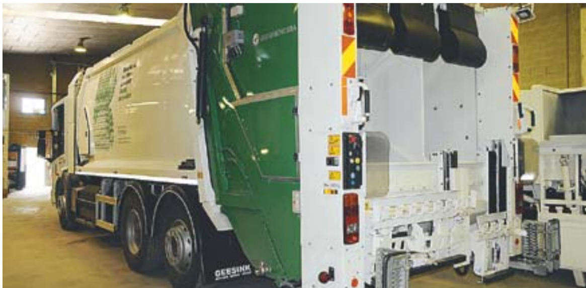
© Un dels camions d'escombraries als que MOBA està col·locant el sistema informàtic per poder identificar contenidors. || J.G.