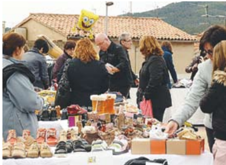
Visitants i alguns compradors donant un cop d'ull als estocs d'hivern

La propera ocasió dels comerciants per treure els seus estocs al carrer serà ja de cara a la temporada d'estiu. En aquesta ocasió, les botigues es podran desfer dels estocs d'estiu. +