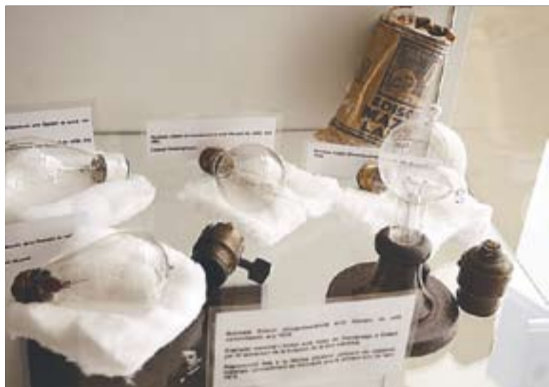
© Algunes de les bombetes que es poden veure a l'exposició del CEC. || J.G.