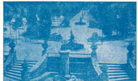
La Plaça Major inaugurada ara fa 50 anys