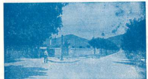
Els Pedrissos, quan per creuar no calia mirar si passaven cotxes