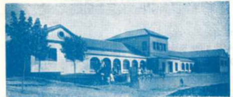
Les Escoles Mestre Pla, inaugurades l'any 1934