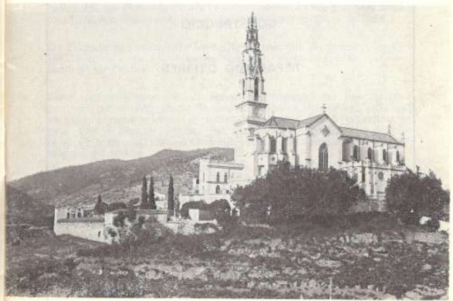
PARROQUIA DE SANT ESTEVE

CC.OO. - Sant Iscle, 30 COORDINADORA DE DISMINUITS FÍSICS I PSÍQUICS - Ctra. de Sentmenat, 2 CONVERGÈNCIA DEMOCRÀTICA DE CATALUNYA - Basetas, 34 ESCOLA DE BASQUET LA IMMACULADA - Puigvert, 10 ESCOLA NOCTURNA - Passeig Tolrà, 6 ESBART TEATRAL - Avda. Sant Esteve, 21, 1.º 1.º GRUP CONTRADANSA - Avda. 11 de Setembre, 6 GRUP PESSEBRISTA - Dr. Pujol, 5 GRUP IL·LUSIÓ - Puig de la Creu, 20 GRUP L'ESPIGA D'OR - Hospital, 13, 2.º 2.º GRUP TAROT - Racó, 2 JOVENTUT NACIONALISTA DE CATALUNYA - Sant Pau, 2 PENYA CICLISTA CASTELLAR - Puig de la Creu, 53 PENYA LA HIGUERA - Avda. Sant Esteve, 9, 1.º PENYA SOLERA BARCELONISTA - Francesc Layret, 3 PSC - PSOE PSUC - Santiago Rusiñol, 27 RÀDIO AFICIONATS - Avda. Sant Esteve, 36 RÀDIO CASTELLAR - Major, 74, 2.º pis SEAC - Basetas, 9 SERNA - Emili Carles-Tolrà, 19 SETMANARI FORJA - Església, 16 SOCIETAT CASTELLARENÇA - Pedrissos, 1 TENNIS TAULA - Puig de la Creu, 26 UNIÓ ESPORTIVA CASTELLAR - Marià Fortuny, 1 UNIÓ DE BOTIGUERS - Barcelona, 20 UNIÓ DEMOCRÀTICA DE CATALUNYA - Torras, 1 UGT - Sant Iscle, 30