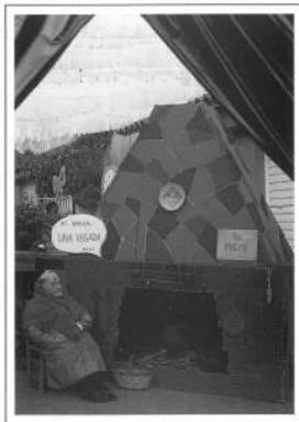
Carrer Agustina d'Avogò, 1991

Feliç Festa Major amb un magnífic local!!!