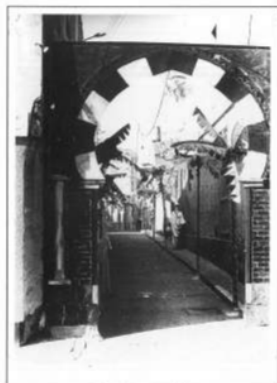
Carrer Sasseles, 1965

Obres i Clons, Ventura, carrer Sant Josep, 3, Castellà.