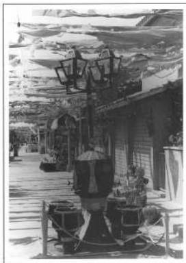
Correfoc Agutina d'Arçó, 1967

s'adhereix a aquesta celebració. Li oferim un