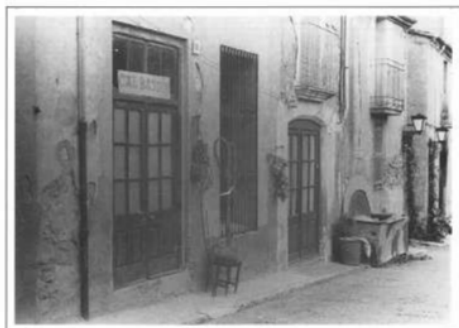
Carrer de la Mina, 1964