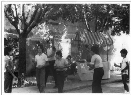
Carrer Sant Miquel, 1983

Obres i Cioms. Ventura, 45 anys d'experiència a la construcció.