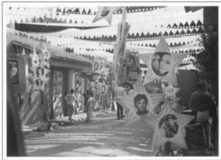
Carrer Agostina d'Aragó, 1989

Amb tres plaques d'aparcament, amb diferents