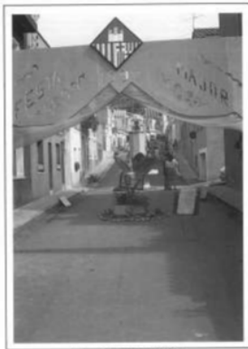
Casa Sarri Sebastià, 1990