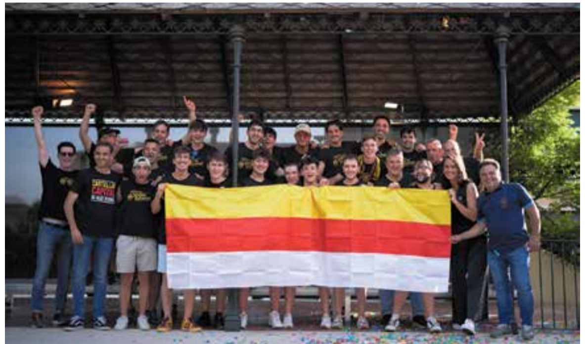
Recepció institucional als campions de l'Hoquei Club Castellar als jardins del Palau Tolrà.

Després de desfilat pel carrer Major, el camió va tornar a descarregar al pavelló on s'han viscut moltes tardes màgiques aquesta temporada i on passaran alguns dels millors equips de Catalunya la que ve. Al ja tradicional sopar de final de curs, la junta va voler valorar el que signifiquen aquests ascensos: "La rua ha estat un èxit, tot i les dificultats del traçat, ja que, com que eren dos equips ascendits, el camió no podia passar per alguns carrers més cèntrics, tot i això, i les dates, hem