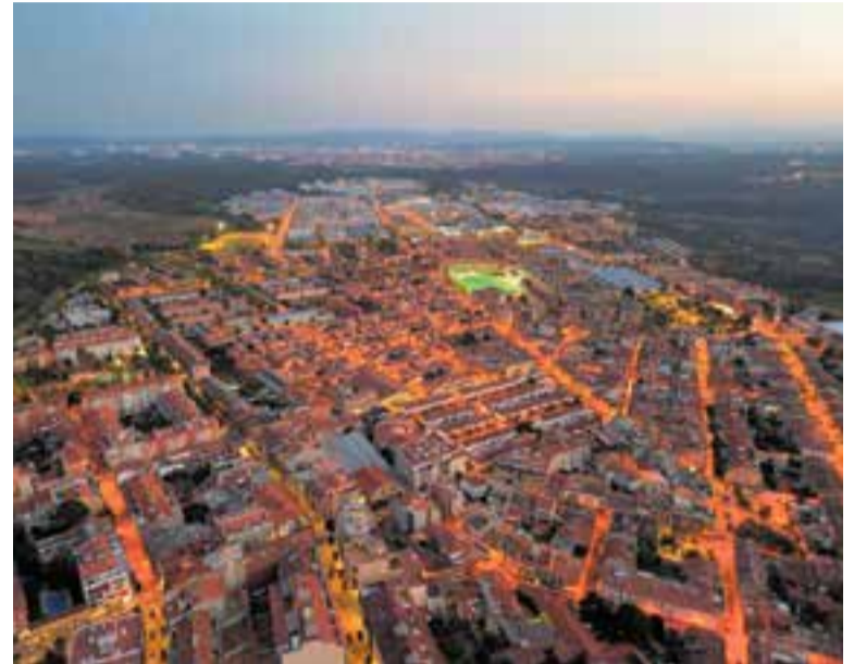
Vistes aèries de Castellar del Vallès en una imatge de fa uns mesos.

treballadors de baixa qualificació (10% a Castellar, 12,1% al conjunt de Catalunya), estrangers de països de renda baixa o mitjana (3% a Castellar, 13% al conjunt de Catalunya). La renda mitjana per persona és de 13.187 euros a Castellar, i de 14.748 euros al conjunt de Catalunya. Hi ha diferències rellevants en el nivell socioeconòmic dels 947 municipis catalans: hi ha 49 municipis que tenen un IST alt (és a dir, que supera en més de 20 punts percentuals la mitjana catalana) i a l'altre extrem, n'hi ha 31 amb un IST baix (20 punts o més per sota de la mitjana). Dels 49 municipis amb el nivell socioeconòmic més alt, 13 es troben a les comarques centrals, 12 a l'àmbit metropolità i 10 a les comarques gironines. En canvi, dels 31 amb el nivell socioeconòmic més baix 15 són a Ponent i 9 a les comarques gironines. +