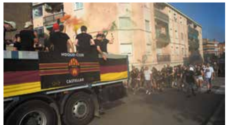
Rua de celebració de l'Hoquei Club Castellar divendres passat.

El club, que encara no ha anunciat el pròxim entrenador, ja treballa des de fa setmanes per confeccionar una plantilla competitiva per a la temporada que ve, en què s'esperen com a mínim un parell d'incorporacions. +