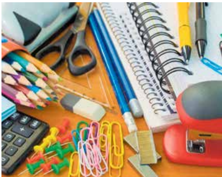
El val serveix per comprar tota mena de material escolar i llibres.