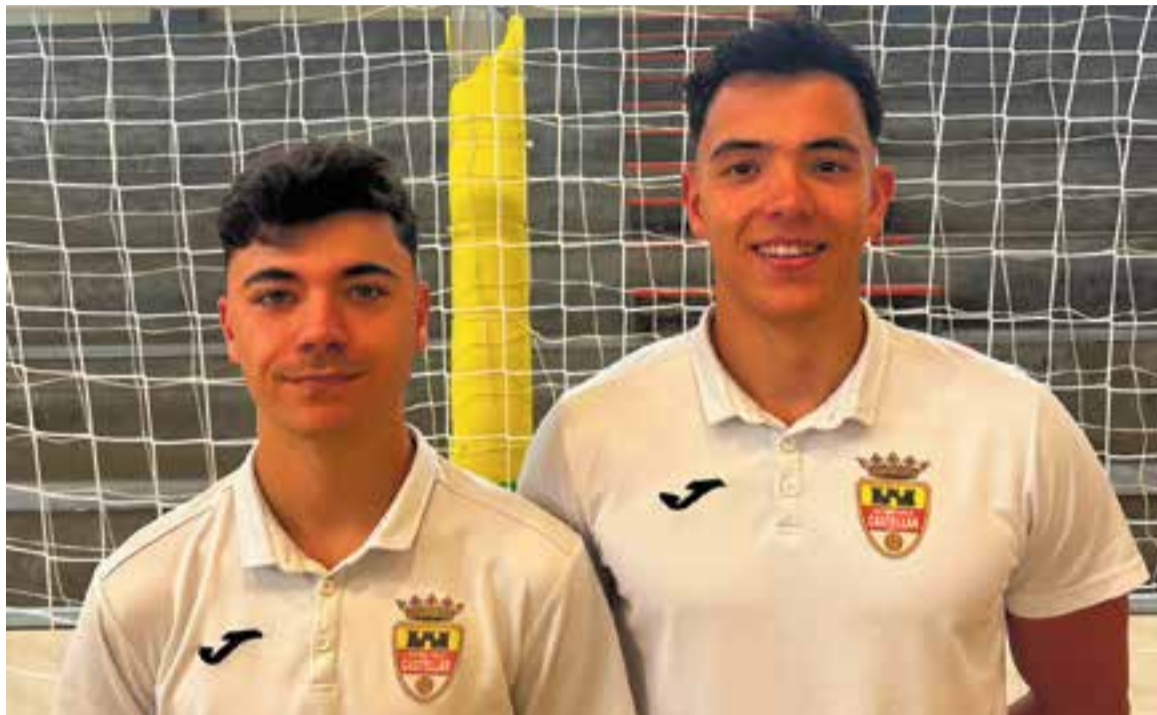
Pérez i Mas s'encarreguen de les tasques de coordinació del club i juguen al primer equip taronja.