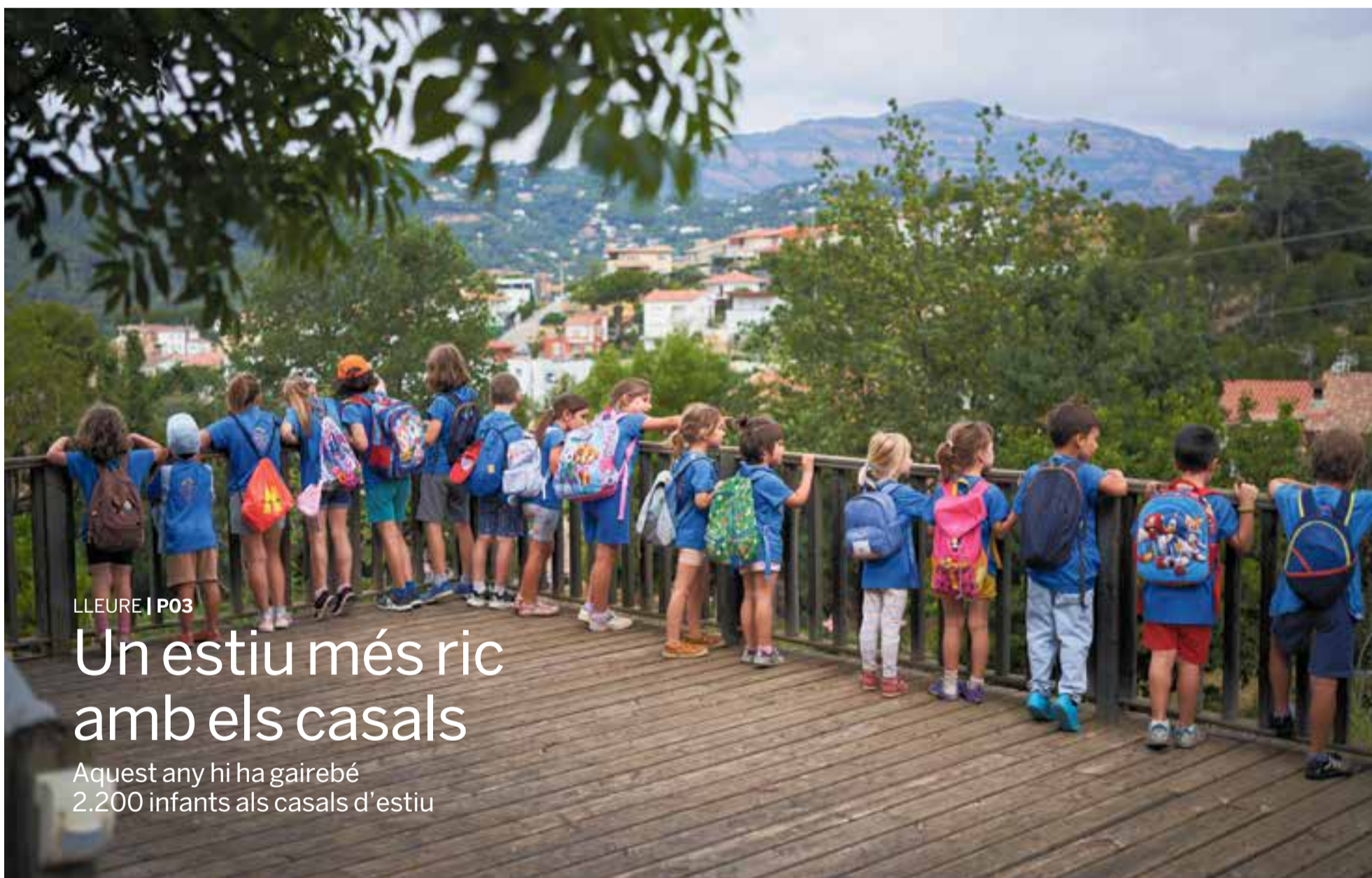
Una de les novetats d'aquest estiu és l'esplai de muntanya Corriol, nascut aquest curs del Centre Excursionista de Castellar (CEC). Els infants fan sortides i coneixen l'entorn i la natura del municipi.

Aquest any hi ha gairebé 2.200 infants als casals d'estiu