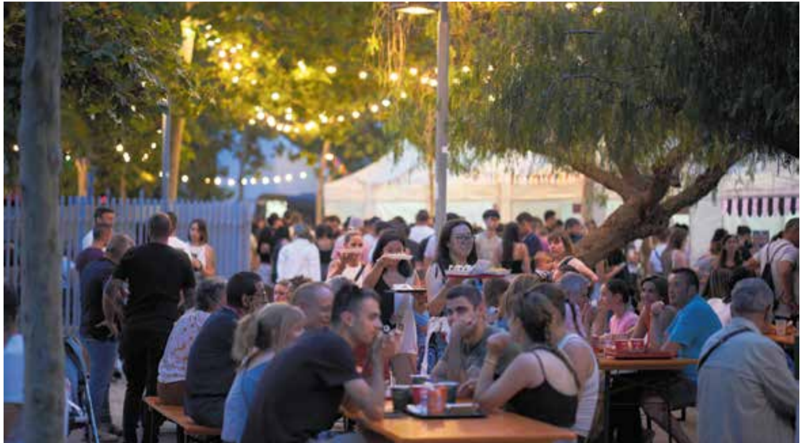
L'espai de degustació del Tast d'Estiu va estar ple durant els dos dies de celebració de la iniciativa.