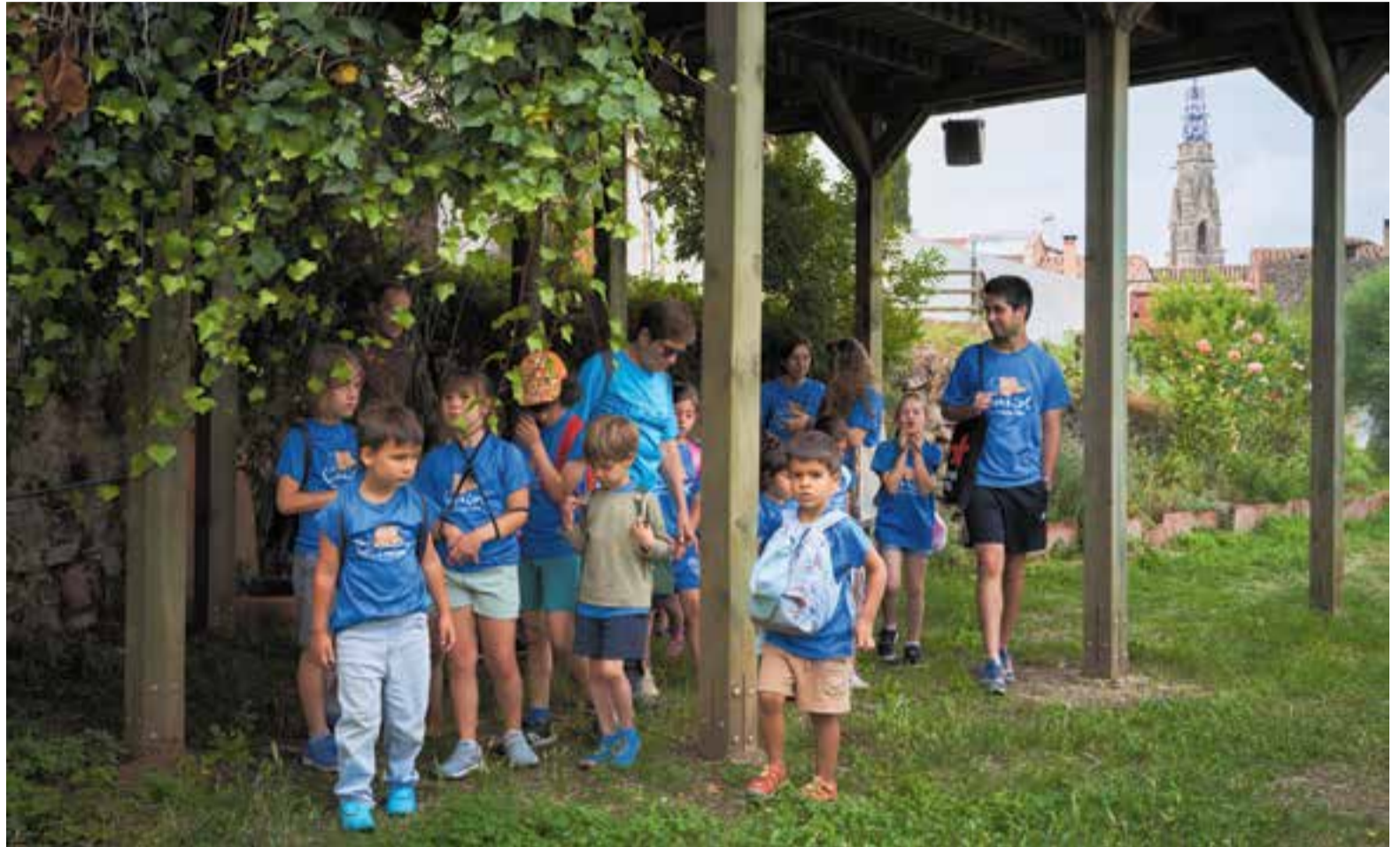
Una de les sortides que han fet els nens i nenes del casal Corriol, del Centre Excursionista de Castellar, ha estat als horts municipals de Cal Botafoc.

Alguns casals i activitats són veterans, però d'altres són propostes noves, com el casal d'estiu que ofereix l'esplai de muntanya Corriol, sorgit aquest curs del Centre Excursionista de Castellar. "L'esplai és nou d'aquest curs, i arran d'això, com que volem que ens coneguin i tenir més canalla, hem fet un casal d'estiu. Està funcionant molt bé, n'estem supercontents, s'hi han