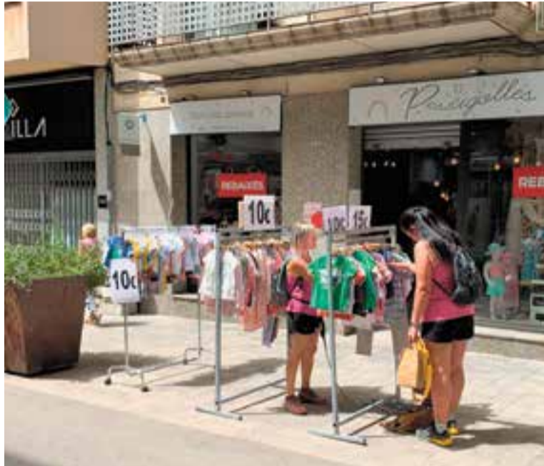
Dues clientes mirant les ofertes de la botiga Pessigolles.

La majoria dels comerços van treure els seus articles al carrer amb penja-robes de barra. Així, per exemple, des de bon matí els establiments dedicats a la moda infantil del carrer Sala Boadella, Pessigolles i Midudu, oferien com a reclam peces de roba a 10 i 15 euros. De fet, el client podia entrar a l'interior de la botiga i trobar descomptes del 20% en gènere de temporada. A Midudu el descompte era del 20% per a roba i en complements i en sabates la rebaixa era d'un 10%. La botiga de decoració i complements per a la llar Decoart, ubicada al carrer Santa Perpètua, oferia descomptes de tots els articles de la botiga d'entre el 10 i el 20%. Cuca Bag, la botiga de bosses de mà, maletes i complements del carrer Major, participava en la iniciativa tot i que no podia treure gènere al carrer per motius d'espai i animava la clientela a comprar amb el reclam d'un sorteig que va fer aquest dilluns a la tarda amb arracades d'Ivette Oller, una bossa de mà i un joier. †