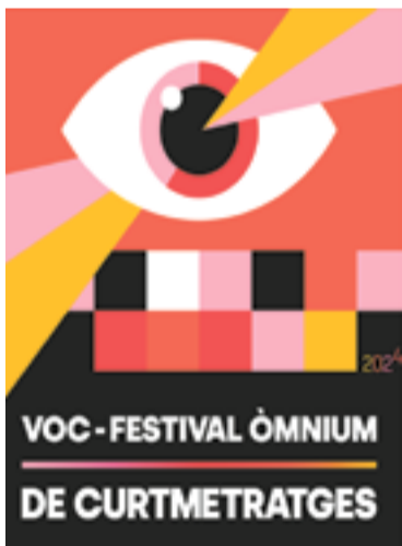
Cartell promocional del VOC.