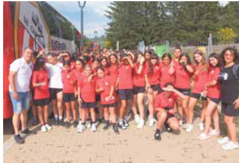
Els equips femenins de la UE Castellar que van anar a la Pirineos Cup.