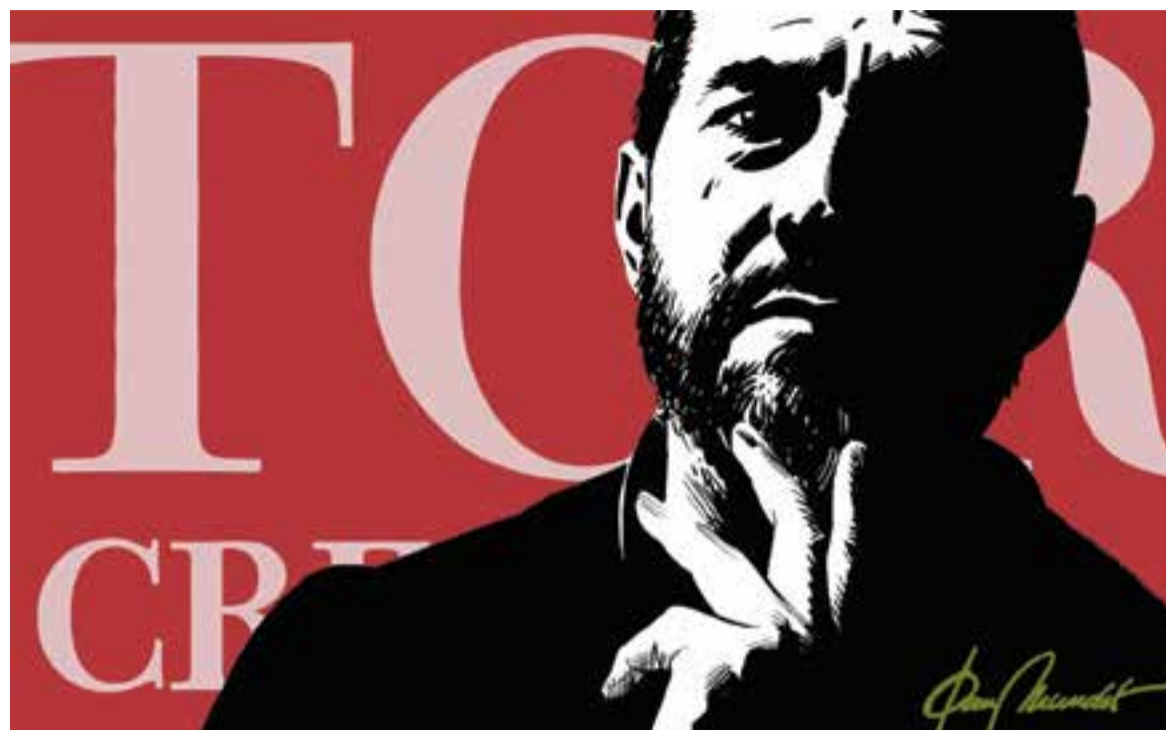
© Posarem llum a la foscor?. || JOAN MUNDET

"Tor no deixa de ser una metàfora, un exemple clar, d'allò que porta implícita l'essència humana"