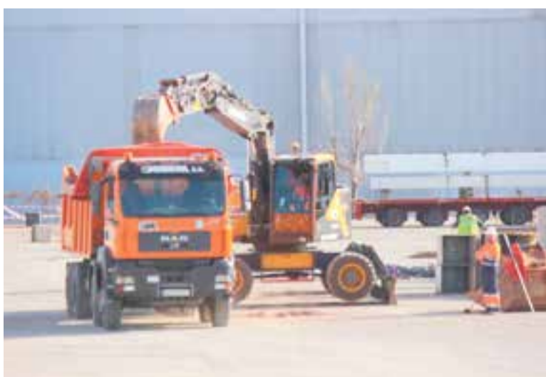
Uns treballadors construint una nau al Pla de la Bruguera.

El mes de juny ha tancat amb el segon augment consecutiu del nombre de persones inscrites a les llistes del Servei d'Ocupació de Catalunya. Si al maig hi havia 922 persones sense feina, setze més que a l'abril, el juny s'ha tancat amb 933, 11 més que l'anterior. Castellar no és l'única població on ha crescut l'atur durant el mes de juny. Sant Quirze, Barberà, Matadepera, Polinyà, Rellinars, Sentmenat i Ullastrell també han registrat repunts lleugers. Tot i això, la taxa d'atur registral és del 7,18%, una de les més baixes de la comarca. Si es tenen en compte els primers sis mesos de l'any, el gener es tancava amb 916 persones sense feina, disset menys que al juny. En un any, Castellar ha passat de les 902 persones inscrites al SOC -juny del 2023- a les 933 d'aquest juny, 32 persones més.