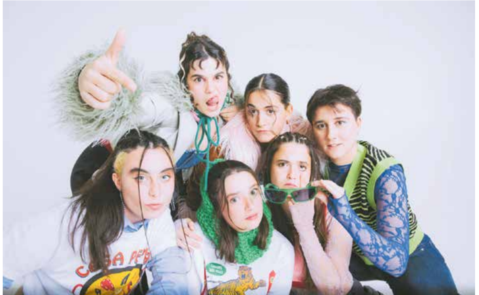
Les Al·lèrgiques al Pol·len actuen al FemFestival de Castellar dissabte 6, a les 21.30 h, a la plaça d'El Mirador.

Nosaltres toquem pop. Sempre ens hem mogut dins aquest àmbit. També és el que escoltem. Fèiem cançons de pop i seguim fent-les.