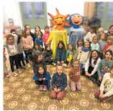
Cor Sant Esteve

+ INFO: www.castellarvalles.cat/festivalomniom