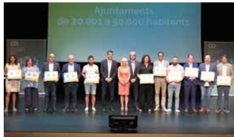
Foto dels ajuntaments premiats d'entre 20.001 i 50.000 habitants.