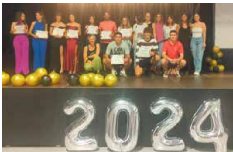
Cloenda del servei comunitari ara fa uns dies. || A.J. CASTELLAR