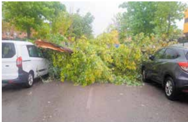
Les fortes pluges de dissabte passat van provocar la caiguda d'un arbre.

La tempesta viscuda va provocar també l'aixecament de diverses tapes de clavegueram, com al carrer Sant Feliu amb el carrer Molí, al carrer Àngel Guimerà amb el carrer