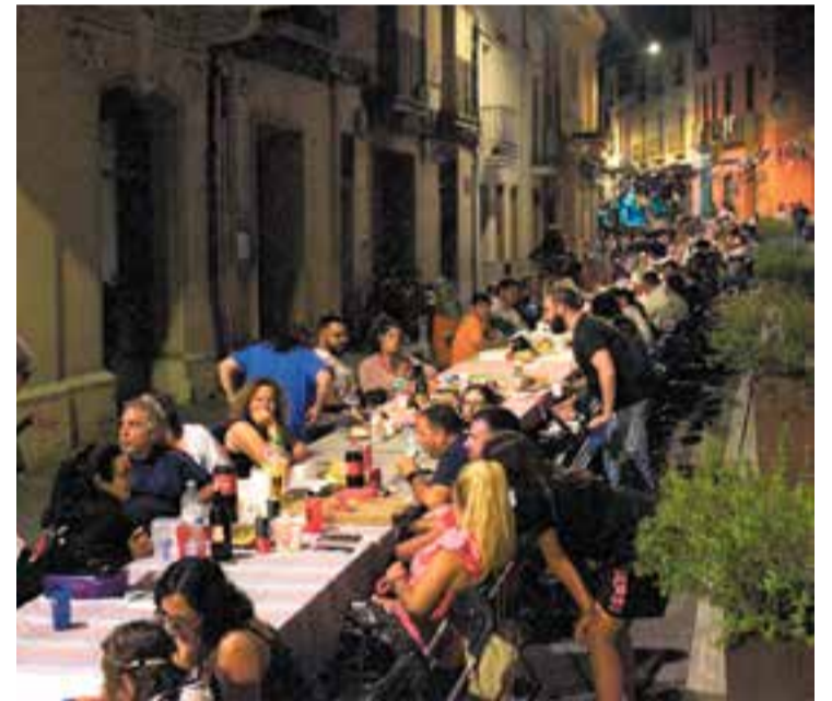
La Revetlla d'Estiu va omplir el carrer Major. || J. CLAPÉS

La revetlla és una bona oportunitat per gaudir de l'estiu a la fresca i compartir el moment en comunitat entre el veïnat i qui s'hi va voler acostar. ✦ || J. CLAPÉS