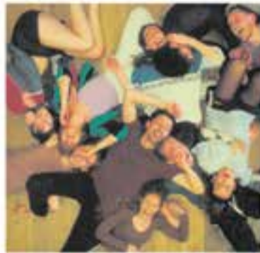
Club Cinema Castellar Vallès