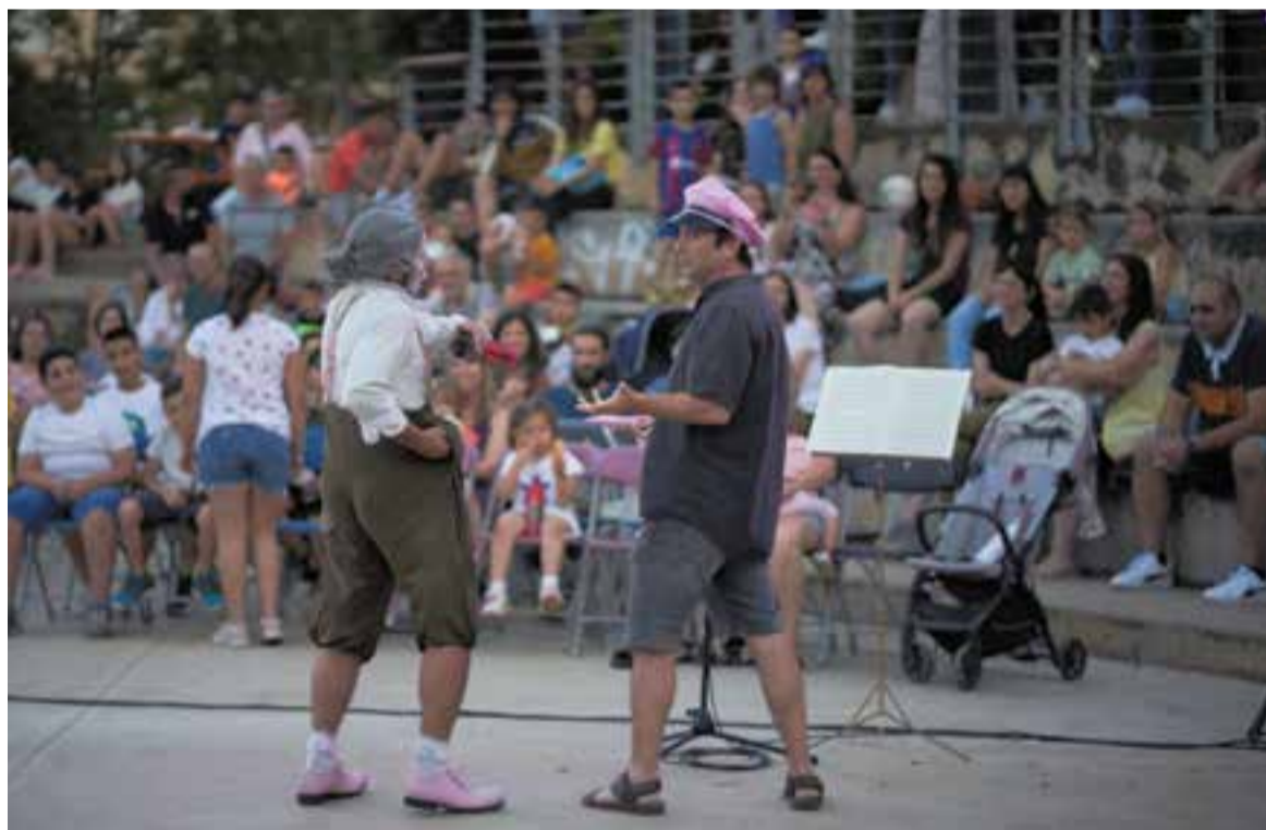
L'espectacle 'Gran Sonata' de la companyia Le Puant va comptar amb la col·laboració dels espectadors.

El Tast d'Estiu ha acabat amb unes 7.500 racions servides, 2.500 més que a l'edició anterior