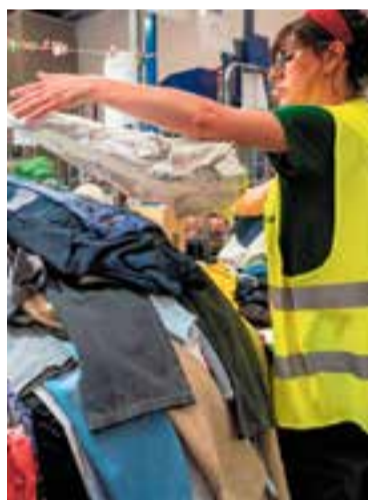
Planta d'Humana a l'Ametlla.