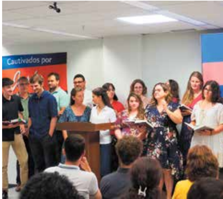
Una de les lectures de la Bíblia que es van fer durant la celebració.

El 7è aniversari de l'Església Evangèlica de Castellar es va celebrar els dies 20 i 21 de juliol, amb una sèrie d'activitats que van reunir els membres de la comunitat i d'altres esglésies amigues. Els actes van començar el dissabte 20 amb un esmorzar al local de l'entitat, seguit d'una exposició bíblica. Aquesta jornada “va estar marcada per un ambient de germanor i participació” , segons expliquen els organitzadors en un comunicat. “Les activitats es van dividir en grups per edats i interessos: els joves van debatre sobre les seves aspiracions futures i la vida que desitgen, mentre que els més petits van gaudir de jocs i d'una sessió de titelles amb l'Estevet, aprenent sobre la confiança en Jesús” , detallen. A més, segons informen, “un grup d'adults es va reunir en pregària, demanant la benedicció de Déu per la gent de Castellar i les poblacions veïnes” . + || REDACCIÓ