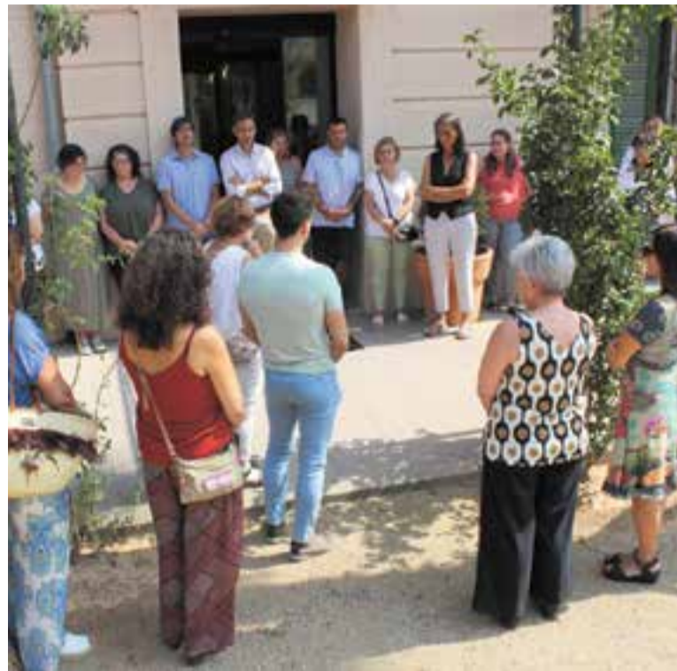
Més d'una trentena de persones es van reunir davant del Palau Tolrà.

Amb aquest gest simbòlic, es va voler expressar la indignació i repulsa davant aquesta manifestació de violència, reiterant el compromís col·lectiu en la lluita contra el masclisme. ✦