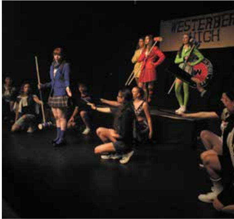
L'elenc jove de l'Stage de Teatre Musical d'Espaiart a 'Heathers'.