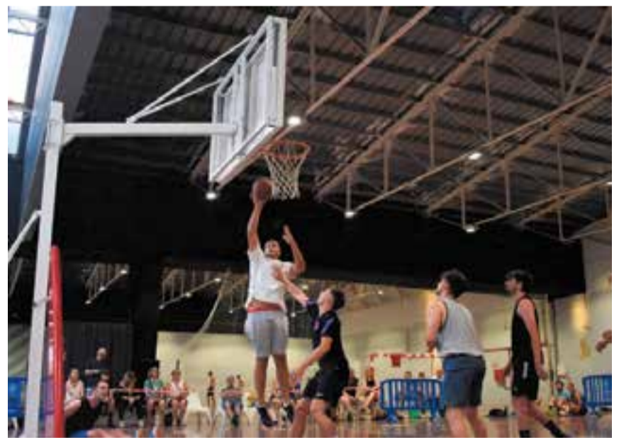
A dalt, la foto oficial del I Torneig 3x3 Social -Associació Bàsquet Pinya Castellar. A baix, un moment del torneig.