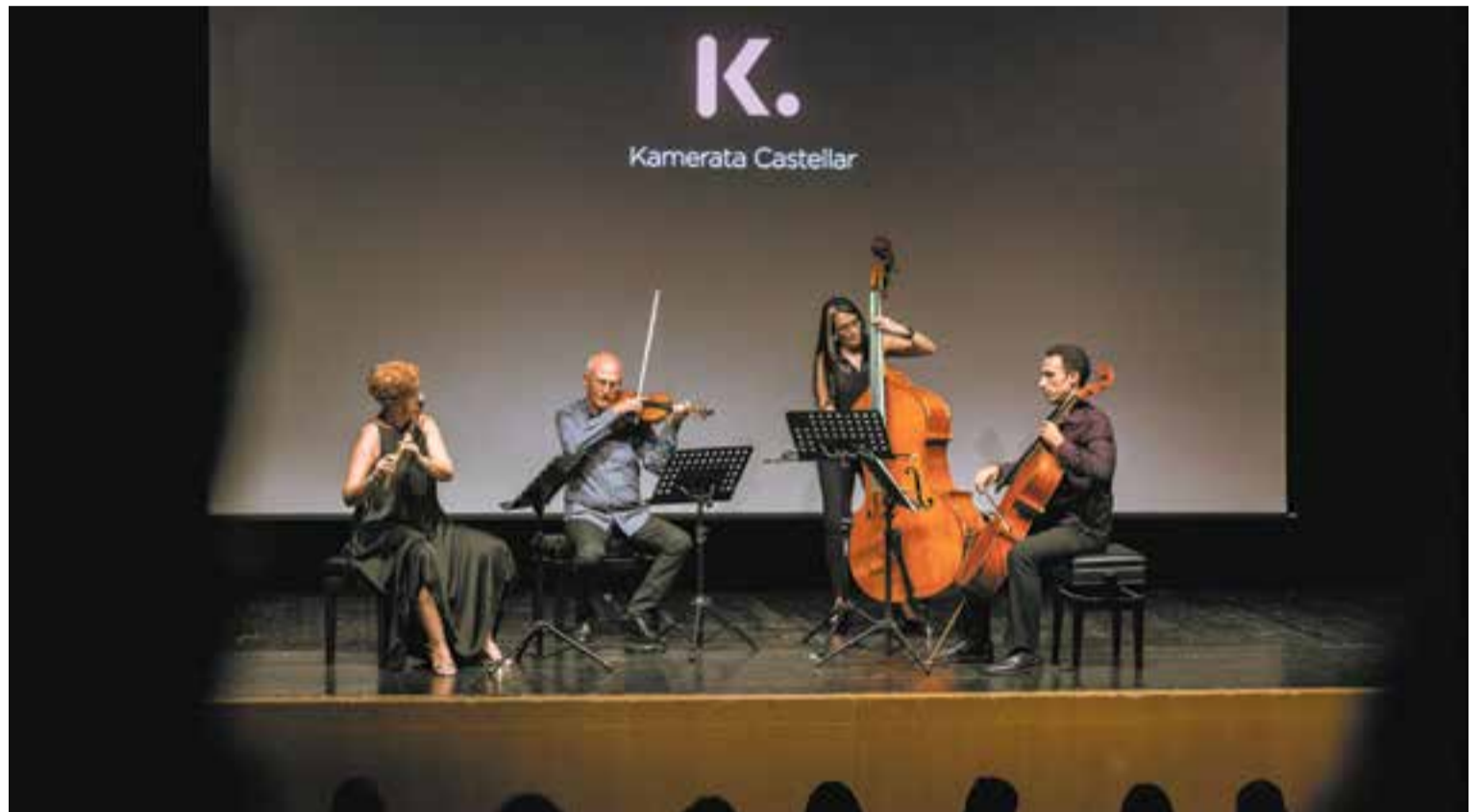
Quatre dels músics de la Kamerata Castellar van oferir un tastet de peces clàssiques a la presentació de la nova orquestra de cambra. || M. PÉREZ

Carles Miró va destacar la professionalitat dels músics que conformen la