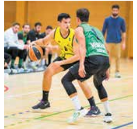
El Castellar masculí vol refundar-se. || A. S. A.

Prat, que ja va agafar les regnes de l'equip a finals de la campanya passada, quan l'equip ja estava sentenciat, serà l'encarregat de posar les bases per poder retornar a categories superiors, i també ho farà com a director tècnic del club groc-i-negre. El conjunt ha arrencat els entrenaments aquesta setmana i espera enfrontar-se al Matadepera aquest diumenge (Puigverd, 19 h) i al Les Franqueses (dia 8, 12 h) com a primers rivals. † || A.S.A.