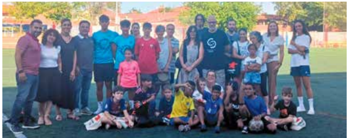
Algunes de les famílies que participen en el projecte Vacances en Pau al Joan Cortiella. || CEDIDA

L'Ajuntament de Castellar va obsequiar els nens i nenes que van visitar el camp de futbol amb material divers de promoció de la vila: bossa, cantimplora, boc n'roll, llibreta i necesser. + || C.D.