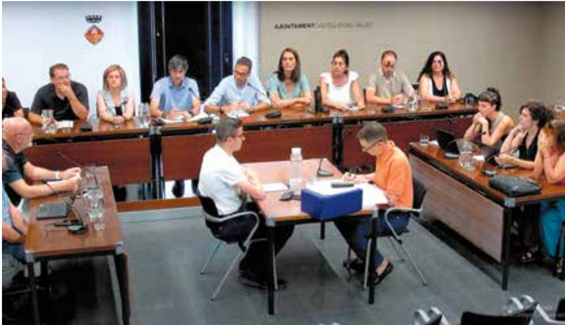
Un moment del ple extraordinari del mes de juliol passat. || C. D.