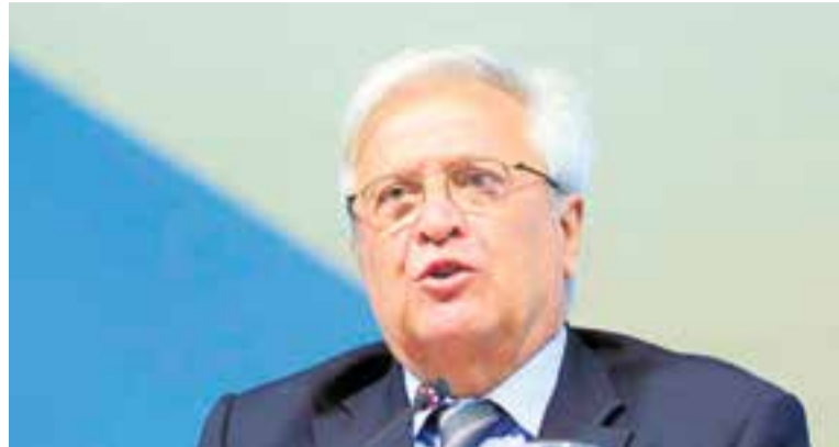
L'excalcalde de Barcelona i exministre d'Indústria Joan Clos.