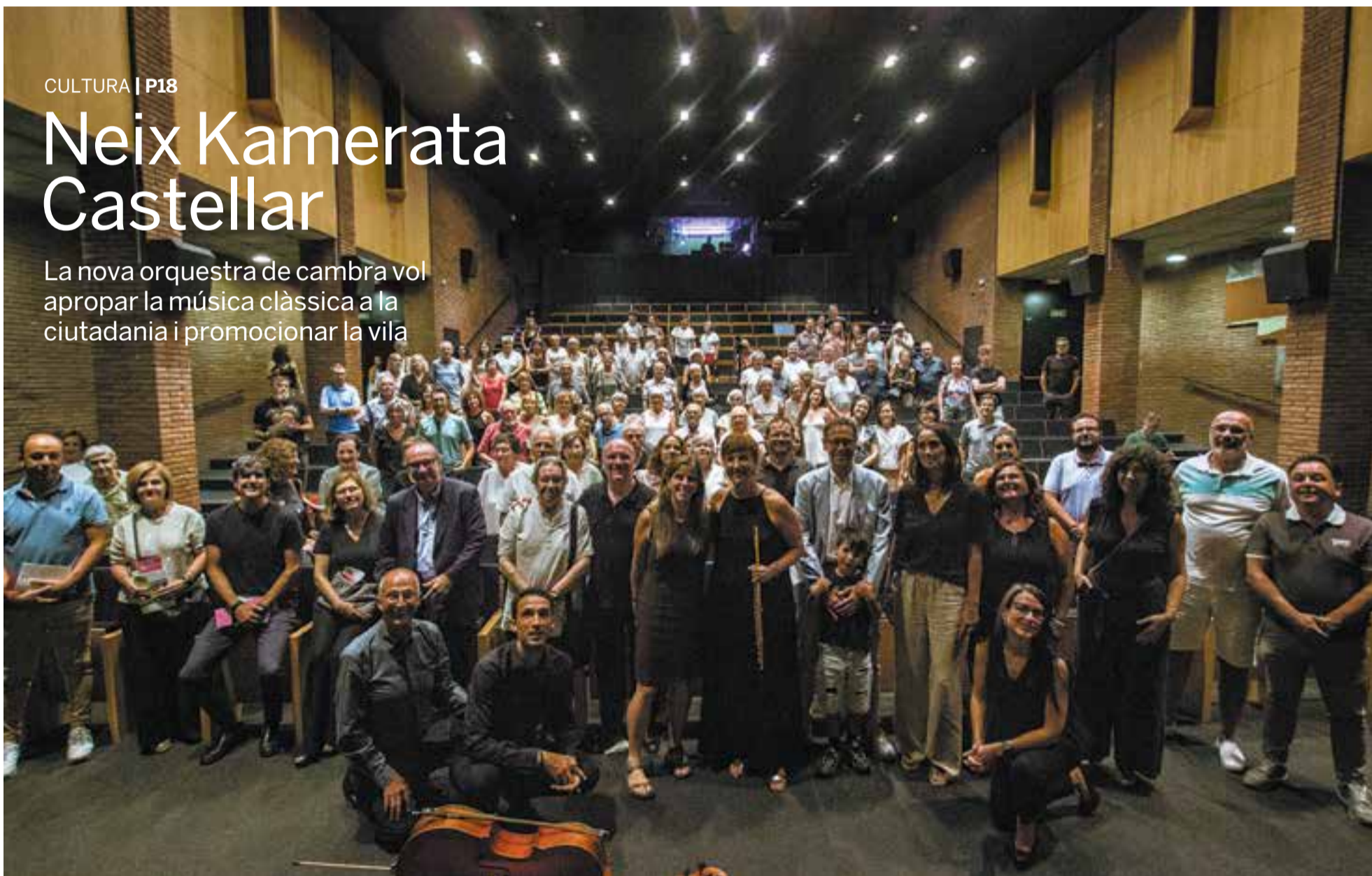
Foto de família dels integrants i impulsors de Kamerata Castellar amb autoritats i regidors dels grups municipals després de la presentació del projecte, dimecres passat a l'Auditori.

La nova orquestra de cambra vol apropar la música clàssica a la ciutadania i promocionar la vila