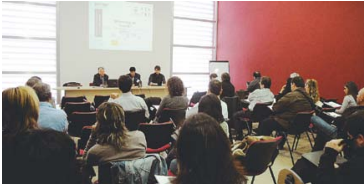
© Públic assistent al seminari Màrqueting de guerrilla al Centre de Serveis. || JOSEP GRAELLS

El consultor va començar el seminari desgranant un per un molts dels temes clàssics que a l'agenda de l'empresari han d'anar canviant perquè els temps també han canviat. Com a bona tècnica