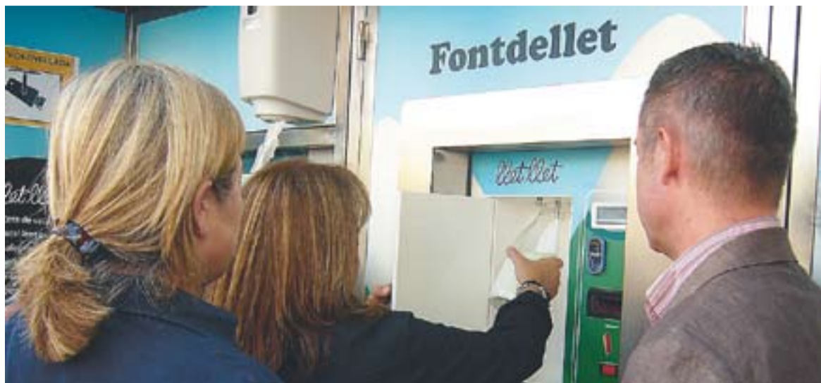
Màquina expenedora de llet, instal·lada al municipi de Sant Quirze del Vallès