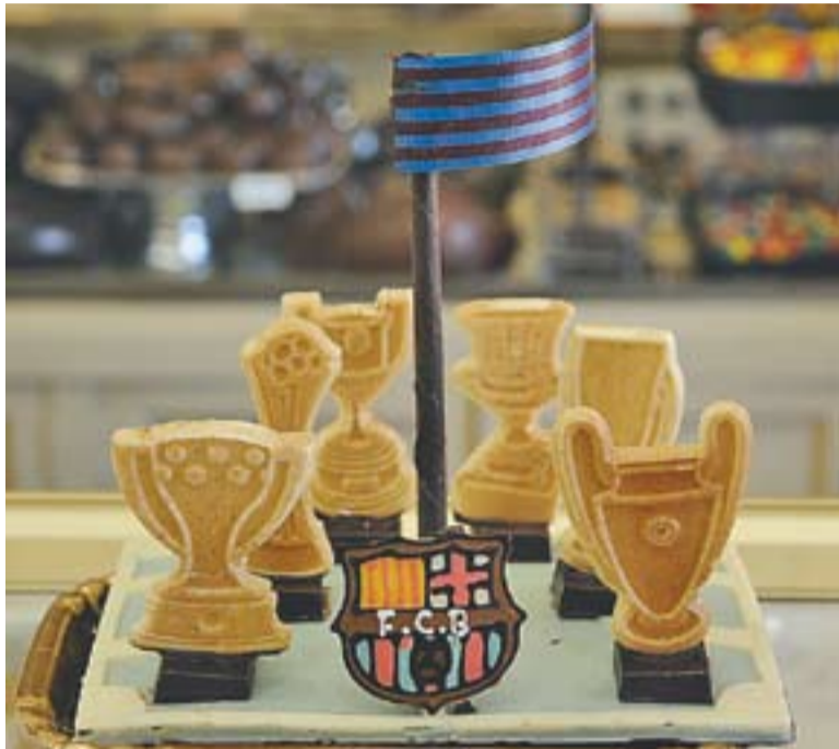
Les 6 copes del Barça són una de les mones més demanades.

El Barça i els dibuixos de sèries infantils omplen els aparadors de les pastisseries