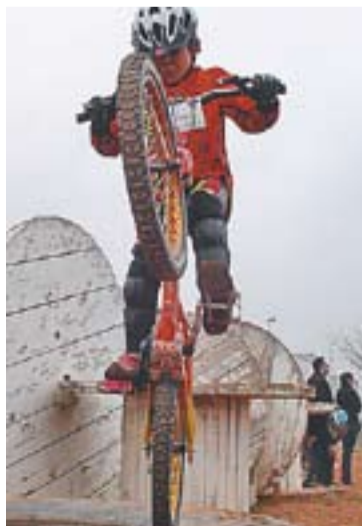
⊕ Alan Rovira a la Vall d'Uixó.

Aquesta propera setmana començarà el Campionat de Catalunya de biketrial al port de Torredembarra. És el primer any que aquesta competició és classificatòria per al Campionat del Món de biketrial. ➤