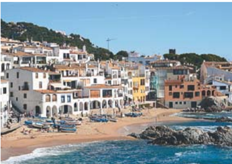
© La platja és un dels espais triats per alguns per passar la Setmana Santa || CEDIDA