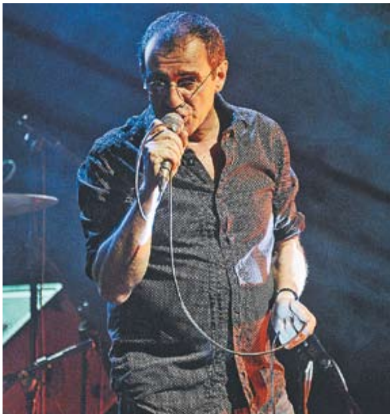
El cantant Quimi Portet durant l'actuació a la Sala Blava de l'Espai Tolrà.