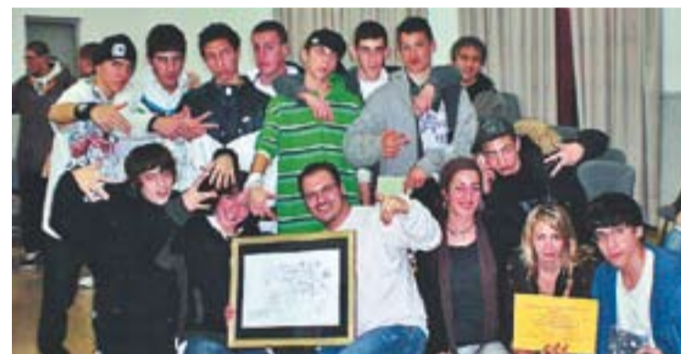
© El grup Breakers Revenge Creu de l'Espai Jove celebra el seu triomf.