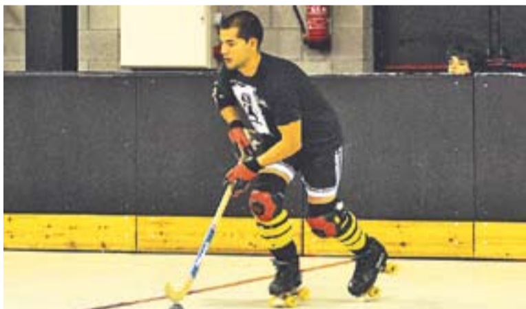
El Castellar torna a jugar contra el Molins de Rei.