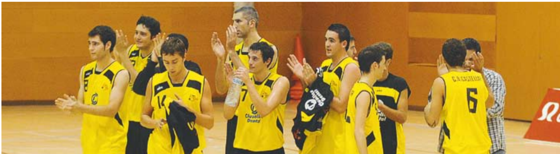
© Els jugadors del Castellar van fer un autèntic partidàs a Tarragona que els manté amb opcions d'ascens. || JOSEP GRAELLS

Els castellarencs van caure a Sentmenat després d'anar guanyant durant tot el partit. Els locals van remuntar un 0 a 2 en contra en els darrers 10 minuts i ara el Castellar veu com el primer lloc de la taula s'allunya a sis punts.