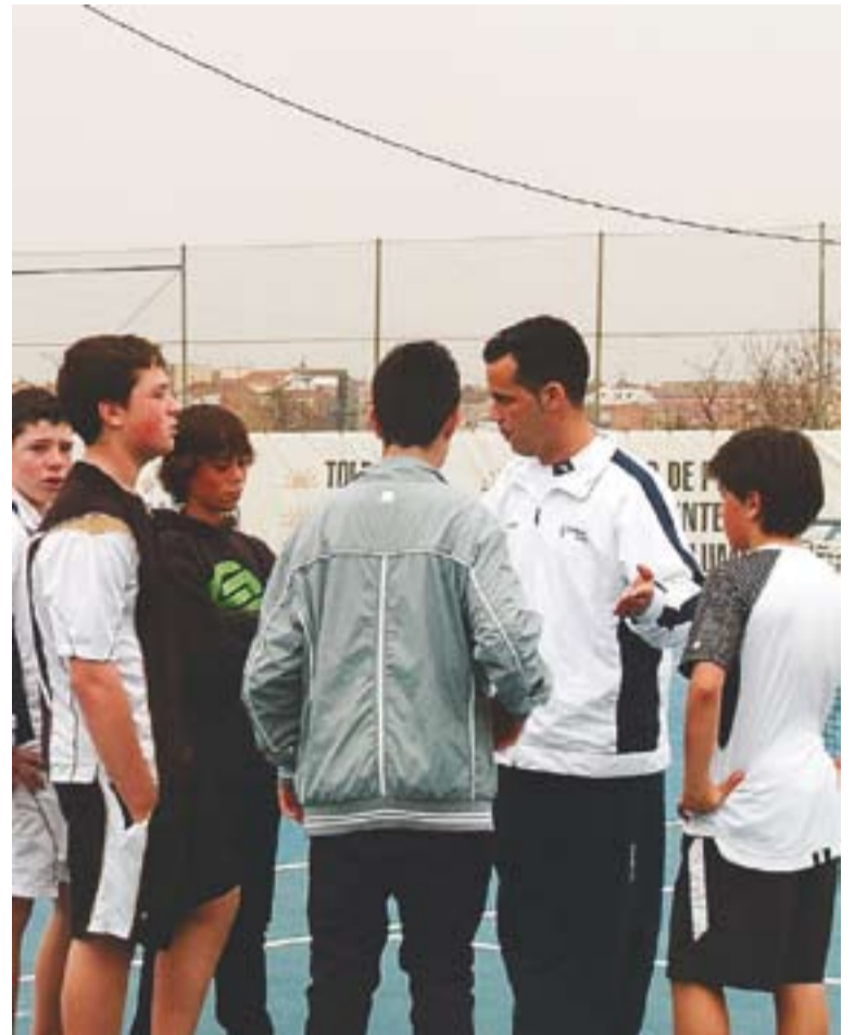
Els tennistes castellarencs parlen amb el seu entrenador a Lleida.

Amb el salt a la categoria d'argent del Campionat de Catalunya de tennis apartat fins el 2011, ara els jugadors de Castellar ja tenen la ment posada a una altra de les competicions on també s'estan jugant les garrofes. Es tracta del Campionat Comarcal, on es troben disputant la lligueta de la categoria d'or amb opcions d'acabar al primer lloc. Són tercers a un punt de l'Atlètic Terrassa, que és primer. +