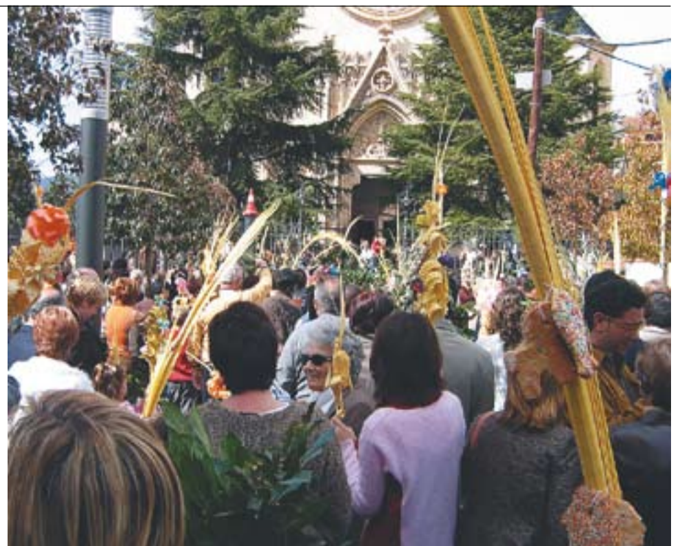
© El carrer Església durant el Dia de Rams. || ÀNGEL PASTOR

Amb aquesta celebració es commemora l'entrada triomfal de Jesús a Jerusalem. Ho fa poc després de tornar la vida a Llätzer i els jueus el reben amb aclamacions i palmes. Aquesta manifestació va contribuir de manera decisiva al fet que els summes sacerdots decidissin que Jesús havia de desaparèixer.