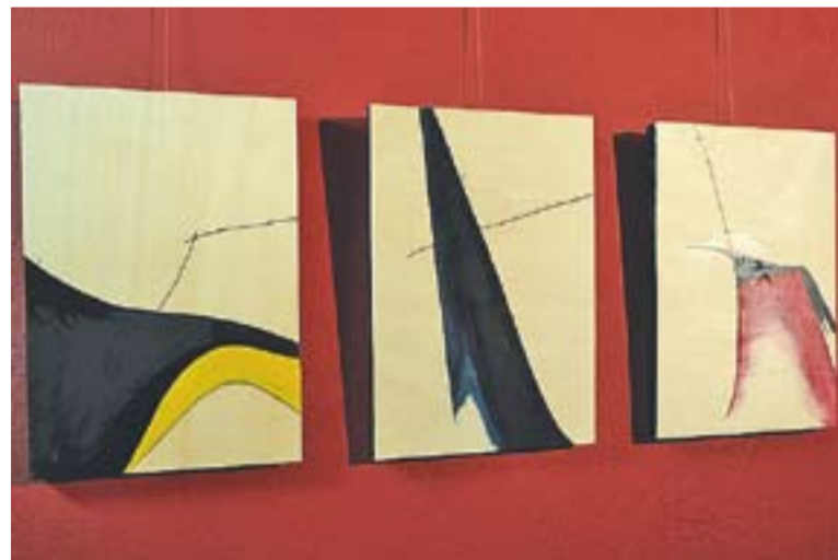
Detall de tres dels quadres de l'exposició de Segalés.