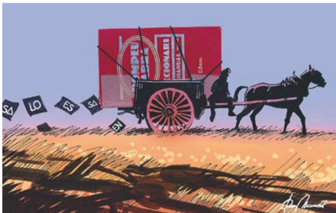
© El viatge de la llengua. || JOAN MUNDET

L a paraula "article" té múltiples acepcions: des de "disposició que en conjunt amb unes altres forma un estatut, un reglament, etc." passant per "gènere del periodisme d'opinió". S'hi inclou, també, la de l'article personal, aquell que "pot precedir els noms propis de persona". Si parem l'orella, veurem que a Girona usen "en", que a les Balears salen (sa nina, es bòtil...), i que de Ponent al delta de l'Ebre usen "lo". Sigui com sigui, al davant del nom sempre hi ha un article. Però la tendència, almenys en molts textos -sobretot traduccions- i quan van vinculats a noms propis, és a fer-los desaparèixer. Potser sí que podem escriure els noms propis sense articles al davant -entre altres canvis- però llavors cal acceptar que el geni del català, entenen com a "geni" la definició que es dóna a l'estructura particular d'un idioma, es va perdent, que es deixava fins a esdevenir un aiguabarreig d'estructures pròpies i de la llengua que té més propera. Aquest mateix fenomen es pot veure també en l'ús dels pronoms febles, que tendeixen a desaparèixer i la seva absència dóna com a resultat frases que grinyolen, que els falta quelcom. O els quarts en les hores: cada vega-