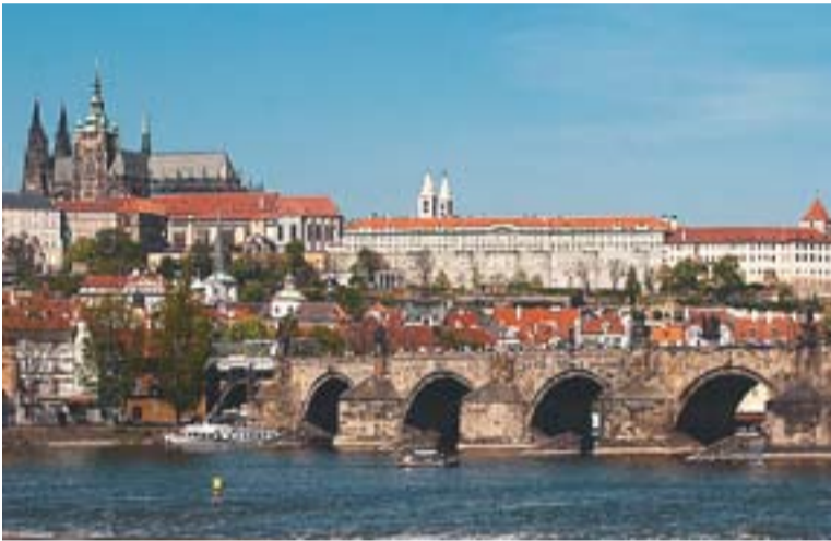
Praga és una de les capitals escollides per passar aquestes vacances

La platja i les capitals europees són alguns dels viatges escollits pels castellarencs per passar aquesta Setmana Santa