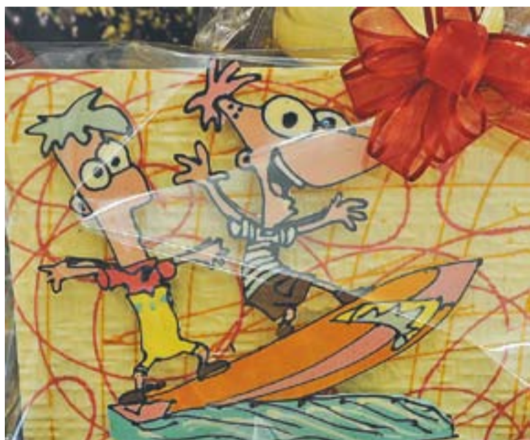
© Els dibuixos de Phideas i Ferb convertits en figures de xocolata. || JOSEP GRAELLS.