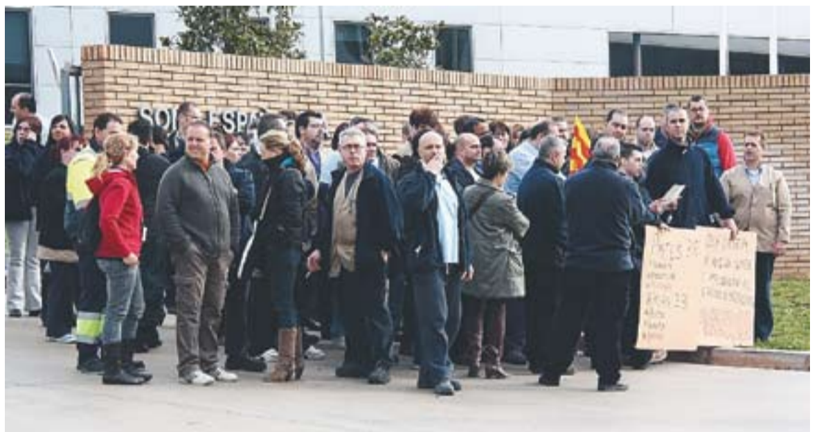
© Els treballadors es van concentrar dimarts a les 9 del matí a l'entrada del magatzem per protestar contra la venda | CEDIDA

Gairebé la totalitat de la plantilla se sumaran a la vaga que ha convocat CCOO per als propers dies 29, 30 i 31 de març amb la intenció d'exigir a la direcció de