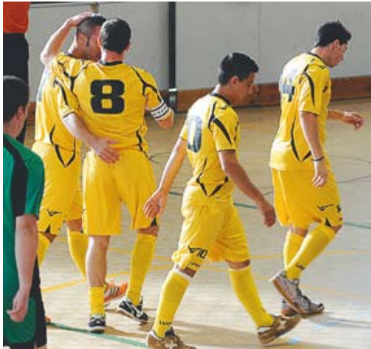
⊕ Els jugadors de l'Athlètic 04 celebren un gol en un partit a casa.

Per al partit de dissabte, els castellarencs tornaran a tenir una baixa sensible: el porter De Roa