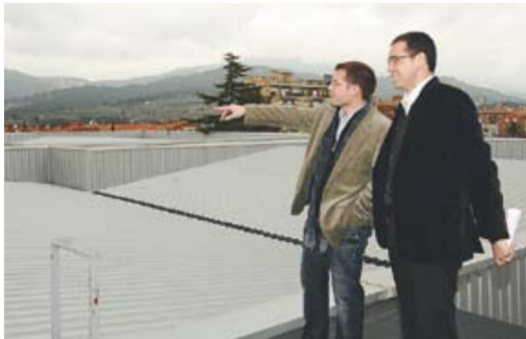
L'alcalde i el regidor de Via Pública a la coberta de l'Espai Tolrà.

Tot plegat permetrà la injecció de més de 856.590 kwh a l'any, fet que suposa l'equivalent al consum energètic anual de 325 habitatges que tinguin una factura d'entre 30 i 35 euros mensuals. Aquesta posada en marxa permetrà reduir al voltant de 388.806