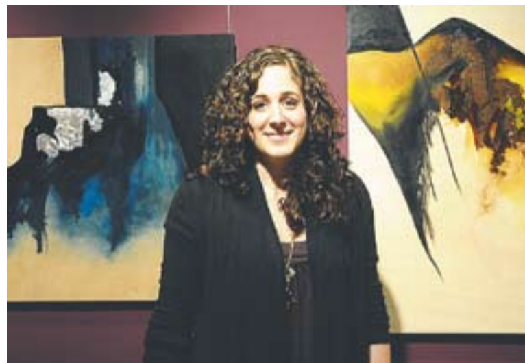
© Neus Segalés durant la inauguració de la primera exposició a Rich & Habti. || J.G.

La pintora treballa en nous projectes, tot i que no vol avançar-ne res. "Els pintors depenem de les nostres mans i per això no ens podem arriscar. En qualsevol moment podem fer-nos mal i haver d'ajornar el què feiem". +