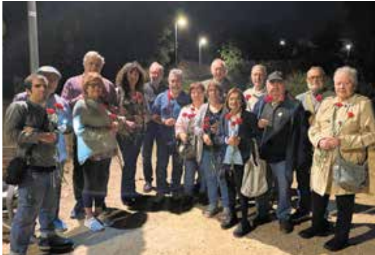
Alguns dels participants en l'homenatge a Lluís Companys, dilluns passat.

Homenatge d'ERC amb motiu de 84è aniversari de la mort del polític