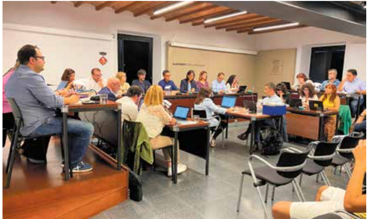
Una imatge de la sessió plenària del debat de pressupostos dimarts a Ca l'Alberola.