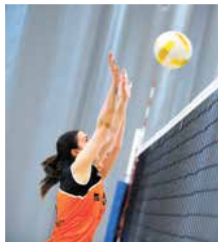
El femení va perdre el primer partit. || M. CASALS

Canvi de papers dels sèniors de l'FS Castellar de vòlei: guanyen els primers i perd el femení contra el líder.