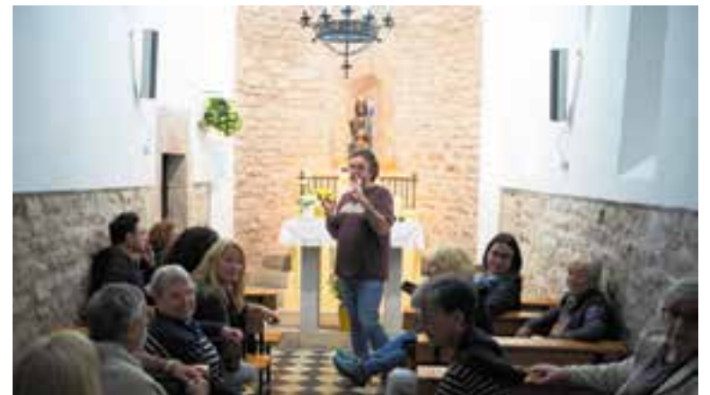
Aquest any les JEP també van incloure una visita a l'ermita de les Arenes.

Diumenge al matí, també incloses en les Jornades Europees de Patrimoni, hi va haver portes obertes d'11 a 14 h a càrrec de la parròquia de Sant Feliu del Racó. Diverses persones s'hi van apropar per contemplar les pintures recentment restaurades de Fidel Trias, així com per conèixer l'arquitectura d'aquesta església. +