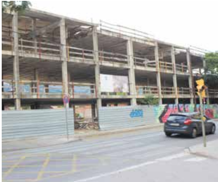
Recentment s'ha reactivat la construcció de pisos aturada a la carretera davant la BP.

El mercat immobiliari de Castellar del Vallès va mantenir el 2023 un creixement moderat en la construcció d'habitatges i una activitat relativament constant pel que fa a les transaccions de compravenda i lloguer, en línia amb la tendència comarcal del Vallès Occidental. Tot i que s'ha reactivat clarament la construcció d'obra nova en els darrers anys a Castellar, es fan més transaccions de lloguer que de compravenda. Segons l'Informe Anual de l'Habitatge del Consell Comarcal, durant l'any 2023, a Castellar del Vallès es van iniciar 56 habitatges i se'n van acabar 33. Tot i que aquestes xifres representen una contribució relativament baixa respecte al conjunt de la comarca, és coherent amb el seu perfil de municipi mitjà. A Sabadell, per exemple, es van iniciar 641 habitatges i se'n van acabar 349, mentre que a Terrassa se'n van iniciar 893 i se'n van acabar 369. Al Vallès Occidental, es van iniciar 2.409 habitatges i se'n van acabar 1.479 en total, fet que indica que Castellar aporta un 2,3% dels habitatges iniciats i un