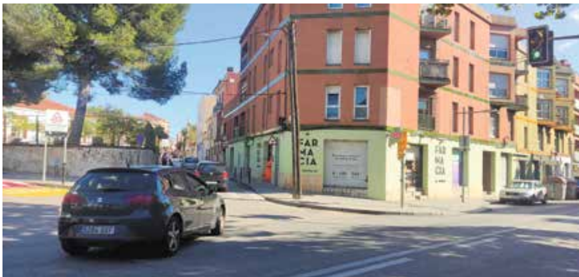
Vehicles fent el gir a l'esquerra des de la B-124 cap el carrer Doctor Pujol aquest dijous