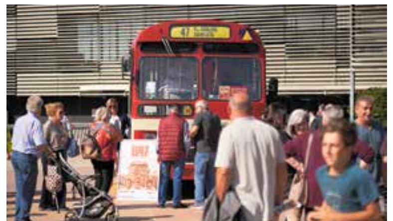
L'autobús de la pel·lícula 'El 47' va presidir la plaça d'El Mirador, el diumenge. || Q. P.

Aquell mateix any ARCA va adquirir el vehicle i es va encarregar de restaurar-lo per retornar-lo a l'aspecte original de l'època de TMB i l'ha preservat fins a l'actualitat. + || M.A.