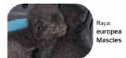
Raça: europea Mascles LIVIOUS, LEMUEL, LEYDI En adopció des d'agost de 2024

Més animals per adoptar a: www.facebook.com/adoptamcastellar