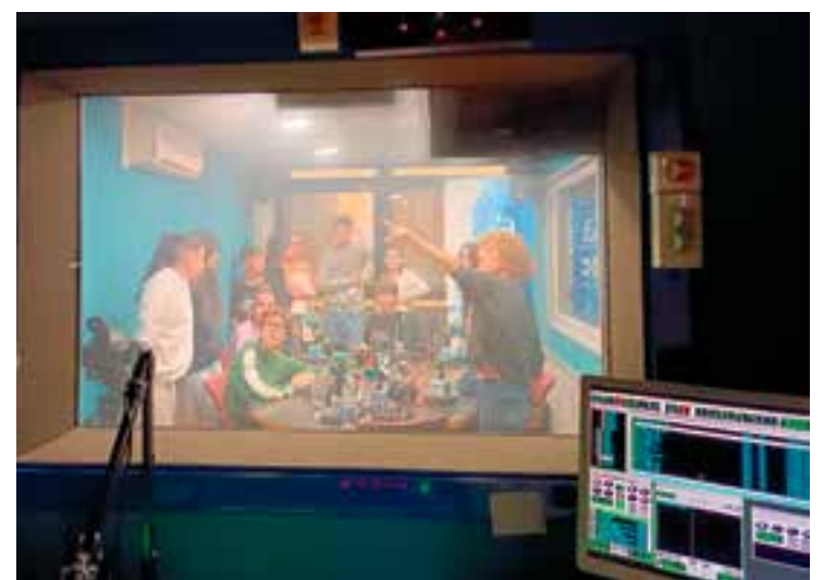
Alguns dels alumnes escolten explicacions dins l'estudi 1 de la ràdio.

Com és habitual en aquestes dates, Ràdio Castellar comença a obrir les portes a les visites escolars. Els primers alumnes que han descobert com funciona el mitjà municipal i han pres notes d'alguns consells de cara a l'elaboració de pòdcasts propis han estat els de tercer de l'Institut Castellar. Els alumnes hauran de crear, produir i desenvolupar un projecte de pòdcast dins de l'assignatura de llengua i literatura castellana. En aquest cas, el gran volum d'estudiants ha fet que les visites es divideixin en tres sessions, la de dilluns passat i els dos propers dilluns. El projecte del pòdcast engegat per l'Institut Castellar s'ha batejat com a Voces soñadoras i té com a objectiu final que cada grup realitzi un episodi. † || REDACCIÓ