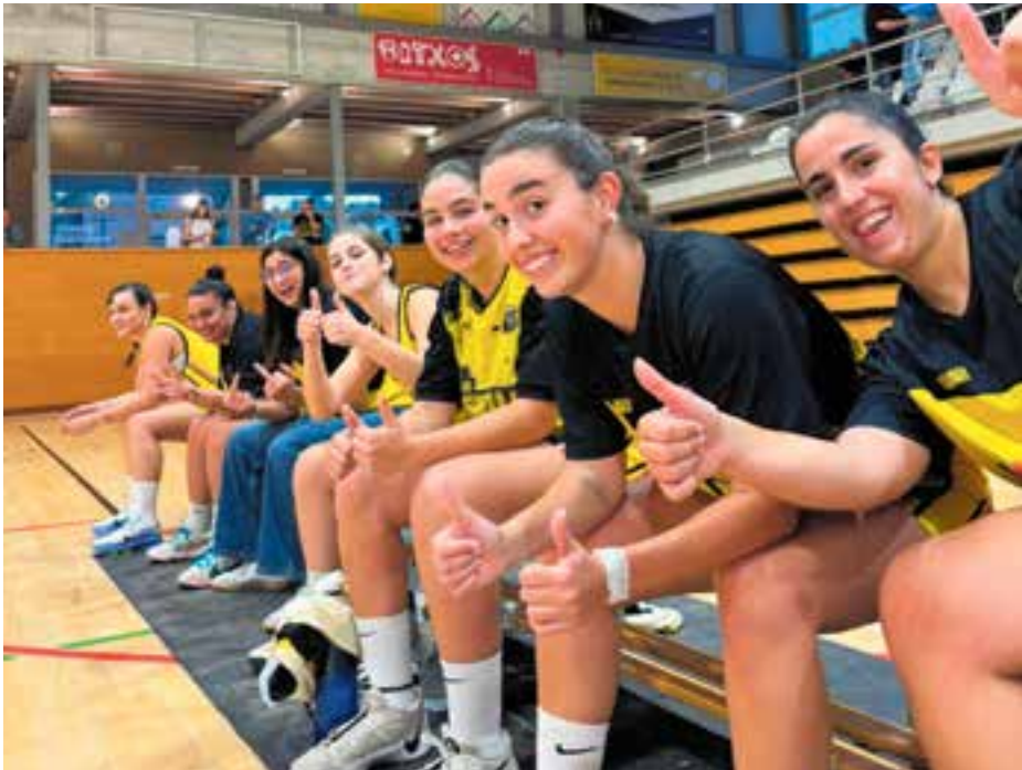
El masculí i el femení del CB Castellar continuen en creixement.

Es torna a repetir la doble victòria de la setmana passada amb els dos equips sèniors guanyant els partits respectius. El masculí ho va fer contra la UE Gaudí al Forum Sardanya per 50-68, mentre que el femení ho va superar per 61-48 contra el Nou Bàsquet Olesa B.