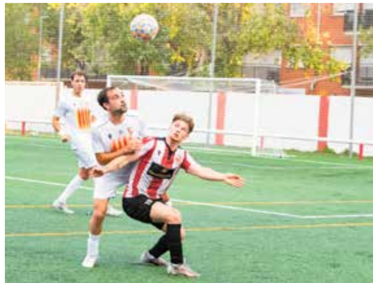
La UE Castellar es va quedar sense premi, de nou, per un error arbitral. || A. S. A.

final del matx el delegat federatiu va estar més preocupat per l'entrada a la grada de llaunes –que no es venen al bar del camp– i d'alguns fumadors ocasionals –ambdues coses expressament prohibides mitjançant cartells– que del lamentable espectacle ofert per una tripleta arbitral que durant 94 minuts va mantenir una actitud prepotent i altiva amb