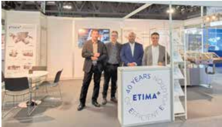
Els representants d'ETIMA al saló CPHI de Milà.

L'empresa ETIMA, especialitzada en la fabricació, el disseny, el muntatge i el manteniment de màquines etiquetadores, ubicada al polígon de Can Carner, va estar present amb la seva divisió farmacèutica al saló CPHI de Milà, que es va celebrar entre el 8 i el 10 d'octubre, la fira comercial d'indústria farmacèutica més gran del món.