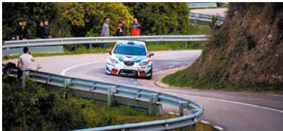
Xavi de la Vega enllaçant els revolts de la Pujada a Ullastrell amb el seu Seat León.

La XIV Pujada del Suro a Sta. Maria Vilalba - Ullastrell va deixar uns resultats excel·lents per a Xavi de la Vega i l'Alta Perfumeria Team, col·locant el seu Seat León en el segon calaix del podi de turismes i el primer de classe 3.