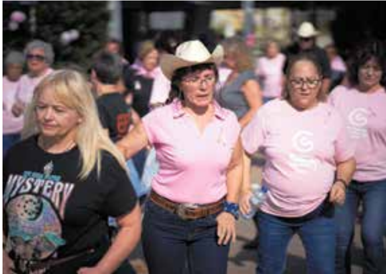
La ballada de country que es va fer l'any passat. || Q. PASCUAL

Els assistents a l'activitat podran adquirir una samarreta solidària