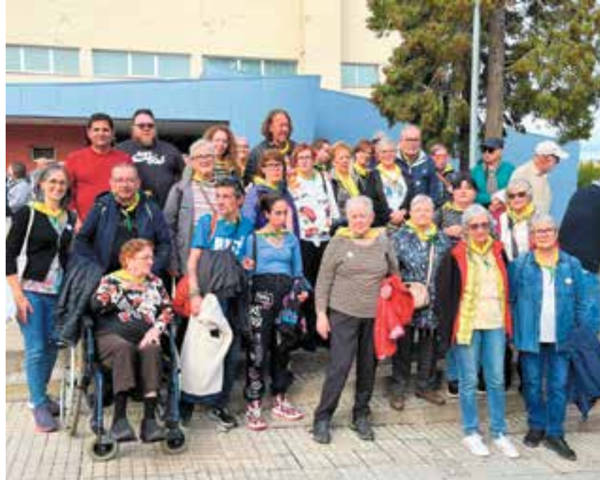
Una quarantena de persones vinculades amb Suport Castellar a la trobada de Berga.

Sota el paraigua dels actes amb motiu del Dia Mundial de la Salut Mental, una quarantena de persones vinculades amb l'entitat castellarenca Suport Castellar van participar dissabte 12 d'octubre en l'acte central d'aquesta efemèride a Berga, que per un dia va esdevenir capital catalana de la salut mental. Més de 800 persones i 90 voluntàries van assistir a l'acte organitzat per la Fundació Horitzó i la Federació Salut Mental Catalunya. És l'hora de prioritzar la salut mental a la feina va ser el lema protagonista de la jornada, que va servir per reivindicar l'accés a una ocupació digna, però també a fomentar entorns laborals que preveniu i promoguin el benestar emocional dels treballadors. Segons van reivindicar