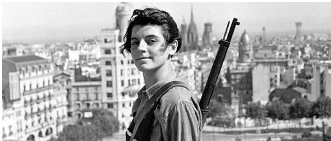
Marina Ginestà, periodista, escriptora, intèrpret i militant antifeixista catalana, serà homenajada a L'Alcavot dissabte.

I dijous 24, a les 20.30 h, la Cia. Alcavot Teatre presenta Guimerà 100 anys . Enguany es commemora el centenari de la mort de Guimerà. Per això, L'Alcavot vol retre-li homenatge amb un espectacle que recorda la seva obra i biografia. La proposta s'inclou al cicle S'horabaixa , un espai per a la literatura, el teatre, la poesia en el format habitual de cafè-teatre que crea L'Alcavot. + || M.A.