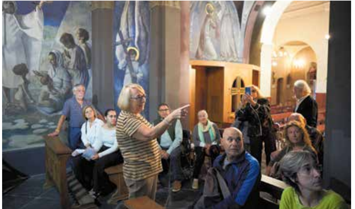
Visita guiada a l'Església de Sant Feliu, on s'acaben de restaurar els frescos pintats pe Fidel Trias.

A la sortida van participar 40 persones, que van poder gaudir d'una caminada distesa i plena d'història. "Avui coneixerem dues masies que han sabut reformular-se per assegurar la seva conservació a través de nous usos" . D'una banda, Can Carner s'ha reconvergit en una cooperativa d'habitatge, formada per diverses famílies que tenen cura de la masia. I de l'altra, la propietat de Can Pèlags es vol re-