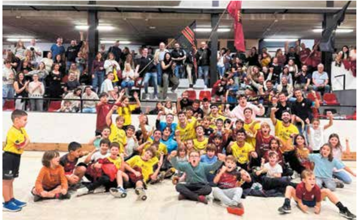
La comunió entre jugadors i afició és total a l'HC Castellar. El suport de la grada continua sent decisiu en l'ànim de l'equip.

La pròxima jornada, els castellarencs visitaran la pista del CP Vilanova (dissabte, 19.45 h), penúltim classificat que només ha sumat un punt en quatre jornades, un bon cap de setmana per poder continuar amb aquesta bona ratxa. ➔ | A. SAN ANDRÉS