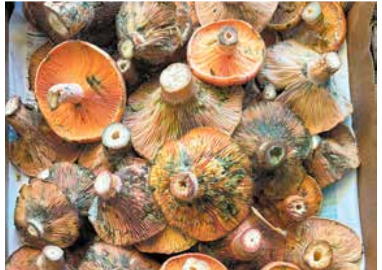
La Botiga del Castell ofereix rovellons collits per boletaires castellarencs.

Per últim, per tal de no extraviar-vos, no us allunyeu dels camins principals i fixeu llocs i hores de retrobament amb els vostres companys. +