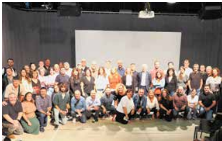
Representants dels 70 mitjans que han col·laborat en el Llibre Blanc.