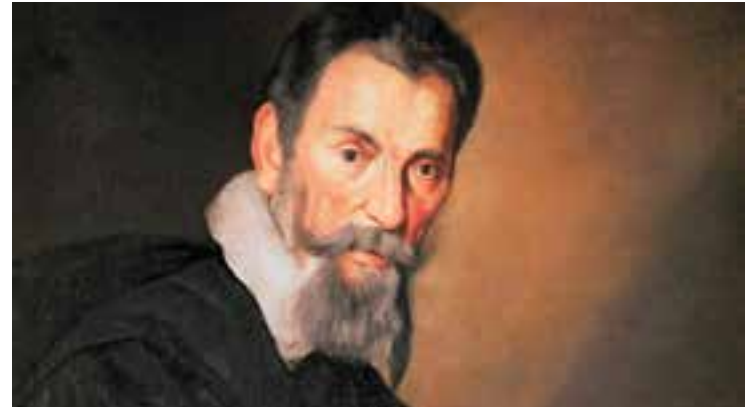
Fragment del retrat de Claudio Monteverdi, de Bernardo Strozzi.