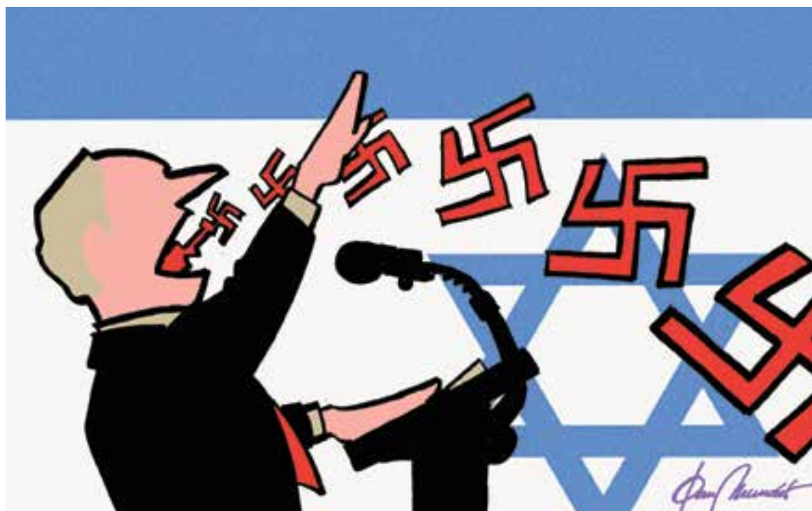
© L'ONU, U... NO. || JOAN MUNDET

"Quantes vegades girarem el cap a l'altre costat i farem veure que no hem vist res?"