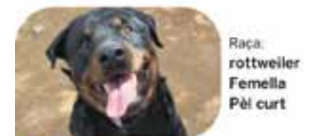
Raça: rottweiler Femella Pèl curt SIGRID En adopció des de març de 2024