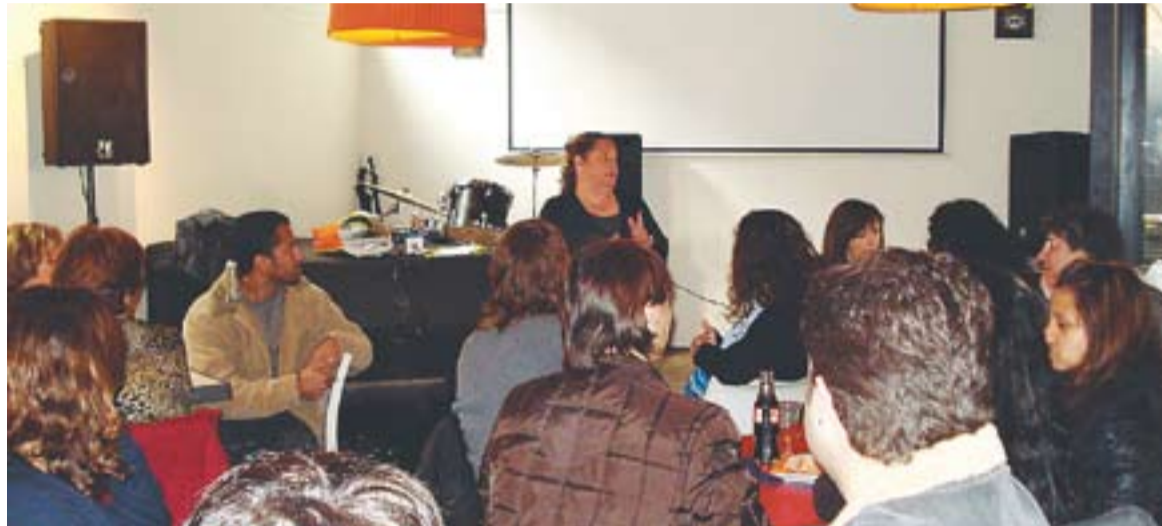
El Calissó Espai Plural va acollir dimarts a la tarda el nou aparellament de parelles lingüístiques de cara a la Primavera

La nova tongada d'aparellaments es va fer en un ambient molt distès, un berenar a Cal Calissó. Això va permetre a les parelles més experimentades explicar a les noves de quina manera aconseguen trobar-se i relacionar-se i