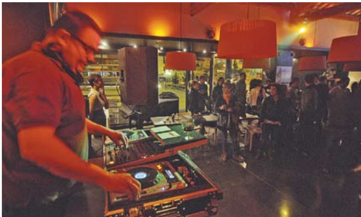
⊙ Les sessions de jazz, de dj's o els concerts s'hauran d'acabar a les 12 encara que el bar continuarà obert.