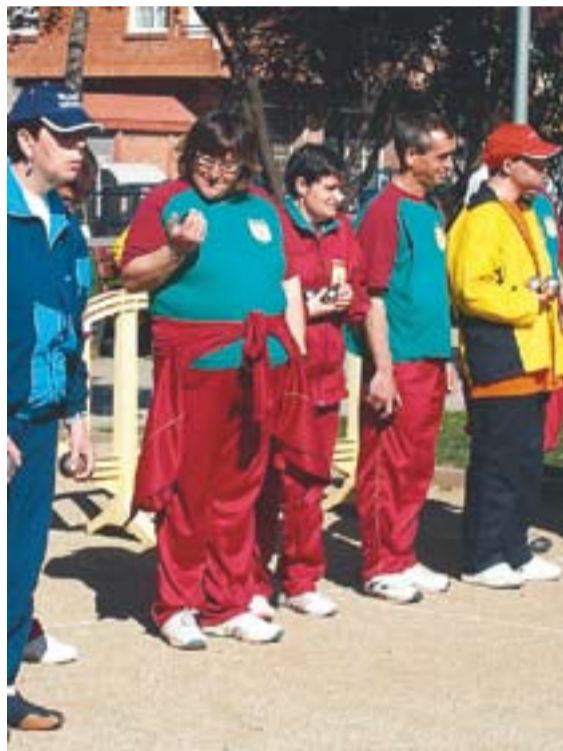
Participants a la prova de petanca.

La competició va durar tot diumenge el matí i part de la tarda. Cap a les sis es va fer l'en-