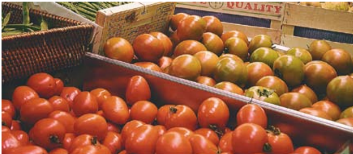
El guanyador de la recepta s'endurà un àpat per a dues persones al restaurant La Taverna del Gall. || JOSEP GRAELLS

Els alumnes, d'edats diverses, es van mostrar molt interessats en les parcel·les del Botafoc, ja que molts d'ells volen construir un hort a petita escala, alguns en terrasses, d'altres en petits balcons i uns altres en jardins. ➔