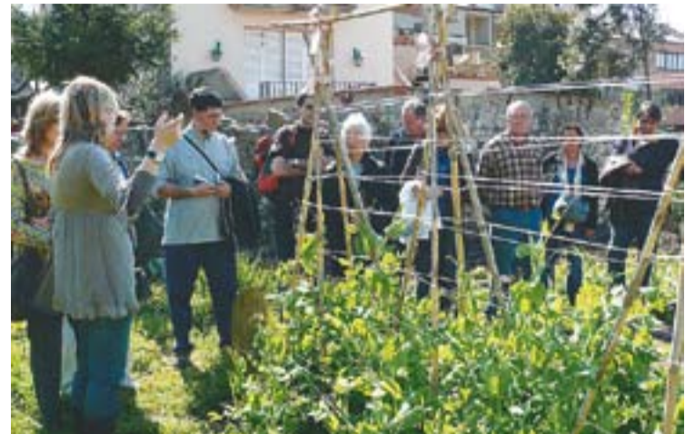
Els alumnes, en unes de les parcel·les, durant la visita. || M. A.

Tothom qui hi vulgui participar podrà presentar les seves receptes fins al 14 de maig. ➔