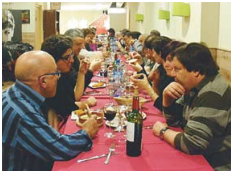
© El premi als valors republicans es va donar a la pizzeria La Nona. || C.D.

Més enllà d'aquests valors més coneguts, per Homet la República també va implicar "tenir en compte els valors de ciutadania: els ciutadans amb drets