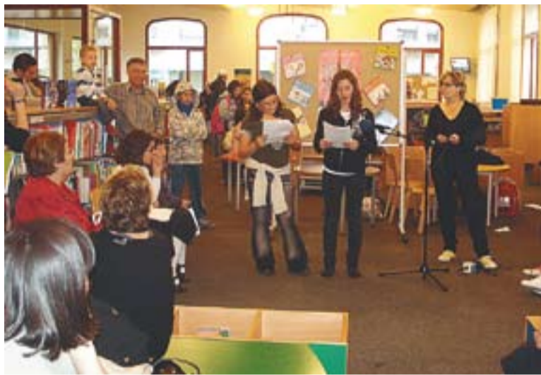
Moment de la lectura en el Dia Internacional del Llibre Infantil.

La commemoració del Dia Internacional del Llibre Infantil ja fa tres anys que se celebra a la Biblioteca castellanenca, emmarcada enguany en els actes de celebració del 25è aniversari de la creació d'aquest servei. "La convocatòria ha anat molt millor que l'any anterior i això demostra que es consolida" , han dit les responsables de la Bibli-