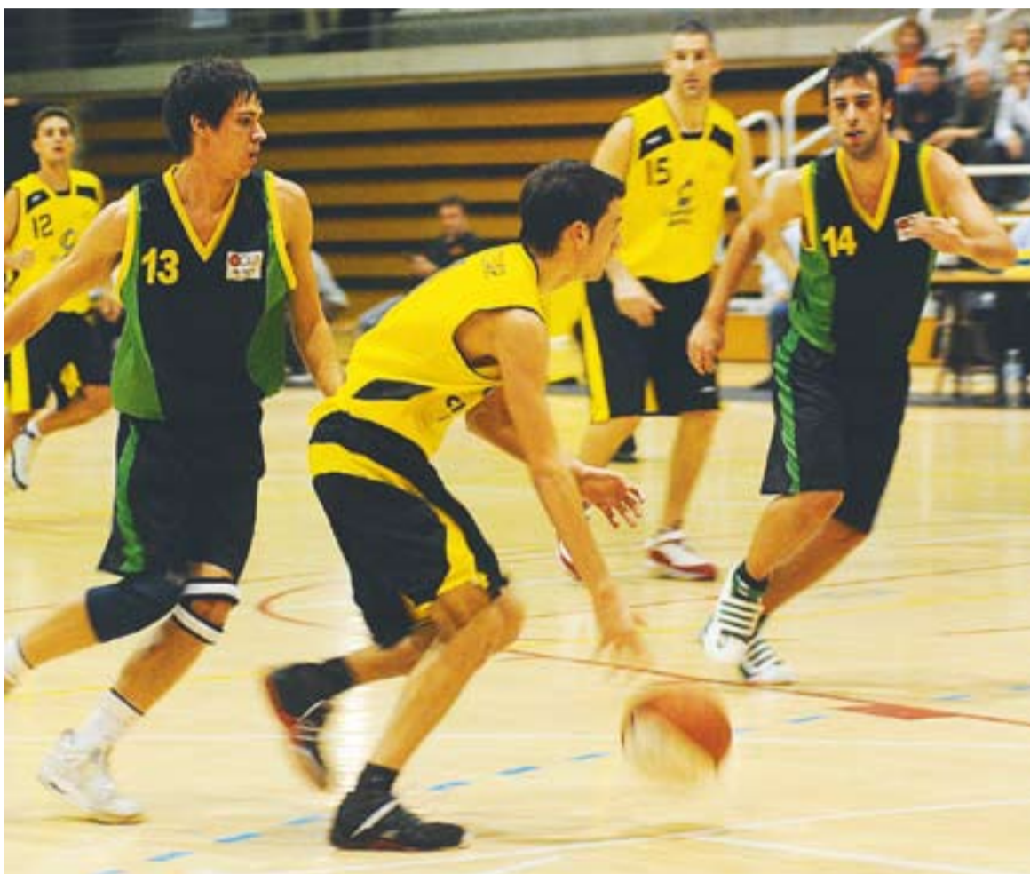
El base Albert Cadafalch en una acció del partit d'anada contra el Riera de Cornellà.

ESTEVE TORNA || Xavi Esteve tornarà a entrar a la convocatòria per a aquest diumenge contra el