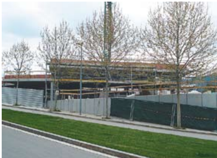
Una imatge de les obres de la nova escola bressol vista des de la Ronda.

Dilluns i dimarts hi haurà jornades de portes obertes a l'escola bressol municipal El Coral. En el cas de la nova escola bressol, que es preveu que s'obri al setembre, es farà una jornada informativa dilluns a les 19.30h a la Sala Blava de l'Espai Tolrà. La preinscripció per aquests dos centres es podrà fer del dia 3 al 14 de maig. En total, s'oferten 94 places de la nova escola i les que restin d'El Coral si alguns nens no continuen l'any vinent. En total, doncs, durant el curs vinent hi haurà 155 places d'escola bressol pública. †