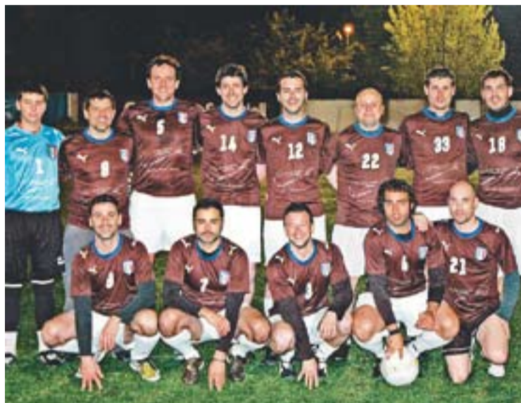
© L'equip del Cal Petasques, guanyador de la primera edició de la lliga. || UEC