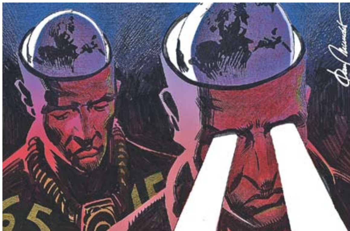
© Dins el món. || JOAN MUNDET

Hi ha una sèrie de factors que potencien aquesta capacitat: