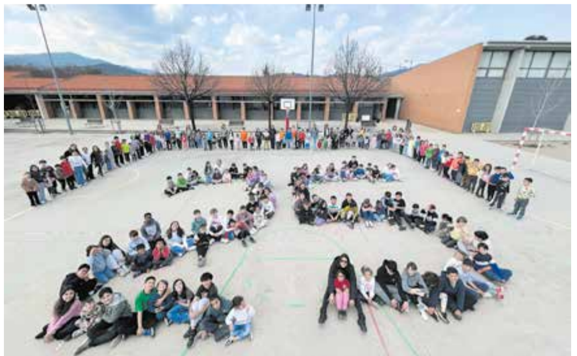
Famílies, alumnat i professorat formant el número 25 al pati de l'escola el passat 27 de març.