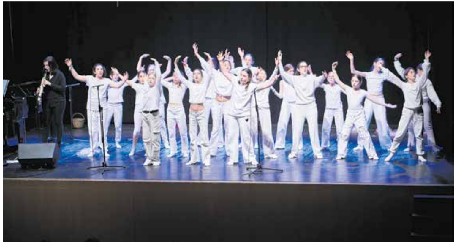
Moment del concert de primavera del Cor Sant Esteve a l'Auditori Municipal, titulat 'Les veus de la terra', amb la coreografia creada per Èlia Fort.

Unes cinc cantaires de la Coral Tic Tac també van interpretar dues peces po-