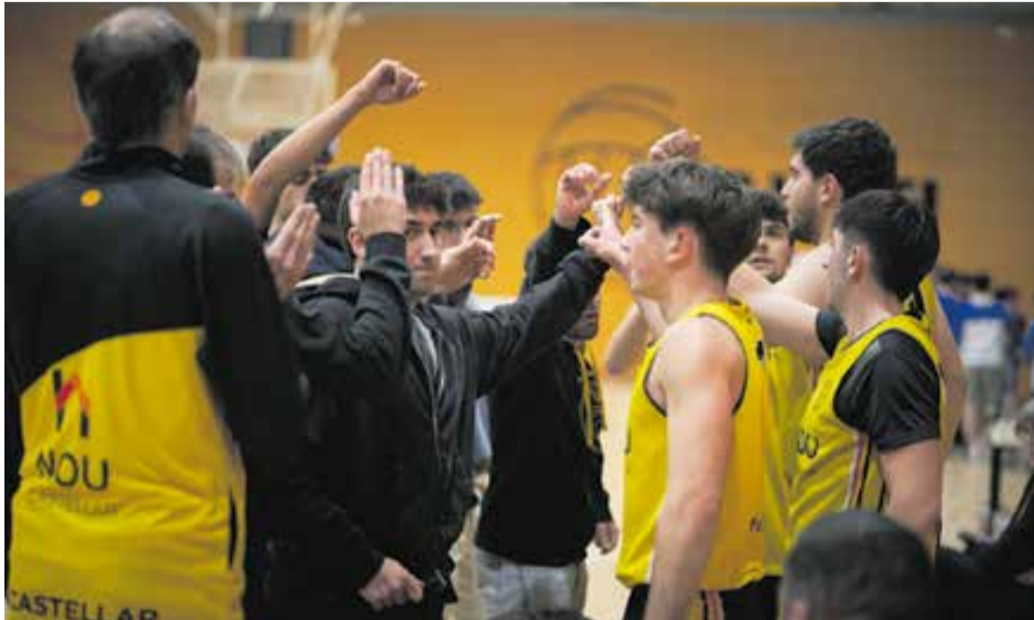
El masculí del CB Castellar ho té complicat però lluitarà fins al final per a no perdre la categoria.

Masculí i femení afronten la recta final en la lluita per la salvació