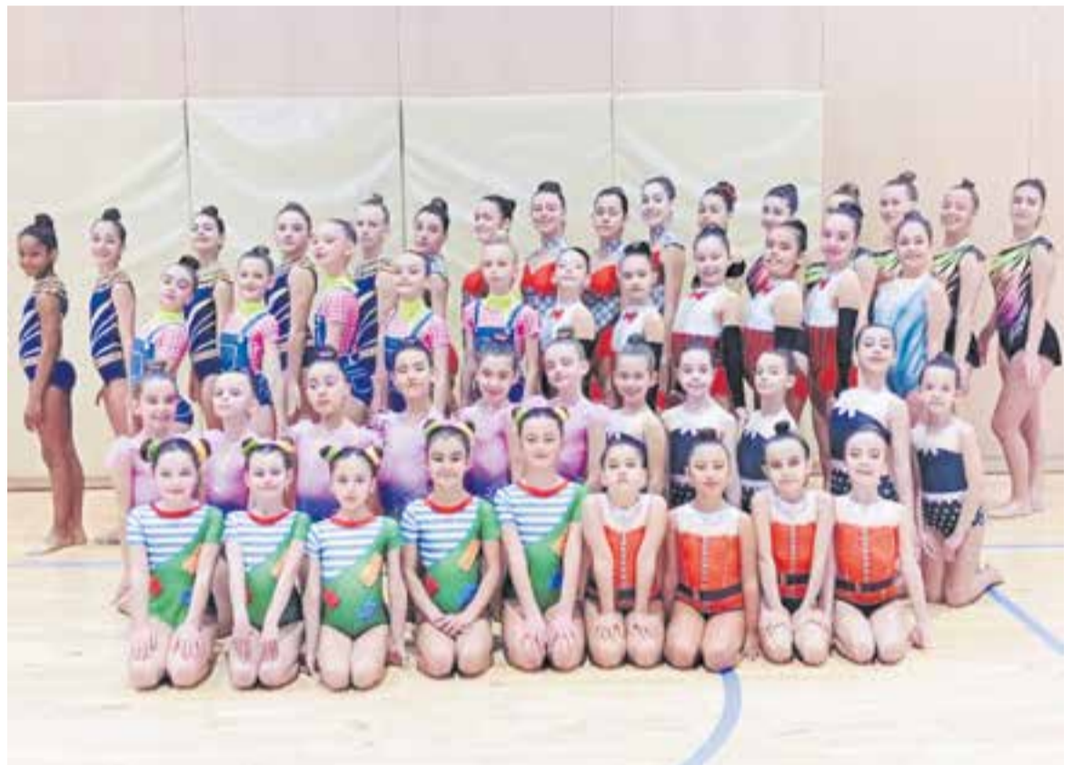
Algunes de les esportistes federades del Club Rítmica Clau de Sol.