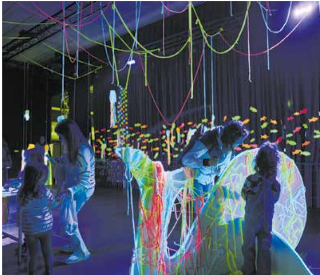
Ambientada en l'oceà, l'edició del 2025 va ser tot un èxit.