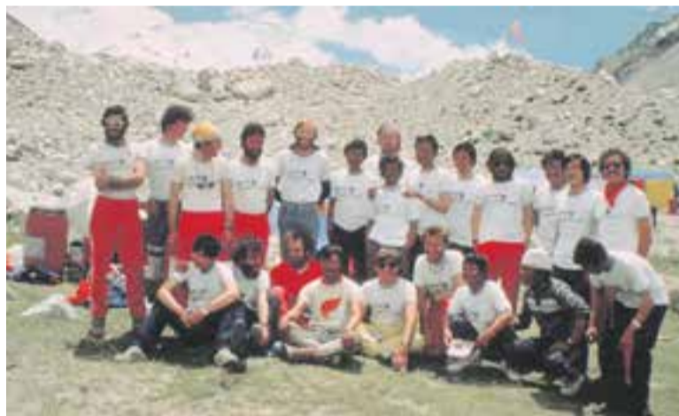
'Everest 1985', la pel·lícula que narra la gesta catalana al sostre del món.