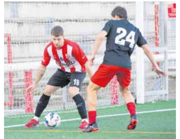
La UE Castellar vol tornar a superar al líder Singuerlín. || A.S.A.

Amb una setmana de descans pel mig, cos tècnic i jugadors han fet net per a viatjar a Santa Coloma amb totes les garanties possibles per a enfrontar-se al líder destacat. El Singuerlín acumula 56 punts, a falta de disputar els 60 minuts que li resten del partit enfront de l'APA Poble Sec (1-1). Els castellarencs ja saben el que és superar a aquest rival, amb un 2-0 aconseguit en la primera volta, que va significar la segona derrota de la temporada pels verd-i-blancs. + || A. SAN ANDRÉS