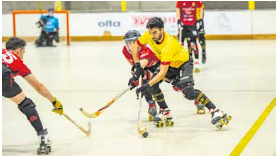
Si la situació es manté, Noia i Castellar estan destinats a trobar-se de nou en una promoció d'ascens. || A. SAN ANDRÉS

El calendari castellarenc és força equilibrat amb dos rivals que s'hi juguen les garrofes i tres que no. Aquesta setmana, els de 'Fiti' visitaran el pavelló de Les Comes d'Igualada (diumenge, 18:30 h), per rebre la pròxima setmana al Bell-lloc, viatjar a la Seu per a enfrontar-se al Cadí, rebre al Sant Celoni i visitar el Noia, en una última jornada que pot ser explosiva. †