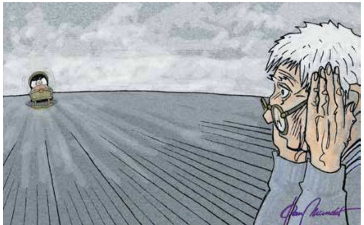
© Temps fugit plus. || JOAN MUNDET

He de dir que, afortunadament, per a la nostra trobada semestral només necessitem poca cosa més que una taula quadrada, un parell de cadires i la predisposició de re-