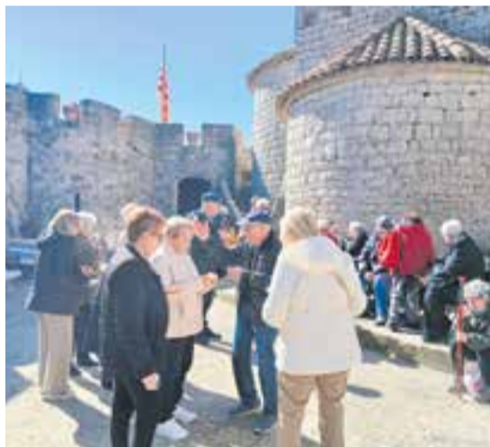
Trobada de Primavera al Puig de la Creu.