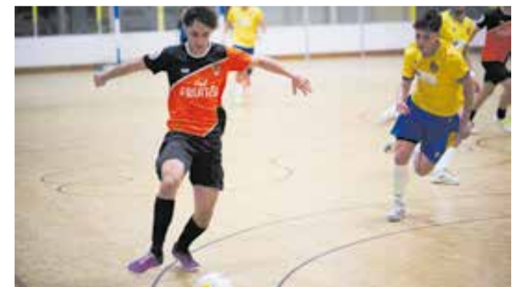
Els taronges volen continuar puntuant enfront de La Prosperitat.

L'FS Castellar torna aquesta setmana a la competició, després d'una setmana de descans, amb viatge fins a Nou Barris, per a enfrontar-se a l'Everest Prosperitat (dissabte, 17:30 h), un rival directe en la lluita per la tercera posició, a només quatre punts per sota.