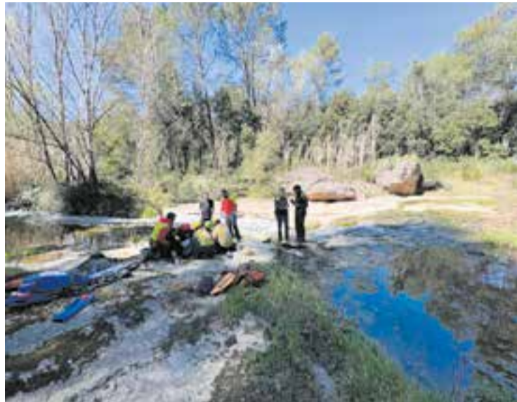
Rescat d'una dona accidentada Divendres Sant.

El bon temps i les dates festives han fet que moltes persones hagin volgut gaudir de la natura durant les festes de Setmana Santa. Aquest fet, però, també ha comportat una feina extra per als serveis de Bombers de