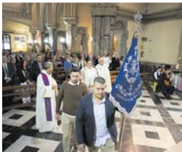
Benedicció del banderí de l'A.R.A. Nuestra Señora del Rocío. || Q.P.