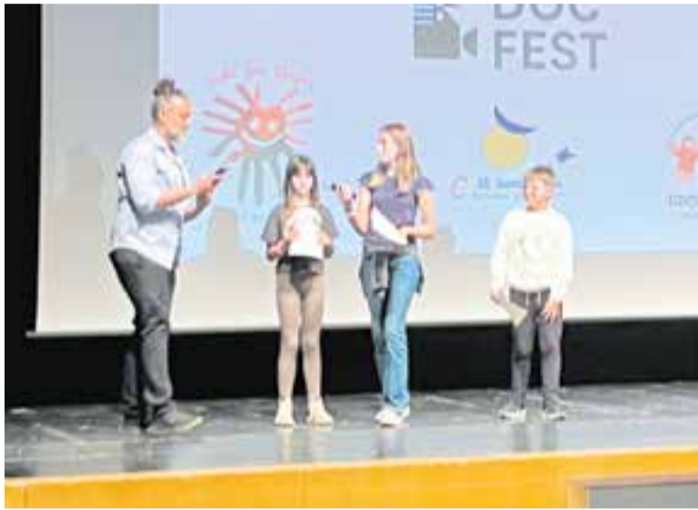
Alumnes participants en el projecte dalt de l'escenari, dimecres passat. || C. ARAGONÈS

L'Auditori va acollir la quarta edició del Nepal School DocFest