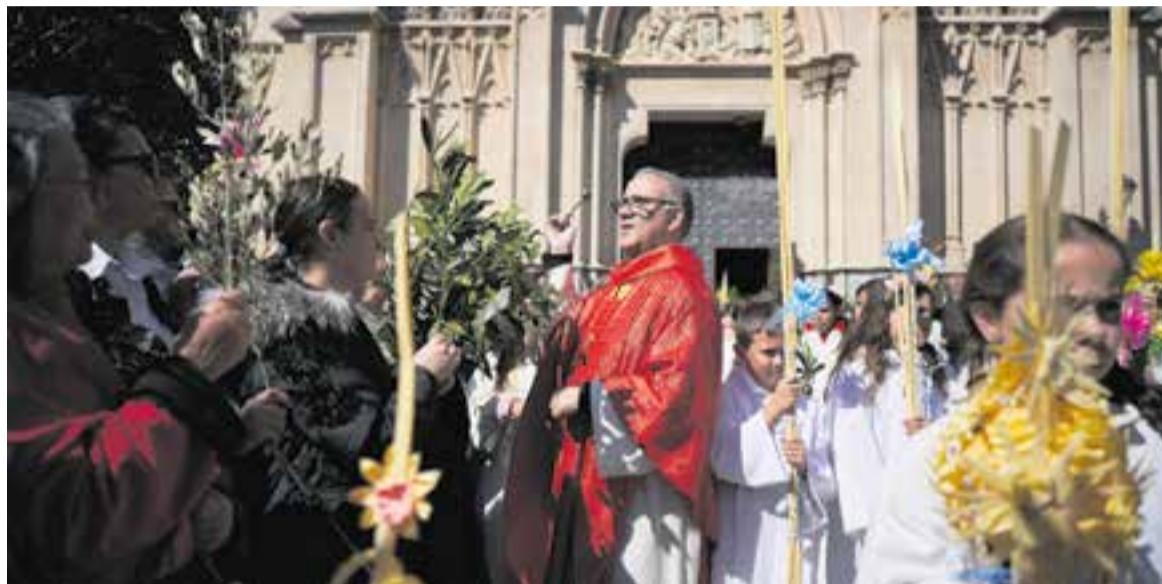
Benedicció de la palma, branques i palmons durant el Diumenge de Rams fora de l'església de Sant Esteve.

Un matí assolellat i un temps primaveral esplèndid van presidir la 23 Trobada primavera Puig de la Creu que es va fer Divendres Sant, el 3 d'abril, al Puig de la Creu. Unes 200 persones van passar durant tot el matí, amb més assiduïtat a l'hora de les torrades amb oli, sal i l'aigua, així com durant el Cant de la Passió. Durant la trobada, es podia visitar la capella, pujar al terrat, i estar-se a la talaia de l'edifici. Les famílies van aprofitar el bon temps per passar el dia a l'Era del Drac (espai de l'antiga piscina). †