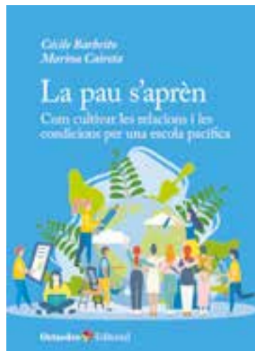
"La pau s'aprèn", C. Barbeito i M. Caireta.

Un dels punts centrals és redefinir el concepte de pau. "La pau no és tranquil·litat ni absència de conflicte, al contrari, el conflicte és inevitable i pot ser una oportunitat de