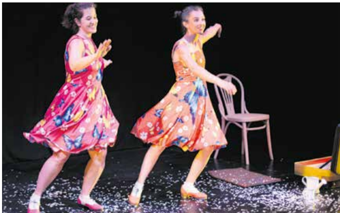
Imatge de l'espectacle 'TipTAPTop' de la companyia Teatre al Detall.

La companyia torna a Castellar amb una proposta diferent de les anteriors. Té 35 minuts de durada i combina moments d'humor, màgia i tendresa amb una narrativa accessible per als més petits. "Ens fa molta il·lusió tornar per-