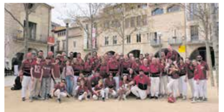
Els Castellans de Castellar a Banyoles, el passat 22 de març. || CEDIDA

Pel que fa a les activitats castelleres, el 18 d'abril els Capgirats organitzaran la segona edició de la iniciativa "Viuen els castells en família", un matí ple de jocs i tallers oberts a totes les famílies del poble. Tindrà lloc a partir de les 10.30 h a la plaça Calissó. + || REDACCIÓ