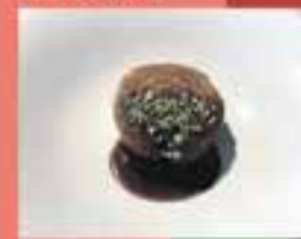
RESTAURANT CARBI / Roll Carnivor