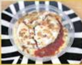
LA CAPRITXOSA / Capritx brutal