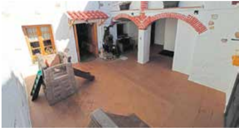
El pati de l'escola bressol Casamada quedarà buit a final de curs.