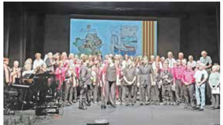
Moment del 32è Musicoral a l'Auditori Municipal Miquel Pont.

El concert es va cloure amb un cant comú, enguany, L'habanera del Vallès .