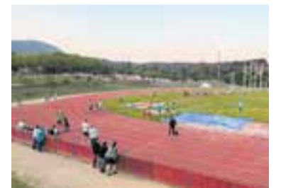
Les pistes d'atletisme van acollir el control de llançaments.