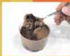
LLULLU CAKES / El cor salat d'un postre dolç