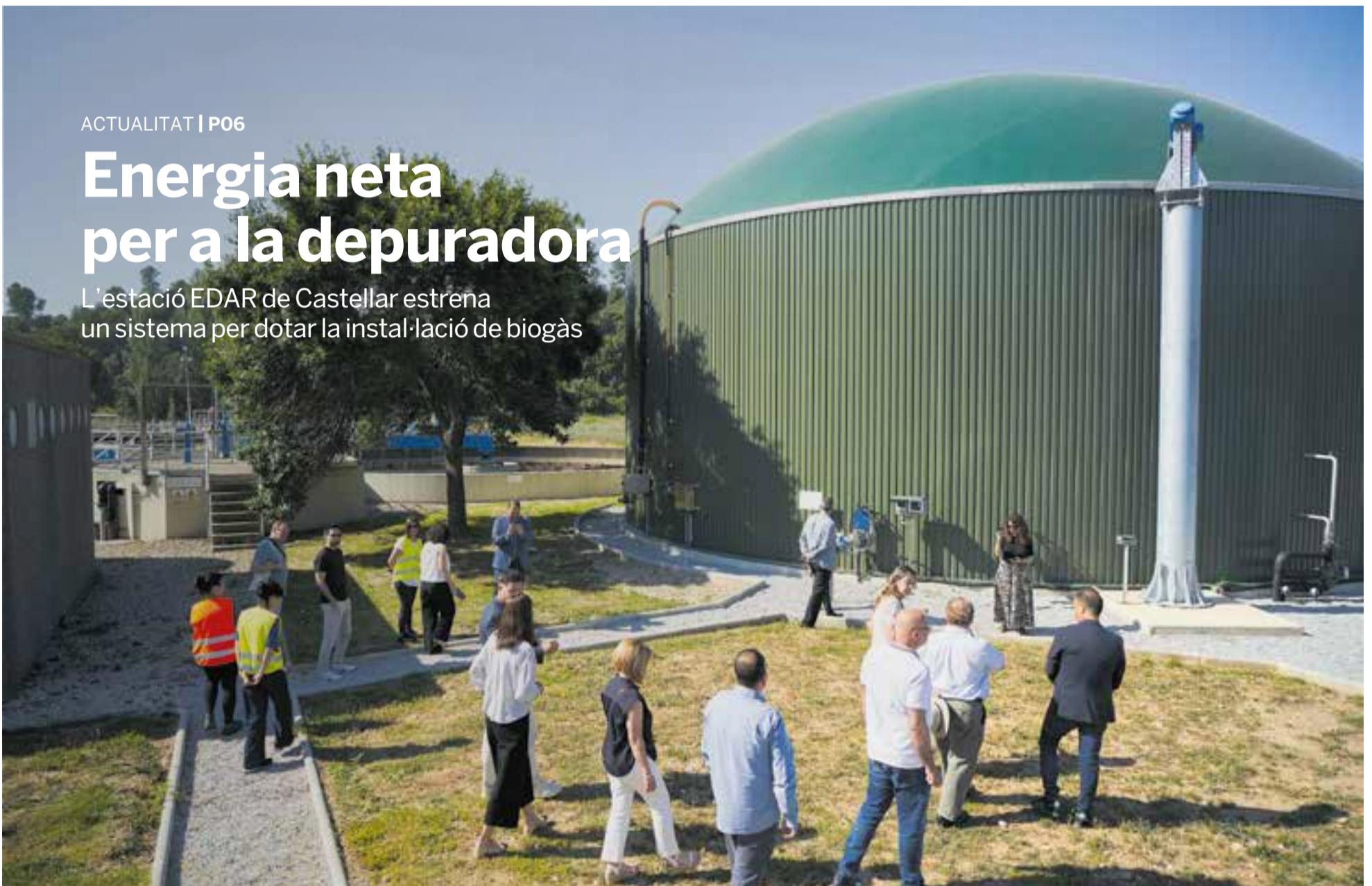
La nova instal·lació de l'EDAR, que es va presentar aquest dijous, permetrà assolir fins al 40% de l'energia que la planta fa servir per al desenvolupament de la seva activitat

L'estació EDAR de Castellar estrena un sistema per dotar la instal·lació de biogàs