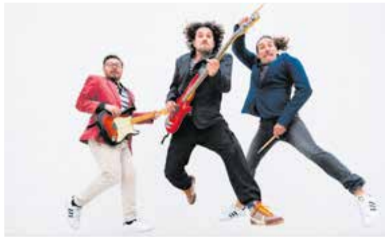
Moon Police retrà un homenatge als The Police al Calissó.

El músic destaca especialment la capacitat del trio britànic per fusionar estils en plena explosió de la new wave i el punk dels anys setanta. L'objectiu de Moon Police és oferir un concert que ho cuida tot: "el vestuari, la gestualitat i fins i tot els arranjaments originals. M'he mirat molts directes de The Police per captar-ne els detalls" . La banda vol que el públic "surti amb la sensació d'haver reviscut un concert de The Police" . ➔