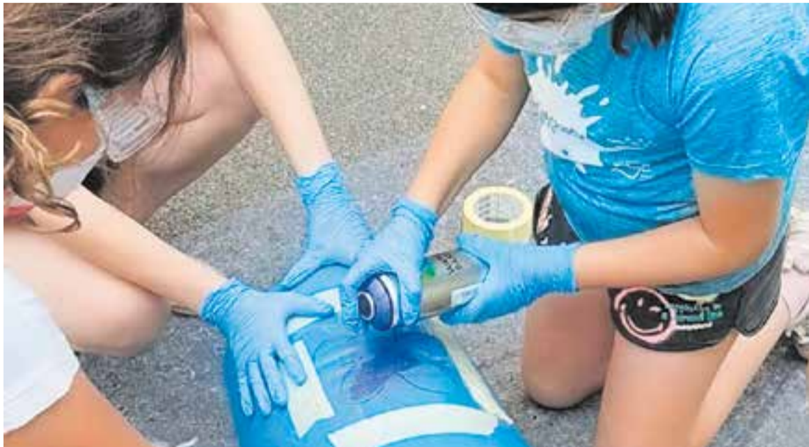
Membres del Consell d'Infants decorant una de les papereres.