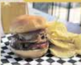
PINTA EL PATIO / Mini viudo