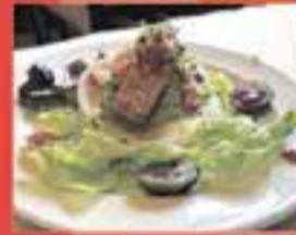
LA MASIA DEL RACÓ / Taco de tataki de tonyina