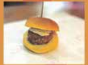
CASÉ CARNISSERS XARCUTERS / Mini Burger Casé