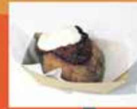
GARBANZO NEGRO / La Bomba