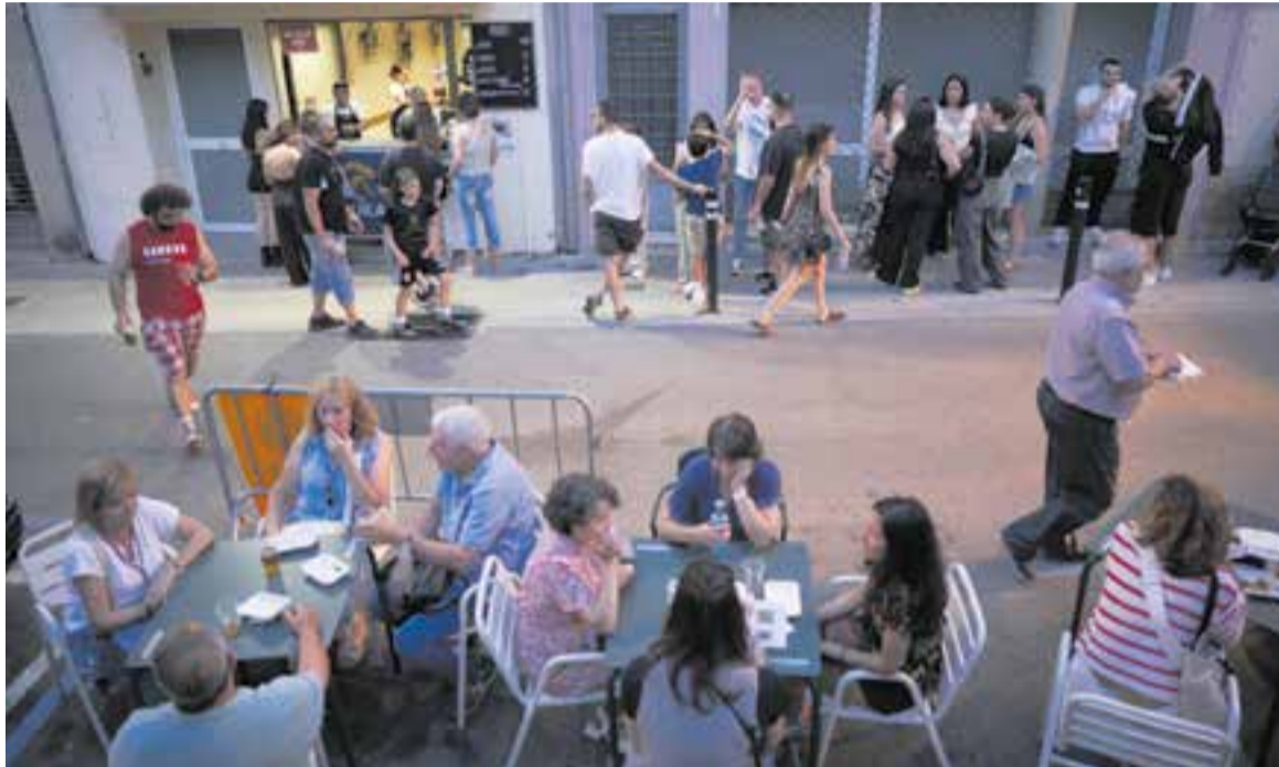
Ambient en un dels establiments participants al CorreTapa de l'any passat.

El 10è CorreTapa, del 3 i el 6 de juny, comptarà amb 36 establiments