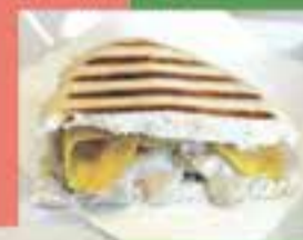
TXIVARRI / Rocambolesc