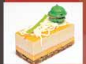
PASTISSERIA MUNTADA / René