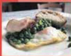
MAS UMBERT / Passejats de l'Umbert