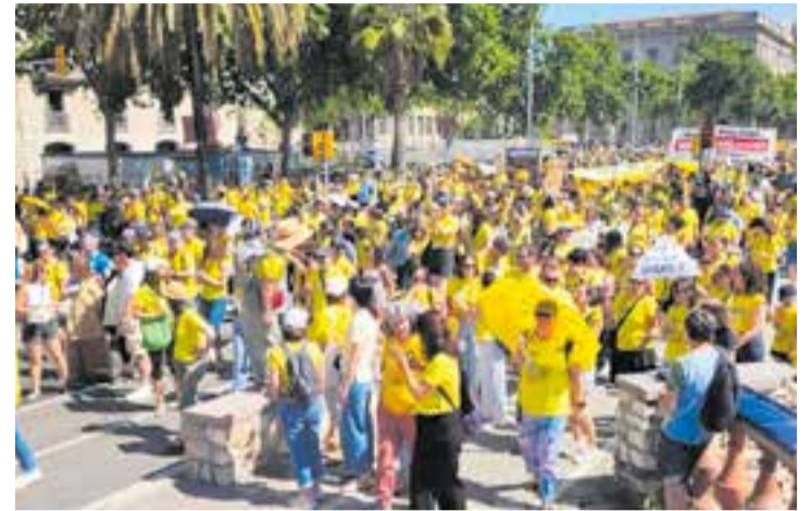
Manifestants castellarencs a Barcelona dimecres.