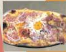
CAL CAMILO / Pizzeta Brava