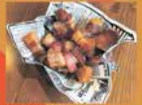
LA BALENA / Torreznos de la Balena