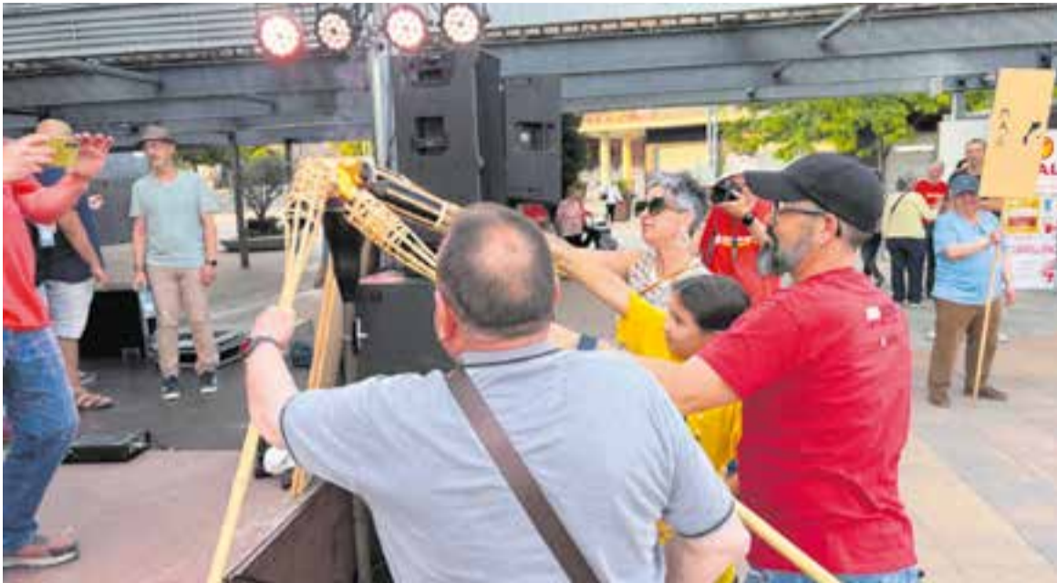
Moment de l'encesa de la flama principal del Correllengua. || J. G.