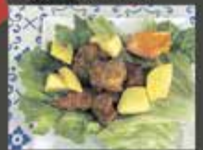
SABOR KEBAB / Pakora de pollastre