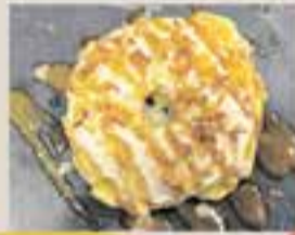
QUINATS / Beef Loop