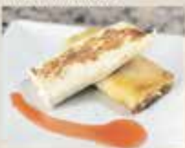
SOCIETAT CASTELLARENCA / Mar i Muntanya