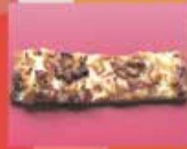
FORN DE PA VALERO / La focaccia de Valero