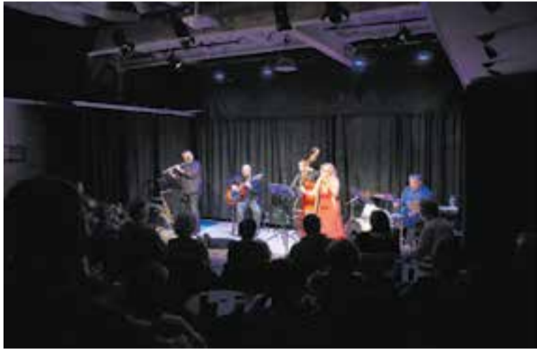
Els Jazzics tornen a L'Alcavot dissabte 30 de maig. A la imatge, fa un any.