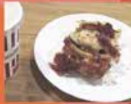
LA JIJONENCA / Niu trencat d'iberic