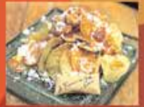
LA TAVERNA DEL GALL I LA GALLIN / Rovell i Mar