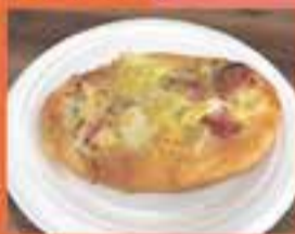
MARIANA BAKERY / Coca Alemanyà