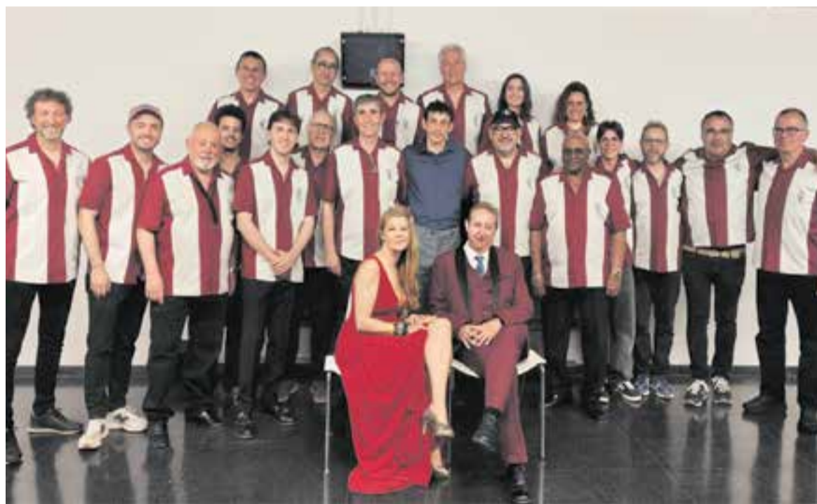
La Castellar Swing Band competirà amb la Sant Quirze Big Barra Band a la 1a batalla de bandes de swing a Castellar.

Les batalles consistien en duels musicals entre grans orquestres que competien davant del públic i dels ba-