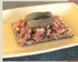
CAL CALISSÓ / Tàrtar de fuet