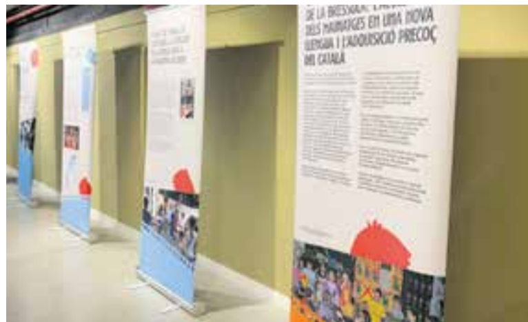
Imatge d'alguns plafons de l'exposició sobre La Bressola.

ta conté 15 plafons diferents, els quals ofereixen un recorregut per la història de l'associació de La Bressola alhora que fan difusió del seu projecte pedagògic, basat en el sistema d'immersió lingüística,