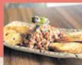
TIBERIUS / Tàrtar de fuet