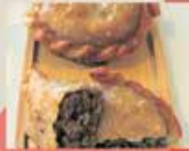
EL PATI DEL CLUB / Empanada argentina