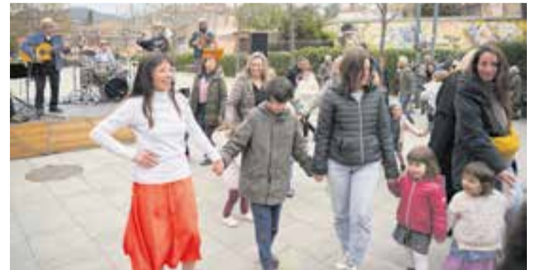
Concert de Bufanúvols per la diada de Sant Josep, el 19 de març passat.

El grup castellarenc Bufanúvols continuarà aquest dissabte 30 de maig la celebració dels seus 40 anys de trajectòria amb una actuació de ball folk a la plaça d'El Mirador. El concert començarà a les 19 hores i inclourà música en directe, danses participatives i un brindis commemoratiu amb la participació de diversos músics que han format part de la història del grup.