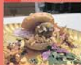
RACÓ RESTAURANT / La caramel·litzada cruixent amb tocs de primavera