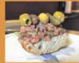
CAL PINKITO / El pinxito