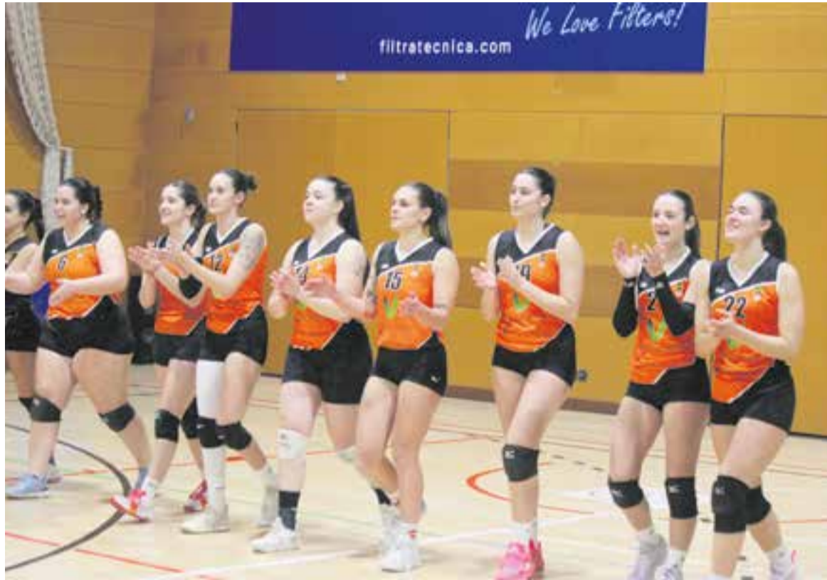
L'equip femení haurà de disputar la promoció de descens per no perdre la categoria. || O. F.

Els del Baix Penedès van posar una marxa més i van superar els castellarencs per 3-1 (25-20/25-14/11-25/25-21). Els dos equips ja co-