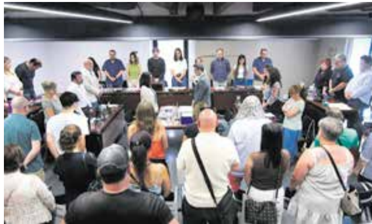
El ple va fer un minut de silenci pels dos castellarencs morts en accident de moto.