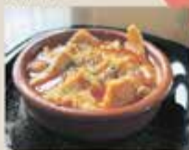
SOHO / Callos