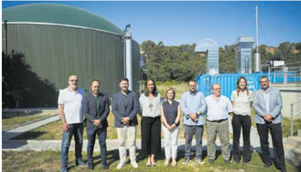
Autoritats durant la visita institucional a les noves instal·lacions de la depuradora de Castellar dijous al matí. | J. Q. PASCUAL

Fins ara els fangs de la depuradora estaven destinats a compostatge i les obres han permès dur a terme les actuacions necessàries per implementar els processos de digestió anaeròbia per a l'obtenció de biogàs. Amb el nou sistema, es redueix en un 35% la producció de fangs. En aquest