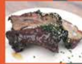
LA PIPARRA / Costella lacada Korean BBQ