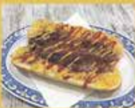
LINAMAR / Panbutí