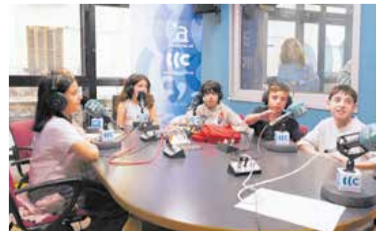
Participació dels alumnes de FEDAC Castellar al programa 'La Redacció'.