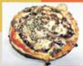
PIZZA A PUNT / Pizzeta