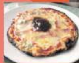
PASSAPAROLA / La Romanella