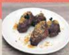
TACOS EL TIGRE (Food Truck) / Aletes sticky Tex-Mex