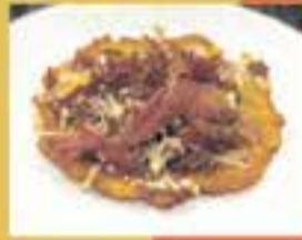
LA FRUITERIA DEL POBLE / Entre dos terres