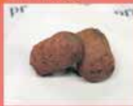
PRAT TORRAS / Duo de croquetons de "Txuleta Basca"