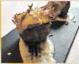
CENTRE FELIUENC / Cor farcit