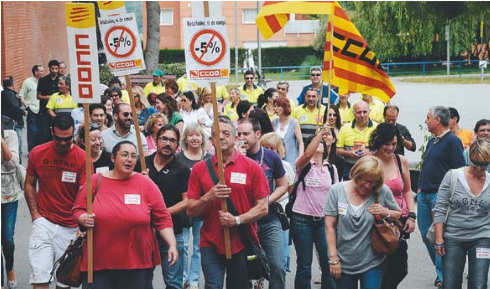
© Els treballadors públics de l'Ajuntament van començar la seva protesta de dimarts a l'Espai Tolrà. La manifestació va comptar amb uns 70 assistents. || J.GRAELLS