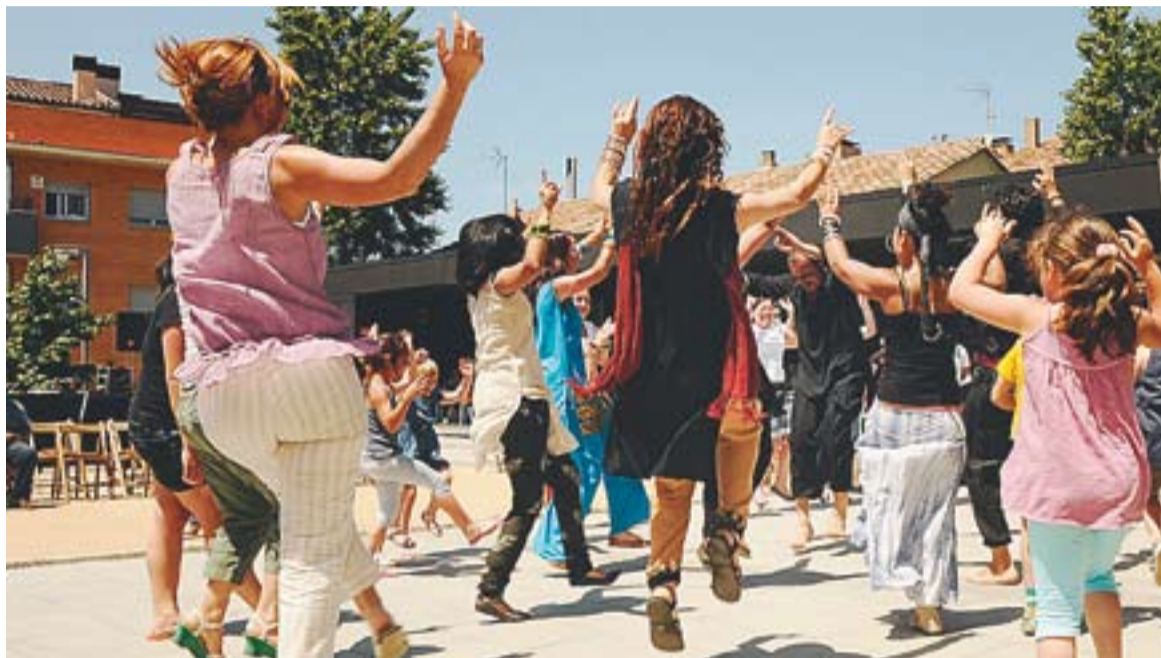
La classe popular de Bollywood va ser un dels actes més participatius.

La iniciativa dels comerços organitzadors de la festa sorgeix