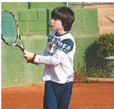
© Les activitats esportives centraran l'atenció d'aquest mes de juliol a Castellar || J. G.

28 de maig de 2010 Dia de la Salut de les Dones dona, cos i salut