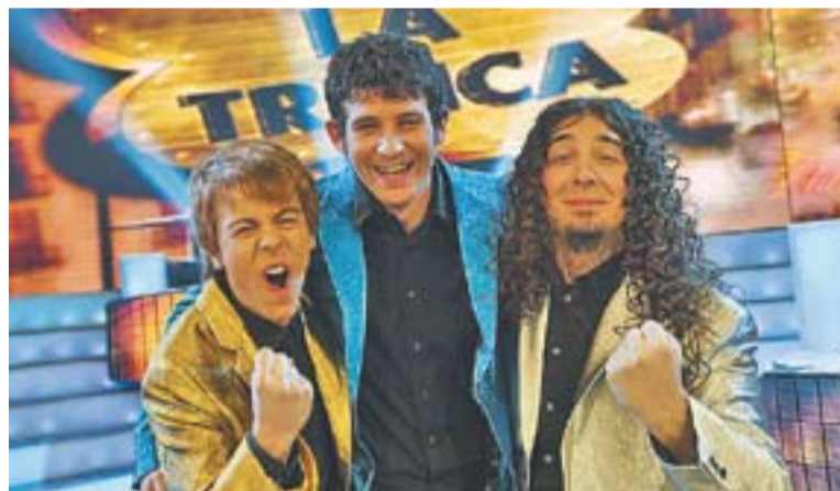
⊙ La Trinca del segle XXI actuarà l'11 de setembre a la plaça de la Fàbrica Nova.