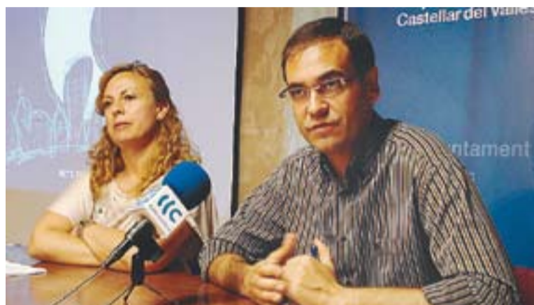
⊙ La regidora i l'alcalde a la presentació de les Nits d'Estiu.

El pressupost destinat enguany a les activitats de la Festa Major serà d'uns 150.000 euros, 50.000 euros menys que l'any 2009. +