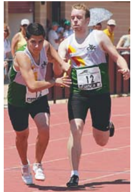
© Gran marca del CAC als relleus. || CEDIDA