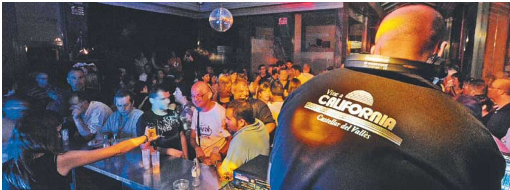
Moment de la nit de dissabte a les galeries Califòrnia reconvertides en discoteca dels anys 80 per un dia.