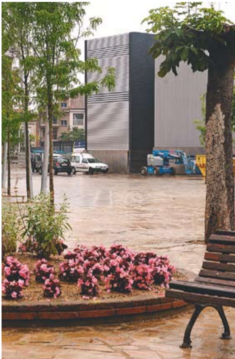
Vistes a El Mirador des de la part antiga de la plaça Major ahir al matí.

EL MIRADOR || L'Ajuntament espera que pels finals de juny la resta dels edificis estiguin acabats: "La pèrgola de la plaça Major i el vidres de tancar l'edifici estan molt avançats. Les instal·lacions i la terrassa, també. Durant aquest mes començarem a entrar mobles". Al juliol es vol traslladar el SAC i l'Oficina d'Habitatge al Mirador amb la idea que amb la Festa Major pugui funcionar a ple rendiment. +