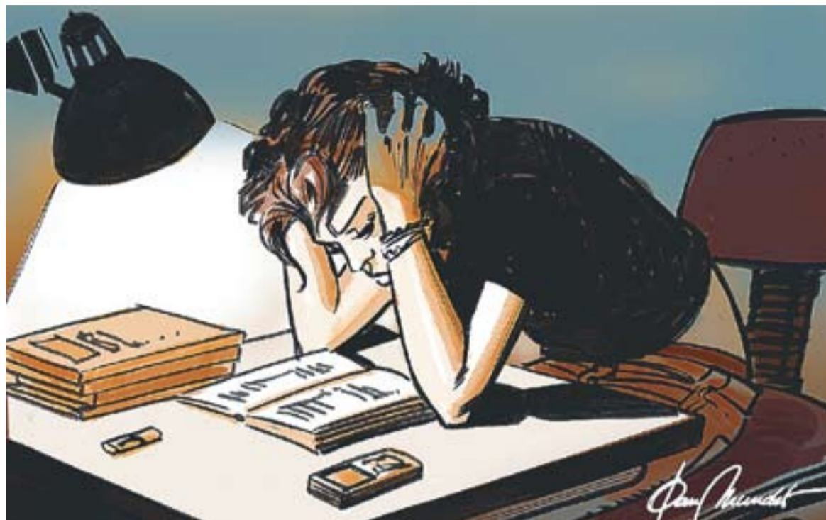
© “La sele”. || JOAN MUNDET

renciades: la fase general obligatòria i la fase específica voluntària. A la fase general els alumnes s'han d'examinar de 5 assignatures: llengua catalana, llengua castellana, llengua estrangera, història o filosofia i una matèria de modalitat triada per l'alumne i vinculada a la branca de coneixement en què s'inscriu el grau que volen estudiar. La qualificació d'aquesta fase és la mitjana aritmètica dels 5 exercicis i es considerarà que un estudiant ha superat la prova d'accés a la universitat si obté una nota igual o superior a 5 com a resultat de la mitjana ponderada del 60% de la nota mitjana de