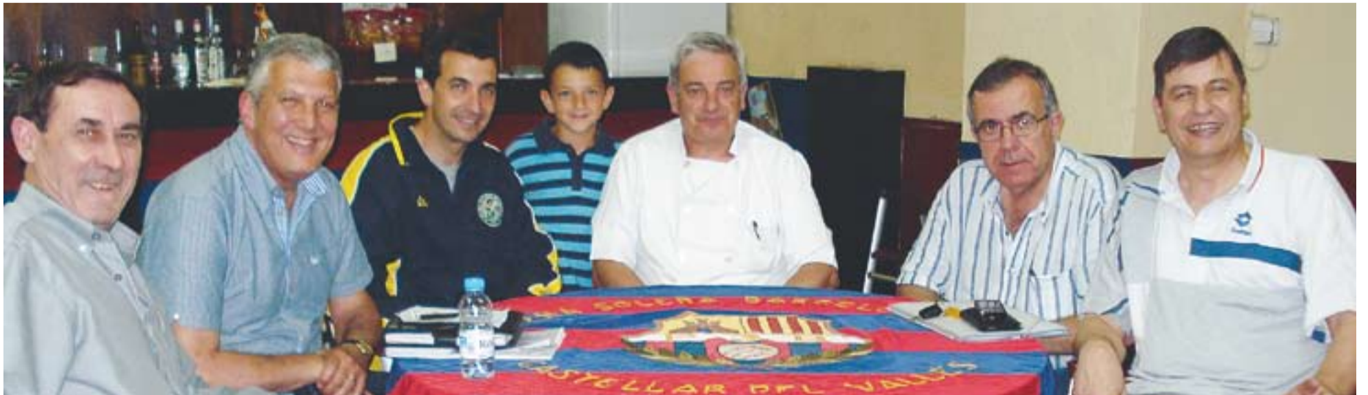
Membres de la Peña Solera Barcelonista de Castellar del Vallès a la seu de l'entitat aquest dimecres.