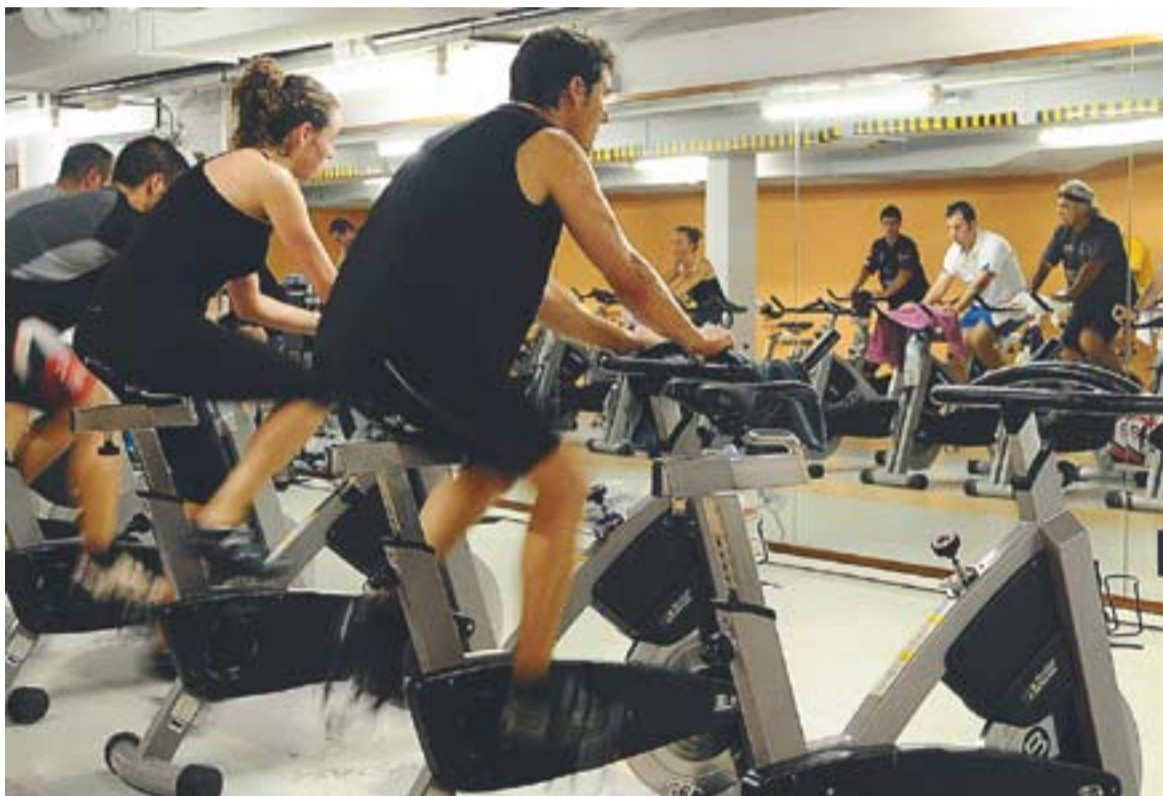
El 'cycling' és una de les activitats físiques amb més èxit durant aquests dies.

Fer esport al gimnàs, fer dieta o utilitzar anticel·lulítics, en el cas de les dones, són algunes de les opcions per aprimar-se quan arriba l'estiu