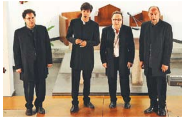
Moment del tercer concert a la Capella amb els Blackbirds.

ció tendra i magnètica, com com en una fàbula infantil sense final feliç, resignada i serena davant del turment dels dimonis interiors. La perfecta conjunció sonora forma un conjunt sòlid i perfectament greixat, creant un bloc que a més d'agradable a l'oïda, suggeridora, sensual i íntima, resulta en una de les formes més originals que ha adquirit el neo-folk tan poblat a casa nostra recentment, afegint unes cotes d'autenticitat i avantguarda inèdites en la resta de cantautoros de la nova fornada. +