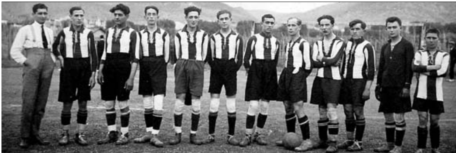
Una de les primeres plantilles del Castellar, fundat com a Agrupació Esportiva Castellar Club de Futbol.

les zones enfangades a causa de la pluja caiguda. Rovira es va imposar sense fer cap peu i va aconseguir la victòria final a la competició. López Fau va vèncer en categoria Pro i ha finalitzat en tercer lloc de la classificació general.