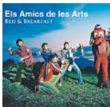
⊙ Portada del disc d'Els Amics de les Arts