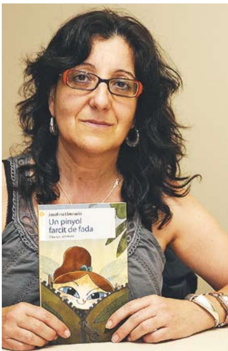
© Josefina Llauredó és l'autora del llibre infantil 'Un pinyol farcit de fada'. || J.G.

amb autèntica passió la història de la Belluguets, reconeix que se sent més còmoda amb la novel·la d'adults, "sobretot, amb la novel·la d'intriga, tot i que encara no n'he acabat cap però hi continuo treballant". La raó d'aquesta preferència és que "puc fer servir més paraules. Els nens m'han d'entendre a la primera", afegeix.