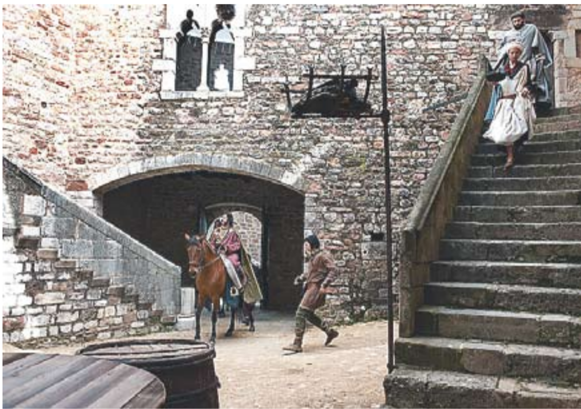
El pati del Castell de Clasquerí en una de les escenes de la minisèrie.

El castell es converteix en el Palau Comtal de Barcelona per la nova minisèrie de TV3, que es basa en Ermessenda de Carcassona