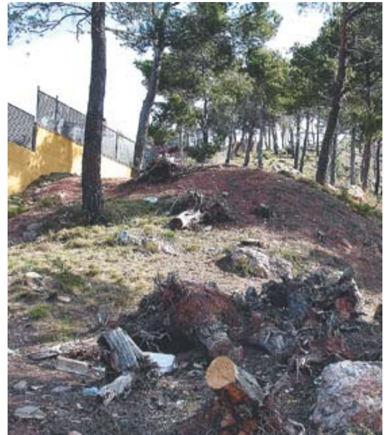
© La franja de protecció al carrer del Turó Roig del Balcó. || OFICINA 21

La minisèrie es troba ara en fase de muntatge. En principi, Televisió de Catalunya té la intenció d'emetre-la al novembre, ja que “volen anar emetent una minisèrie a l'any”. +