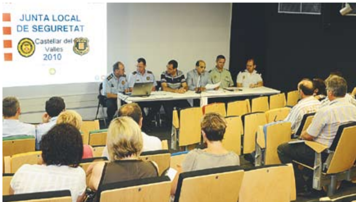
La celebració de la darrera Junta Local de Seguretat, celebrada a la Sala d'Actes de l'Auditori.

En total, durant aquest període, s'han produït a Castellar 29,5 delictes i faltes per cada 1.000 habitants. En concret, durant l'any policial s'han registrat un total de 700 delictes o faltes, dels quals un 38% han estat resoltos. Unes xifres que suposen 31 fets delictius més que l'any passat. "Són xifres molt baixes i el que ens ha desmuntat l'estadística és que aquest any hem tingut un episodi puntual de robatoris en massa a l'inte-