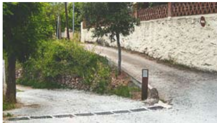
© Un dels camins de Les Arenes arranjat gràcies als diners del FEOSL. || J.G.

De tota manera, Castellar Decideix ha preparat un punt de trobada de tots els castellarencs a Barcelona, encara que no hi vagin amb l'autocar que ha preparat l'entitat. Serà a les 17.50h a l'encreuament entre l'avinguda Diagonal i Rambla Catalunya al cantó mar. †