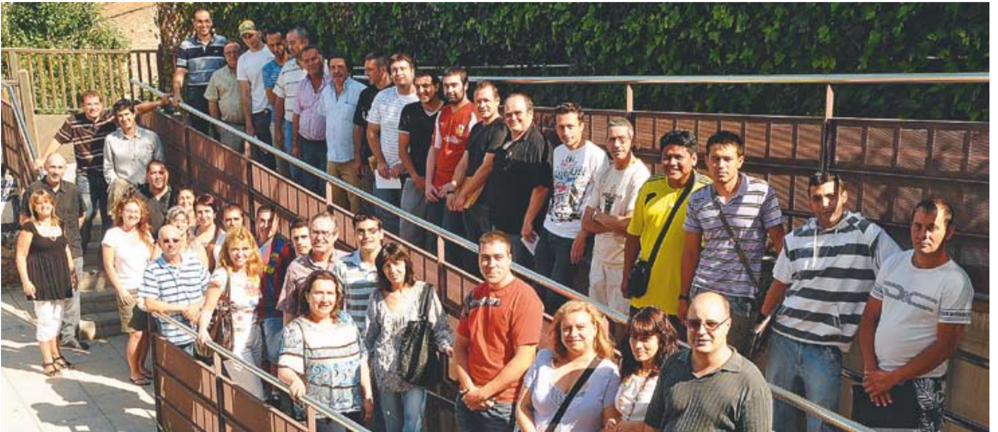
© Les persones contractades al Plans d'Ocupació juntament amb l'alcalde, regidors i tècnics divendres passat al pati de Cal Botafoc. || JOSEP GRAELLS