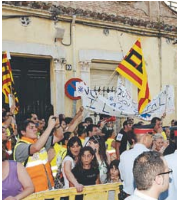
Protestes dels treballadors de les ambulàncies i el programa que Ràdio Castellà va fer en directe.