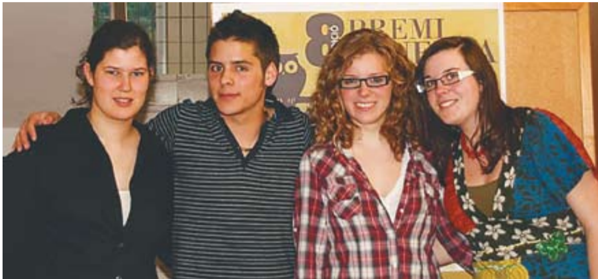
© Laia Pasquina, Eloi Creus, Inés Escolano i Queralt Soler a l'acte de lliurament dels Premis Minerva. || CEDIDA

Els tres primers guardons del concurs de treballs de recerca han estat per al centre