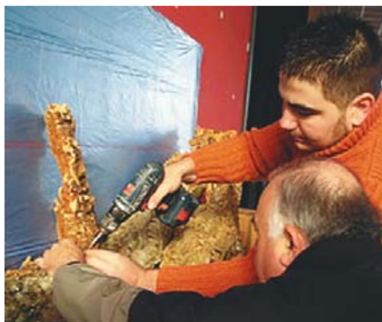
© Pessebre solidari que el Grup Pessebrista va elaborar per la Marató. || ARXIU

Per participar a l'exposició cal inscriure's mitjançant un formulari del Grup Pessebrista de Castellar abans del 30 de juliol. Les obres hauran de quedar enllestides el 30 d'octubre. L'exposició estarà oberta del 4 de desembre de 2010 al 30 de gener de 2011 a la sala del primer pis del Grup Pessebrista. +