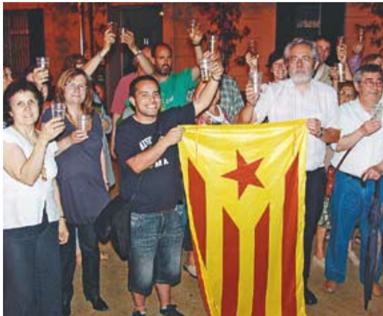
© Castellar Decideix celebrant que, per ells, s'ha acabat la via autonomista dilluns després de conèixer la sentència del Tribunal Constitucional contra l'Estatut.

DOS AUTOCARS || Pel que fa a la vila, Castellar Decideix ha preparat dos autocars per tal d'anar fins a la marxa de dissabte pels carrers de la capital catalana. La rebuda