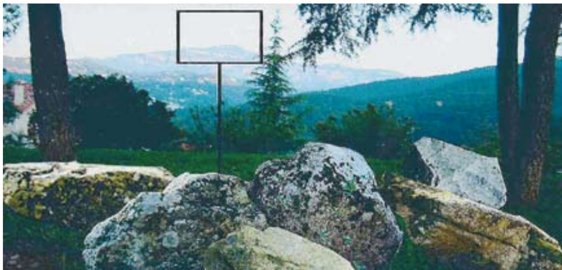
Recreació virtual del conjunt escultòric que emmarcarà la Mola a l'Era d'en Petasques.

D'altra banda, aquest projecte també ha servit per tal que l'artista creixi en altres camps: "Tenia ganes de fer un treball en un espai públic. Vaig poder compaginar les dues coses: la figura de l'homenatge i la figura del paisatge". De fet, sembla que Parera vol continuar amb les sensacions que Muntada transmetia