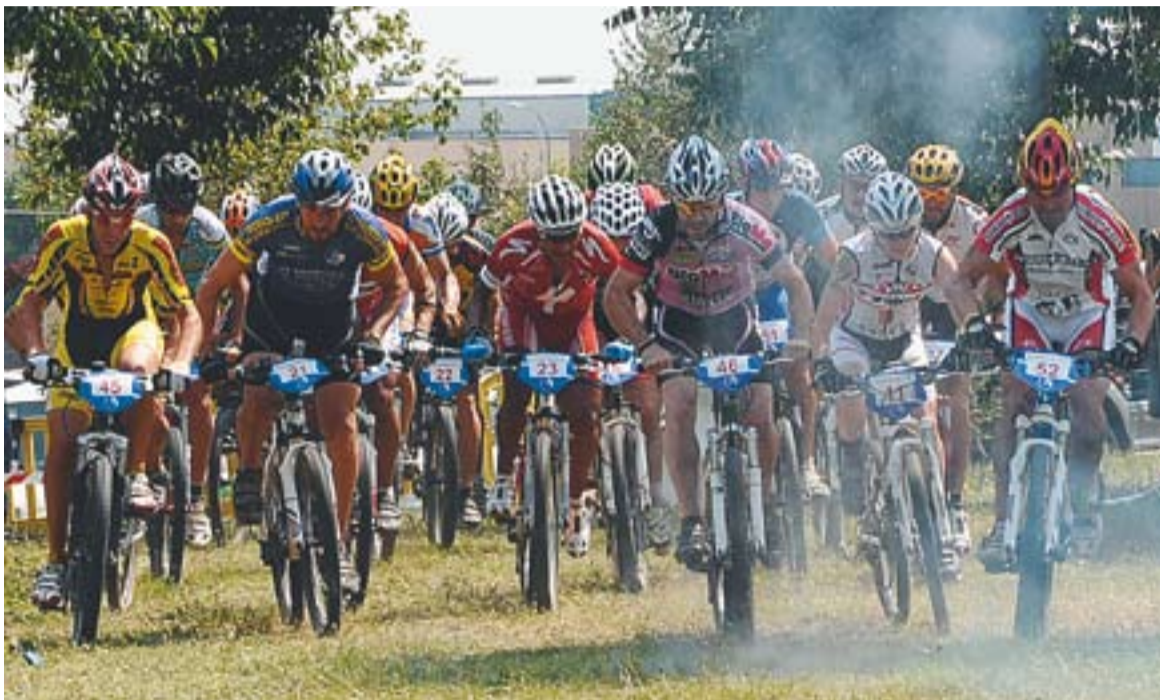
Les quatre hores de resistència en el moment de la sortida a les quatre de la tarda.

Quant al nivell, sobre el traçat habilitat al Parc de Colobriers hi havia ciclistes que aquest any participen a la Copa Catalana i a l'Open d'Espanya. Un exemple és