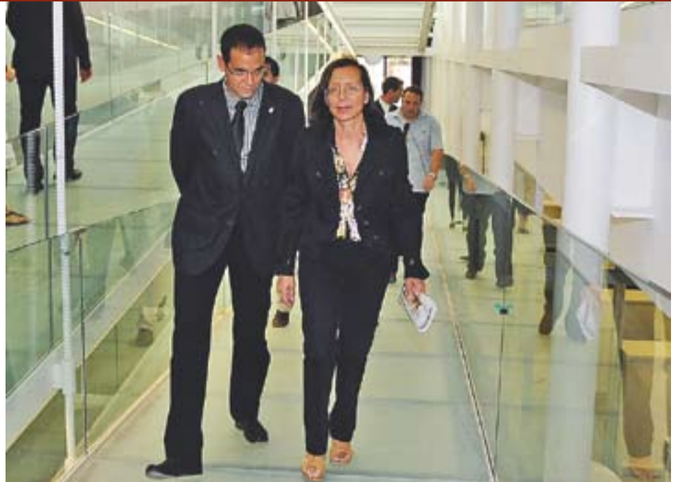
La consellera de Justícia, Montserrat Tura, i l'alcalde Ignasi Giménez passejant per El Mirador.

PORTES OBERTES || Fets els discursos i inaugurat ja oficialment El Mirador, resten uns petits serrells per acabar de definir totes les instal·lacions d'aquest espai. Un equipament que, de fet, estarà obert demà dissabte durant tot el matí (de 10h a 14h), per tal que tots els castellarencs que així ho vulguin puguin donar un cop d'ull a aquestes instal·lacions. D'altra banda, tots aquells que estiguin interessats en prendre part d'alguns dels cursos que ofereix El Mirador tenen temps de fer les preinscripcions fins al 31 de juliol. Hi ha cursos destinats a aquelles persones que tot just comencen a fer servir un ordinador, que volen aprendre a navegar per internet, que volen millorar el seu nivell informàtic o que tenen inquietuds en el món de la creativitat. ➔