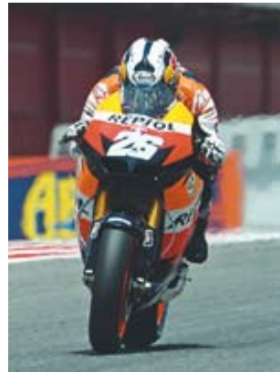
© Pedrosa a la recta principal. || REPSOL

CASTELLAR FA HISTÒRIA || Per primera vegada Castellar del Vallès va tenir dos pilots participant en una cursa del Mundial de Motociclisme, una gesta a l'abast de poquíssimes poblacions. Només grans ciutats com Barcelona, o en nuclis com Granollers on ha sortit una nissaga com els germans Espargaró, tenen el privilegi d'haver tingut més d'un pilot al Mundial. +