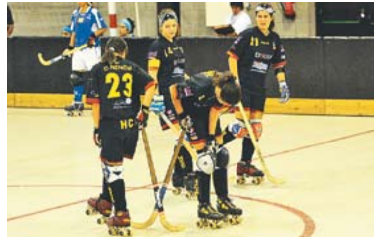
© L'equip sènior femení ha desaparegut aquest final de temporada. || J.G.