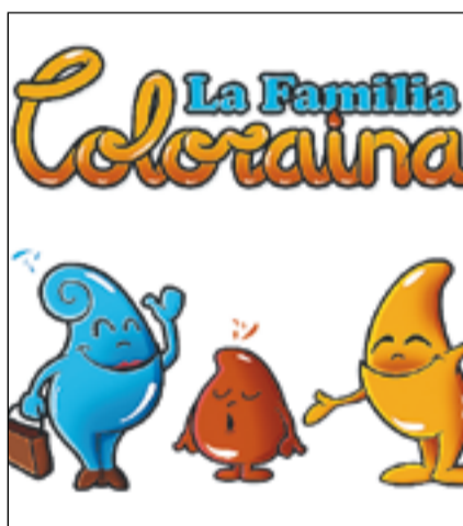
© Dani Coma, en la imatge superior, ha tret al mercat 'La Família Coloraina', una narració musicada que es publica en cd per capítols. || ARXIU

Coma, que aniran sortint anualment fins a la publicació d'un total de 10 històries.