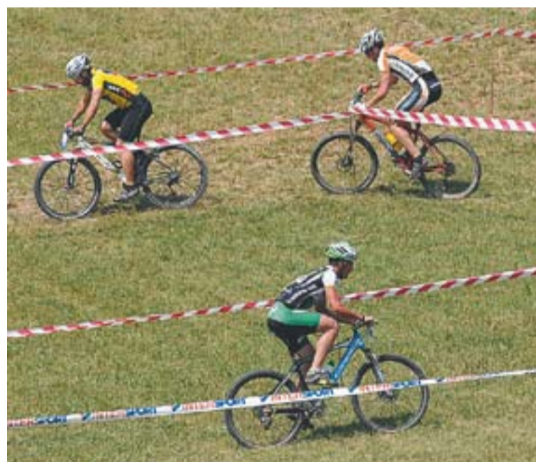
Els ciclistes afronten un dels trams del circuit al Parc de Colobriers.

Les 4 hores de resistència van tenir dos equips júnior competint sobre el terreny i cinc ciclistes que van competir individualment, de manera que van haver d'aguantar sense relleus les quatre hores seguides. Els guanyadors es van endur un trofeu, embotits i cava com a premi. +