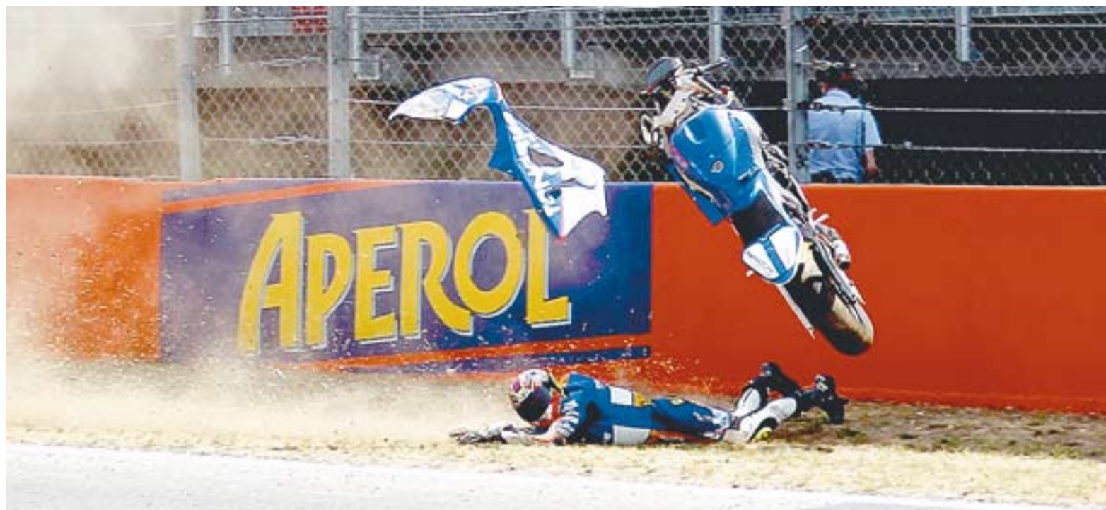
© El pilot Carmelo Morales en el moment de la caiguda a la recta principal del Circuit de Catalunya després de topar amb Kenny Noyes. || MOTOGP

SOMNI REALITZAT || L'estrident final no desllueix un cap de setmana que Morales portava perse-