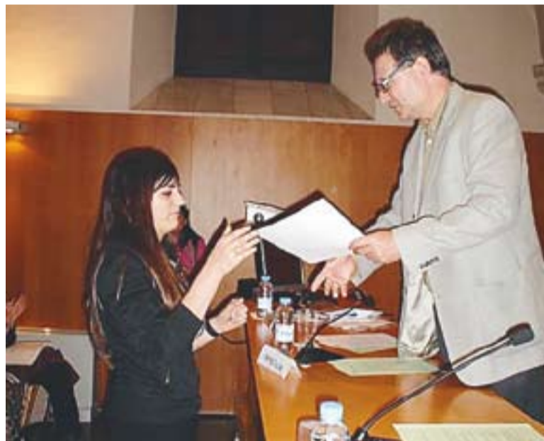
© Elena Rodríguez als Premis de la Societat Catalana de Química. || CEDIDA

Tampoc s'esperava guanyar el segon premi l'Eloi Creus. "Mai he guanyat res, fins fa dos anys,