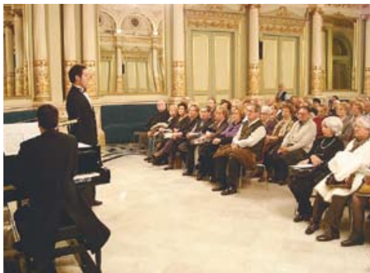
© El recital d'un tenor al Saló dels Miralls va ser el colofó de la visita.