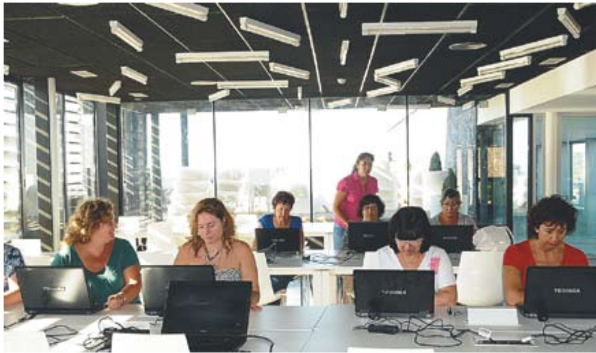
© En els quatre primers mesos de funcionament han passat per les aules de El Mirador 320 alumnes. || JOSEP GRAELLS

Precisament amb aquesta intenció de diversificar l'oferta, el nou programa d'activitats de El Mirador s'estructura en set itineraris formatius amb una oferta total de 27 nous cursos, on hi tenen cabuda els tallers creatius i les classes adreçades a la millora de les habilitats socials. "Hem intentat adaptar a la nova oferta formativa els suggeriments