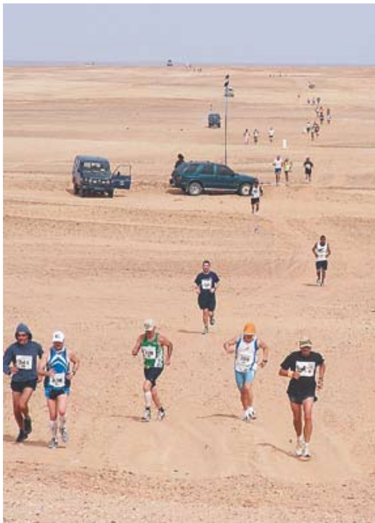
Una imatge de la cursa de la Marató del Sàhara.

ESCOAC portava més d'un mes preparant la cursa i tindrà la col·laboració del Club Atlètic Castellar en la realització de la prova. El traçat serà semblant al del Cros Vila de Castellar -que es farà d'aquí a dues setmanes-, i només patirà lleugeres modificacions per adequar-ho a la prova. Les inscripcions es podran fer a partir d'una hora abans de l'inici de la cursa i la donació serà de 6 euros, que aniran íntegrament destinats a ajudar els refugiats saharauis. ESCOAC donarà una samarreta commemorativa a tots els participants a la cursa.