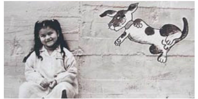
Una de les instantànies de la mostra “Tan iguals, tan diferents”

La propera sortida cultural tindrà lloc al mes de maig. Les places per participar-hi són limitades. Les inscripcions s'hauran de formalitzar a la Regidoria de Gent Gran, ubicada a l'Espai Tolrà. +