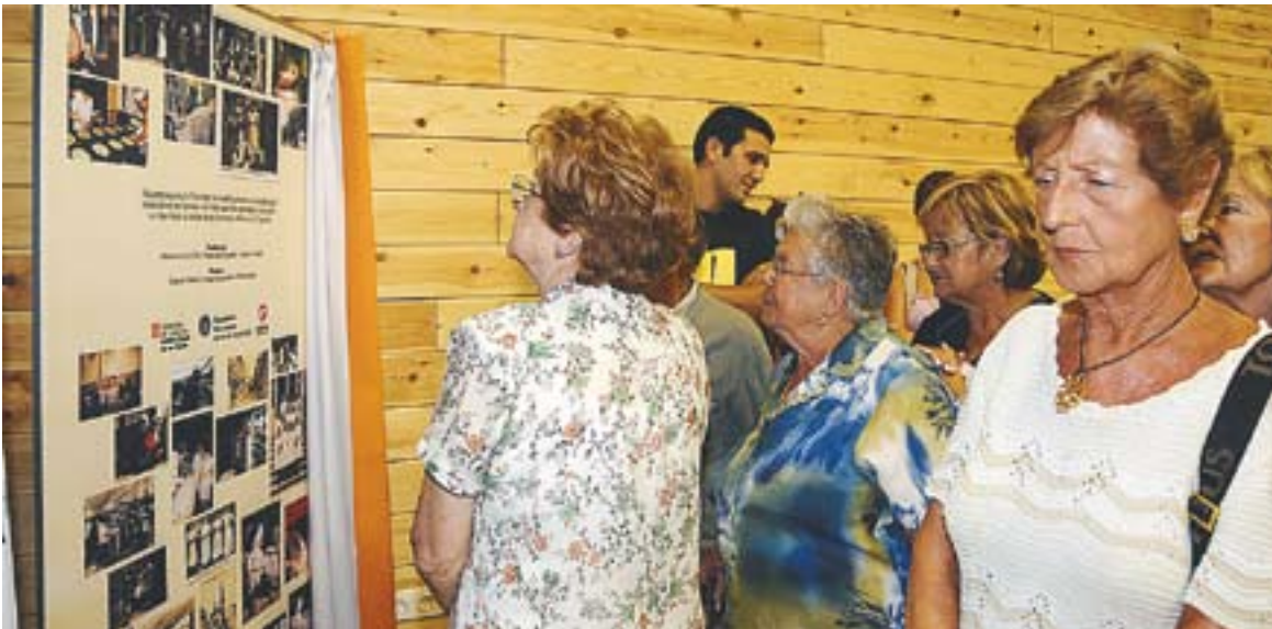
⊙ L'exposició 'Dones i oficis' es torna a mostrar, en aquesta ocasió al CAP, del 22 de novembre al 3 de desembre || J.G.

El 25 de novembre es commemora el Dia Contra la Violència de Gènere. A la vila s'han programat xerrades i exposicions per conscienciar la ciutadania