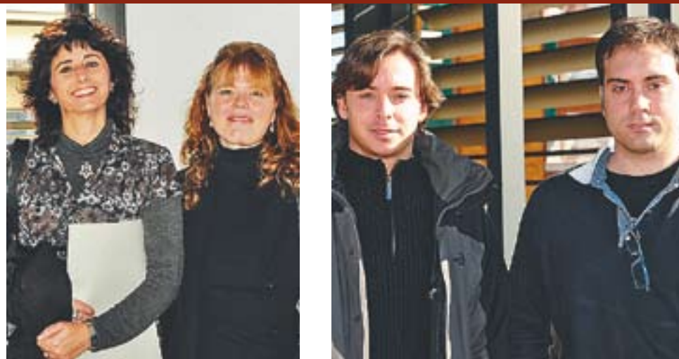
A l'esquerra, les emprenedores de CEDIG al seu local i a la dreta, dos dels socis d'Edertone.