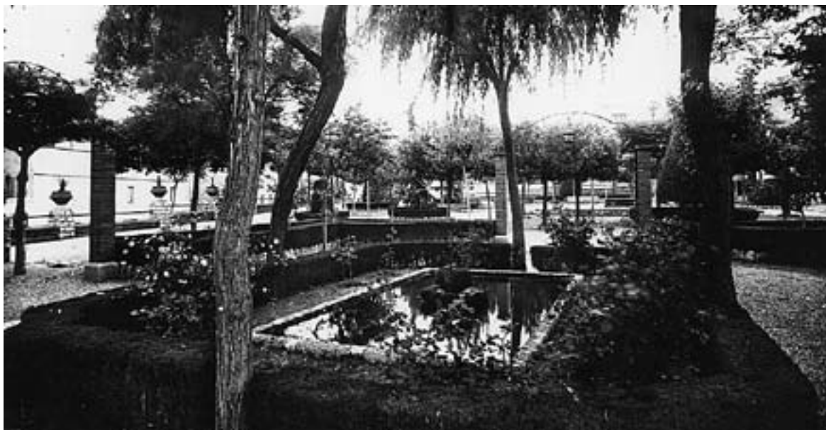
L'estany de la plaça Major de Castellàr .