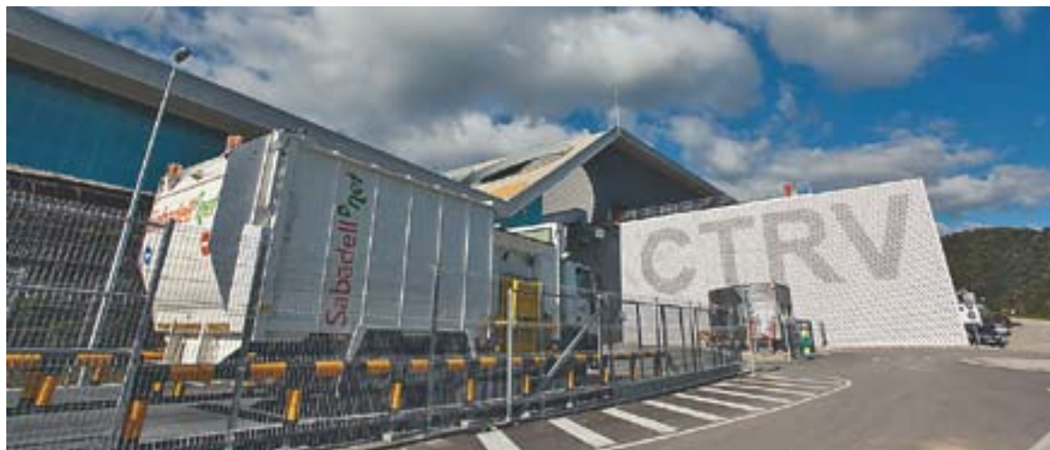
La setmana passada arribaven els primers camions al CTR Vacarisses, planta que estarà en proves fins el gener.

Estava acordat que es pagués 78 € la tona, però el Consell d'Alcaldes del Vallès Occidental ha pactat amb CTR Vacarisses pagar 58,09 €, durant el 2011