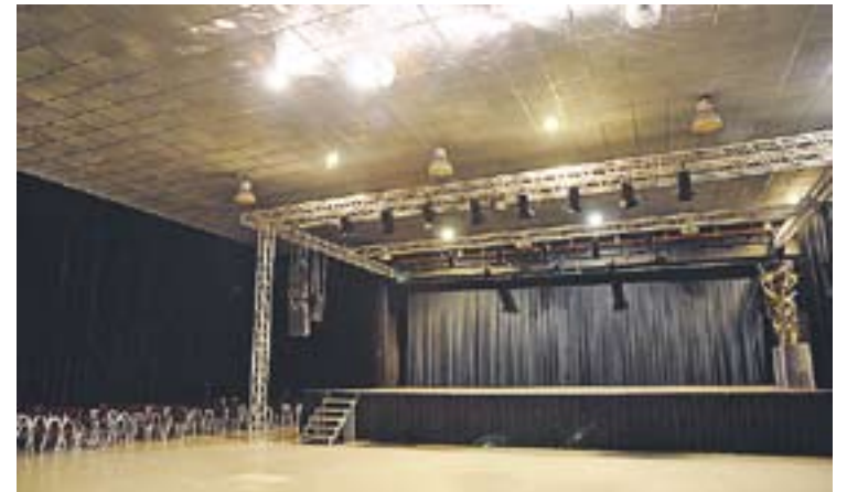
⊙ Les obres, finançades pel FEOSL, han costat 220.000 euros . || J. GRAELLS

A banda de les xerrades, Benestar Social ha organitzat d'altres activitats, com ara un taller de defensa personal al CAP. +