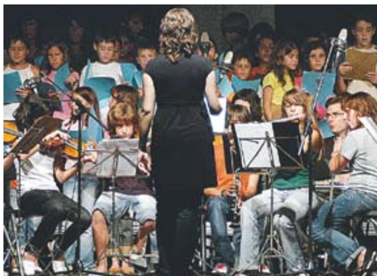
Concert de Torre Balada en una passada edició.

TORRE BALADA || D'altra banda, l'Escola Municipal de Música Torre Balada també ha preparat un programa especial per a la celebració de Santa Cecília. L'actuació, que és gratuïta, tindrà lloc també demà a l'Auditori Municipal a partir de les 18 hores. En aquesta ocasió, el concert estarà protagonitzat pel professorat del centre, el qual farà un