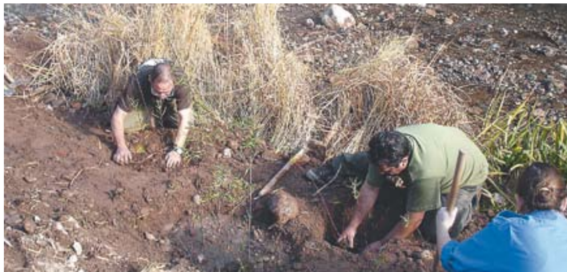
Tres persones treballen a la llera del Ripoll en la plantació de diumenge.

Durant més de tres hores els Bombers voluntaris juvenils, alguns ciutadans, l'empresa col·laboradora amb aquest projecte (Naturalea) i alguns tècnics de l'Ajuntament van aconseguir plantar més de 170 espècies de l'àmbit de ribera. "Bàsicament són sal-