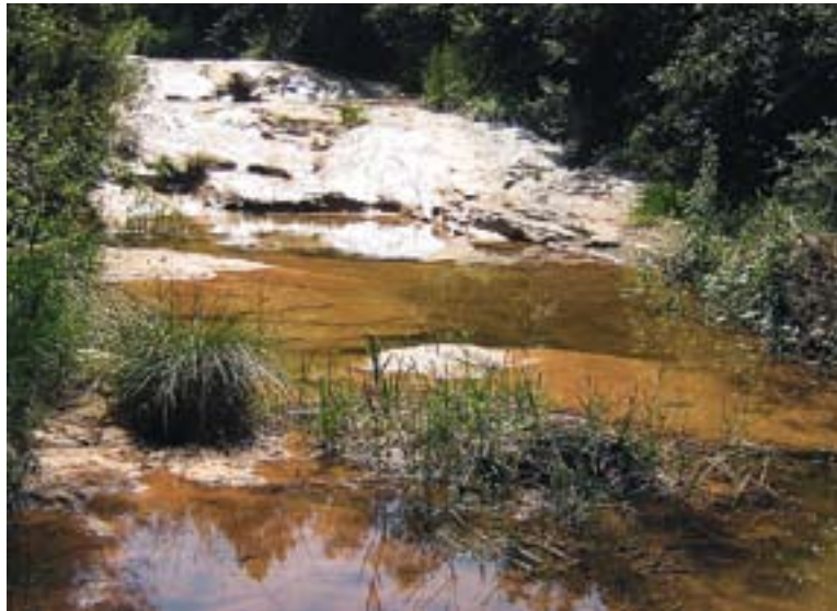
Un dels trams del riu Ripoll.

valorades figuren un pla per a la implantació efectiva i progressiva d'un règim de cabals de manteniment, la revisió i adequació dels sistemes de tractaments d'aigües residuals i la retirada de runa i deixalles al terme municipal de Castellar. Igualment, s'ha destacat la realització d'un programa de preservació i conservació de trams singulars amb la designació de zones de reserva integral.