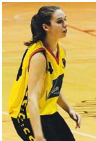
Els esperen dos partits difícils.