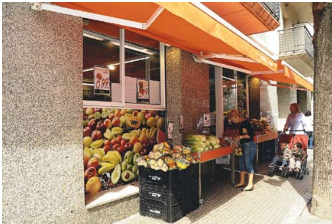
Els productes frescos es compren majoritàriament al municipi.

En el cas de Castellar, aquesta idea es repeteix. Un 90% dels vilatans adquireix alimentació fresca a la vila i un 92% ho fa amb l'alimentació seca. Per contra, un 7% es dirigeix a Sabadell per comprar alimentació fresca. Un altre 2% es desplaça a la capital de la demarcació per adquirir alimentació seca i un 2,4% ho fa a Sant Quirze del Vallès.