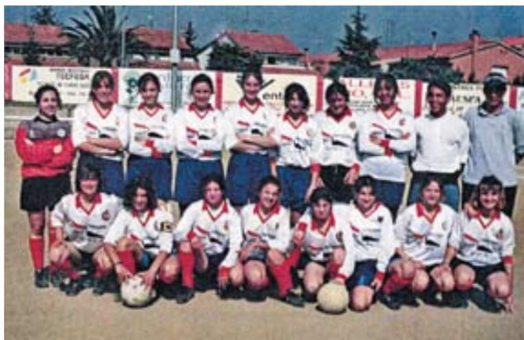
© Foto per a la història. Un dels primers equips femenins.