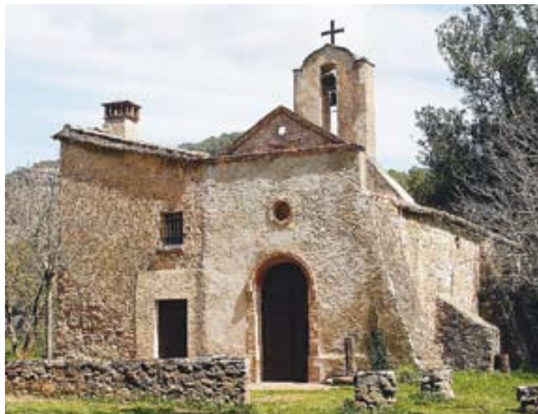
© Ermita de Santa Maria de les Arenes. || JOSEP GRAELLS

D'altra banda, cal recordar també que cada participant ha de