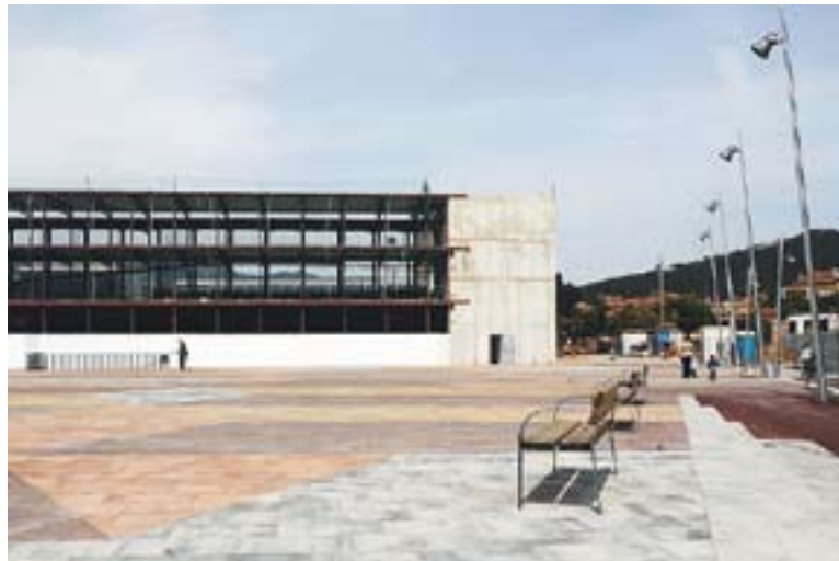
⊕ Acabar la plaça Major és un dels grans projectes d'aquest mandat. || J.G.

de mandat, que recull totes les actuacions previstes per al 2011. I la tercera part del PAM és una llista d'accions anuals. Cada any, el govern posarà sobre la taula les actuacions que pretengui dur a terme. Per l'any 2008 se n'han preparat un centenar, de les quals una vintena ja s'han efectuat. Entre les propostes hi ha actuacions referents a tots els àmbits de gestió municipal.