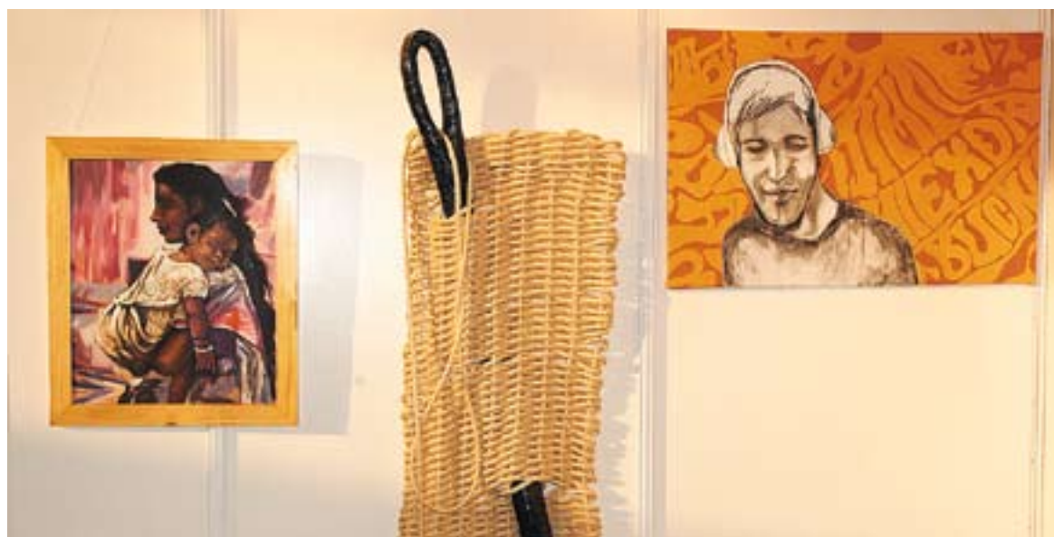
⊕ Creacions d'alguns dels artistes exposats a l'edició de Firart 2006.