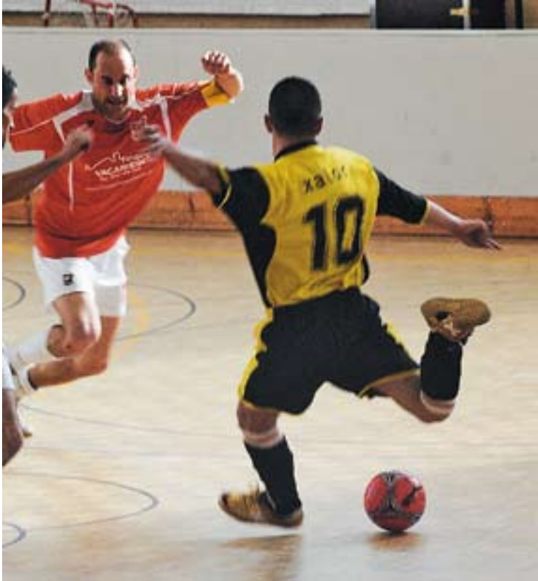
El partit contra el Vacarisses, dissabte passat.