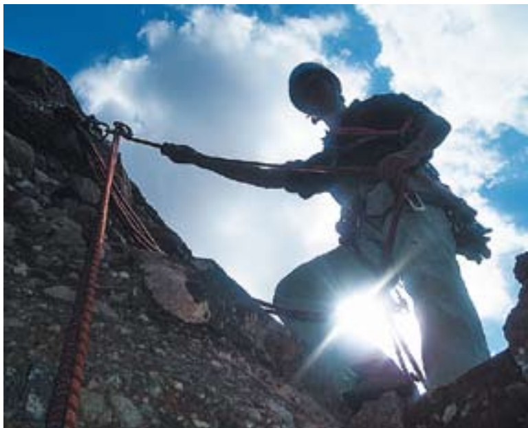
© Una imatge de l'escalada de la Castellassa de Can Torras. || CEDIDA