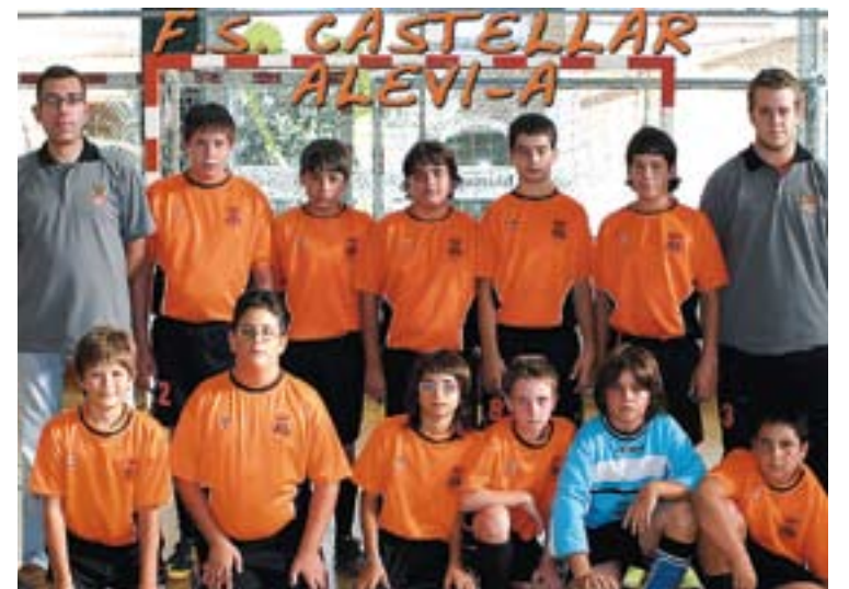
L'alevi 'A' del FSC ha arribat a la segona ronda de Copa.

EL 'B' TAMBÉ JUGA || L'equip 'B', que es troba a Segona Catalana 'A', també ha de jugar doble partit. Els castellarencs s'enfrontaven ahir a la nit al Palauenc al Pavelló Joaquim Blume en un partit ajornat del grup, i aquest cap de setmana rebran a La Sardana de Badia del Vallès, el líder de la categoria. Els taronja-i-negre estan lluitant per sortir de la zona perillosa de la taula, i una victòria en aquests dos partits serà vital per aconseguir l'objectiu. Després d'aquest partit, quedaran només dues jornades de lliga. +