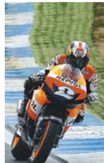
© Pedrosa a Estoril. || REPSOL YPF

En aquest sentit, Repsol Honda continua fent proves amb el nou motor de vàlvules pneumàtiques i espera estrenar-lo aviat per fer les primeres proves. És una incògnita saber si el tindrà a punt pel proper Gran Premi a la Xina. +