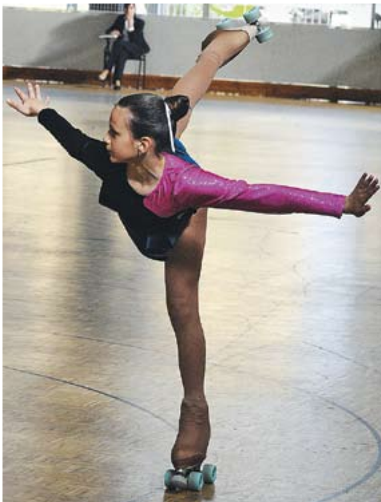
Una castellarenca durant l'actuació del cap de setmana passat.

ARA A FRANÇA || Després de disputar de manera exitosa la segona fase d'Interclubs a Castellar, les patinadores tindran un cap de setmana força intens i diferent. Els grups de Show del CPA s'han desplaçat avui mateix cap a França per participar del Trophée Hérault a Meze, on aquesta tarda comencen els entrenaments. Serà la desena edició d'aquest certamen que va començar com un torneig regional i departamental que enguany comptarà, per primera vegada, amb representació espanyola. Per part del CPA, hi participa el Grup Petit, dissabte amb la coreografia de Los chicos del coro i el Grup Gran ho fa amb Thotem , diumenge. ✦