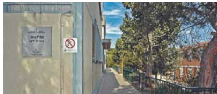
© Façana de l'escola Sant Esteve de Castellar del Vallès. || JOSEP GRAELLS

Per accedir a la Carpeta Ciutadana a través del portal web https://carpeta.castellarvalles.cat , cal disposar de signatura digital del DNI electrònic o del certificat digital idCAT que es pot aconseguir al SAC. Des d'aquest espai a la xarxa també es pot accedir a un servei de validació de documents electrònics generats per l'Ajuntament. +