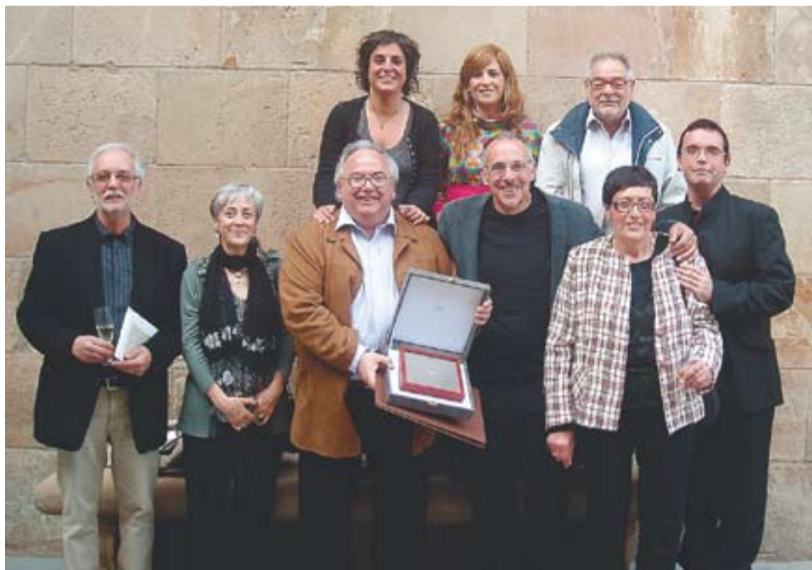
© Els membres de l'ETC que van recollir la Creu de Sant Jordi al Saló Sant Jordi del Palau de la Generalitat. || CEDIDA

El guardó ja s'havia sol·licitat l'any passat. "ERC va proposar-nos per a la Creu i la re-