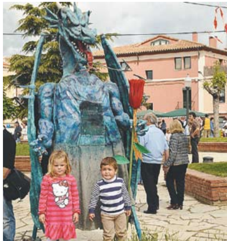
El drac Víbria de l'ETC no es va perdre la diada, acompanyat d'una rosa.