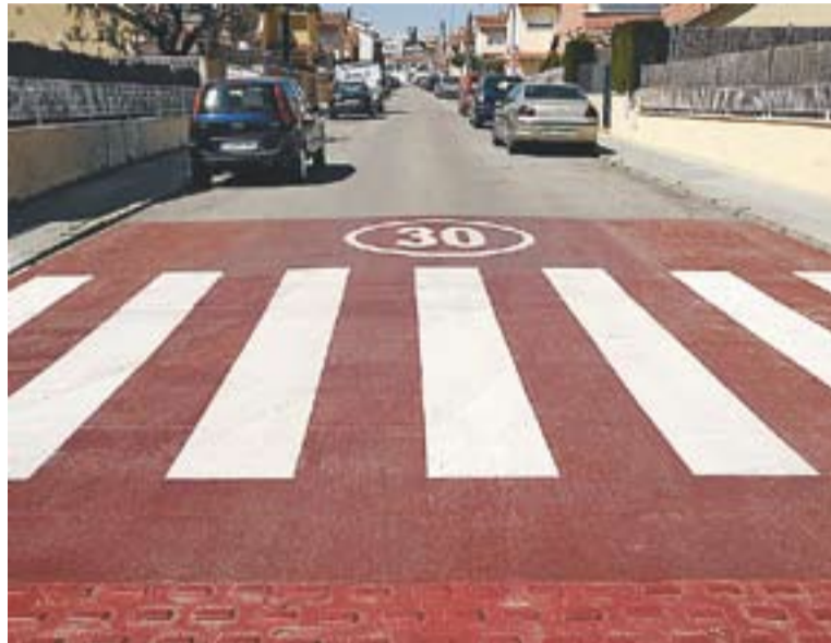
© El carrer Aneto ha estat un dels escollits per instal·lar "Zones 30". || J. GRAELLS

La senyalització de les Zones 30 s'ha dut a terme en un total de 800 metres lineals de carrers distribuïts geogràficament en tres àrees diferenciades de l'eixample antic. Concretament s'han implantat al carrer d'Agustina d'Aragó en la seva totalitat i els carrers d'Alí-Bei, Aneto i Montseny (en els trams situats entre el carrer de Balme i Jaume I); un segon sector format pels carrers del General Prim (entre Jaume I i Àngel