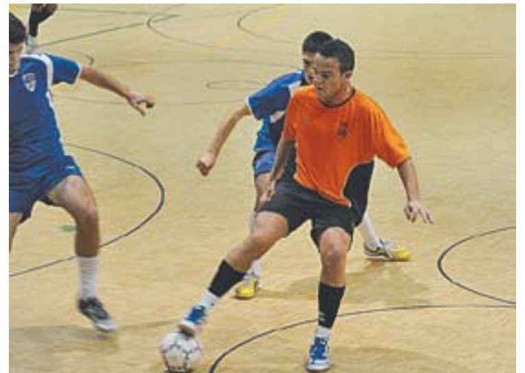
© El Futbol Sala Castellar necessita tres punts més. || J.GRAELLS