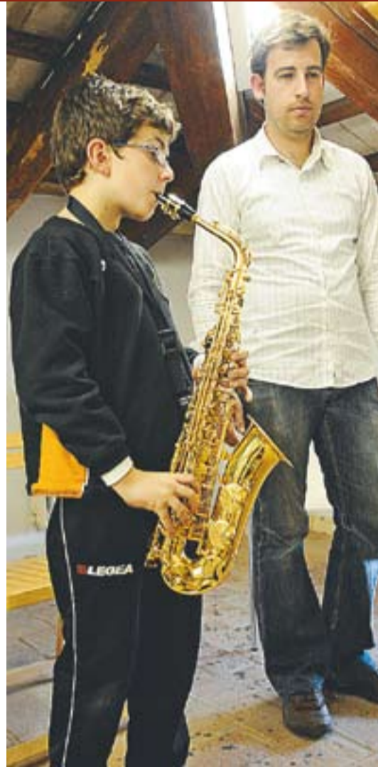
© Una classe de saxo, a Torre Balada || JOSEP GRAELLS

A més, donada la gran varietat de classes d'instruments que s'hi imparteixen un pot pensar, en creuar la porta, que una orquestra esbarrada s'ha repartit per totes les habitacions: es fa palès, doncs, la necessitat d'aconseguir aules insonoritzades, tal com és habitual a altres escoles de música. "És molt difícil millo-