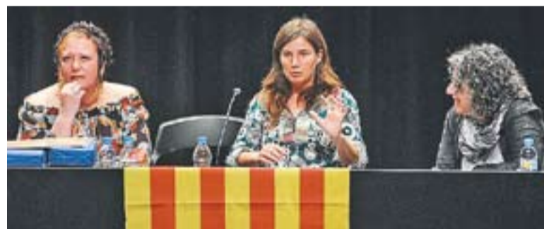
© La xerrada inclosa dins dels actes dels Jocs Florals de l'Escola d'Adults. || J.G.