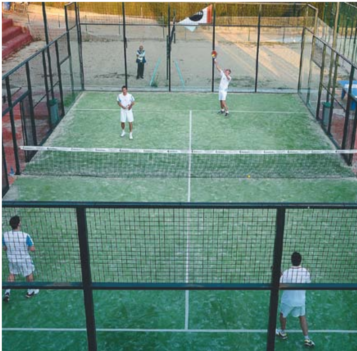
Un dels partits de la ronda eliminatòria que es va jugar aquest dimecres.