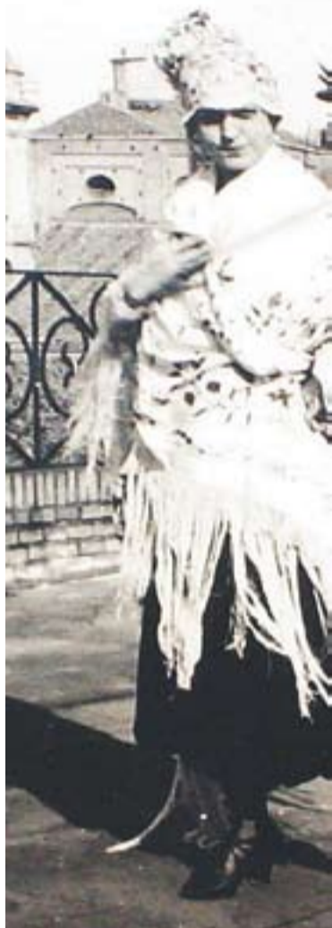
© Olga Spessivteva, ballarina. || CEDIDA

El dia 30 d'abril, a l'Auditori Municipal, tindrà lloc un espectacle preparat especialment per a la celebració del Dia Internacional de la Dansa i inclòs dins la Temporada Estable de Teatre, Música i Dansa de l'Ajuntament.