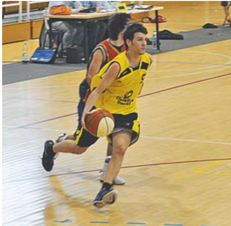
El Castellar en el darrer partit a casa contra el Sant Adrià.

Queden dues jornades per acabar i contra dos rivals directes.