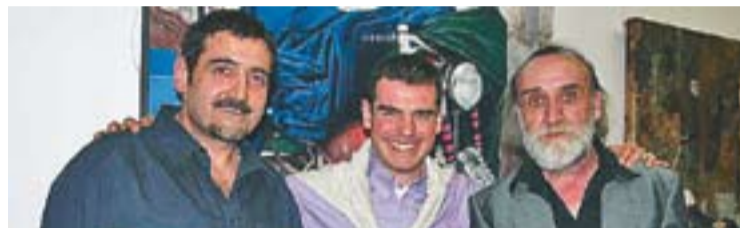
© Rodríguez, Aguilar i Bolívar a la sala de l'Hotel Vela de Barcelona. || CEDIDA

La inauguració va comptar amb un concert de Phoenix Band, on hi van assistir unes 300 persones. || M. A. †