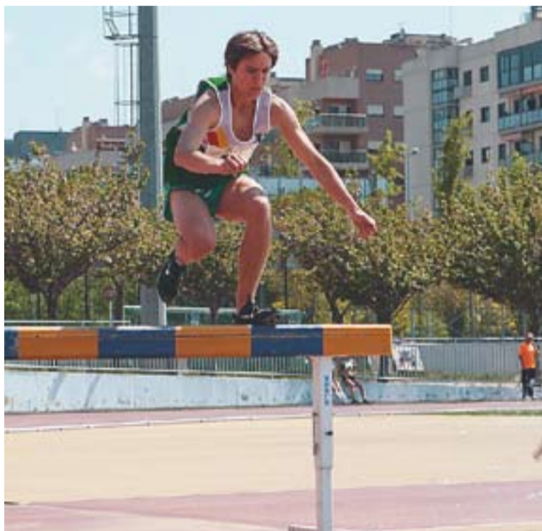
Imatge d'una de les proves de relleus fetes a les pistes de Castellar.

MILLA URBANA || Aquest diumenge, dia 1 de maig, es celebra la Milla Urbana a Castellar del Vallès. És l'edició número 22 i començarà a partir de les cinc de la tarda a l'Espai Tolrà.