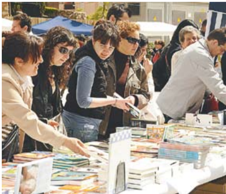
Venda de llibres durant la diada de Sant Jordi.