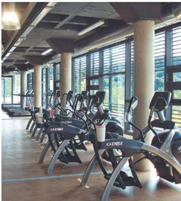
⊙ Tota la maquinària de sala de fitness és nova.

concurts per adjudicar de nou la gestió de l'equipament, una de les condicions era portar a terme aquesta reforma. SIGE SPORT 2005, l'empresa adjudicatària, va agafar aquest compromís. "Les instal·lacions tenen bastants