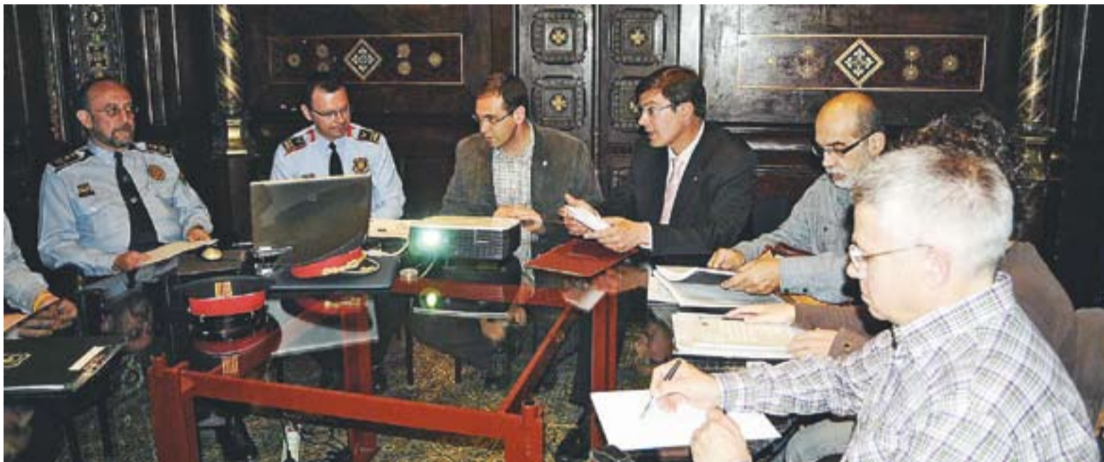
Reunió de la Junta de Seguretat local, que va tenir lloc dimecres 13 d'abril.

poden formalitzar al Punt d'Informació Juvenil del 2 al 6 de maig de les 17h a les 20.30h, i també al CEC el 6 de maig de les 21h a les 22.30h. El preu de l'inscripció és de 7 euros per participant. Si sou menors de 25 anys o majors de 65 euros el preu és de 5 euros.