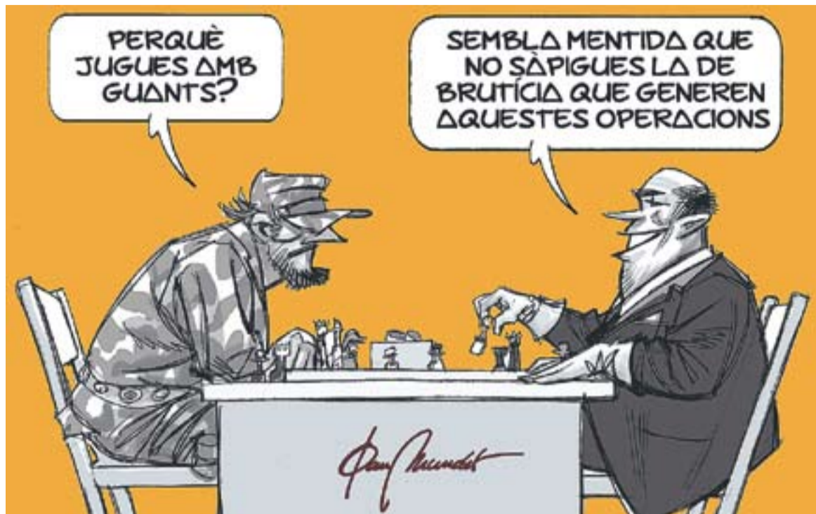
© Restauracions democràtiques. || JOAN MUNDET

Ara, en pocs dies, sembla que la comunitat internacional sencera descobreixi que tractava amb règims corruptes que asfixiaven les seves poblacions. "Indignada" per la crueltat de la repressió militar d'aquests règims, acorda intervenir militarment a Líbia, a corre-cuita, actuant sobre la marxa i conduint el país a una situació confusa i d'impàs. No