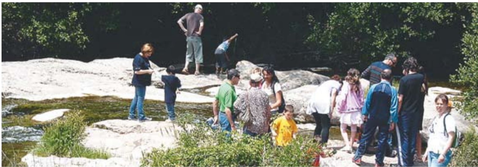
L'Àrea d'esplai de Les Arenes va acollir el 22 de maig del 2010, la 8a Festa del Riu, en què es van lliurar els diplomes a les entitats i escoles del Projecte Rius.

de Castellar acollirà una conferència-projecció sobre el món de les papallones que porta per títol Esclat de colors , i que anirà a càrrec de Joan Condal. El naturalista contestarà diverses qüestions al voltant de les ales de les papallones, entrant en un microcosmos que descobrirà nous mons i un univers de colors. +