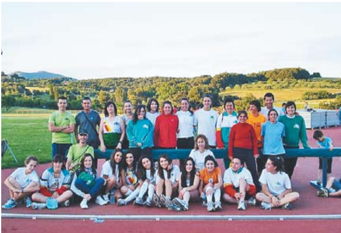
⊕ L'equip femení del Club Atlètic Castellar va fer història diumenge passat a les pistes de Castellar.

EL MASCULÍ ACABA LÍDER || El primer senyal d'alegria del Club Atlètic Castellar va arribar diumenge al matí des de Granollers, on l'equip