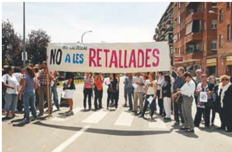
© Professors, pares i mares i alumnes de l'Institut Castellar tallen la B-124 || J. G.

comunicat on manifesten la necessitat de lluitar contra la gran tisorada al departament d'Educació que ja es comença a notar en el dia a dia del centre castellarenc. Segons els professors, l'institut està patint retallades en serveis com el subministrament