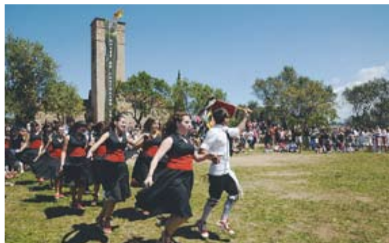
Arrossos, gegants, gitanes i altres activitats van omplir l'esplanada de Castellar Vell durant tot el dia.