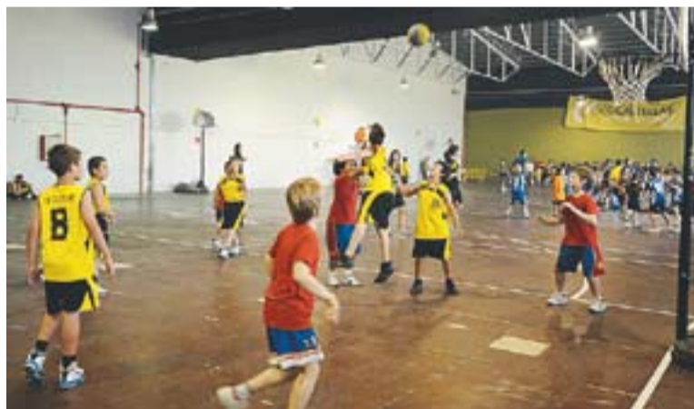
© La Festa de les Escoles es va fer a dins i a fora de l'Espai Tolrà. || J.GRAELLS