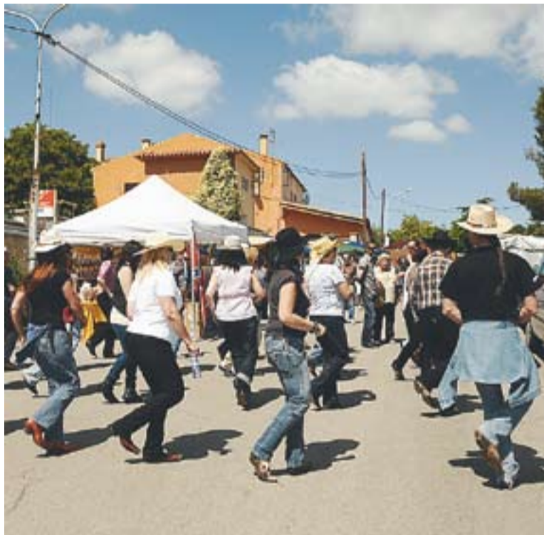
© Ball country que va tenir lloc diumenge al matí a Can Font. || JOSEP GRAELLS

Al matí, el gran atractiu va ser el ball country. També els tallers per als més petits. L'únic que es va haver de lamentar, però, va ser que la pluja de la tarda, ja que en aquesta ocasió, i per primera vegada, el Mercat s'allargava fins a les 8 del vespre. ➔