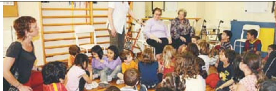
© Visita dels infants de la Ludoteca a l'Obra Social Benèfica || J. GRAELLS

La dinàmica de la Setmana del joc és que les famílies dels infants participin a les activitats que la Ludoteca ha preparat com ara els campionats de futbolí, tennis taula o el taller de bijuteria, entre d'altres tallers. “Estem oberts a totes les propostes! Els pares i mares tenen