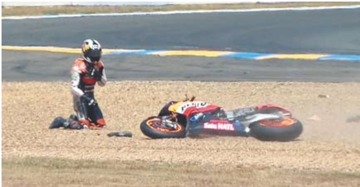
© Dani Pedrosa es posa la mà a l'espatlla després de caure al Gran Premi de França de motociclisme. || MOTO GP