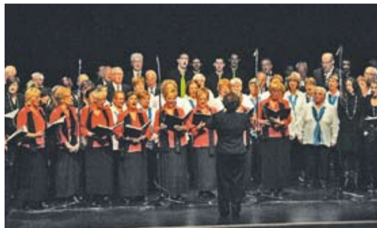
Trobada de corals amb la Coral Sant Josep d'una edició anterior.