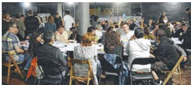
© Un dels moments del sopar organitzat per l'Altraveu. || JOSEP GRAELLS.

Segons Alamany, encara que l'acte no es pròpiament polític és el que realment els identifica i el que re-