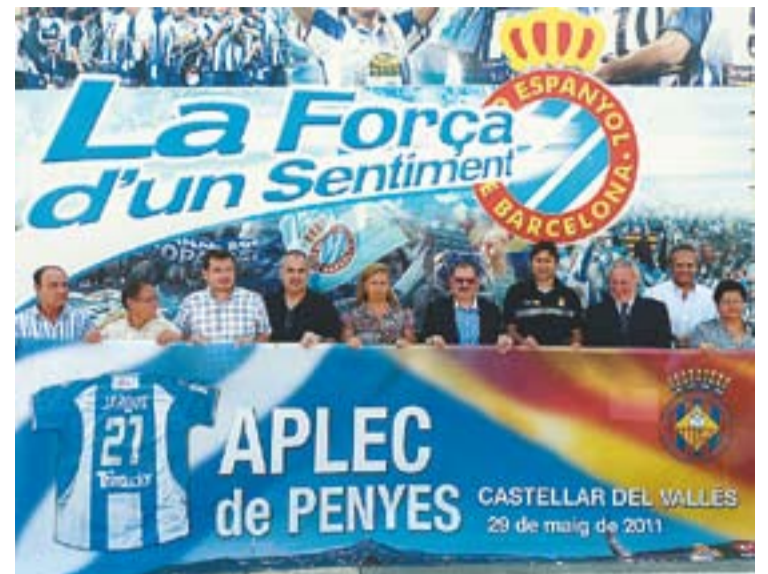
© L'expedició castellarenca mostra la pancarta amb Pochettino. || AJ. CASTELLAR