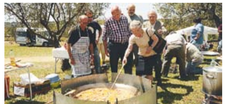
© El candidat Josep Carreras al costat de Pujol i la seva dona. || J.G.

CiU tanca els actes de cam- panya aquesta nit amb un sopar de pa amb tomàquet i pernil davant la seu de la formació. +