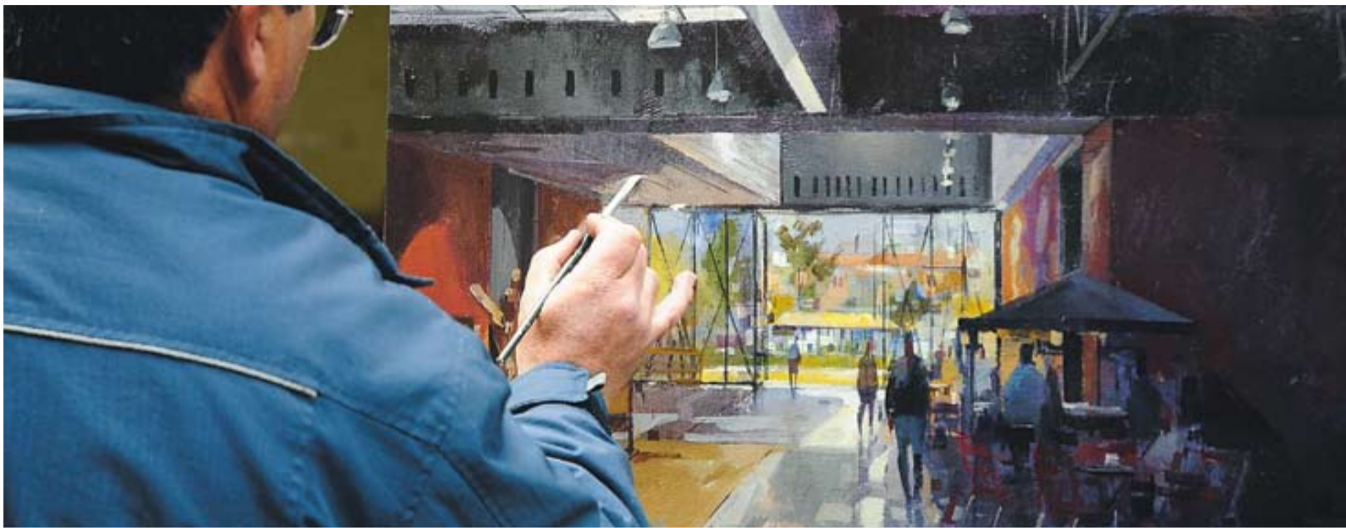
© Quadre de Julio García Iglesias, que va obtenir el primer premi del Concurs de Pintura Ràpida de Firart. || JOSEP GRAELLS

➤ Unes 1.600 persones, prop de la meitat que l'any 2006, han visitat la mostra d'artistes