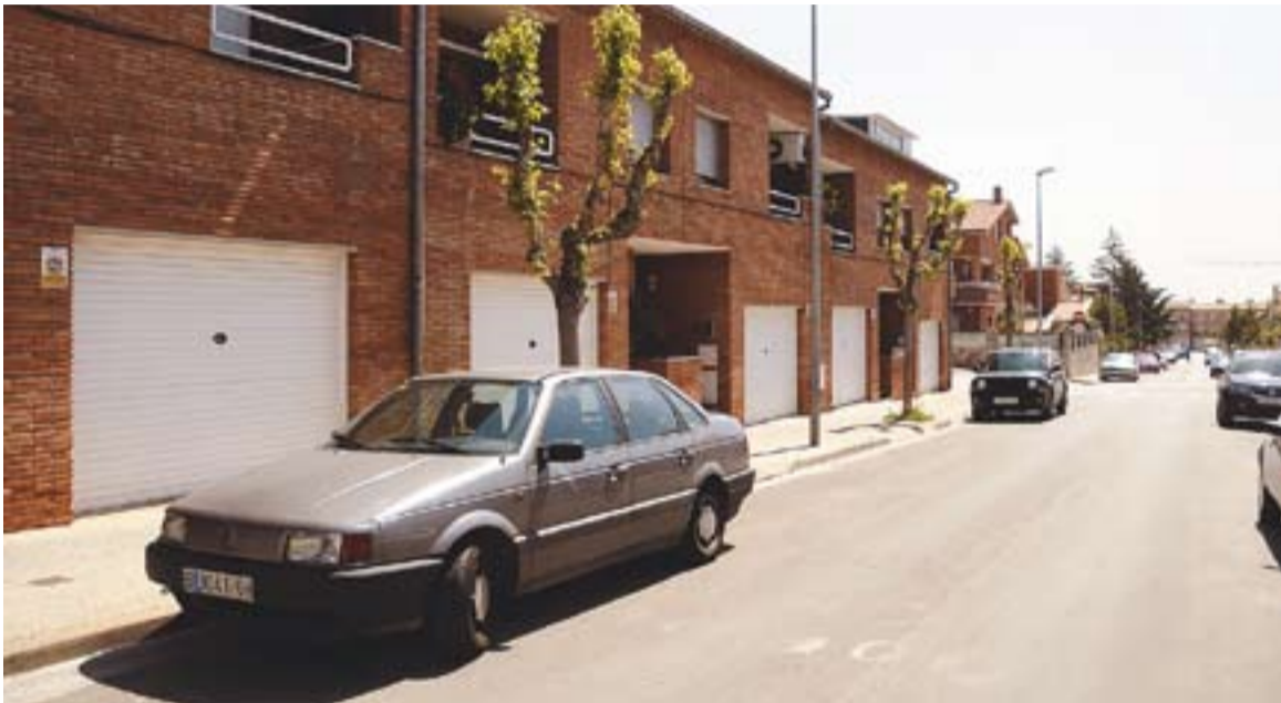
© Un carrer de l'Eixample. || JOSEP GRAELLS