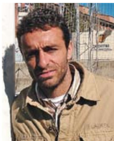
© 'Piti' Belmonte. || J. M.