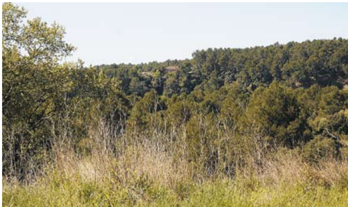
⊙ Els terrenys de Can Bages per on ha de passar el gasoducte Martorell-Figueres. || J.G.

SERVITUDS DE PAS || El principal problema del pas del gasoducte són les servituds de pas