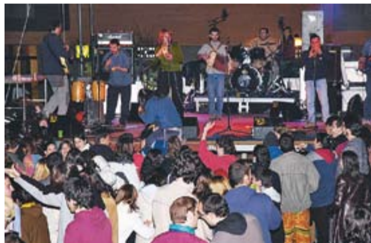
© Una imatge de la celebració del primer aniversari de l'Assemblea. || J.G.