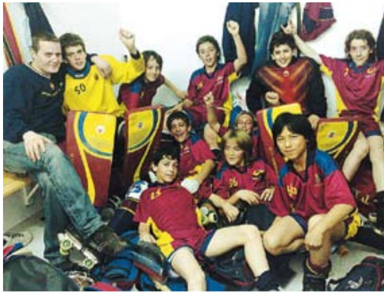
L'aleví de l'HCC celebrant la victòria.

L'INFANTIL || L'equip infantil no va tenir la mateixa sort que l'aleví. Els castellarenecs no van poder repetir la fita dels seus companys, després de perdre per 3 a 5 davant del Cornellà. +