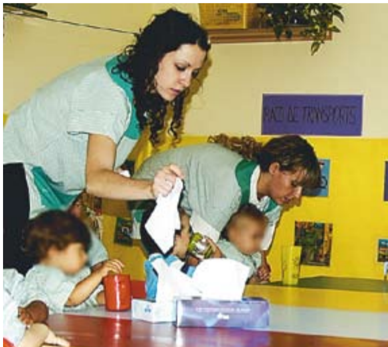
© Alumnes de l'escola bressol El Coral. || J.G.