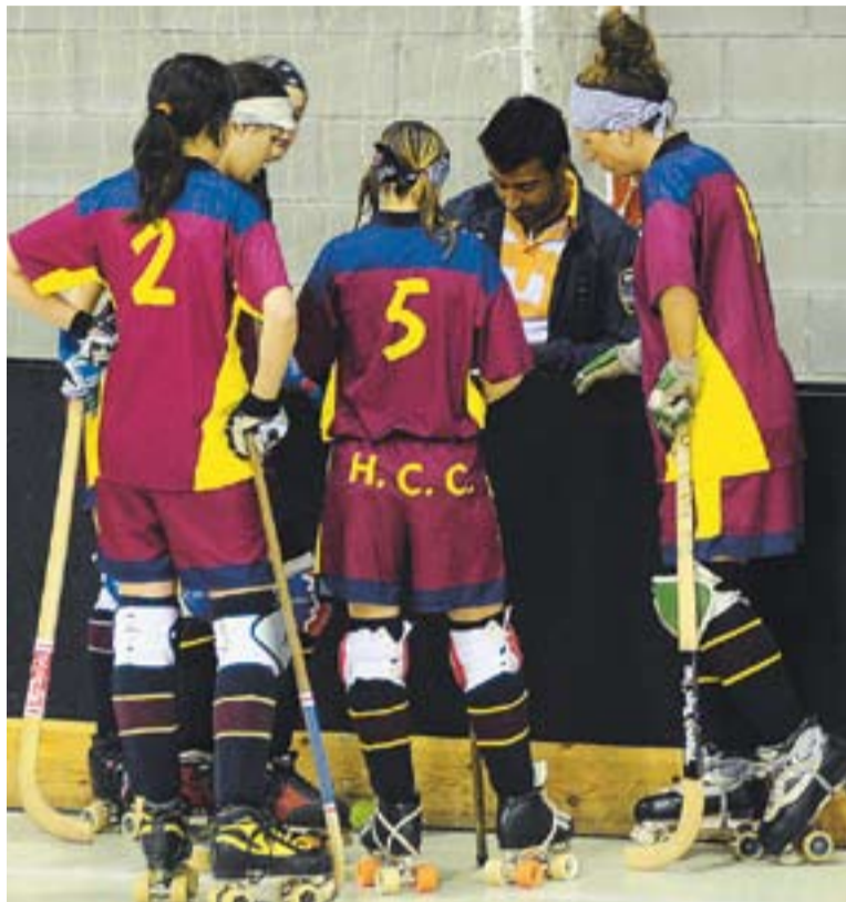
Raül Laprea seguirà entrenant el sènior femení de l'HCC.

L'entitat ha aconseguit conservar gran part de la plantilla. A més, també seguirà amb Raül Laprea a la banqueta.