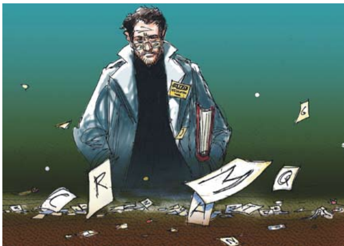
© Una flor no fa estiu. || JOAN MUNDET

No falla el mitjà, fallen les fonts. No estic parlant malament de les noves tecnologies, al contrari, els que em coneixen saben que m'encanten. Estic parlant de la qualitat informativa. I els llibres en segueixen sent el millor pou. +