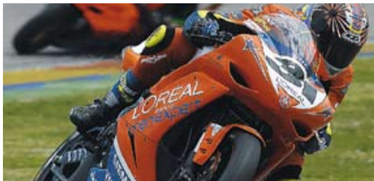
© Morales, aquest cap de setmana, a València. || TEAM LAGLISSE