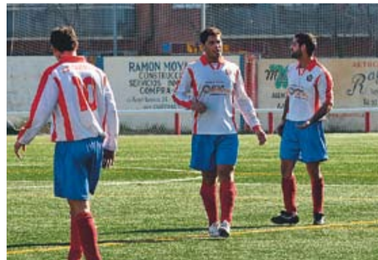
Els castellarencs, molt lluny ja dels dos primers llocs del grup.

INVASIÓ DE LES FÈMINES || L'equip femení de la Unió Esportiva, donat de baixa de la Federació Catalana fa dues setmanes, va agafar part del protagonisme a la segona part. Just començar el segon temps, les castellarenques van exhibir des de la grada de davant de tribuna tres pancartes que manifestaven el seu rebuig envers la decisió de la directiva de desfer l'equip. Al minut 56 i amb el resultat de 2 a 0 en el marcador, el grup de jugadores va saltar al camp en bloc obligant a parar el partit durant deu minuts. L'enfrontament es va reprendre sense problemes. ↗