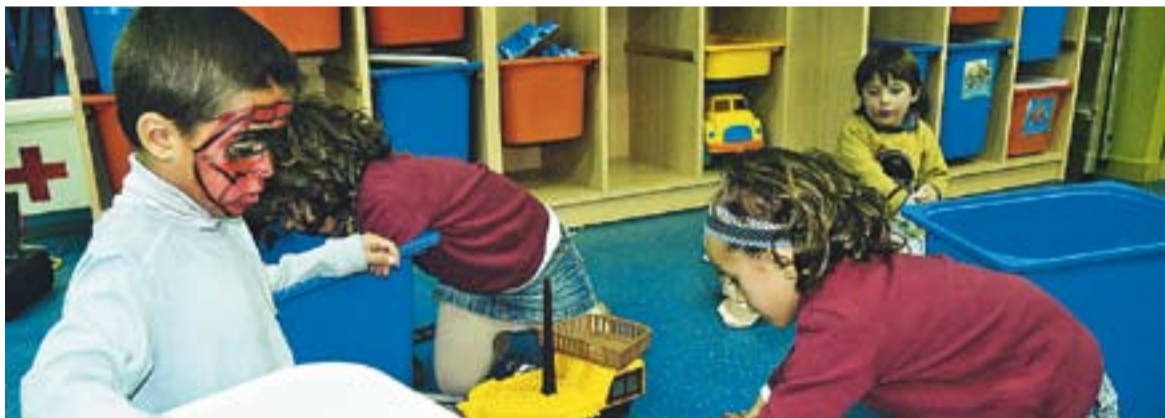
Un gran nombre de nens i nenes han passat per la ludoteca en aquests 10 anys.

Des de llavors, Les Tres Moreres ha anat creixent. A més de ser un espai de joc per als infants, ofereix l'Espai Familiar, un punt de trobada per els pares i mares dels infants. Cada curs s'hi inscriuen uns 80 nens i nenes, molts altres s'hi apropen esporàdicament o en visites amb les escoles. "No hi ha cap infant de la vila que no hagi vingut a la ludoteca al menys una estona" , apunta Avellaneda.+