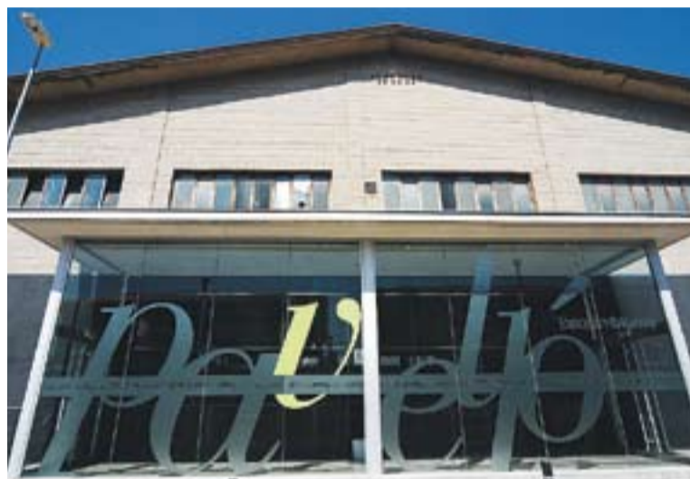
© El pavelló Joaquim Blume és la seu dels partits del FS Castellar. || JOSEP GRAELLS

ALTRES EQUIPS || Més enllà de l'equip femení, l'entitat vol seguir engreixant el número de jugadors. Per això es rebran jugadors de qualse-