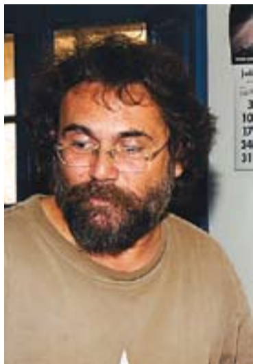
© Joan Mundet. || JOSEP GRAELLS

Els visitants del Saló van poder admirar els quinze originals que l'artista castellarenc presentava. Set eren il·lustracions fetes per la primera novel·la gràfica de