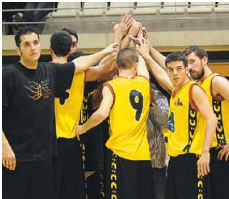
© Els castellarencs, conjurats per guanyar a Terrassa. || JOSEP GRAELLS

El Castellar partirà amb avantatge en el duel a Terrassa. Els castellarencs es troben una victòria per sobre els egarencs, i ho tenen molt difícil per perdre l'average, ja que van guanyar per 76 a 58 a l'anada. "No deixa de ser un partit trampa", explica l'entrenador Agustí Forné. "El Terrassa ve de perdre de pallissa a Sant Boi, però és un partit que van llançar perquè saben que s'ho juguen tot contra nosaltres". De fet, pel Terrassa sí que serà un partit a vida o mort el d'aquest proper diumenge. Si perden es quedaran sense opcions de salvar la categoria, i l'equip d'Agustí Forné aconseguirà