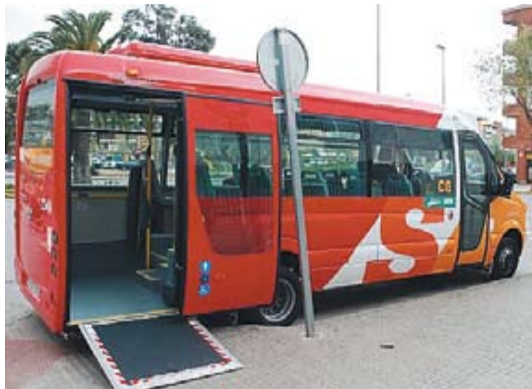
Imatge del nou vehicle adaptat de la línia C6.

Aquest és un dels canvis en les línies del transport urbà del qual es va informar a la primera reunió de la comissió de mobilitat interna de la Taula de Mobilitat que es va reunir la setmana passada. "Amb el canvi de recorregut, ara hi ha parades prop de la zona esportiva de Puigverd, el Casal Catalunya, el CAP i l'Escola Sant Esteve", ha indicat el regidor de Seguretat Ciutadana, Transports i Mobilitat, Jordi Carcolé. A la trobada també es va anunciar que, per primera vegada, la línia C4, que també ha sofert canvis de recorregut, i la línia C6 tindran servei a l'agost. "S'oferirà un recorregut que