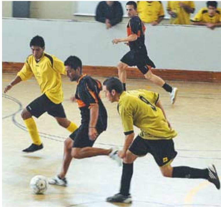
El Màgia Team va ser el vencedor de les 16 hores del FS Castellar.

Dissabte passat, va ser el Futbol Sala Castellar l'encarregat d'organitzar les 16 hores, amb victòria final del Magia Team per 6 a 1 contra La Banda del Gallinero. L'equip vencedor, format majoritàriament per jugadors del FS Castellar, va eliminar el Restaurant El Recreo (6-3) en semifinals