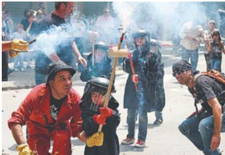
Les Espurnes de Castellar es van estrenar a al Correfoc de la Creu Alta.

Les Espurnes són la nova colla infantil dels diables de Castellar. Es van estrenar diumenge en el marc de la Festa Major de la Creu Alta. La colla està formada per 30 nens i nenes d'entre 3 i 11 anys. La iniciativa de l'ETC va sorgir per la inquietud dels mateixos infants de participar com a diables amb els seus pares i mares. Les petites Espurnes vesteixen una capa blau marí amb caputxa i banyes vermelles, tot elaborat amb roba ignífuga. També porten unes pantalles de protecció a la cara. Els adults són qui manipulen la pirotècnia. †