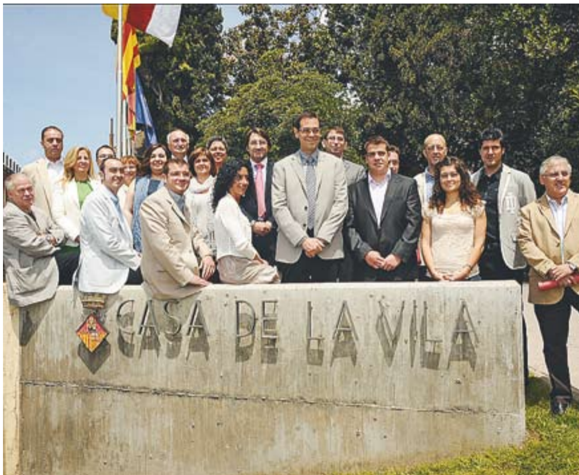
Foto de família dels regidors i regidores del nou consistori després del ple celebrat als Jardins del Palau Tolrà.

Entre els aspectes destacats del nou mandat, Giménez va ex-