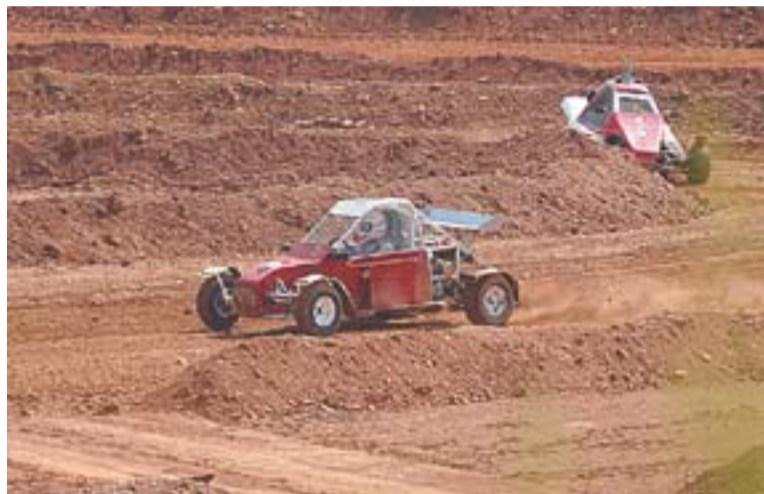
Els car cros seran uns dels vehicles que donaran espectacle.