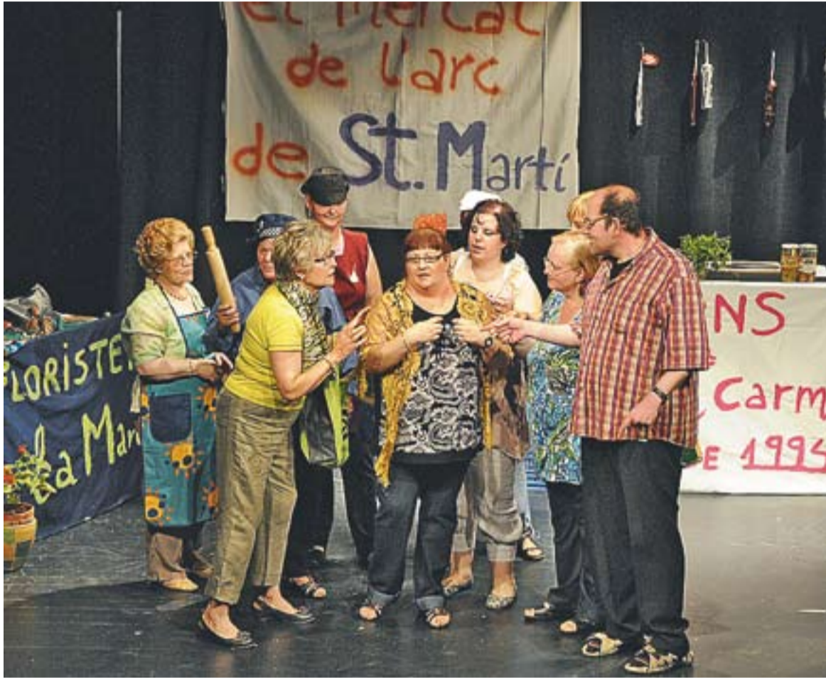
Un moment de la representació d'El Mercat de l'Arc de Sant Martí dimecres a la Sala de Petit Format

El programa de salut emocional Arc de Sant Martí tanca el curs amb 'El mercat'