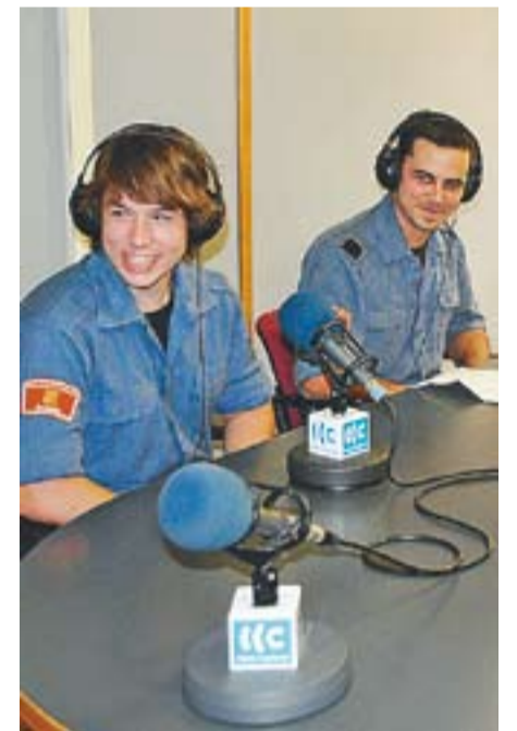
© Dos bombers joves voluntaris. || J.G.

Els joves bombers hauran de competir davant de portuguesos, italians, suïssos, belgues, anglesos i francesos en diverses modalitats esportives: hoquei, biatló, bobsleigh, cúrling i eslàlom gegant d'esquí. +