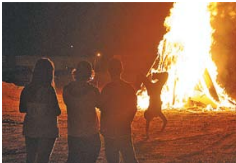
Joves de Castellar celebren Sant Joan davant d'una foguera l'any passat.

L'Agència de Protecció de la Salut ha distribuït uns fulletons amb recomanacions a l'hora de comprar i conservar les coques. Així, s'aconsella comprar-les en un establiment apte per a l'elaboració i venda d'aquests aliments, i conservar en fred les de crema i nata fins el seu consum (si no les consumiu en la seva totalitat, torneu-les ràpidament a la nevera). És important que es seleccioni el tipus de dolç en funció de les