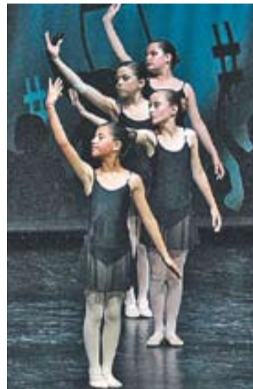
© Ballarines de Dansa Parc. || J.G.

En el futur, "a l'escola ens plantegem poder presentar espectacles de més nivell, com a companyia de dansa amateur", clou Guitart. †