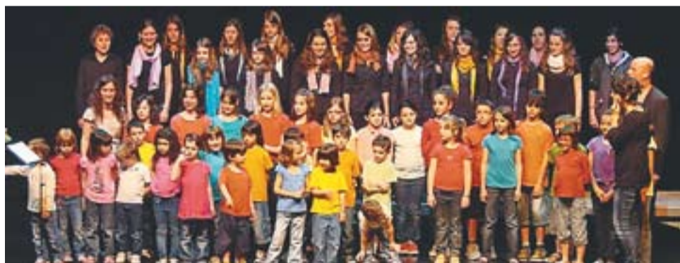
Moment del concert de fi de curs de la Coral Sant Esteve.

PORTES OBERTES || El Cor Sant Esteve es trasllada a la sala de plens de l'antic Ajuntament, al carrer Major, 74. Per aquest motiu, el dia 10 de setembre hi haurà una jornada de portes obertes per donar a conèixer el nou espai. †