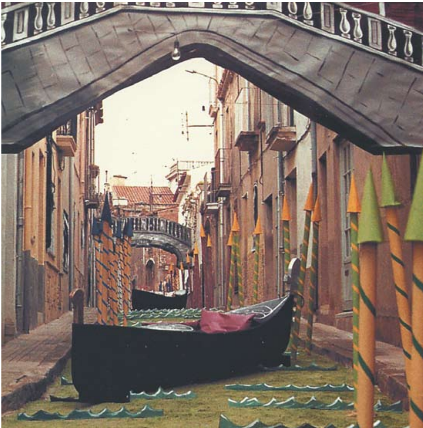
Carrer Bassetes engalanat imitant Venècia durant la Festa Major de 1998.

L'exposició es titularà La ruta dels carrers engalanats i comptarà amb fotografies dels fons Garrós i de la resta de donacions anònimes. "A més, si no tenim una allau molt gran de fotografies, indicarem el nom de qui ha fet la donació de la imatge". +