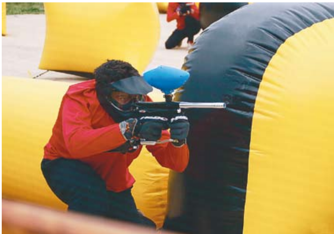
Moment de l'activitat Paintball d'Xtremme Gravity entre diversos jugadors.

HISTÒRIA DEL PAINTBALL || El Paintball va començar "com un joc de caça entre dos amics als boscos de New Hampshire", explica Fabregat. Originalment, va ser batejat com a National Survival Game, l'any 1976. Amb el temps, els