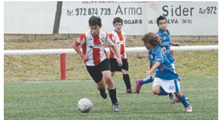
El torneig Cortiella reuneix els millors clubs de Catalunya.

sala de la vila, l'Atlètic 04 Castellar, no farà les seves 16 hores fins després de l'estiu. És previst que durant el mes de setembre, abans de començar la temporada 2011-2012, organitzin una competició amistosa. +