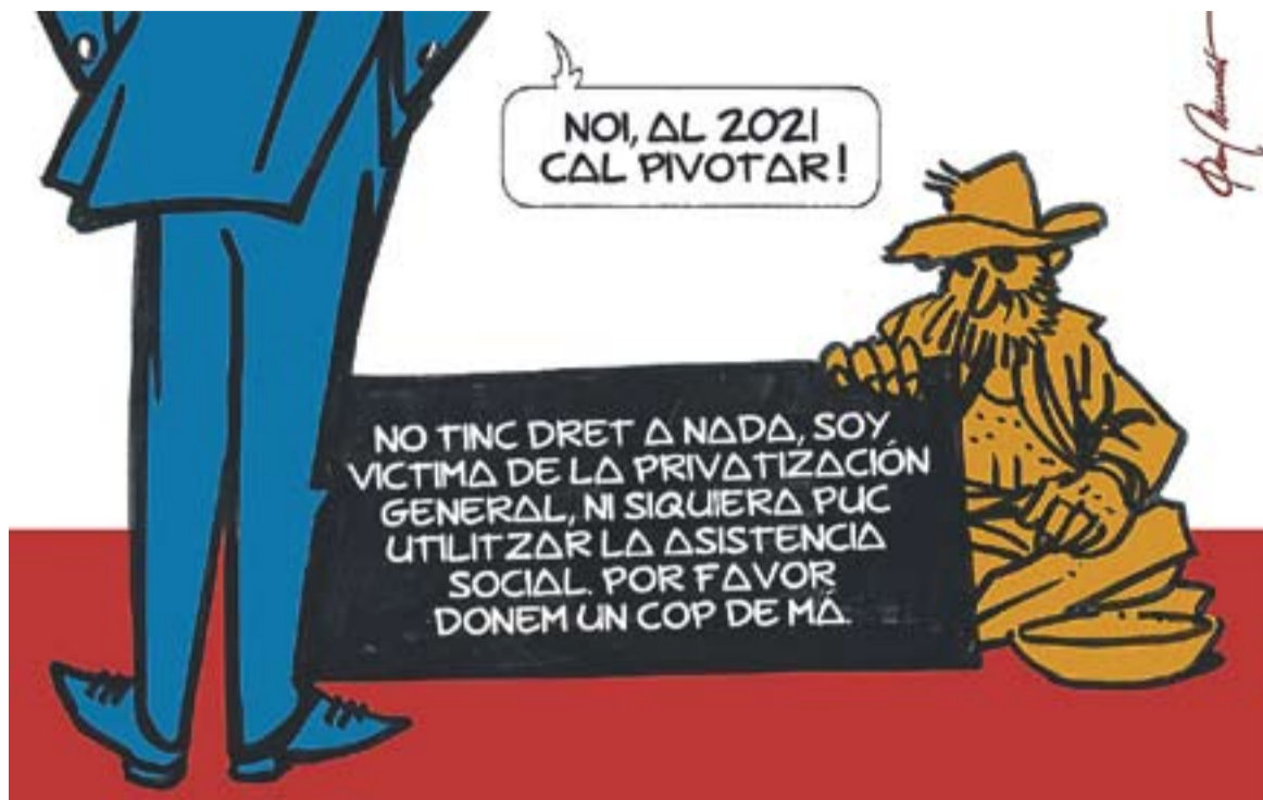
© D'aquí deu anys. || JOAN MUNDET

Castellar forma part des de la primera edició dels Projectes Rellevants del que actualment són el Clúster del Packaging i la Maquinària d'Alimentació de Catalunya i el Clúster de Tecnologies Mèdiques de Catalunya. Tal vegada, paraules com clúster (conjunt d'empreses i d'institucions agrupats al voltant d'un negoci comú en un territori, que aprofiten la demanda i la competència per a fomentar la innovació), innovació productiva o noves tecnologies sonin a música celestial, 'mantres' que