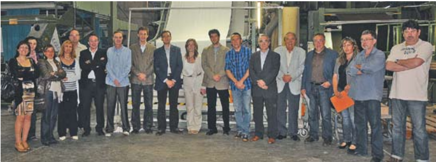
© Directius i membres del comitè de l'empresa Grau amb responsables de l'Ajuntament de Castellar i del Consell Comarcal en la visita a l'empresa. || J.G.