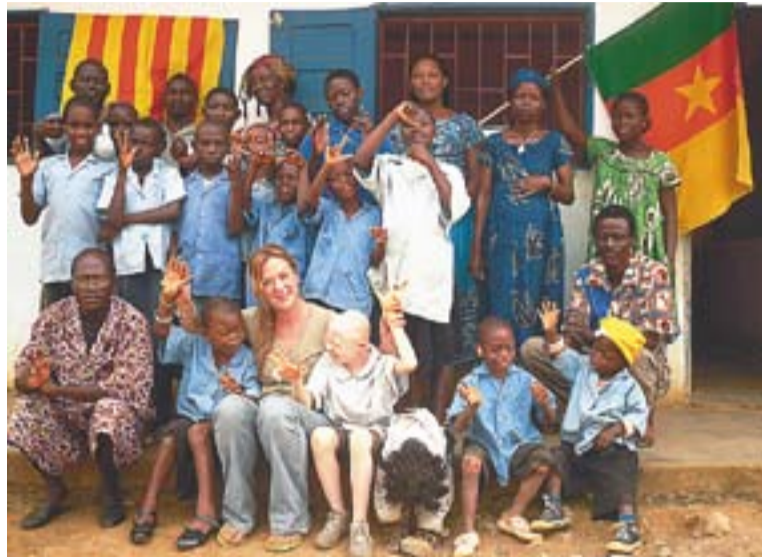
© Escola de sords IMSHA d'Éseka al Camerun amb membres de Codes Cam || J.G

També es finançarà el projecte Suport al centre de dones de F'nideq de l'ONG Entrepobles al Marroc. “El projecte està adreçat a dones de 15 a 45 anys sense ingressos i vol reforçar de les capacitats de les dones en l'àmbit dels drets humans, jurídics, sanitaris, culturals i econòmics”, explica Massagué. Així mateix, també es finançarà al projecte El Trapiche que duu a terme Castellar x Colòmbia a Medellín. “S'adequarà i es reconstruirà el centre educatiu rural ‘La Montañita’, escola