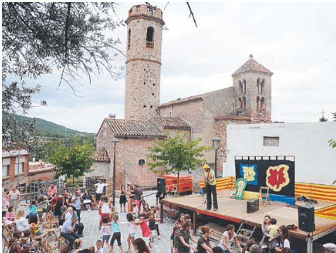
Animació a la plaça de Sant Feliu durant la Festa Major 2010.

Els actes arrenquen divendres, 26 d'agost, a les 21:30 hores, amb el Pregó de Festa Major. El seguirà un concert jove a les 23