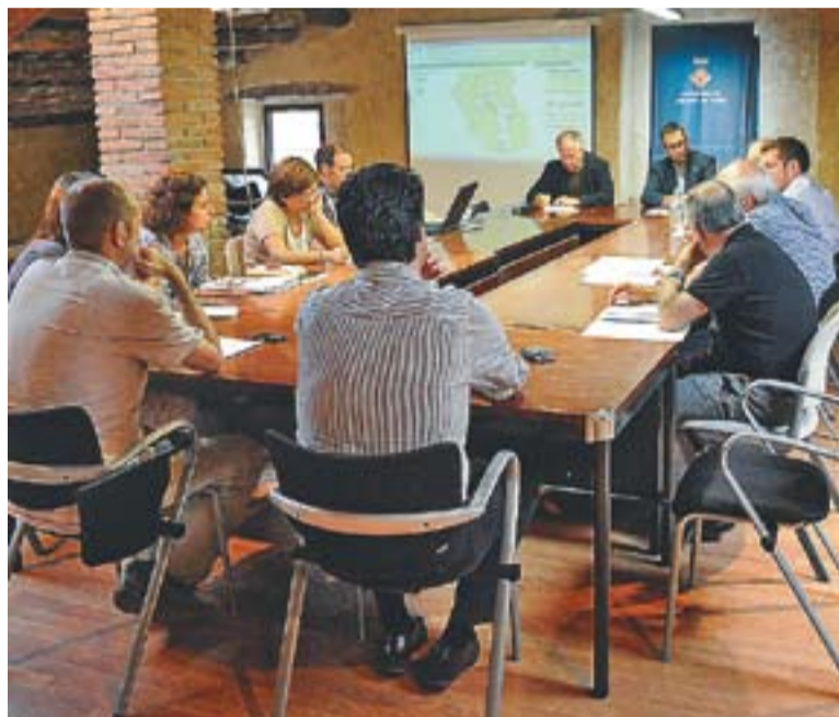
© Els integrants de la comissió que impulsarà la revisió del POUM. || J.G.

En aquesta primera reunió, a més de fer un repàs de les feines fetes durant l'anterior mandat, es va presentar la plataforma Urbanet, un nou entorn de consulta actualitzada sobre plànol del planejament urbanístic i de la normativa associada. Aquesta nova aplicació, que es posarà en marxa el mes de setembre, serà accessible des de l'apartat de planejament del portal web municipal. Segons González, "s'hi podrà consultar absolutament tot, des de marcar una parcel·la i veure les seves dimensions fins saber què es pot construir i quines dimensions pot tenir".