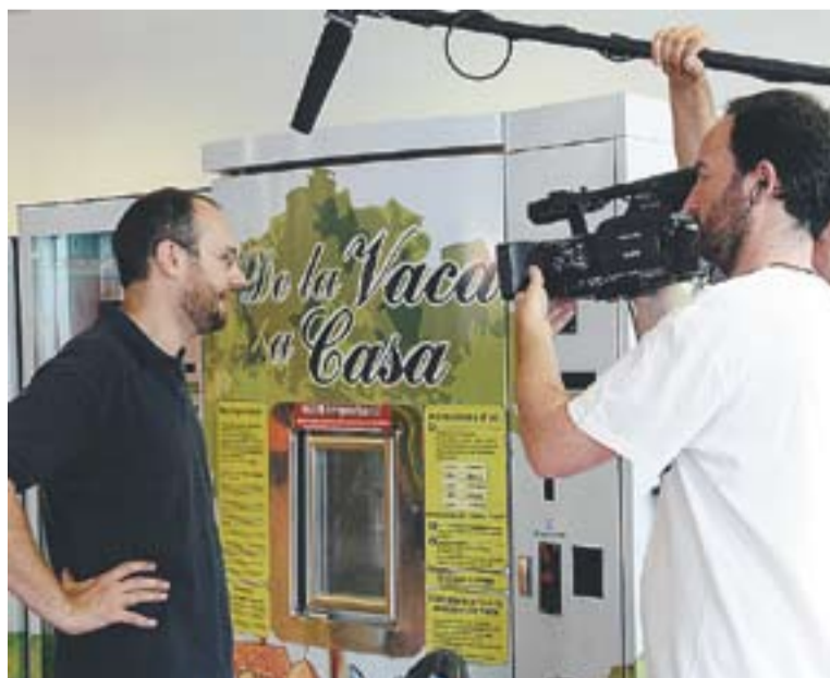
Les càmeres del 'Karakia' graven al Sandri comprant llet fresca al mercat.

De fet, la regió del Friül té una història i una llengua pròpia, una