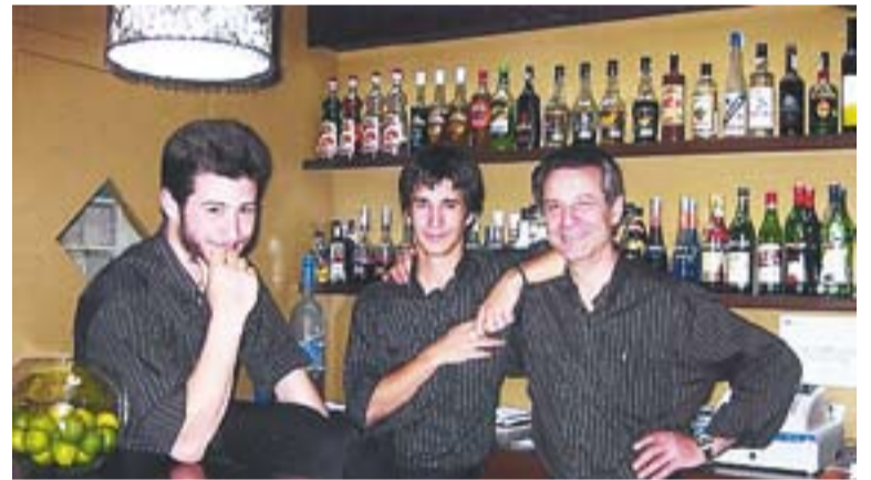
© Els propietaris del Boston Cocktail Bar || BOSTON COCKTAIL BAR

Però, a partir d'aquesta setmana sembla que el Boston tindrà més competència pel que fa als cocktails, el Brando ha decidit introduir el famós mojito a la seva carta “però no serà el típic mojito, ja que estarà fet amb granissat de llimona” . +