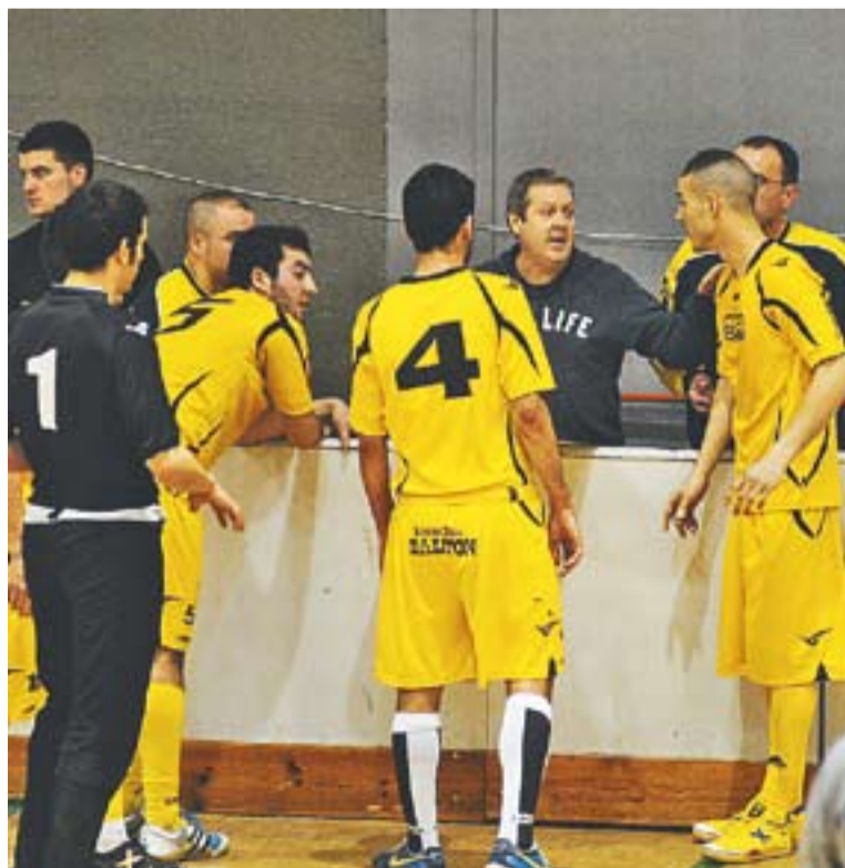
L'equip de l'Athlètic 04 en el temps mort d'un partit al pavelló Blume.