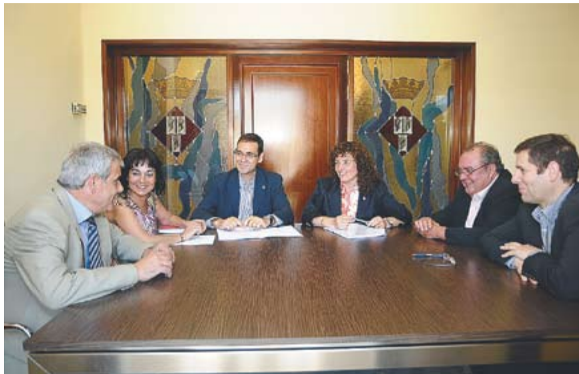
Trobada dels alcaldes de Castellar del Vallès, Sentmenat i Sant Llorenç Savall a l'Ajuntament de Sentmenat

D'altra banda, la comissió intermunicipal ha estat analit-