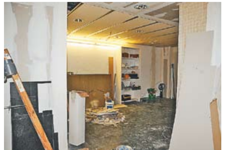
⊙ Aquest era l'estat de les obres al CAP dimecres passat. || JOSEP GRAELLS

Pel que fa a la nova rotonda de la B-124, s'està a l'espera que el Departament de Ports i Transports de la Generalitat autoritzi reprendre l'itinerari de l'autobús per la carretera una vegada s'ha completat l'obra del giratori. Amb la construcció de la rotonda es millora la seguretat dels accessos a les dues parades de la B-124. ✦