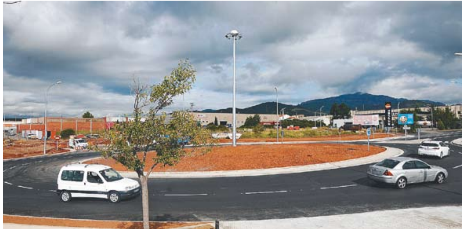
⊙ La rotonda de la B-124 ja plenament operativa, amb la senyalització i enllumenat instal·lats. || JOSEP GRAELLS

ANTIC AJUNTAMENT || Les obres de l'antic Ajuntament avancen a un ritme més lent. Si bé s'havia apuntat que l'equipament, que ha d'acollir l'Arxiu Municipal a la planta baixa i locals d'assaig de les corals al primer pis, podria estar llest per Festa Major no estarà acabat. Després que l'empresa Vigaus reprengués al març les obres de l'equipament una vegada l'anterior adjudicatària, Imaga Construcciones SA presentés un concurs de creditors, "l'equipament hauria d'estar acabat a mitjan setembre" , constata Canalís. Durant aquest agost, les obres s'alentiran una mica ja que en alguns dies no s'hi treballarà. Els treballs de reha-