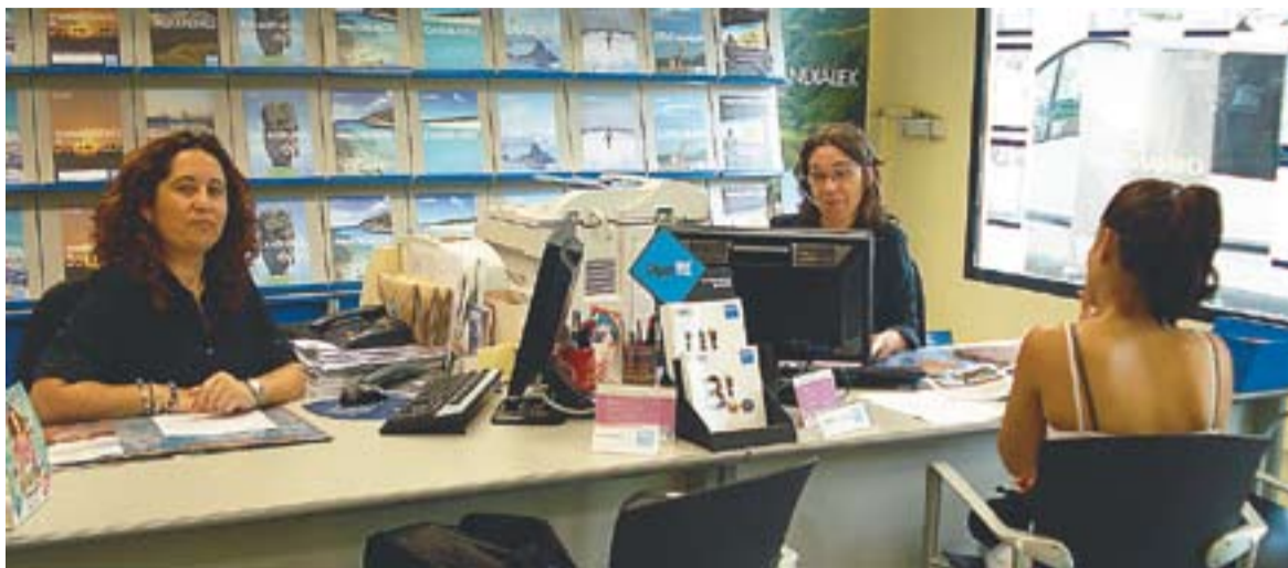
© Les agents de Barceló Viatges, de l'avinguda Sant Esteve, expliquen que Turquia és el viatge que més s'està venent. || C. D.