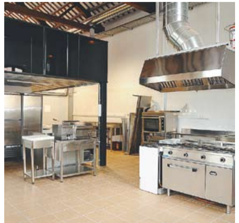
⊙ La nova cuina dels antics safareigs de la Baixada de Palau. || J.G.

bilitació de l'antic Ajuntament estan finançats pel FEOSL. La nova seu de l'Arxiu Municipal tindrà 400 metres de superfície útil amb diverses sales, la principal de les quals disposarà de 18 punts de consulta i un punt d'atenció al públic. A la part superior hi haurà diverses sales per a fer-hi cerimònies, actes institucionals i altres usos. L'Ajuntament està en converses amb les corals Sant Esteve, Xiribec i Sant Josep perquè aquestes entitats les puguin fer servir com a local d'assaig.