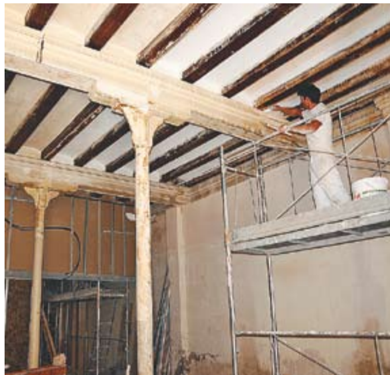
⊙ Un operari treballant a l'interior de la sala de plens de l'antic Ajuntament. || J.G.