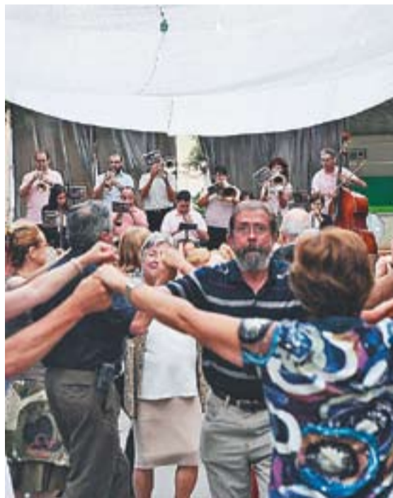
A dalt, el sopar de veïns. A sota, a l'esquerra, les havaneres amb Terral. A la dreta, sardanes amb la cobla Vila d'Olesa.