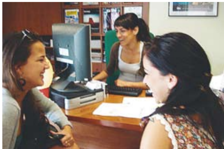
© Gemma, d'Ambar Tours, atèn l'Anna, que marxa de viatge a Sardenya. || C. D.

Respecte els viatges de noces, a Ambar Tours n'han observat un augment. “Tenim moltes parelles que marxen al juliol i també al setembre i la destinació estrella ha estat Tailàndia” . +