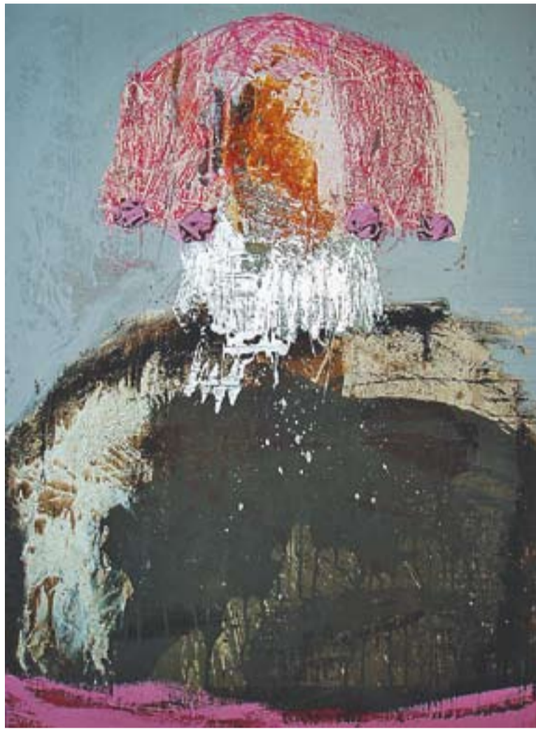
© Pintura de Las Meninas, obra de gran format d'Enric Aguilar. || CEDIDA

Anteriorment, Aguilar ja havia venut algunes peces en aquesta galeria menorquina, "com ara les que es van exposar a Firart l'any 2008 i que vaig titular 'Ciclistes'" , explica