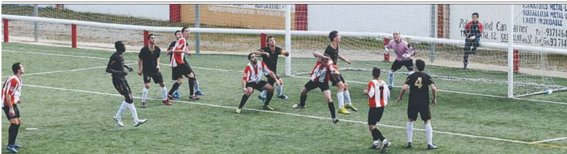
Els jugadors de la Unió Esportiva Castellar intentaran debutar amb més fortuna que la temporada anterior, que van començar amb derrota.