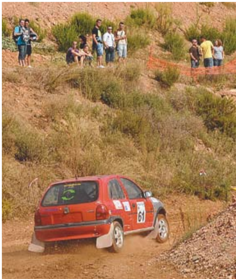
Una imatge del públic durant la primera cursa social d'autocròs.