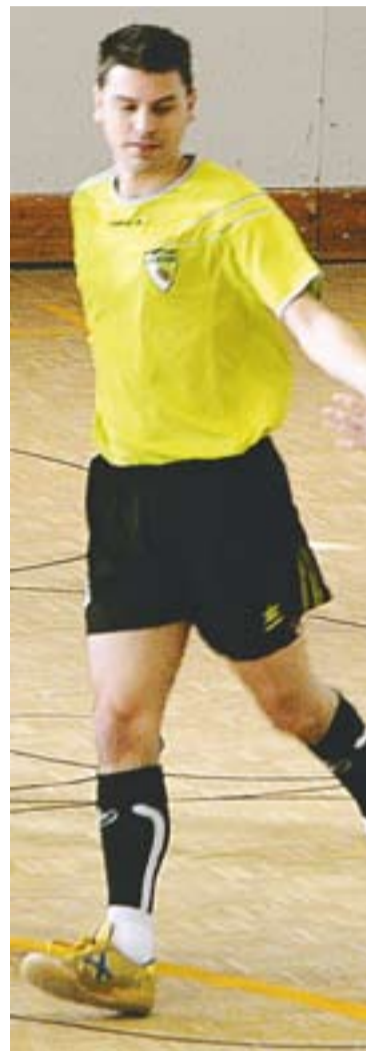
© Els equips castellarencs de l'Atlètic 04, Futbol Sala Castellar i Atlètic Almendra es trobaran a Segona Catalana. || J.G.