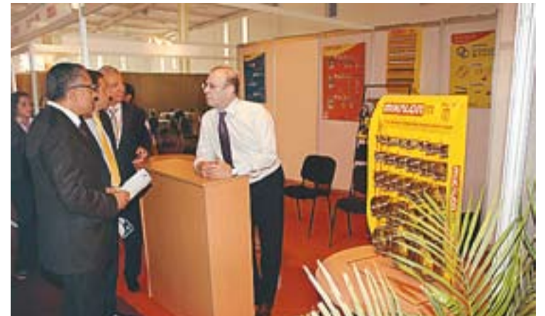
Membres de Damesa a Industech amb el Ministre de Comerç Exterior marroquí.