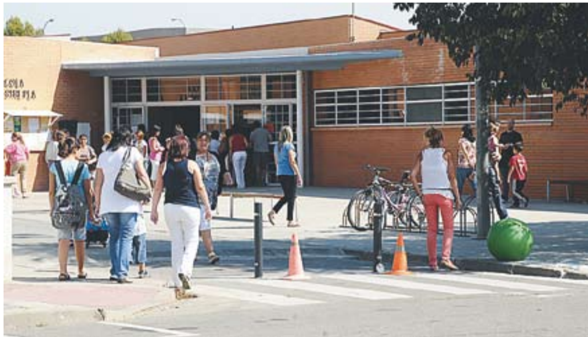
© Mares i pares deixant els seus fills a l'escola Mestre Pla, amb les noves pilones fixes instal·lades. || JOSEP GRAELLS