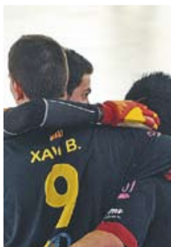
Un partit de l'HC Castellar.