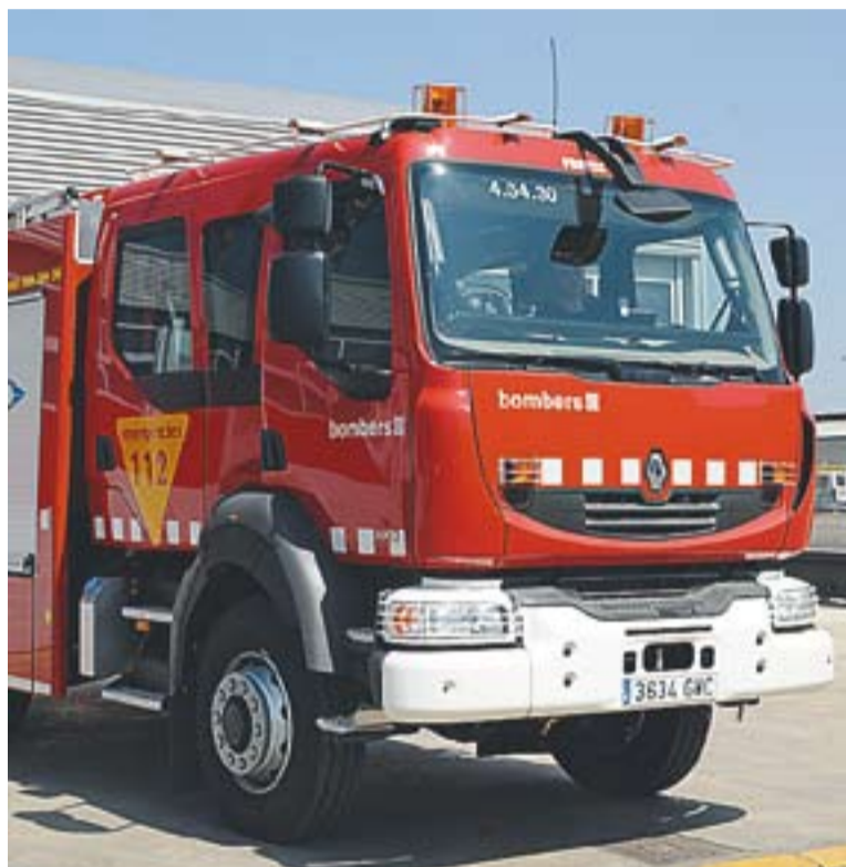
Camió dels bombers voluntaris de Castellar del Vallès

Però no tot l'estiu ha tingut una climatologia poc usual. Els termòmetres han marcat les seves màximes a finals d'agost. "Durant les darreres setmanes d'agost les temperatures han estat força elevades, sense ruixats. Quan les temperatures superen els 30 graus i el ni-