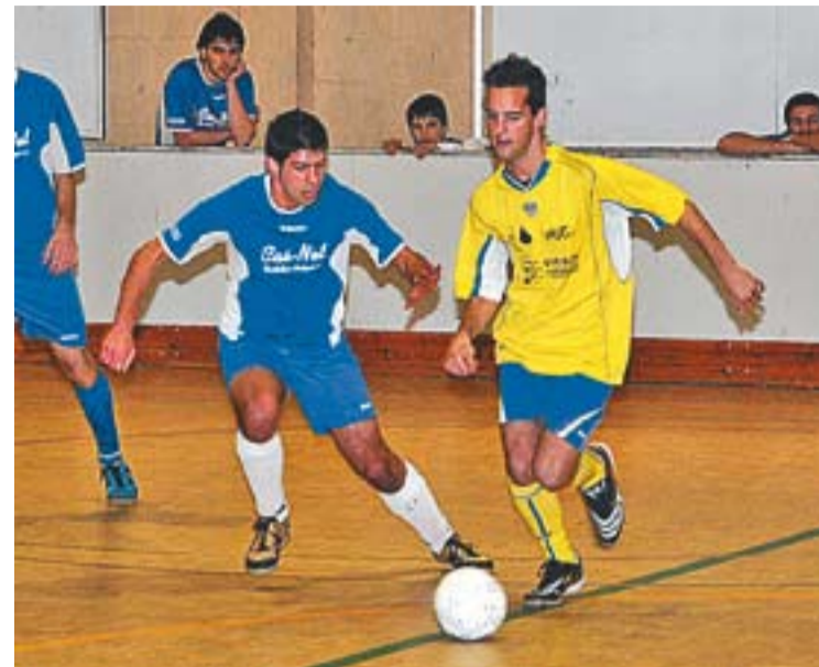
☉ Una acció en un partit del campionat social de Castellar.