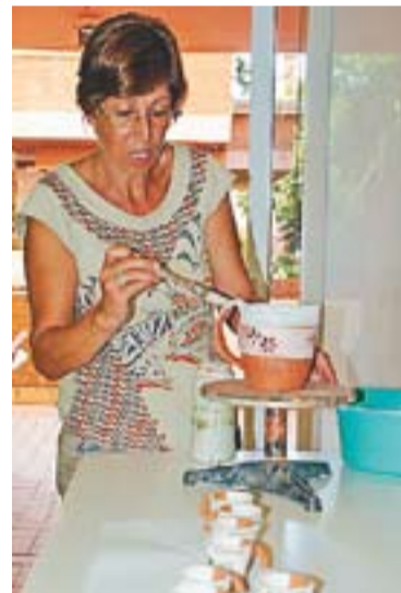
© La ceramista Mari Fresneda. || J.G.

Fresneda també realitza tallers puntuals a diversos equipaments: a les dones de Benestar Social "i també he fet classes a l'escola Bonavista i al Sol i Lluna". +