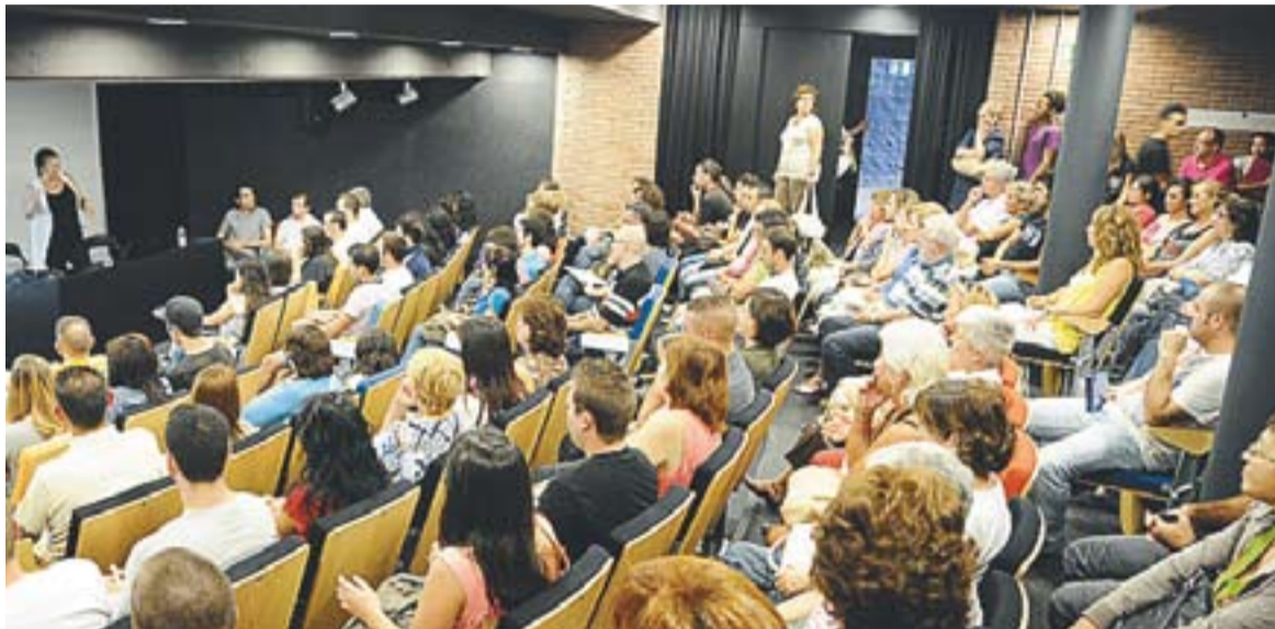
Presentació del nou curs de l'Escola d'Adults de Castellar del Vallès a la Sala d'Actes d'El Mirador

El centre municipal enceta el curs acadèmic amb dos professors menys