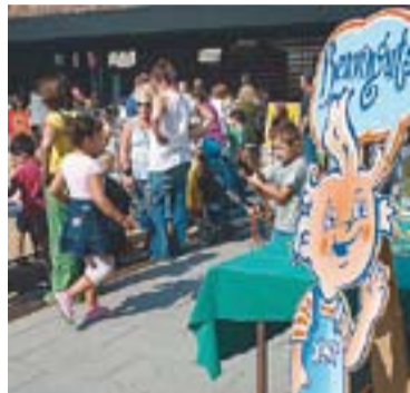
© Presentació de La Xarxa. || ARXIU

la desena edició del Vallesclown - Setmana del Pallasso". Enguany s'haurà de continuar fent un esforç econòmic, "i com que no volem pujar els preus, necessitem la màxima col·laboració, força as-