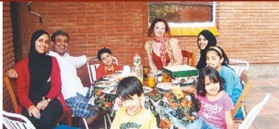
© Dawn Buckler amb una família de Dubai que ha estat en una de les cases de lloguer aquest estiu. || D.B.

Dawn Buckler lloga cases dels voltants de Castellar a famílies estrangeres que volen passar l'estiu en un entorn natural i únic