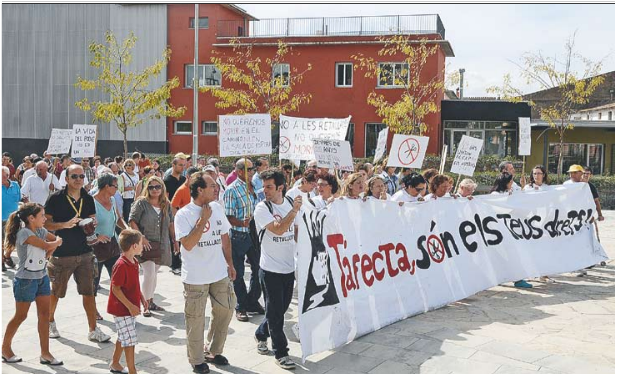
© Capçalera de la manifestació, que es va desplaçar des del CAP fins als Jardins del Palau Tolrà. || JOSEP GRAELLS