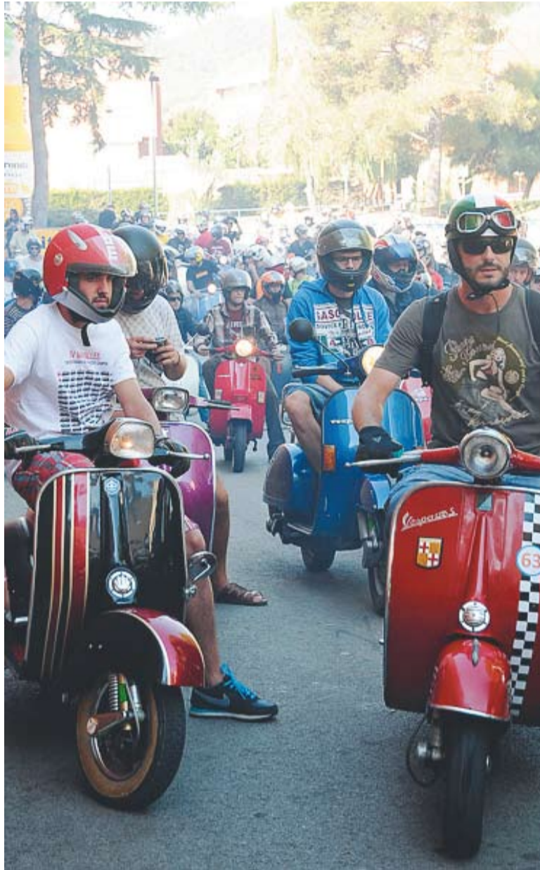
© Edició de Retrovespa 2011. Moment de la sortida de motos. || JOSEP GRAELLS

Al vespre, el grup de música Els Frager-Rock va amenitzar la vetllada fins gairebé les 23 hores. "Ens ho hem passat molt bé, i com cada any ha estat una festa d'amics i coneguts" , afirma Ribera. †