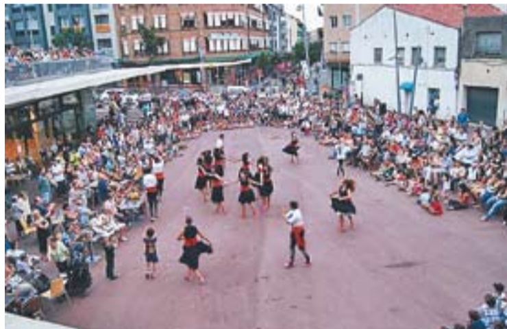
© Actuació del Ball de Gitanes per Festa Major 2011. || CEDIDA

Aquesta setmana, el Ball de Plaça comença els assaigs. Tothom qui vulgui apuntar-s'hi ha d'enviar un correu a balldegitanes@gmail.com o bé trucar a 626081376. L'entitat també té seguidors al perfil “Ball de gitanes Castellar del Vallès” de Facebook. +