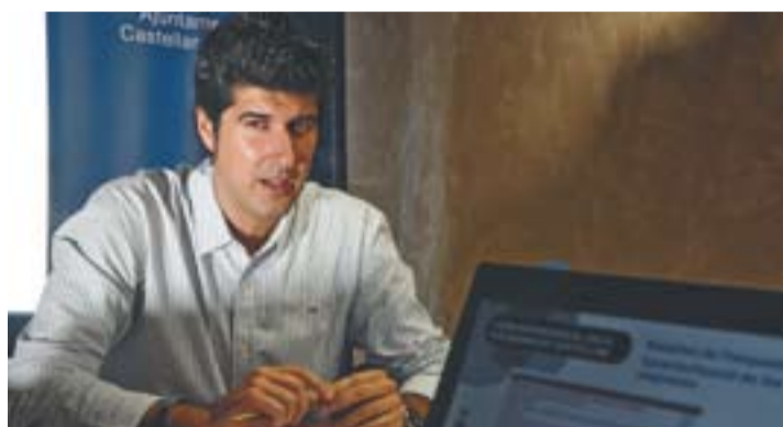
© Joan Creus, regidor de l'Àrea de Promoció i Innovació || J.G.

Una dada destacable és que tres de cada quatre empreses (el 75,7%) afirma que es tornaria a instal·lar a Castellar. Per contra, la majoria d'empreses que optarien per no tornar-se a instal·lar a la vila expliquen que no ho farien