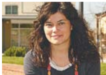
© Elisenda Alamany (L'Altraveu). || J.G.

L'Altraveu organitza amb la col·laboració de l'entitat Dones Hipàtia un cicle sobre Diversitat sexual i de gènere que s'allargarà des de l'octubre fins el desembre i on s'oferiran fins a cinc conferències per reflexionar i aportar propostes. El nou local de L'Altraveu, ubicat al carrer del Centre, número 8, serà l'espai que acollirà les diverses xerrades. La primera tindrà lloc divendres 7 d'octubre a les 19.30 h. i Mária Martínez, Doctora en Ciència Política, parlarà sobre el món i la política vistos amb perspectiva de gènere. Tot plegat, amb l'objectiu que certs col·lectius és visualitzin. "Aquest cicle es planteja com la visualització d'uns col·lectius. Pensem que vivim en una societat on es garanteix la llibertat de tots els col·lectius, però si ens posem a mirar dades, no és així. Per exemple, la dona només ocupa