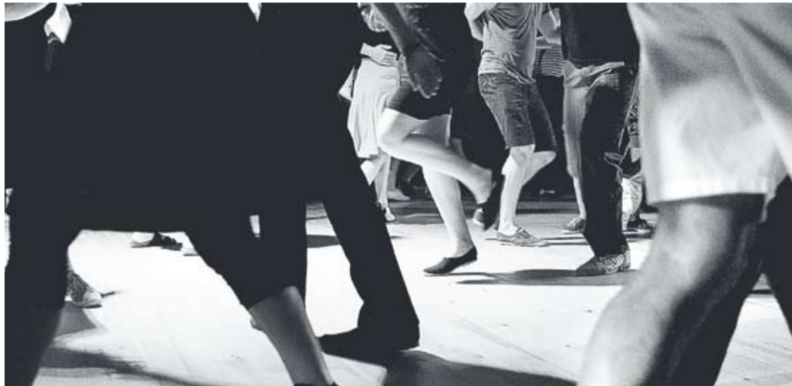
Detall d'un grup de balladors de 'lindy hop' en acció, en una imatge feta per un dels impulsors de Sona Swing.

La idea dels joves castellarencs és formar un grup de gent