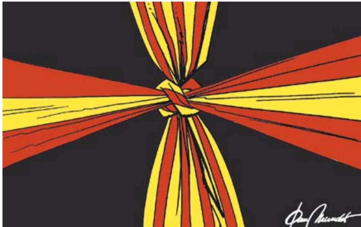
© El nus de la llengua. || JOAN MUNDET

gairebé segur. En aquesta línia és important i necessari el paper de les aules d'acollida. Parlar de segregació en aquests casos no és massa pertinent atès que es troba molt més segregat (a l'ESO i al Batxillerat) i durant més temps un alumne que ha d'assistir a unes classes sense entendre res o poc del que s'hi diu. Els centres escolars i el seu pla d'estudis en general no són el problema pel que fa a l'aspecte lingüístic: el