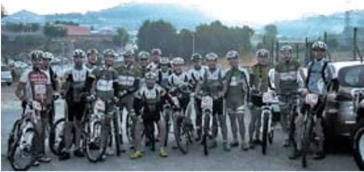
© Els participants del Bike Tolrà a la Selènika . || BIKE TOLRÀ