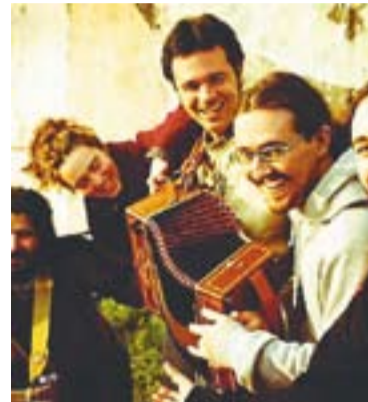
© El grup d'ska, reggae i folk, Batak

El tret de sortida de la programació d'actes de la tarda serà una ballada de sardanes a càrrec de la Cobla Ciutat de Terrassa amb la col·laboració de l'ASAC. La poesia i la música aniran de la mà a les 19.15 hores amb el recital de poemes musicats Joan Oliver l'home, Pere IV el poeta .