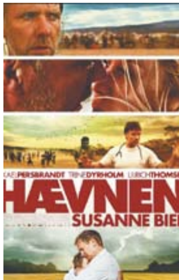
© Cartell de la primera pel·lícula de la temporada

El dia 4 de novembre es projectarà el documental Inside job , dirigit per Charles Ferguson i doblat al castellà (VOSE). Aquest projecte s'endinsa en les causes i els responsables de la crisi econòmica mundial iniciada l'any 2008.