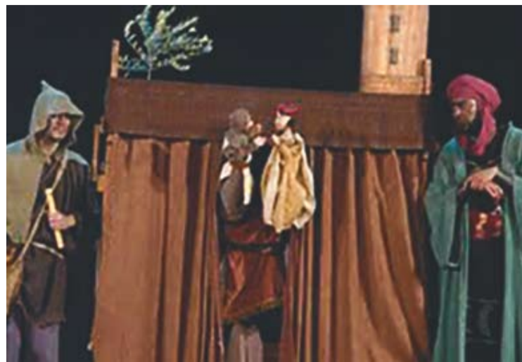
© La Cia. Pa Sucat presentarà 'Meravelles d'Orient'. || CEDIDA

Malgrat tot, l'artífex de llibrenet.com es mostra del tot satisfet i diu que "m'ha sorprès molt l'enorme demanda, uns 60 llibres al mes...! De vegades no dono l'abast.". +