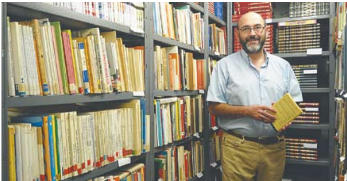
© Joan Galí és el responsable d'aquest portal de venda de llibres de segona mà a la xarxa. || JOSEP GRAELLS

➤ www.llibrenet.com és una web castellarenca que ofereix llibres de segona mà