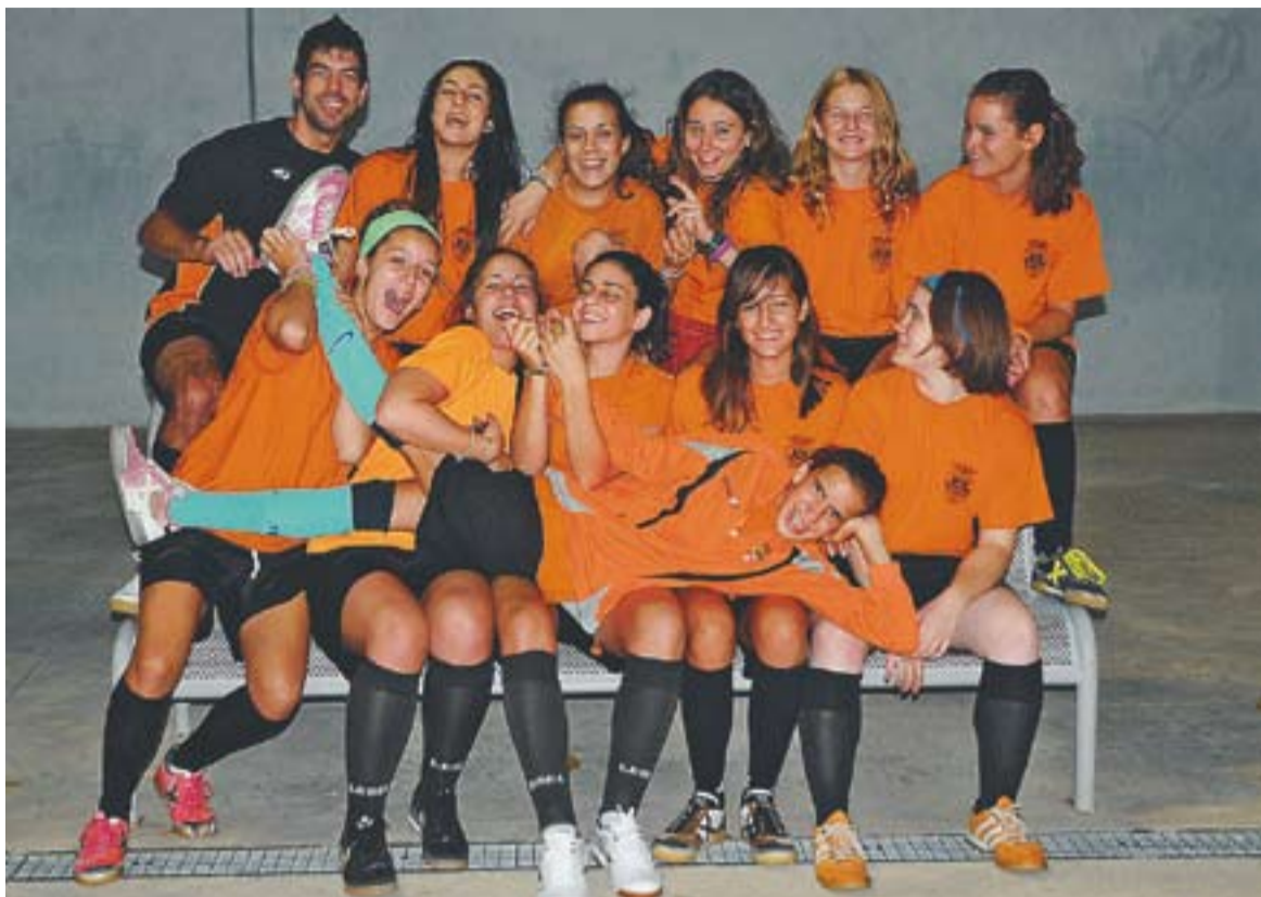
© L'equip juvenil-cadet del Futbol Sala Castellà en un entrenament d'aquesta setmana. || JOSEP GRAELLS