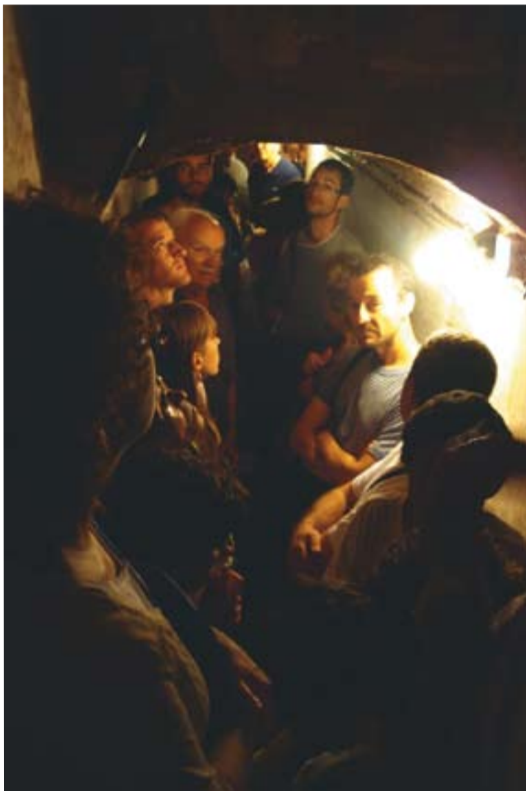
© Aquest és un dels túnels construïts a prop de l'església. || R.G.

Diumenge dia 2 l'atenció es va centrar a l'antic Ajuntament, on 200 persones van trepitjar el renovat espai que ara serà la nova seu de