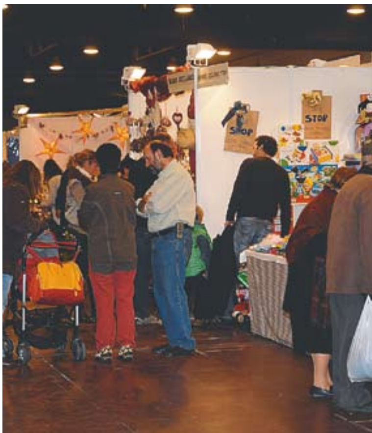
Visitants en una edició anterior de la Fira Comercial.

Diumenge al matí tornarà a fer-se l'espai infantil amb inflables