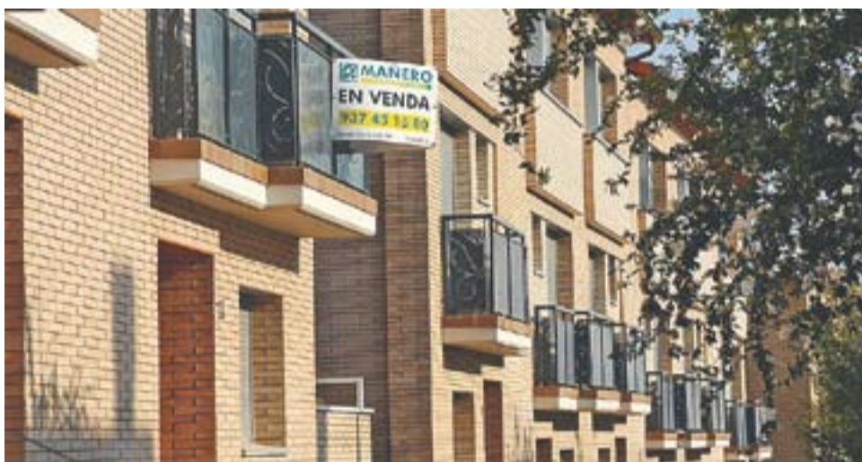
Dues promocions de pisos i cases a Castellar del Vallès.

són poc rellevants a la vila. Les famílies s'interessen pels habitatges d'obra nova però la dificultat per accedir a un crèdit complica la concreció de la compra. "Es nota moviment en el sector de la construcció. Els castellarencs i castellerenques volen aprofitar la rebaixa de l'IVA, Es visiten pisos i cases, i es demanen pressupostos. La complicació per mate-