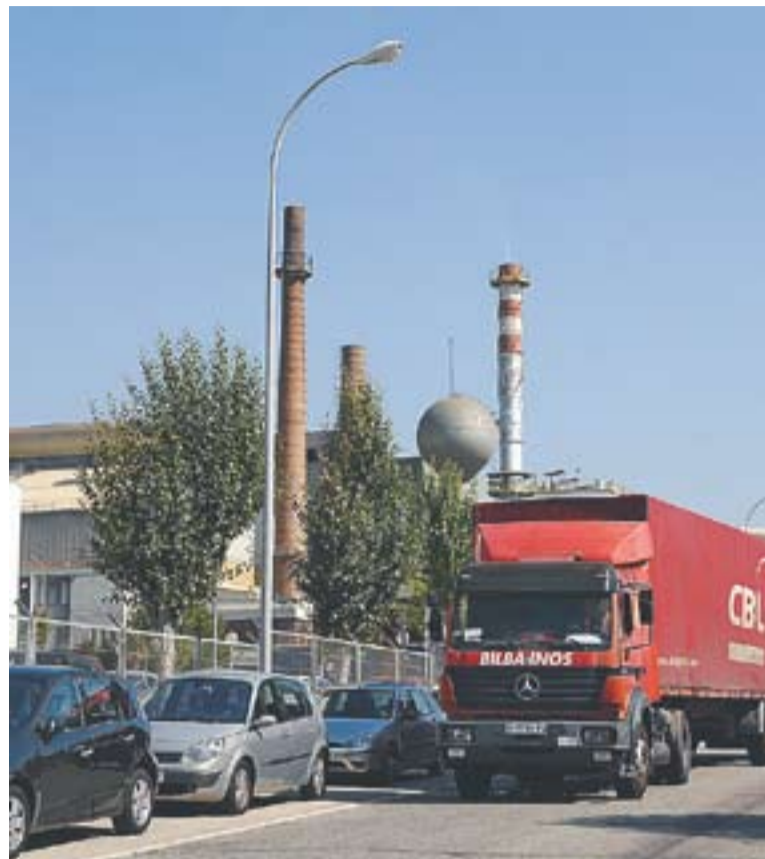
© L'empresa Vidrala té la plantilla més gran dels polígons (270 treballadors) || J.G.

* Cens empresarial dels polígons de Castellar