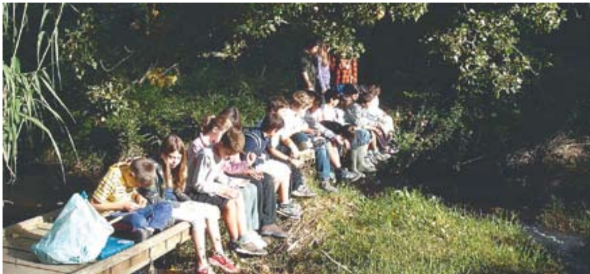
© Alumnes del Projecte Rius, que a partir d'aquest curs s'incorpora a la Guia Didàctica. || LAIA PLANAS